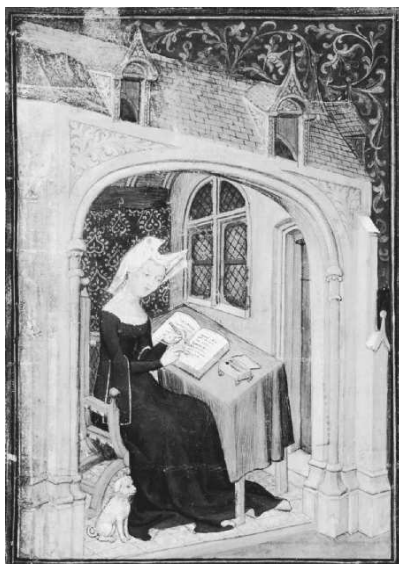
Slika 6: Christine de Pizan piše za stolom. 128