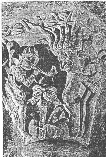
Slika 2: Sotonina oruđa: profana glazba i žene 5