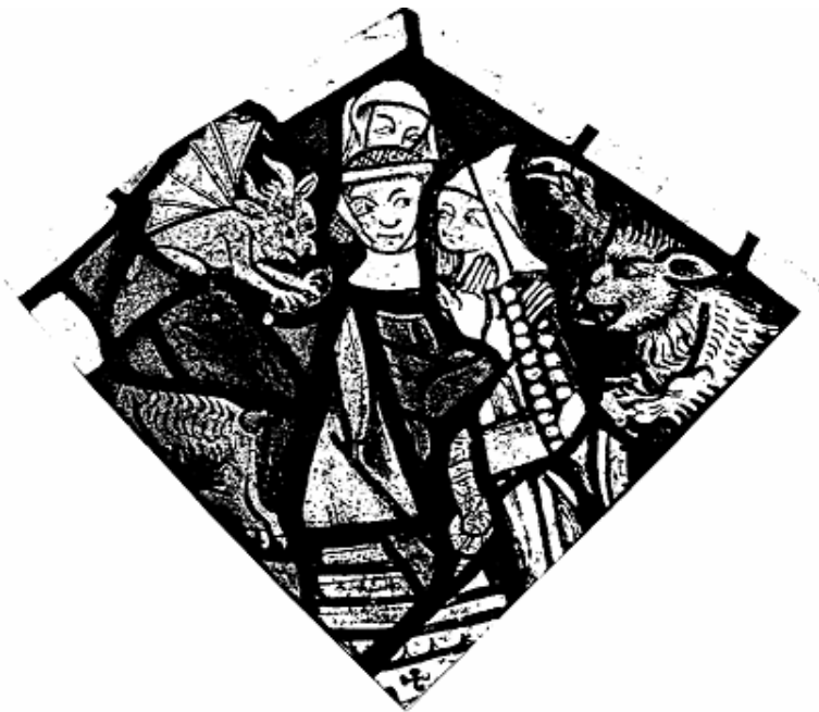
Slika 3: Dijabolična asocijacija žena sklone ogovaranju s početkom XIV. stoljeća iz Stanforda, Northamptonshire 16

najčešće imaju selektivan i negativan pristup prema pitanju položaja žene. Jedina ženina pozitivna uloga je rađanje djece. Žena je "drugotno" biće, stvoreno od čovjeka, muškarca i iz toga proizlazi njena podređenost, odgovorna za prvi grijeh pa je muškarac mora voditi kroz život jer je po prirodi sklona grijehu. Sv. Augustin smatra da zlo proizlazi iz tijela, odnosno žene koja je inferiorna i tjelesna. Za njega je jedini način da se obuzda čulnost, žena, bio brak jer se "ženidbom može uspostaviti prvobitna hijerarhija – gospodarenje duha nad tijelom." 14 Isti stav ima i sv. Jeronim koji je još oštriji prema ženi. Za njega žena "izvor grijeha kojeg se treba kloniti" te on poznaje samo zle, bludne i grešne žene. 15