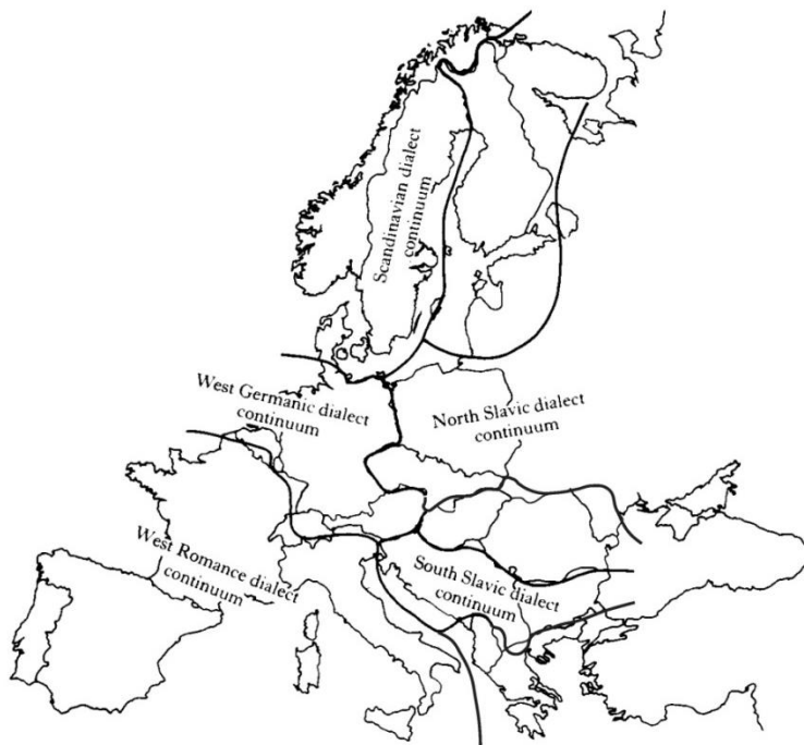
Slika 1: Europski dijalektni kontinuumi (preuzeto iz Chambers i Trudgill 2004: 6)

Treću poteškoću pri primjeni načela međusobne razumljivosti pričinjava i povijesni razvoj jezika. Kako se jezici mijenjaju, velika međusobna razumljivost postoji između pojedinih generacija u nizu, ali kao što je slučaj s geografskim jezičnim kontinuumima, tako će se i jezične razlike u vremenskim kontinuumima akumulirati do te mjere da govornici suvremenoga hrvatskog jezika ne mogu razumjeti tekst Vinodolskoga zakona iz 1288. ili Gundulićeva Osmana s početka 17. stoljeća bez uporabe rječnika.