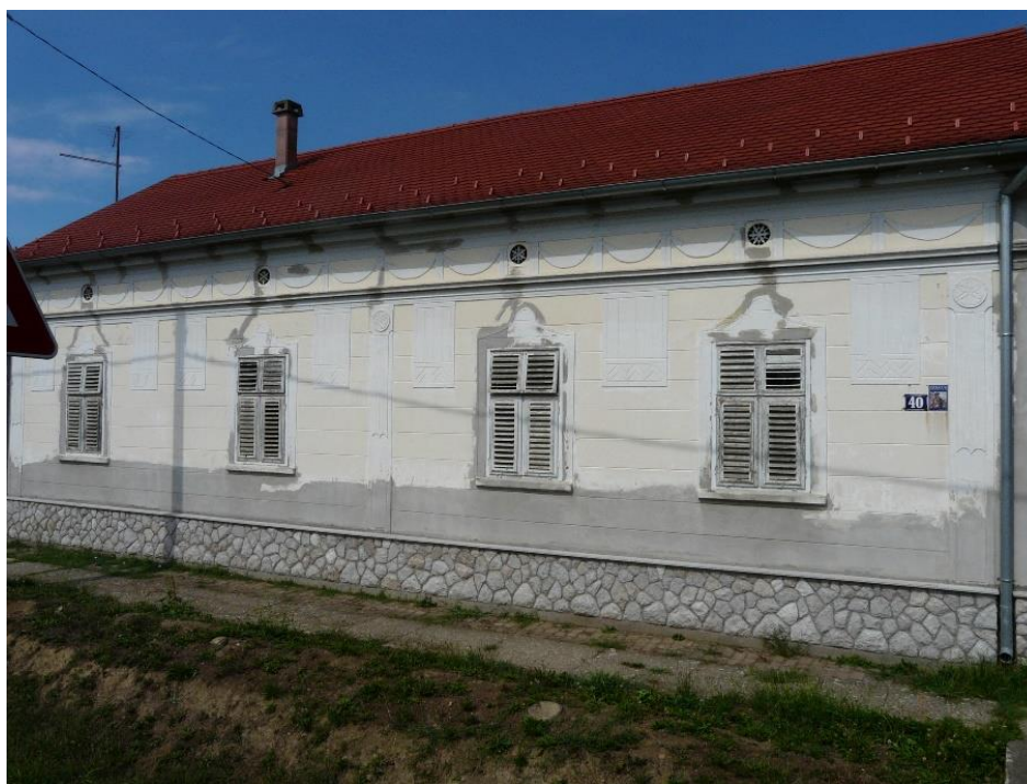
Slika 41: Strošinci, Matije Gupca 40