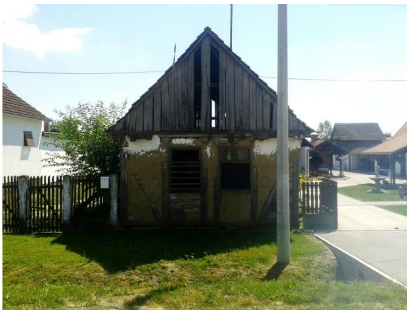
Slika 6: Vrbanja, Kolodvorska 9

Termin zabatne kuće Ž. Španiček preuzeo je od njemačkog Giebelhaus koji se koristi u starijim izvorima, budući da u domaćoj literaturi ne postoji naziv za istu. Pod terminom se podrazumijeva ne samo da kuća posjeduje zabat, nego da je on isključivo okrenut prema ulici, tj. da zabatna strana čini pročelje kuće (slike 6, 7 i 8). Napominje i kako ovaj tip kuće neki autori u svojim djelima smatraju jedinim tipom na ovome području. Autor „zabatom na ulicu“ orijentiranu kuću, postavljenu na samoj građevnoj liniji, a dužim dijelom točno na susjedovoj međi, smatra rezultatom najlogičnije i najsvrsishodnije organizacije poljodjelskoga dvorišta. 32 Nizanje motiva zabata prolaskom kroz naselja čine osnovni ritam „čijom se snagom čovjek suprotstavlja monotoniji panonske ravnice.“ Već spomenuti šor , po Z. Živkoviću, zapravo je ruralni fenomen u kojemu je kvantiteta nanizanih zabata prešla u kvalitetu, a ta kvaliteta ogleda se u likovnom, sociološkom/humanom, ekonomskom i ekološkom smislu. 33 Ulaz u kuću nije na zabatnoj strani. Na pročelju se nalaze samo dva simetrično postavljena prozora, te dva manja otvora za prozračivanje u samome zabatu, također simetrična. Takva orijentacija elemenata uvjetovana je kanatnom konstrukcijom. Dva prozora na pročelju zabatna oblika kuće, kao i dva mala otvora na zabatu, zapravo su smještena sa svake strane nosiva stupa koji pridržava stropnu gredu (tetivu).