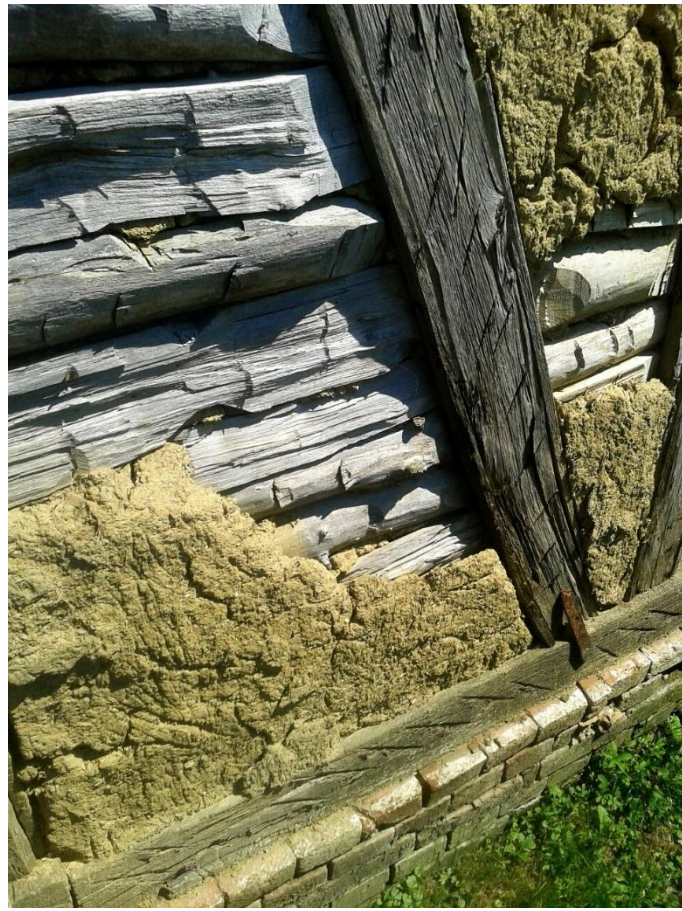
Slika 2: zidna stjenka, Vrbanja, Kolodvorska 9