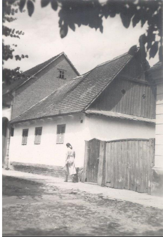
Slika 14: tradicijska kuća, nepoznata lokacija