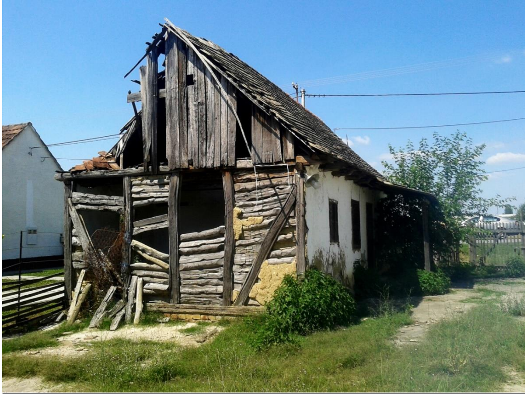
Slika 1: Vrbanja, Kolodvorska 9