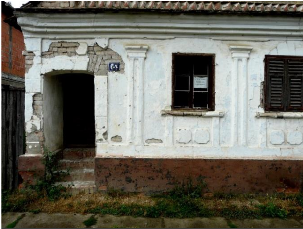
Slika 25: Bošnjaci, Savska 64