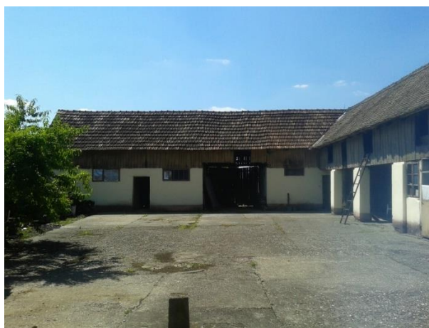
Slika 21: Vrbanja, Ulica bana J. Jelačića 111

Štagljevi (sjenici) su služili kao spremnici za sijeno (hrana za stoku) i snopove žita koji su čekali vršidbu. Riječ štagalj njemačkog je porijekla, kao i same zgrade. Devetnaestostoljetni primjeri bili su građeni od drveta i prilično su tipološki jedinstveni u svim dijelovima Slavonije. U osnovi su bili zgrade pravokutna tlocrta, građeni hrastovim daskama pribijenim na kanatnu konstrukciju, pokriveni slamom ili trskom, kasnije i crijepom. Između dasaka ponekad su se ostavljali mali razmaci kako bi unutrašnjost bila prozračnija. Štagljevi se od ostalih gospodarskih prostorija razlikuju po velikom ulazu za kola koja transportiraju sijeno ili žito. Tavan se izbjegavao, kako bi se mogli napuniti do krova. Štagljevi također često nisu samostalni objekti, nego prigradeni nekim drugim dvorišnim zdanjima. Noviji, zidani štagljevi, pojavili su se krajem XIX. stoljeća, a ono što ih je razlikovalo od ranijih drvenih je gradnja na kat. Tako se štedio prostor, budući da se sijeno onda pohranjivalo na prozračan tavan, dok su u prizemnim prostorijama bile štale i druge potrebite prostorije (slika 21). 70