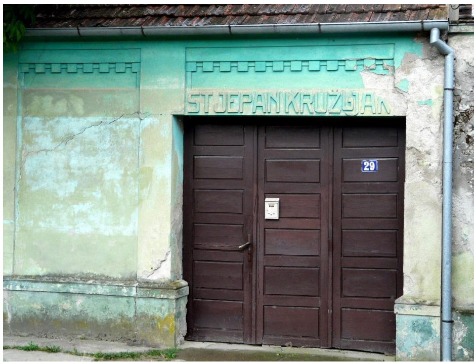
Slika 40: kuća Stjepana Kružljaka, Bošnjaci, Antuna Mihanovića 29

Elementi secesije na uzdužnom tipu kuće vidljivi su na primjeru iz Bošnjaka, i to na natpisu nad ulaznim vratima ajnfora i apstrahiranim plitkim „gutama“ (slika 40), te u Strošincima, na apliciranoj linearnoj dekoraciji i girlandama duž cijeloga pročelja (slika 41).