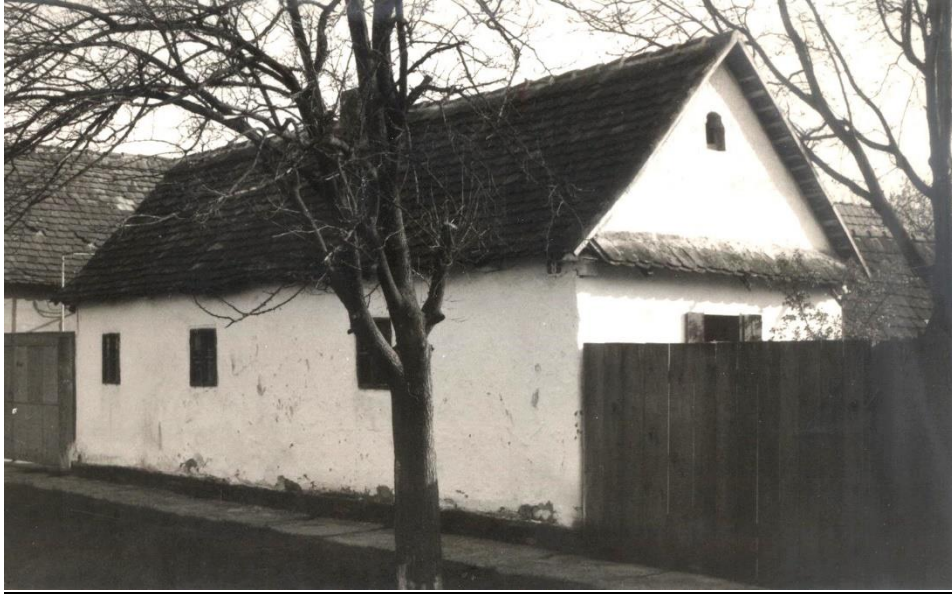
Slika 15: Županja, Gundulićeva ulica

Postoje i posebni oblici kuća u ključ , primjerice kuće s takozvanim ajnforom , odnosno dvokrilnim kolnim ulazom nužnim kada ulično krilo zauzima čitavu širinu parcele. Smješten je uglavnom na samome kraju, ili u sklopu uličnoga pročelja. Kuće s ajnforom nastale su pod gradskim utjecajem, a najbrojniji primjeri sagrađeni su u vinkovačkom i županjskom kraju. Često su bile izrazito dekorirane fasadnim profilacijama u žbuci, za što su postojali obrti, posebice između dva svjetska rata. Organizacija prostorijska bila je takva da su se prednje sobe bile uglavnom spavaće, dok su kuhinja, ostava i druge prostorije bile smještene u dvorišnome krilu. Ajnfori su se koristili i za pristup na tavan. 52