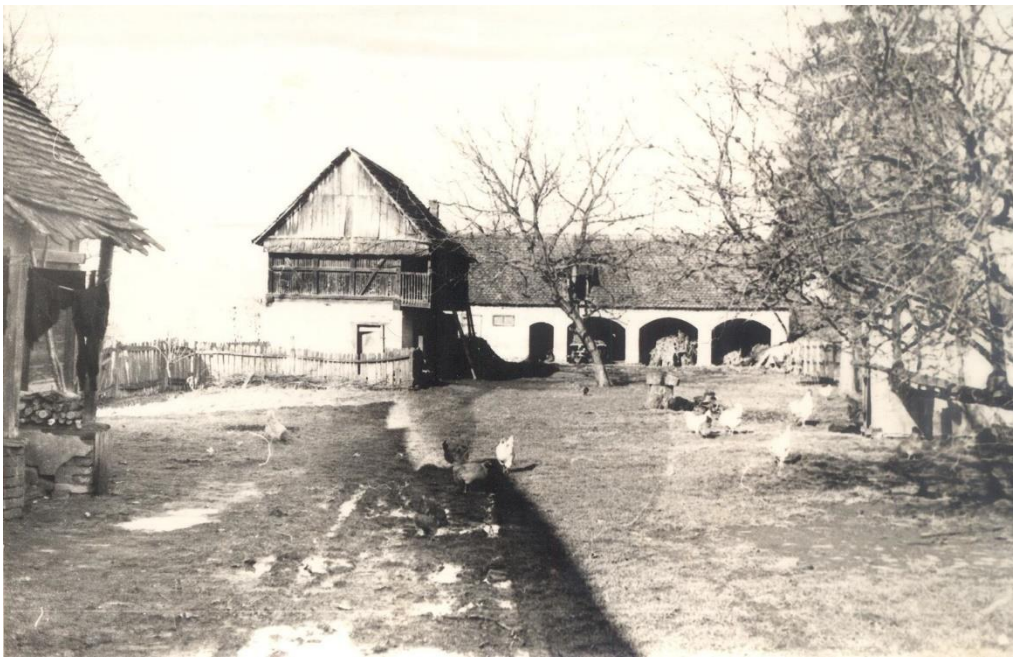
Slika 16: dvorište Ane Doknjaš, Gunja, 1979.

Prostorna organizacija okućnice, odnosno raspored gospodarskih objekata, s obzirom na stambene, ovisi o izgledu i veličini zemljišne parcele. Iako ima primjera okućnica koje su nepravilne i čiji su objekti raspršeni, većina ih se organizirano gradi. Pravila su proizašla iz funkcionalnih uvjeta, ali i iz nekih tradicijskih normi.