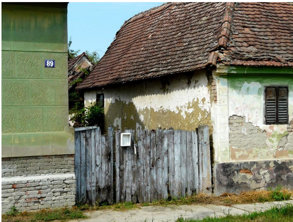
Slika 33: Soljani, fitomorfna dekoracija na kući br. 89 u ulici Braće Radić