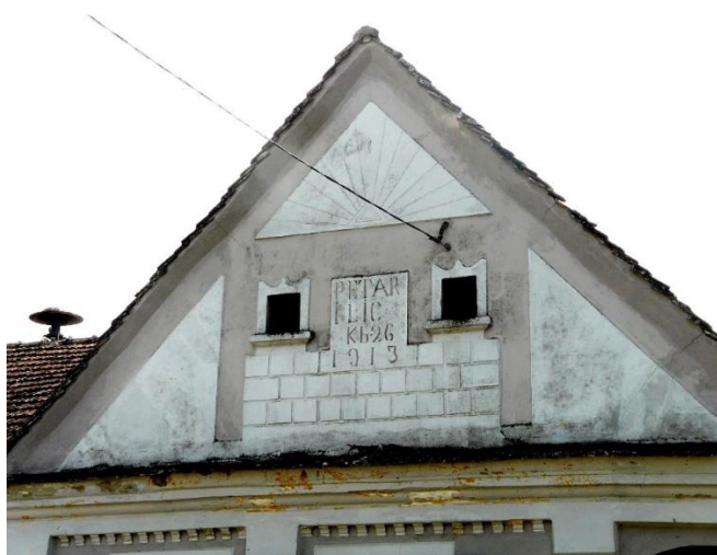
Slika 30: Strošinci, Vladimira Nazora 8

Na zabatnom tipu kuća, ako su dekorirane, na pročelju je obavezan i vijenac koji odjeljuje zabat. On je često uokviren (zupčasti okvir mogući je zaostatak iz dekorativne drvene gradnje), a unutar njega, osim bilježenja imena vlasnika i godine izgradnje, najnaglašenije su prisutne dekorativne (eventualno „stilske“) intencije. Na nizu zabata iz Strošinaca, u zrakastim je motivima i geometrijskoj raspodjeli površine moguće uočiti elemente secesije (slika 30-32). Zabati, odnosno pročelja, svojom su raznolikošću nositelji većine informativnoga i „stilskog“ sadržaja, čemu je uvelike pridonijelo korištenje žbuke.