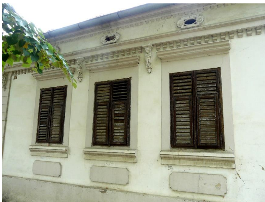
Slika 36: Drenovci, Vinkovačka 41