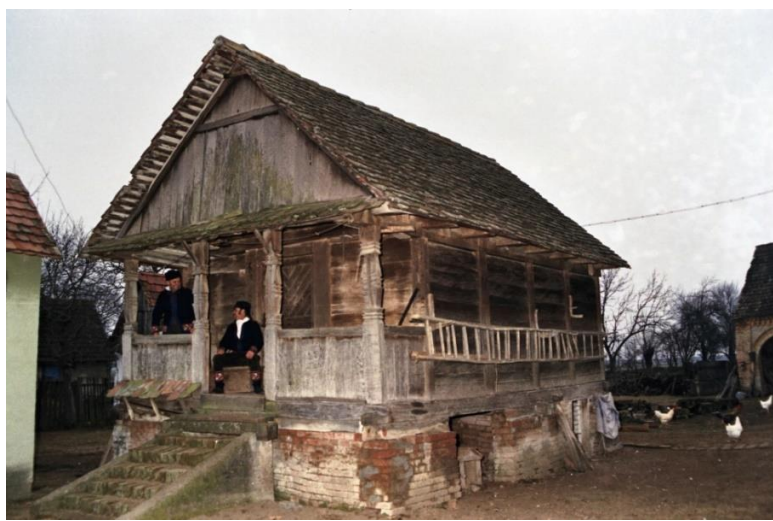
Slika 17: hambar, Štitar

Hambari ili ambari služili su za pohranu žitarica za prehranu ljudi i stoke. Građeni su kanatnim načinom izgradnje: stariji s ispunom od pletera i omazivani blatom, noviji stjenkama od međusobno užlijebljenih hrastovih dasaka (slike 17 i 18). Temelj su činili podsjek, stupci i vijenac, a stjenke od dasaka nisu pridržavali nikakvi kosnici. Daske su morale biti užlijebljene da zrnje ne bi prolazilo kroz pukotine. Njihova specifičnost bila je odignutost od zemlje, da bi se omogućila prozračnost sa svih strana. Često su imali i trijem. Unutrašnjost hambara bila je podijeljena na svojevrstne pretince, svaki za posebnu vrstu žitarica. Takvi pretinci u Slavoniji se nazivaju okna , a u Baranji fijoke . Ograde pretinaca uglavnom su bile fiksirane, te se žito sipalo preko ograde, a grabilo pomoću ljestvi ili pomičnih stepeništa. Kod složenijih oblika, ograde je bilo moguće rasklopiti, odnosno, po potrebi, ukloniti ili vratiti u žlijebove. 61