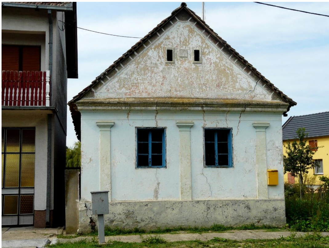
Slika 26: Soljani, Matije Gupca 66