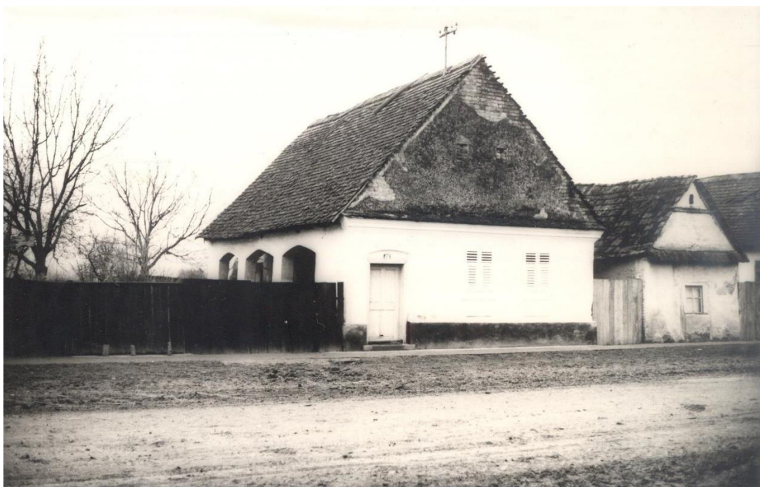
Slika 8: kuća pod zaštitom, Rajevo Selo, 1926.