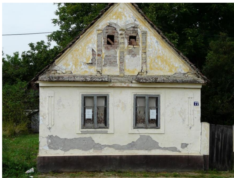
Slika 28: Đurići, Matije Gupca 77

Zanimljiv je i jedinstven primjer slijepe bifore na zabatu iz Đurića, koji podsjeća na oble lukove Rundbogent stila, odnosno neoromanike (slika 28 i 29). Unutar lukova smješteni su standardni mali otvori za prozračivanje.