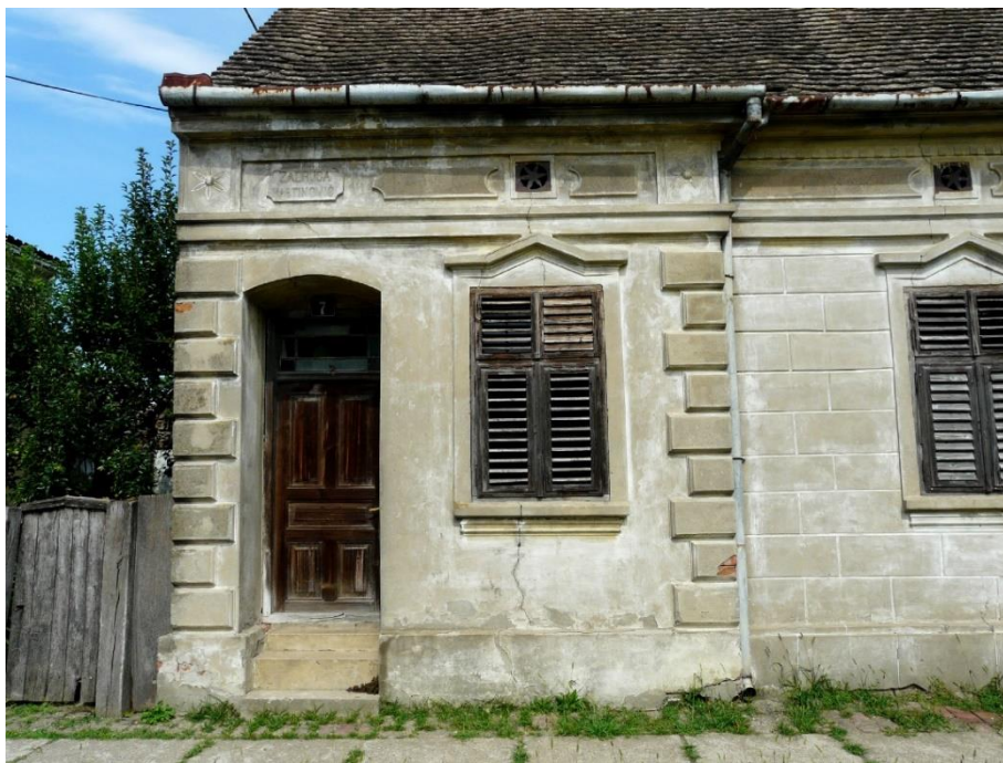
Slika 35: kuća zadruga Martinović, Soljani, Vladimira Nazora 7

Uzdužni tip kuća sa sobom je nosio i određen statusni simbol jer su ih gradile zadruge ili imućniji seljani, pa je na njima i dekoracija raskošnija. Na uzdužnome pročelju često se pojavljuje rustika (na rubovima ili čitavom površinom pročelja), natprozorni vijenci i štuko-ukrasi svojstveni za neorenesansne palače (slike 35-38), ali i ranije spomenuti, nešto bogatiji „klasicizirajući“ elementi (slika 39).