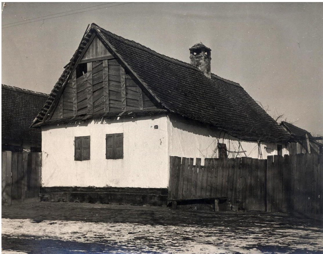
Slika 7: kuća Verkovićevih, Županja