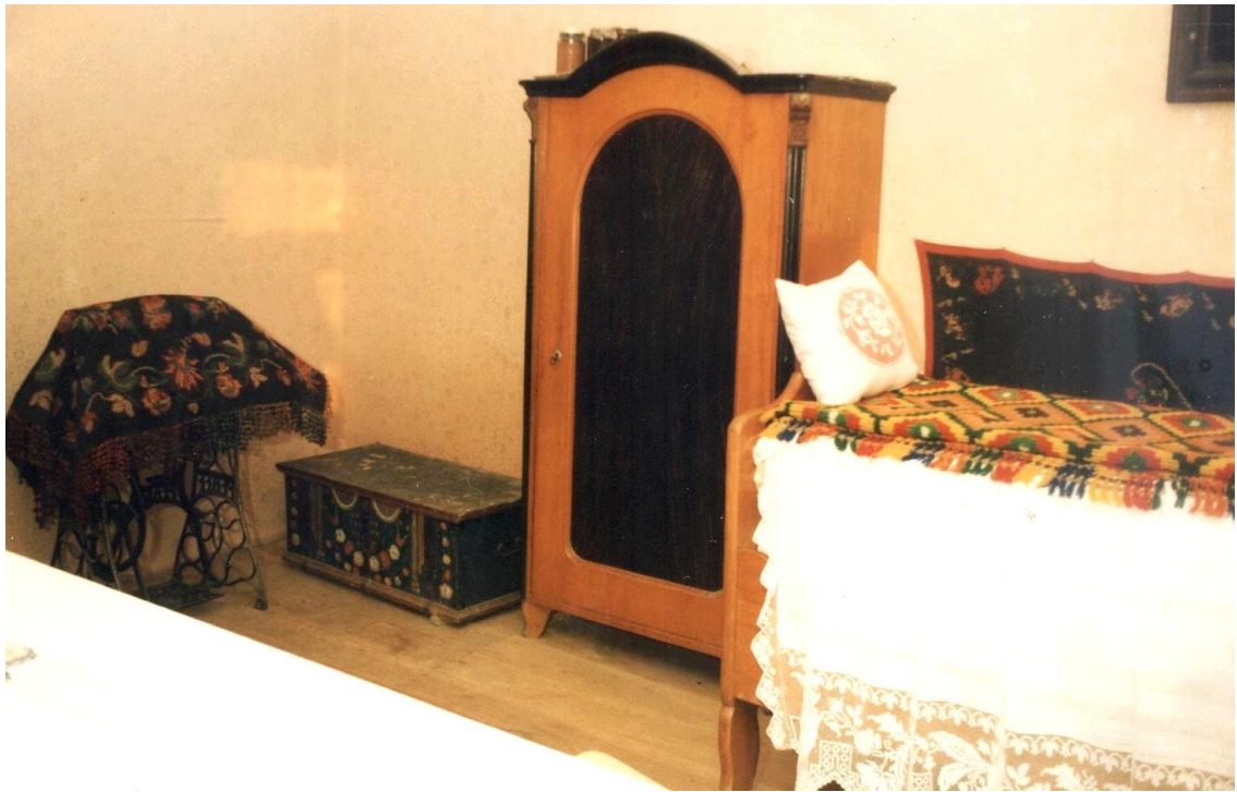
Slika 10: detalj sobe, Gunja, Ulica Vladimira Nazora 114, vlasnica: Ana Doknjaš