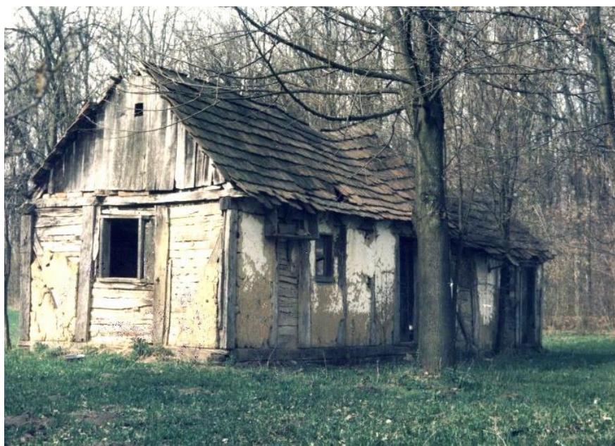
Slika 23: koleba na stanu, Gradište