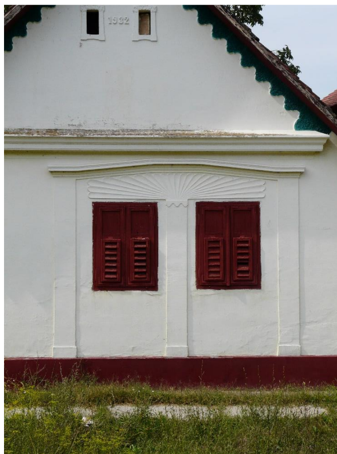
Slika 34: Soljani, Matije Gupca 134, zrakasti natprozorni detalj