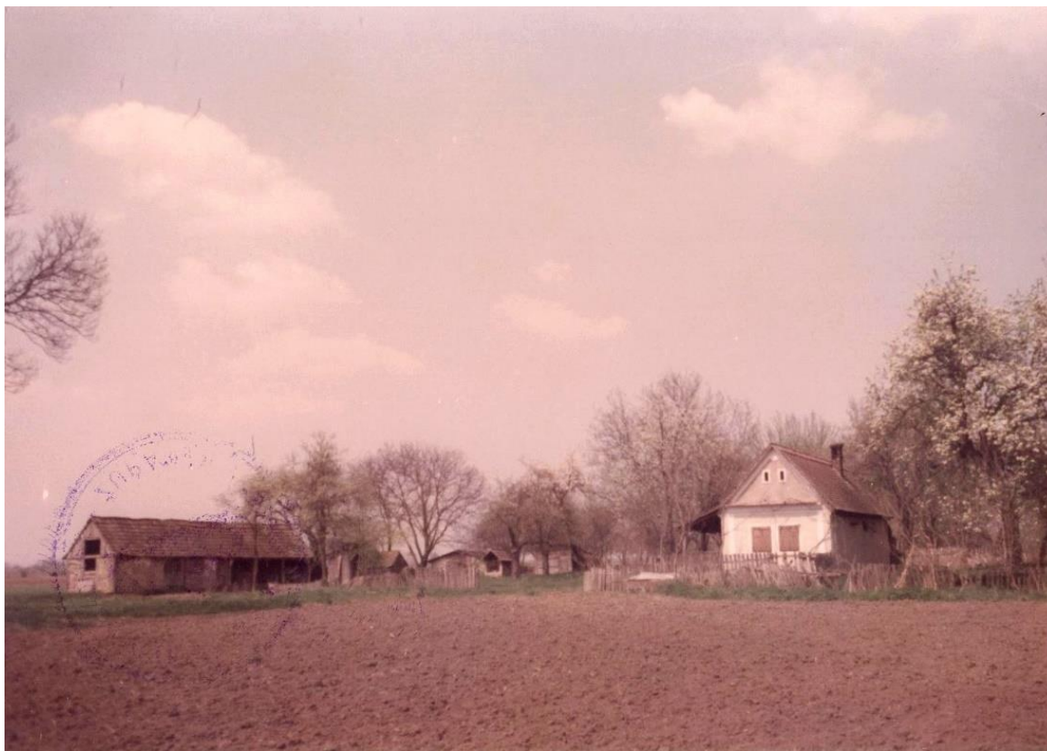
Slika 22: salaš, Gradište