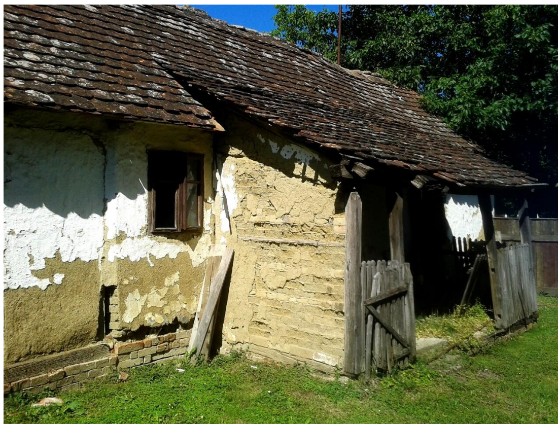
Slika 5: gradnja ćerpićem, Vrbanja, Ulica bana J. Jelačića 109

stropova radila se od vitlova , odnosno debljih, grubo otesanih hrastovih štapova dugih 80-100 cm, omotanih sijenom ili slamom te oblijepljenih blatom. Vitlovi su se, nakon sušenja, slagali između stropnih greda na prikucane letve, zatim i s gornje i dolje strane premazivali blatom pomiješanim s pljevom kako bi se dobila ravna površina stropa, koja se s donje strane uglavnom bijelila vapnom. Obje vrste stropova s gornje su se strane ravnale blatnim premazima, kako bi se na tavanske prostore pohranjivao kukuruz u klipu, rjeđe žito. 30 Podovi su u svim kućama bili od nabijene zemlje, a u novije vrijeme daščani ili potaracani opekom. Krovne konstrukcije bile su isključivo dvostrešne, prekrivene biber crijepom koji se, paralelno s opekom, pojavio u XIX. stoljeću (slika 5). Kuće su se ranije pokrivala slamom, trstikom ili šindrom. 31