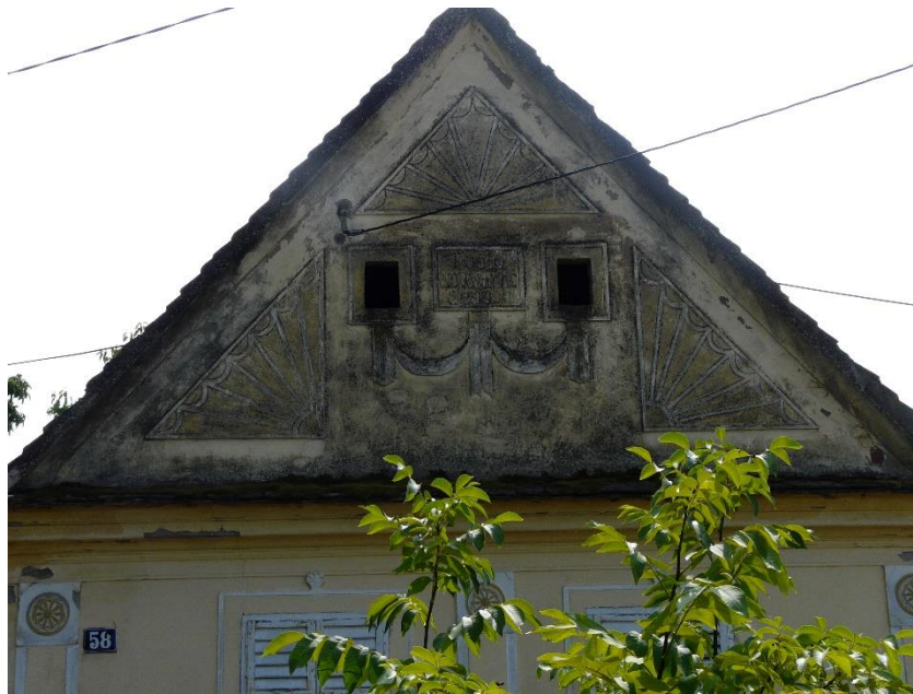
Slika 32: Strošinci, Vladimira Nazora 58

Secesijski elementi pojavljuju se i u Soljanima, na pročelju kuće u potpunosti prekrivenom apstrahiziranim fitomorfnim viticama (slika 33), te ponovno zrakastom, ovaj puta natprozornom dekoracijom (slika 34).