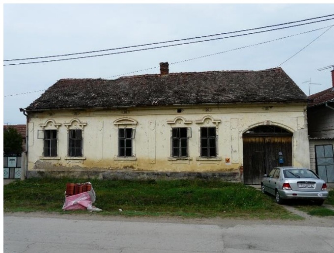
Slika 37: Račinovci, Ante Starčevića 58