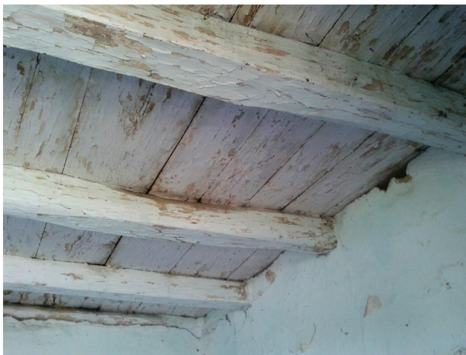
Slika 4: strop, Vrbanja, Kolodvorska 9

podzidu od opeke. 27 Opekom se kanat počeo ispunjavati tek krajem XIX. stoljeća. Tada se uvodi i žbuka, kao i razni reljefni ukrasi u njoj – horizontalni vijenci, istaci na uglovima, obrubi oko prozora, godina i inicijali u zabatu (...) – na svakoj kući drugačiji. 28 Stropove u tradicijskoj arhitekturi možemo podijeliti na dvije vrste. Prva vrsta stropova izvedena je od dasaka pribijenih iznad stropnih greda, tako da i daske i grede ostaju vidljive iz sobe. Takav oblik stropa na širem prostoru Slavonije zove se šipilo (slika 4). 29