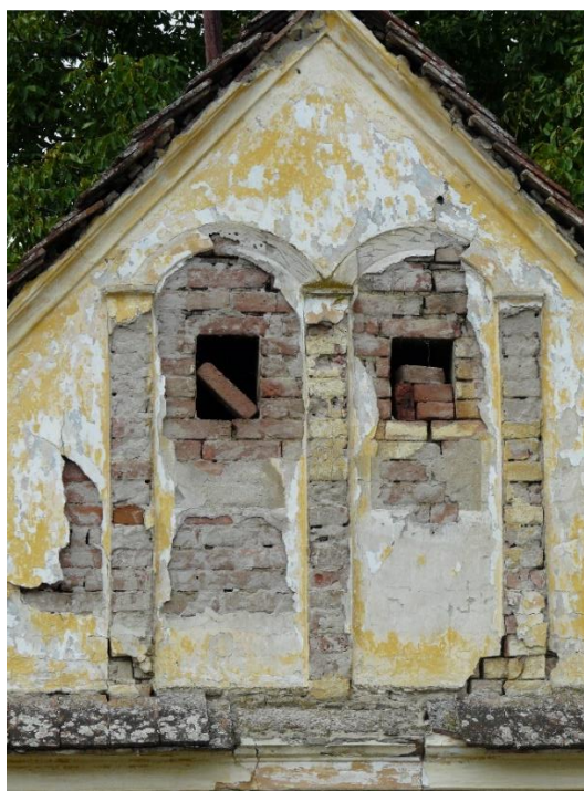
Slika 29: Đurići, Matije Gupca 77

Na zabatnom tipu kuća, ako su dekorirane, na pročelju je obavezan i vijenac koji odjeljuje zabat. On je često uokviren (zupčasti okvir mogući je zaostatak iz dekorativne drvene gradnje), a unutar njega, osim bilježenja imena vlasnika i godine izgradnje, najnaglašenije su prisutne dekorativne (eventualno „stilske“) intencije. Na nizu zabata iz Strošinaca, u zrakastim je motivima i geometrijskoj raspodjeli površine moguće uočiti elemente secesije (slika 30-32). Zabati, odnosno pročelja, svojom su raznolikošću nositelji većine informativnoga i „stilskog“ sadržaja, čemu je uvelike pridonijelo korištenje žbuke.