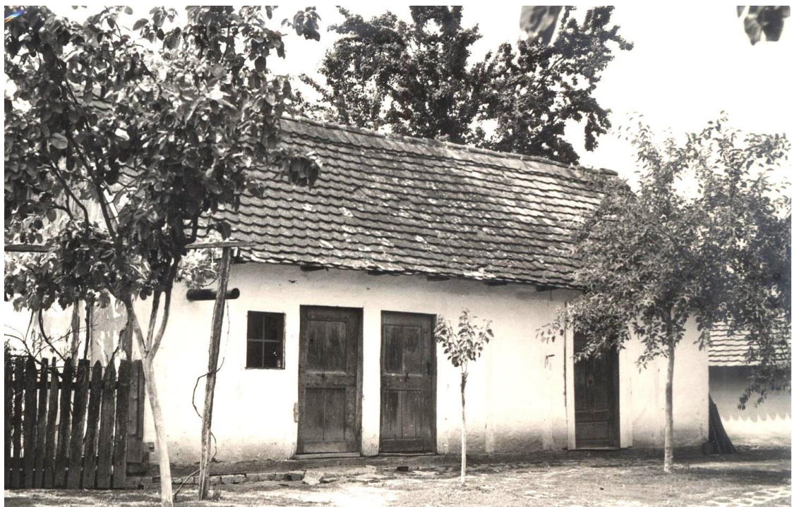
Slika 11: kućari, Županja, Ulica Vladimira Nazora 3