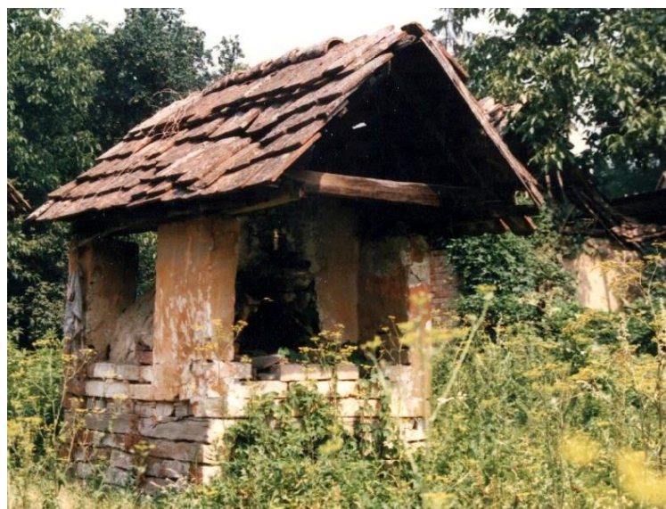
Slika 20: vanjska krušna peć, napušteni salaš, Gradište

Krušne ili vanjske peći postepeno su se pojavljivale kako bi se iz kuće, pogotovo u ljetno doba, uklonilo nepotrebno dugotrajno zagrijavanje. Kruh se za velike obiteljske zadruge pekao svakih 8 do 10 dana. Proces je zahtijevao loženje vatre, kako bi se peć zagrijala, zatim vađenje žari i čišćenje unutrašnjosti peći. Kruh se, nakon toga, pekao na toplini akumuliranoj u stjenkama objekta. Dvorišne peći rijetko su bile samostojeći objekti, češće su uključene u unutrašnjost neke poluzatvorene šupe, ili priključene tj. prigradene na neku zgradu. Starije su građene od pletera, a novije od cigle, prijesne ili pečene (slika 20).