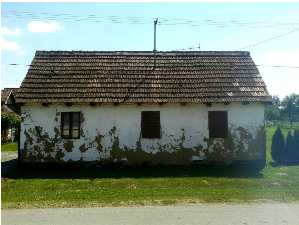
Slika 13: Vrbanja, Kolodvorska 3