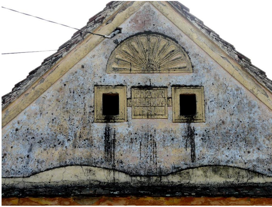
Slika 31: Strošinci, Braće Radić 15