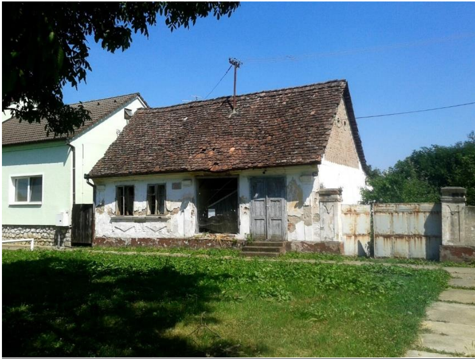
Slika 12: Vrbanja, Ulica kneza Ljudevita Posavskog 97