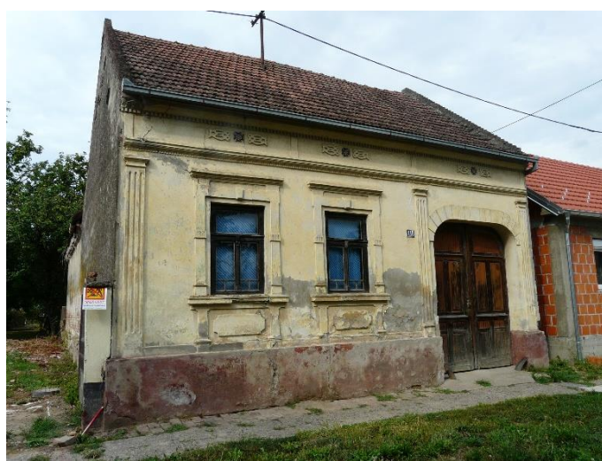
Slika 39: Gunja, Vladimira Nazora 118