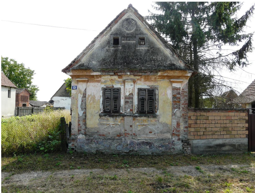
Slika 27: Strošinci, Braće Radić 13

Zanimljiv je i jedinstven primjer slijepe bifore na zabatu iz Đurića, koji podsjeća na oble lukove Rundbogent stila, odnosno neoromanike (slika 28 i 29). Unutar lukova smješteni su standardni mali otvori za prozračivanje.