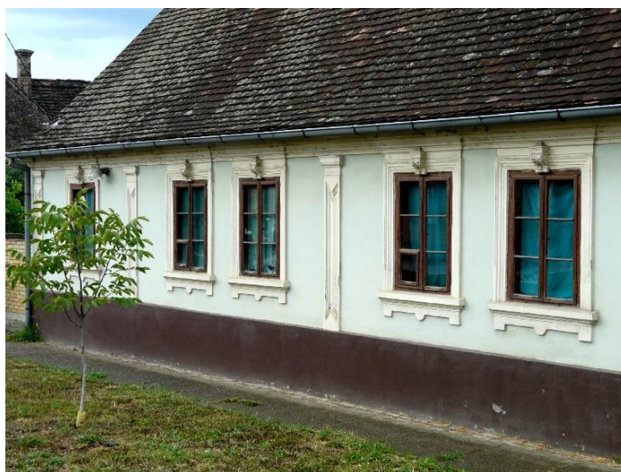
Slika 38: Bošnjaci, Savska 42