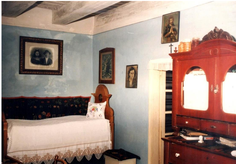
Slika 9: detalj sobice, Gunja, Ulica Vladimira Nazora 114, vlasnica: Ana Doknjaš

U XVIII. i većem dijelu XIX. stoljeća, za prijem gostiju, često svećenika, oficira ili državnih službenika, služila je treća prostorija ( sobar, stražnja soba, sobica, stara kuća ) (slika 9). U XX. stoljeću ona uglavnom služi kao ostava ili špajz . U rjeđim slučajevima, stražnja soba biva prenamijenjena u glavnu stambenu prostoriju. 46