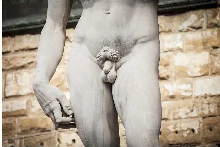
Slika 2: Šta se sve promenilo?

Od svih članaka dobivenih pretraživanjem, na ovom portalu vizualni prikaz penisa prisutan je samo uz 2 teksta, i to kao dio skulpture Michelangelova Davida (opaska autora). Na fotografiji nije prikazan cijeli kip, već je u prvom planu središnji dio tijela a vidljivi su penis, testisi i stidne dlake. Na ostalim fotografijama prikazani su muškarac i žena kao par, ili samo muškarac, odnosno žena. Na dvije fotografije prikazana je banana kao i na portalu Cosmopolitan.hr .