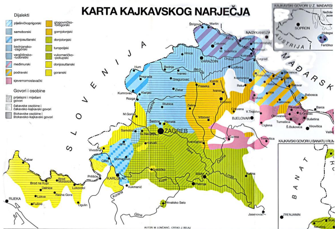
Slika 1. Karta kajkavskog narječja