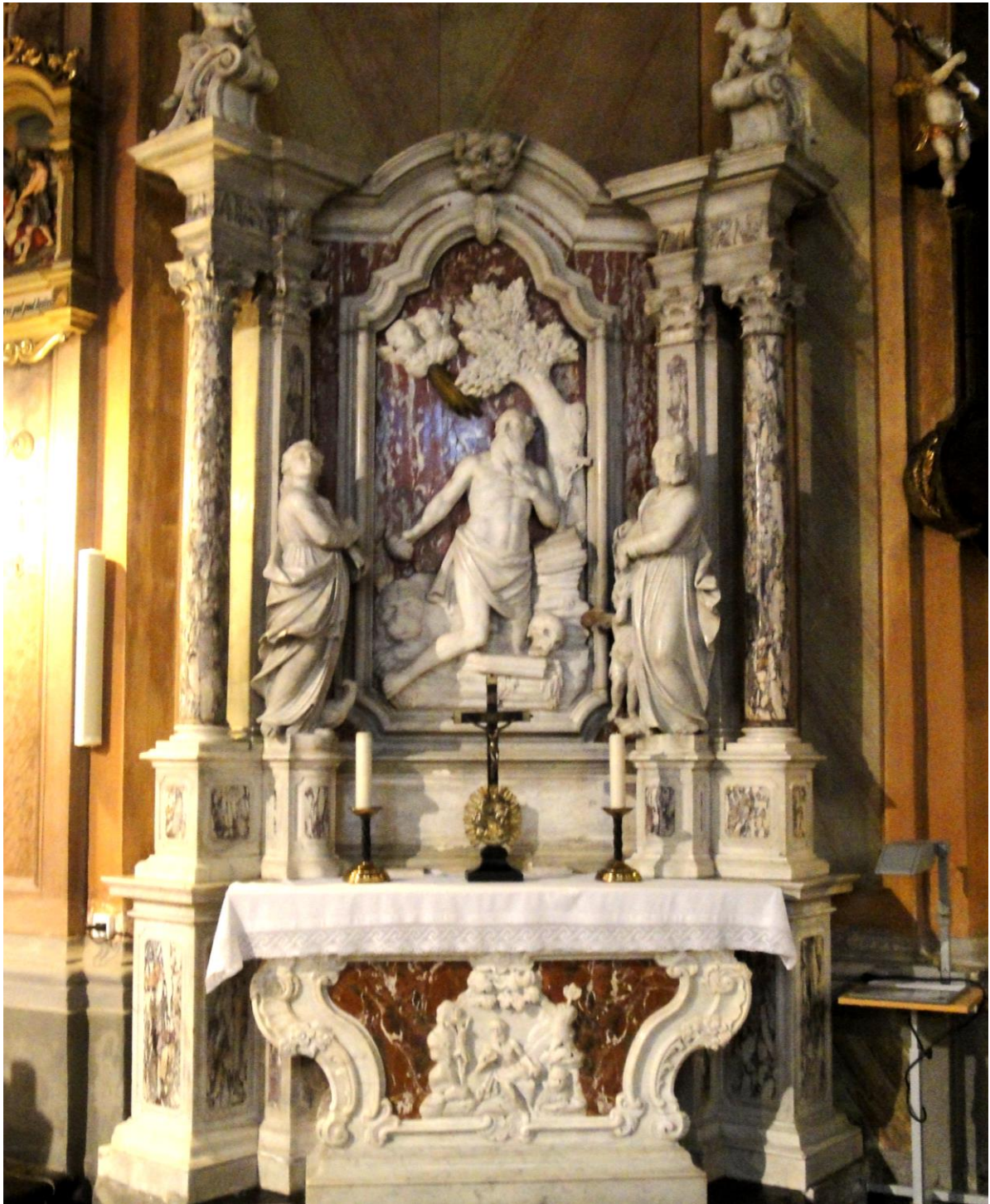
Slika 1) Oltar sv. Jeronima (1780.), crkva sv. Ivana Krstitelja, Nova Ves, Zagreb.