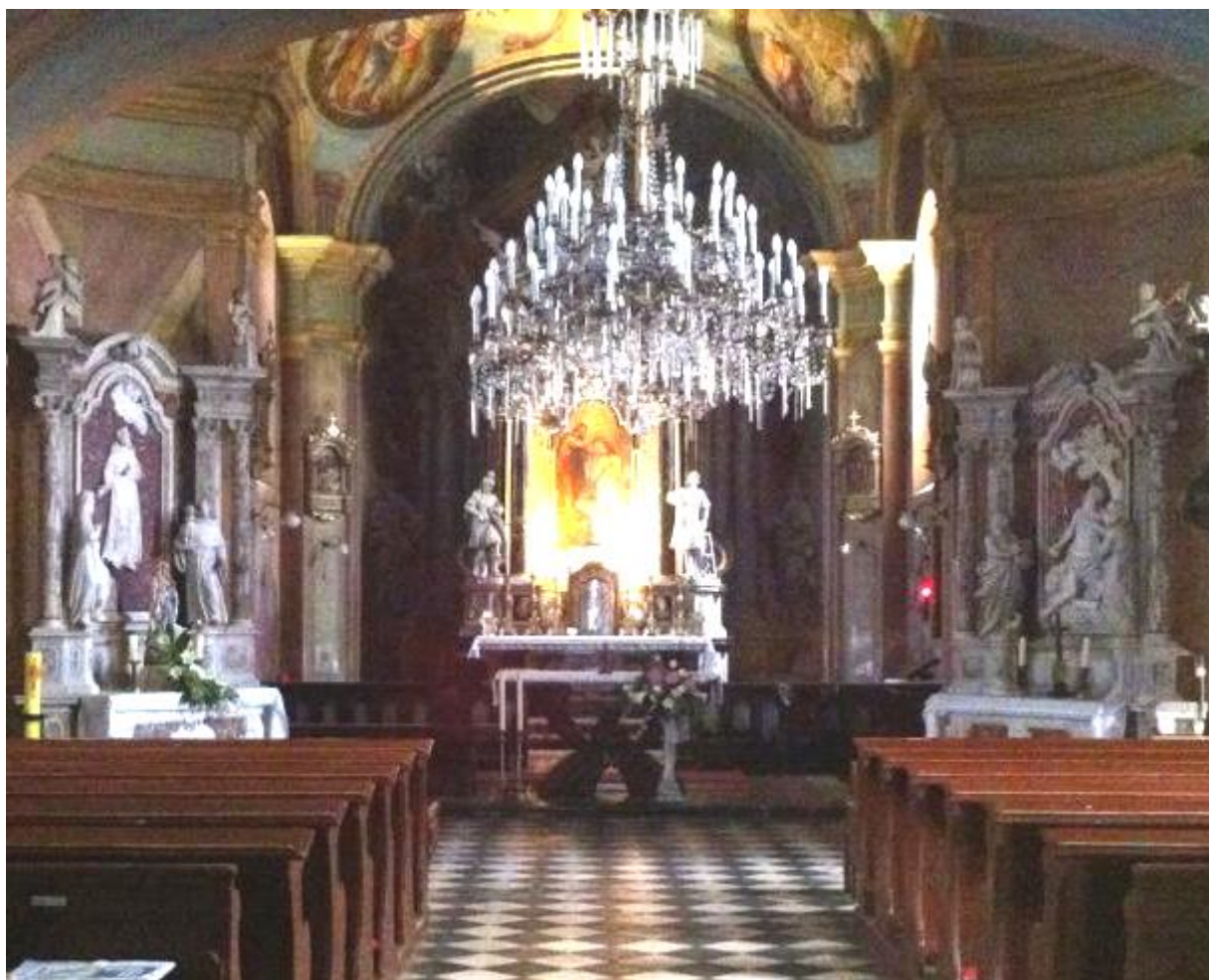
Slika 5) Crkva sv. Ivana Krstitelja – pogled prema svetištu, Nova Ves, Zagreb.

zamijenjeni su oltarima svetog Jeronima i svetog Franje Serafijskoga radovima Sebastijana Petruzzija. 31