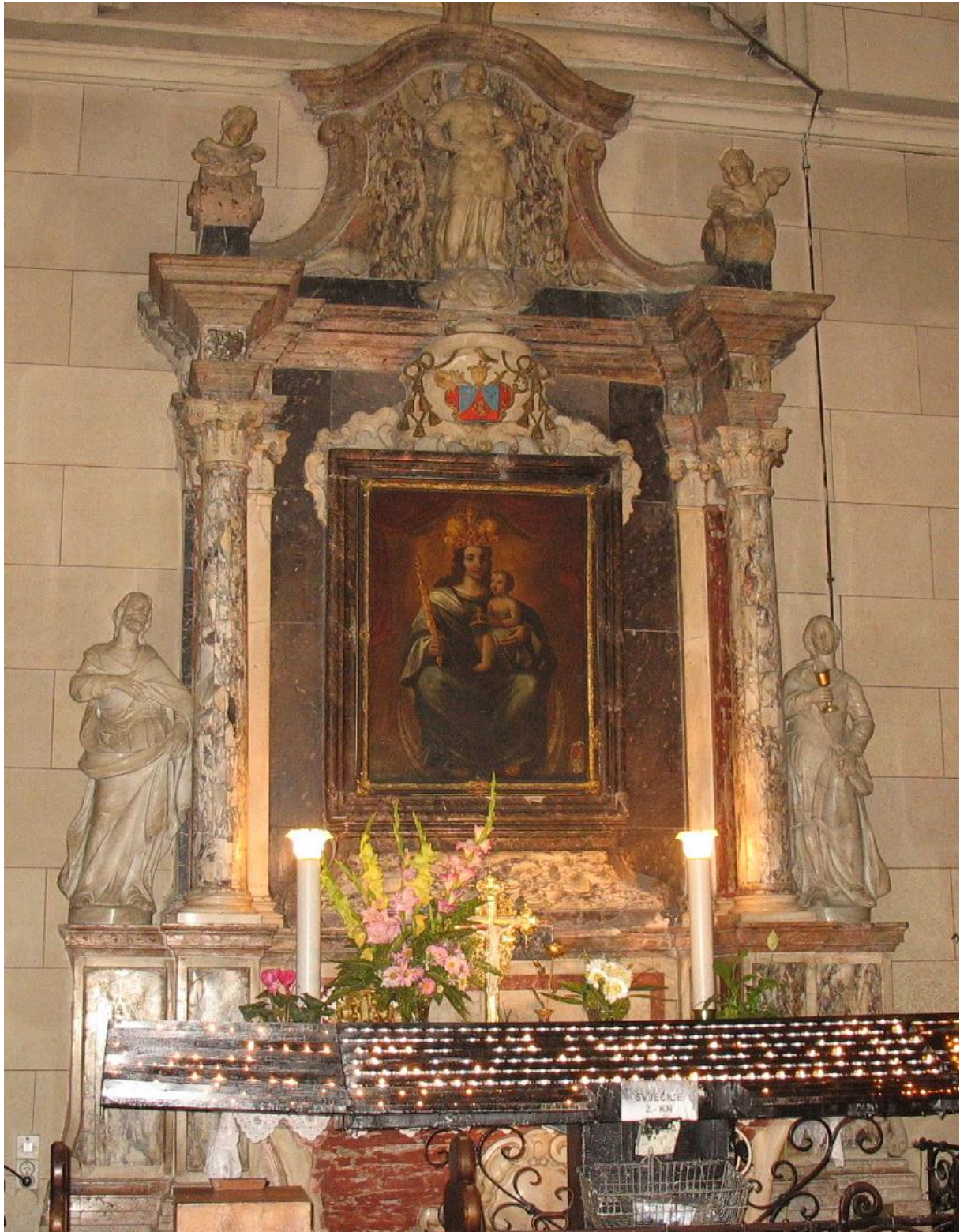
Slika 4) Sebastiano Petrucci, Oltar Marije Pomoćnice (1778.), zagrebačka katedrala.