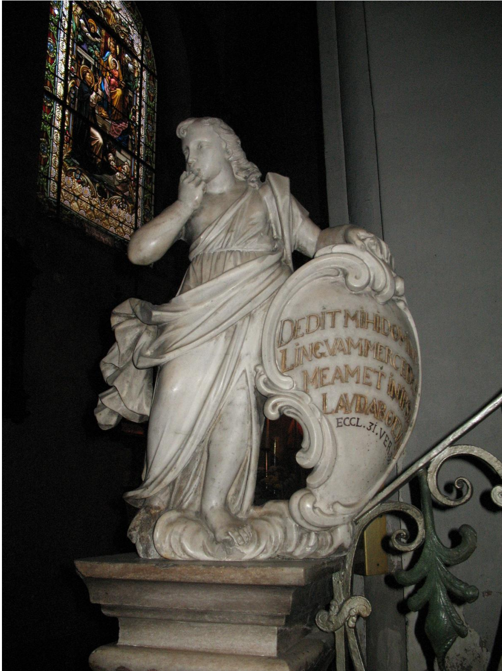
Slika 6) Sebastiano Petrucci, Andeo , crkva sv. Marije od Pohoda, Dolac, Zagreb.

Za Petruzzija karakteristično, naglašeno tektonsko i klasicistički pročišćeno rješenje oltarne arhitekture pokazuju oltari sv. Franje Asiškog te sv. Jeronima iz zagrebačke katedrale, koji pokazuju i čest kromatski kontrast bijelog carrarskog, crvenog i bijelo sivog mramora. Važna karakteristika Petruzzijeve radionice su i ornamentalne kartuše koje se nalaze na stipesu nekolicine njegovih oltara. One mogu sadržavati reljefni narativni prikaz obrubljen rocaille kartušom kao što to imamo na creskom oltaru sv. Petra u župnoj crkvi sv. Marije Snježne gdje se unutar rocailleom i školjkama ukrašene kartuše nalazi reljefni prikaz Krist hoda po vodi