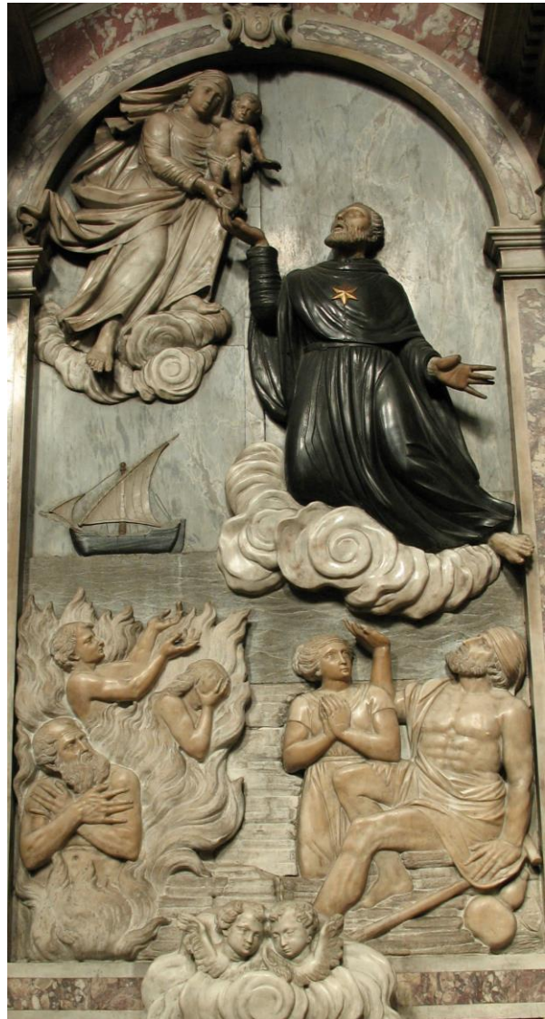
Slika 10) Radionica obitelji Capovilla, Zagovor sv. Nikole Tolentinskog (1781.), oltar sv. Nikole Tolentinskog, crkva sv. Jeronima, Rijeka.

I figuralna rješenja radionice Sebastiana Petruzzija vuku svoje porijeklo i pod utjecajem su likova nastalih u radionici koja im je prethodila a to je ona Antonija Michelazzija. 35 Tako na Michelazzijevom glavnom oltaru iz crkve sv. Petra i Pavla u Bribiru (1747.-1748.) zatičemo lik sv. Petra koji gestom desne ruke položene na prsa i uzdignutom glavom podsjeća na