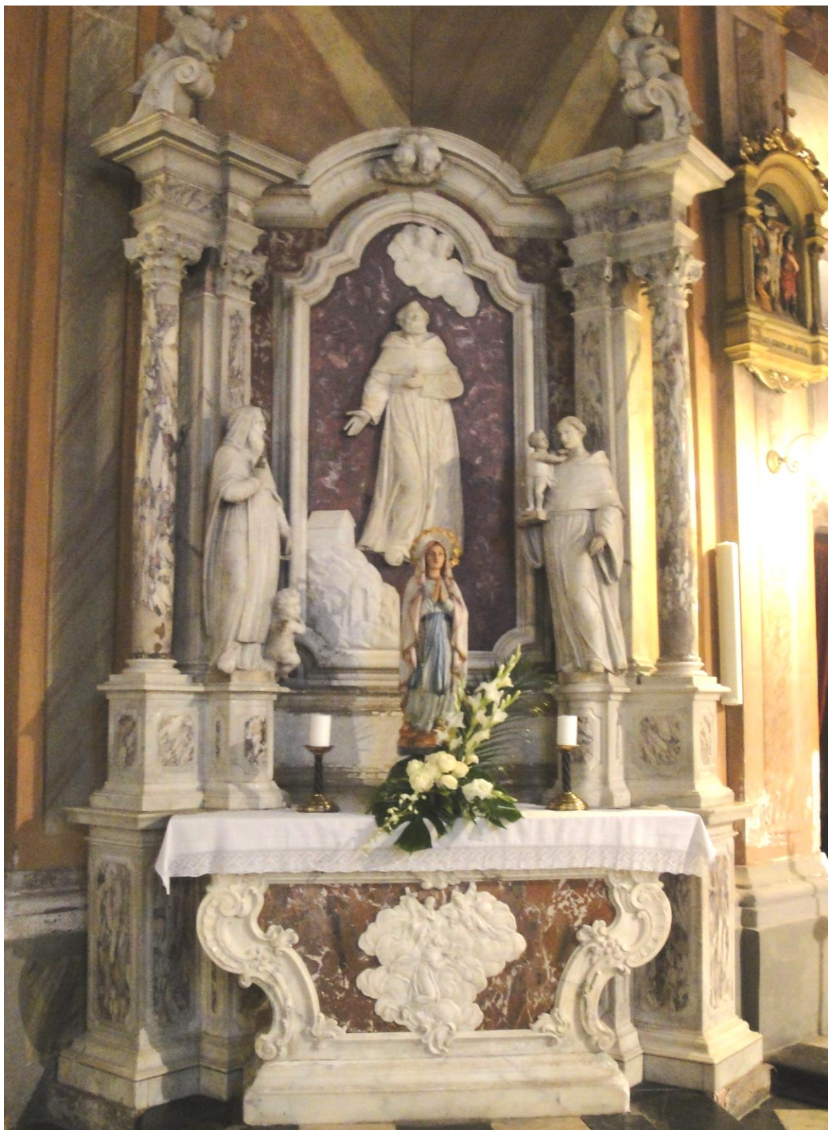
Slika 2) Oltar sv. Franje Serafijskog (1780.-1783.), crkva sv. Ivana Krstitelja, Nova Ves, Zagreb.