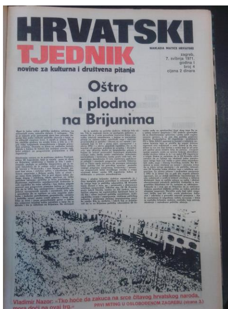
Slika 3. Naslovnica Hrvatski tjednik 1971. 4. broj