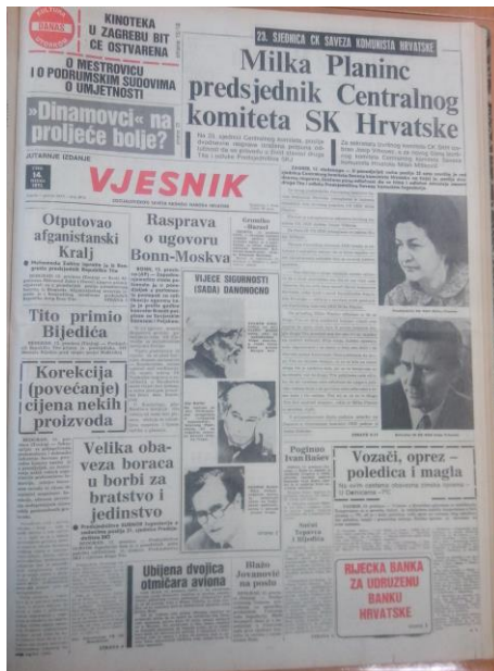
Slika 10. Naslovnica Vjesnika 14. prosinac 1971.

smijenjenom vodstvu. Demonstracije su silom ugušene pri čemu je velik broj osoba bio priveden. 108