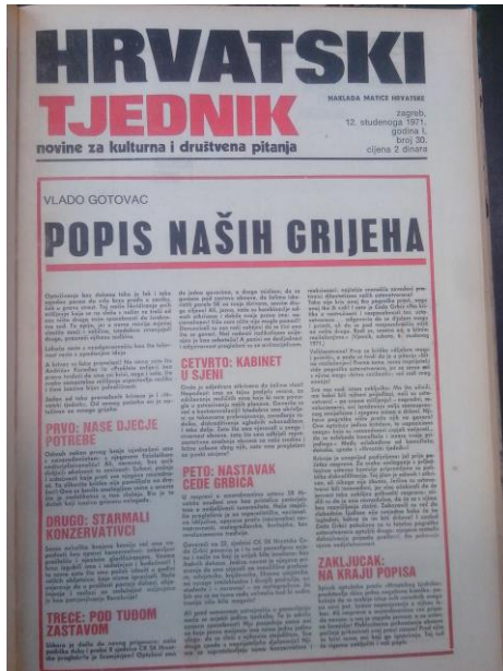
Slika 8. Naslovnica Hrvatskog tjednik broj 30 12. studeni 1971.

U tijeku teških optužbi na račun Hrvatskog tjednika izlazi odgovor u 30. broju od 12. studenog, koji sve optužbe odbacuje na naslovnici s „popisom naših grijeha“ koju potpisuje V. Gotovac. V. Gotovac u tekstu piše o brojnim optužbama bez dokaza, za nacionalizam, antisocijalizam, kabinetu u sjeni kao kontra revoluciji, prebrojavanju i separatizmu.