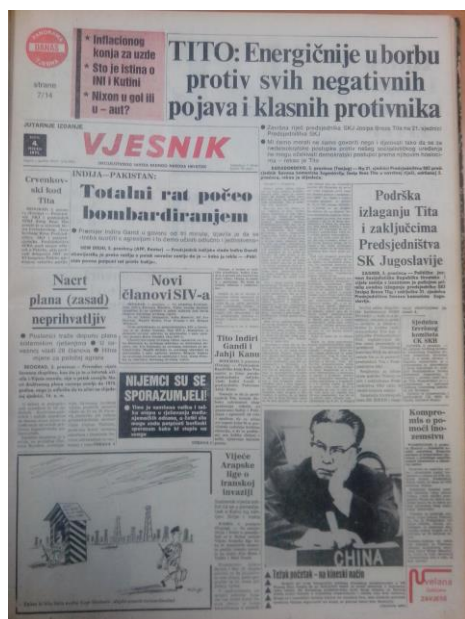
Slika 9. Naslovnica Vjesnika 4. prosinaca 1971.

rukovodstvo krivo za stanje u Hrvatskoj i da treba utvrditi tko stoji iza štrajka. Nadalje Tito u tekstu govori da se treba okrenuti našim organizacijama, a ne nekom novom pokretu. 102 Sljedeći dan u novinama Vjesnik se objavljuje još žešći napad na sve negativne pojave i klasne neprijatelje. Ovdje Tito kaže da se trebalo ranije poduzeti mjere protiv studenata zbog mogućnosti da se štrajk mogao proširiti na cijelu Jugoslaviju. Posebno je istaknuo da će se nedemokratski postupci provoditi protiv protivnika. 103