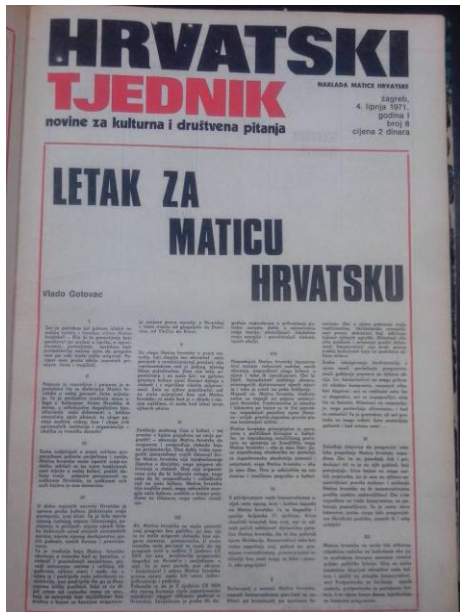
Slika 6. Hrvatski tjednik 4. lipnja 1971. broj 8.