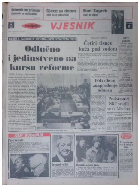
Slika 1. Vjesnik naslovnica 18. siječanj 1970.