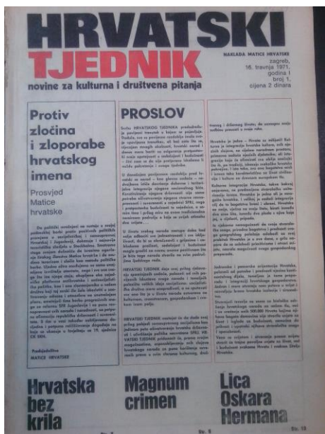
Slika 5. Naslovnica Hrvatskog tjednika iz 1971.

Prvi broj Hrvatskog tjednika izišao je 16. travnja. Na čelu lista kao glavni urednik je Igor Zidić do 13. broja kada uredništvo preuzima Vlado Gotovac. Na početnoj stranici je „Proslov“ u kojem se javnosti izlaže kakve će biti uređivačka politika. Proslov su napisali F. Tuđman, H. Šošić i I. Zidić.