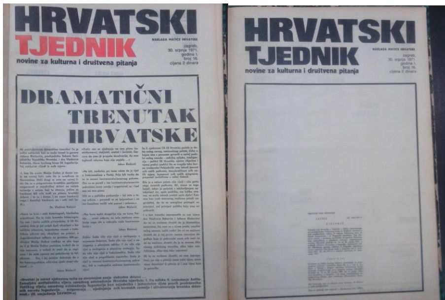
Slika 7. Otisnuti i kasnije zabranjeni broj 16. Hrvatskog tjednika od 30. lipnja 1971.