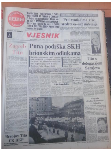
Slika 4. Vjesnik naslovnica 8. svibnja 1971.

U prvoj skupini su tkz. „reformatori“ na čelu s M. Tripalom i S. Dabčević-Kučar koji su stekli golemu popularnost u Hrvatskoj ali i Jugoslaviji što dovodi njihovu liniju u prednost pred protivnicima. Njihova otvorenost prema masama im je davala moć u pregovaranju u svrhu ostvarivanja svojih ciljeva kao vodstva CK, ali i interesa Hrvatske. Ovu skupinu možemo nazvati i liderskom zbog svojeg zalaganja da budu na čelu promjena. Vrhunac je reformatorska skupina imala na trgu Republike 7. svibnja pred oko 200 000 ljudi. Na tom skupu se istaknula S. Dabčević-Kučar svojim govorom u kojem je iskoristila Brijunski sastanak za podršku vodstvu SKH. Najvažniji dio govora je bio „hrvatski šovinisti razbijaju Jugoslaviju kakva nam je u interesu i koju hoćemo! Unitaristi i veliko srpski šovinisti, etatisti nude nam Jugoslaviju kakvu ne želimo i nećemo“. 29 Na skupu je utvrdila da će ustavne promjene donijeti veće ovlasti republikama ali i odgovornosti. Osim toga istaknula je punu ravnopravnost sa radničkom klasom na čelu tih promjena kroz njihovo učlanjivanje u SKH. Nadalje ističe da će u tom novom samoupravnom socijalizmu graditelj biti Tito i SK. 30 Ona ovdje ističe reformiranje SKH putem primanja novih članova. Na kraju svog govora predložila je da Tito bude prvi i doživotni predsjednik predsjedništva SFRJ. 31