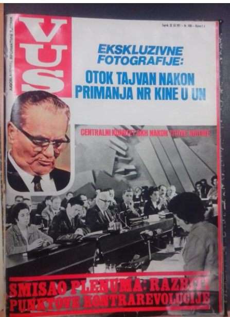
Slika 11. Naslovnica Vjesnika u Srijedu 22. prosinac 1971 broj 1025

Obračun s Maticom kreće 20. prosinca kada je upravni odbor podnio kolektivnu ostavku jer su odbili prokazati pojedince u svojim redovima što je od njih tražio CK SKH. Matica je branila svoju djelatnost i tako je osuđena na zatvaranje, te zabranu rada početkom 1972. godine. Zbog Matice hrvatske je osmišljen posebni policijski plan „M“ koji dovodi do sudskog progona članova Matice.