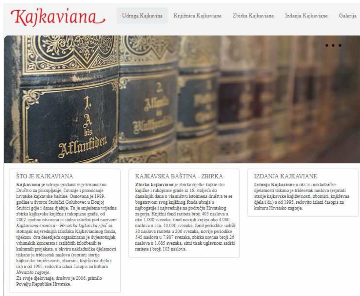
Slika 2. Naslovna mrežna stranica Kajkaviane

Specijalne knjižnice Krapinsko-zagorske županije ne pridaju previše pažnje izradi vlastitih mrežnih stranica i prisutnosti na društvenim mrežama. Samostalnu mrežnu stranicu ima samo Kajkaviana, ali i ona je nedovršena.