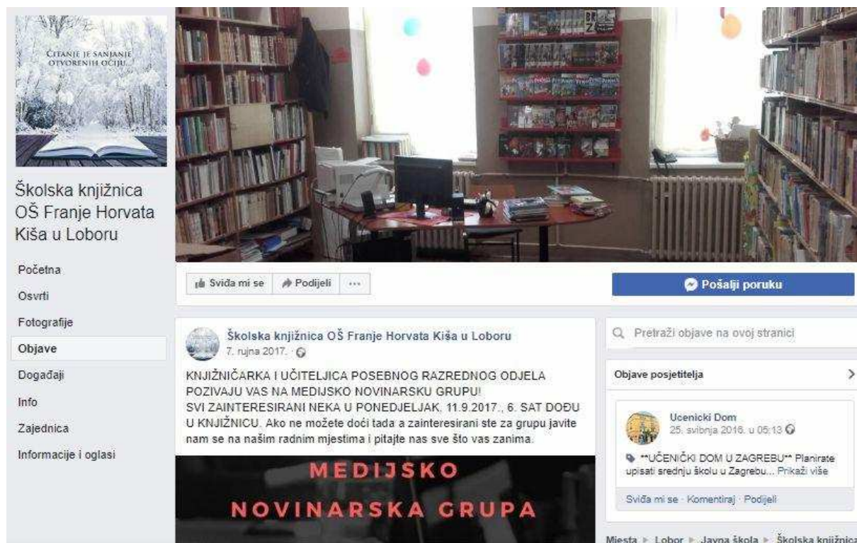
Slika 4. Facebook stranica Knjižnice Osnovne škole Franje Horvata Kiša Lobor

Facebook stranica Knjižnice Osnovne škole Hum na Sutli nije ažurna što je vidljivo po tome da je posljednja objava iz prosinca 2013. godine. Na stranici su se ranije objavljivale slike događanja održanih u knjižnici kao što su čitanje djeci iz vrtića, kao i onih koje je knjižnica organizirala (čitanje naglas mještanima Huma i sl.).