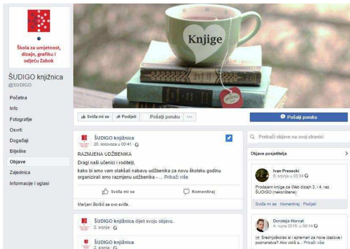
Slika 5. Facebook stranica Škole za umjetnost, dizajn, grafiku i odjeću Zabok

Facebook stranica Srednje škole za umjetnost, dizajn, grafiku i odjeću u Zaboku je ažurna što je vidljivo po posljednjoj objavi iz kolovoza 2018. godine. Stranica donosi informacije o školi i o aktivnostima u knjižnici, ali i obavijesti o raznim projektima izvan škole koji bi mogli zanimati učenike.