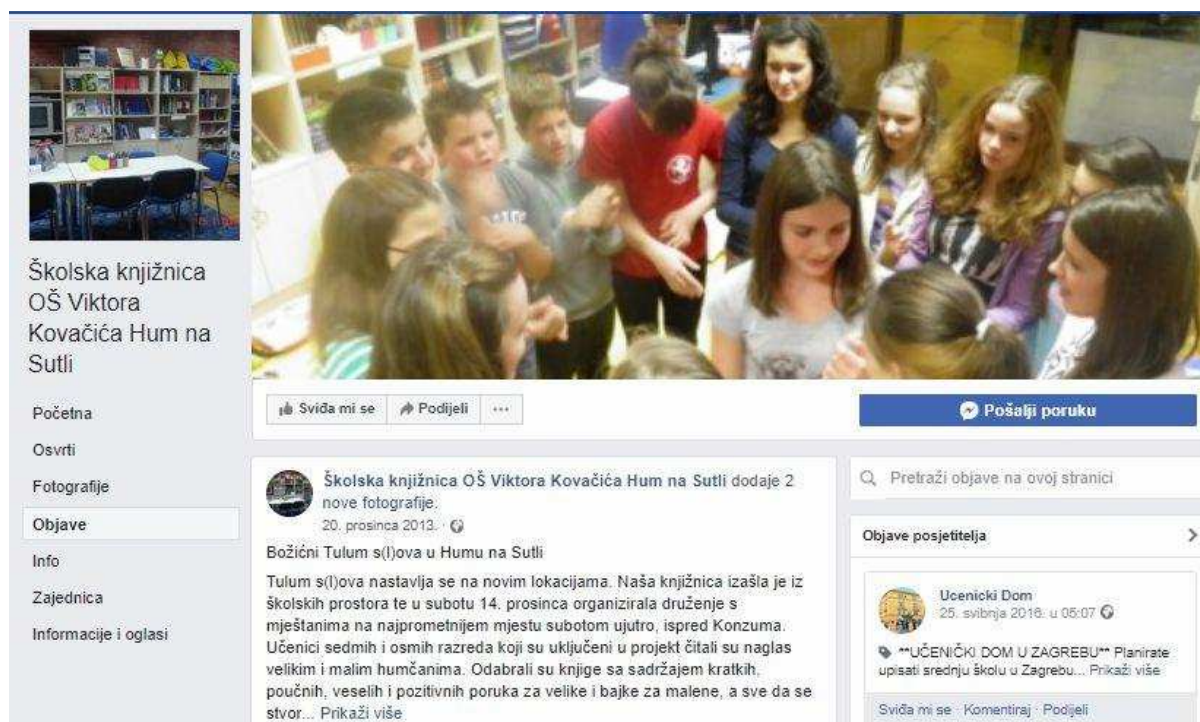
Slika 3. Facebook stranica Knjižnice Osnovne škole Viktora Kovačića Hum na Sutli

Velika većina osnovnoškolskih knjižnica ima mrežnu stranicu na mrežnom mjestu škole. Jedino Knjižnica Osnovne škole Donja Stubica ima mrežnu stranicu koja je u potpunosti samostalna. Od popularnih društvenih mreža samo dvije knjižnice imaju Facebook stranicu: Knjižnica Osnovne škole Viktora Kovačića Hum na Sutli 85 (stranica nije ažurna) i Knjižnica Osnovne škole Franje Horvata Kiša Lobar 86 . Ostale društvene mreže nisu korištene.