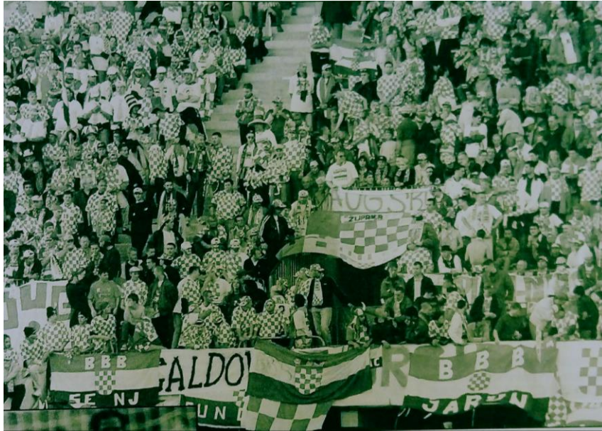
Slika 2: Potpora hrvatskim nogometašima sa tribine u Lensu, tijekom utakmice protiv Jamajke 154

Nakon završetka utakmice jedan je navijač slikovito iskazao osjećaje koje je u njemu probudila ova pobjeda: „Bila je to večer za povijest, i na travnjaku i na tribinama. Iako sam već u 'veteranskim' godinama, iako iza sebe imam sve, baš sve što jedan navijač može proći u karijeri, Lens će ostati duboko u meni. Ta noć probudila je one najdublje emocije, vratio sam se bezbroj puta na početke, u devedesetu, u poznate dane i mjesece koji su pisali hrvatsku povijest“. 153