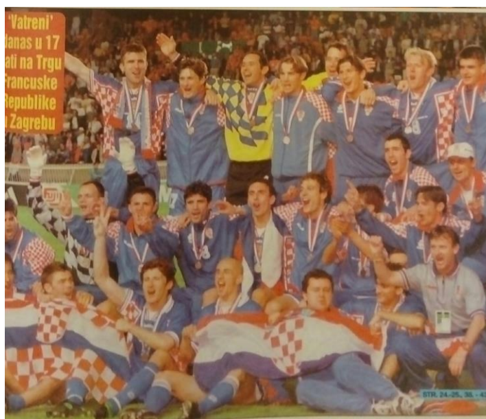
Slika 6: Slavlje igrača nakon dodjele medalja 179

Slika 6 prikazuje slavlje hrvatskih reprezentativaca i članova stručnog stožera nakon što su im dodijeljene medalje. Primjećujemo kako su svi odjeveni u dresove i trenirke koje na sebi imaju motiv „kockica“, a igrači su na dodjelu medalja donijeli i nacionalne zastave.