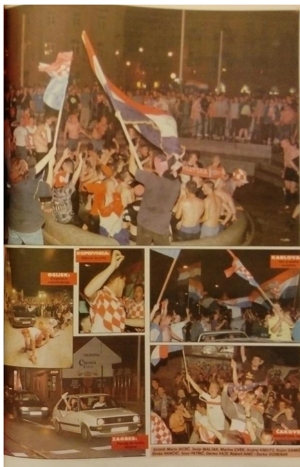
Slika 4: Slavlje navijača diljem Hrvatske nakon pobjede nad Njemačkom 171

Slika 4 sastoji se od kolaža fotografija koje su fotografi Večernjeg lista snimili u hrvatskim gradovima u noći pobjede nad reprezentacijom Njemačke. Na fotografijama vidimo