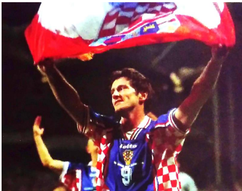
Slika 3: Davor Šuker s hrvatskom trobojnicom nakon pobjede nad Njemačkom 170