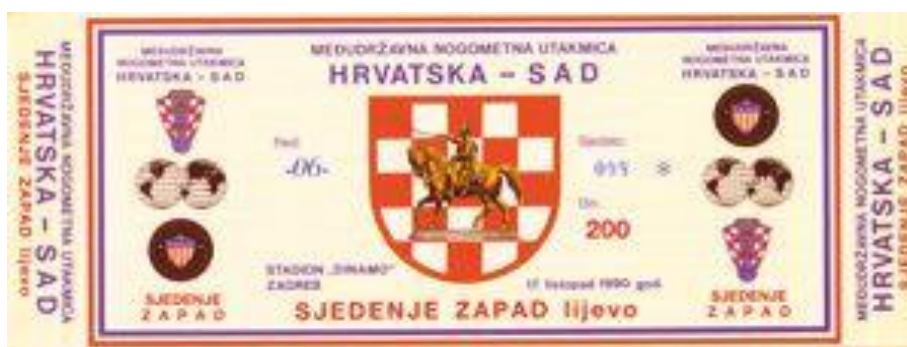
Slika 1: Ulaznica za međudržavnu utakmicu Hrvatska - SAD 113

Posljednji sportski događaj koji odražava društveno-politička zbivanja u zemlji na samom početku devedesetih je prijateljska nogometna utakmica između reprezentacija Hrvatske i SAD-a odigrana 17. listopada 1990. godine u Zagrebu. Navedena utakmica ima posebnu simboliku u suvremenoj povijesti hrvatskog sporta jer je na dan njezinog odigravanja Hrvatska još uvijek bila dio Jugoslavije radi čega je bilo velikih problema u samoj organizaciji ovog događaja. „Uz pomoć sporta kao „najglasnijeg“ medija u društvu, slala se poruka i građanima Hrvatske, Hrvatima u iseljeništvu ali i svijetu o društvenim promjenama koje je planirala politička elita predvođena Hrvatskom demokratskom zajednicom“. 111 Iako se radilo o prijateljskoj utakmici, u javnosti je bila obilježena kao „povijesna“, ali ne toliko radi svoje „sportske“ važnosti, koliko zbog društveno-političkog konteksta. Naime, dan ranije, na glavnom zagrebačkom trgu, upriličena je velika svečanost koju je prenosila nacionalna televizija, tijekom koje je na „staro mjesto“ postavljen kip bana Jelačića „simbol probuđene hrvatske svijesti“, koji se tamo nalazio osamdeset godina, prije nego li je za vrijeme komunističkog režima maknut. Zanimljivo je da je kip bana Jelačića bio apliciran na plakatu kojim se najavljivala predstojeća nogometna utakmica, kao i na ulaznicama (Slika 1) za ovaj susret. 112