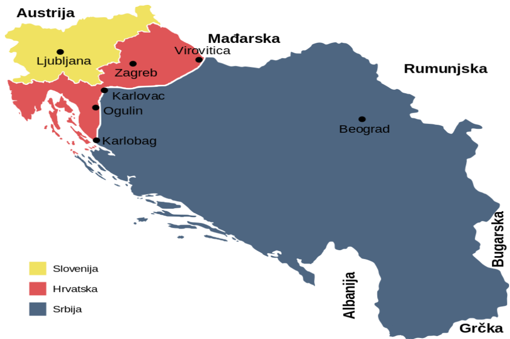
Slika 2: Karta "Velike Srbije" [2]