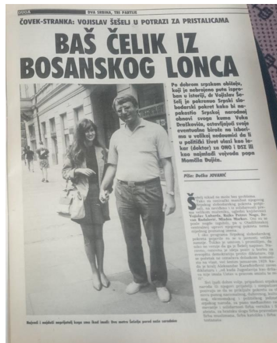
Slika 5: Fotografija V.Šešelja u intervjuu za "Dugu" [5]

U članku Baš čelik iz bosanskog lonca , autorice Duške Jovanić, naveo bih nekoliko izjava Vojislava Šešelja. Pa tako on tvrdi sljedeće: “U slučaju da Slovenci i Hrvati odluče da istupe iz Jugoslavije, zalažem se za demokratsku integraciju svih istorijskih pokrajina u kojima u većini živi srpski narod. Ubeđeni smo da je neophodno posebnu pažnju posvetiti stvaranju mogućnosti za slobodan i nesmetan povratak u Otadžbinu svim srpskim iseljenicima, kao i stalnom jačanju kulturnih, ekonomskih i političkih veza Otadžbine i dijaspore. “, čime direktno daje na znanje da je zagovornik velikosrpsva. U nastavku teksta Duška Jovanić piše o Šešelju da je zagriženi nacionalist, što je smatrala njegovom najvećom kvalitetom. Šešelj je tvrdio da je u Bosni nemoguće govoriti o međunacionalnim odnosima, budući da tamo žive isključivo Srbi, ali