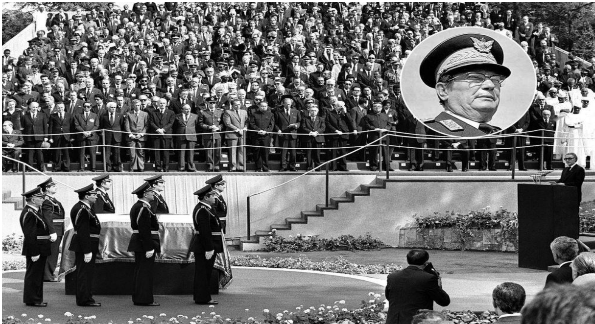
Slika 3: Titov sprovod 1980. godine [3]

U proljeće 1981. godine, dolazi do nemira na Kosovu. Razlog nemira je bio ekonomsko zaostajanje pokrajine i sve veća politička neravnopravnost s drugima u Jugoslaviji. Započeli su ih studenti i učenici u Prištini (u studentskom restoranu), odakle su se proširili diljem cijele pokrajine.