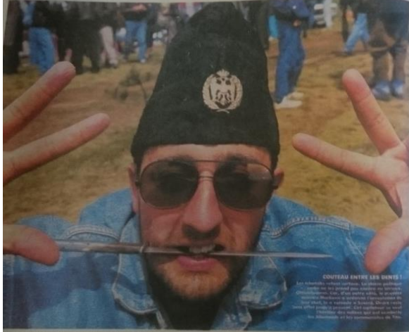
Beograd: Krahajski nos za borilačke veštine