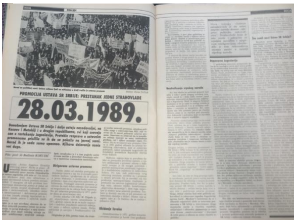
Slika 4: Članak objavljen u "Dugi", travanj 1989. [4]

jedne strahovlade ), gdje se veličalo ponovno ujedinjenje Srbije i kritiziralo amandmane iz 1971., te Ustav 1974. godine. 80 Međutim, članak koji mi je privukao najviše pažnje, jest intervju Mirjane Marković, profesorice socijologije na Beogradskom sveučilištu, predsjednice stranke Jugoslavenska levica, te supruge Slobodana Miloševića. U intervjuu se govorilo o ulozi intelektualaca i inteligencije u