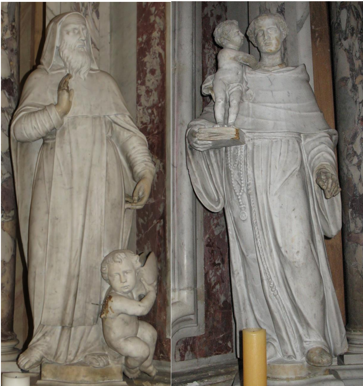
Slika 13. Sebastiano Petrucci, Sv. Benedikt , 1780., Zagreb (Nova Ves), crkva sv. Ivana Krstitelja, oltar sv. Franje Serafinskoga.