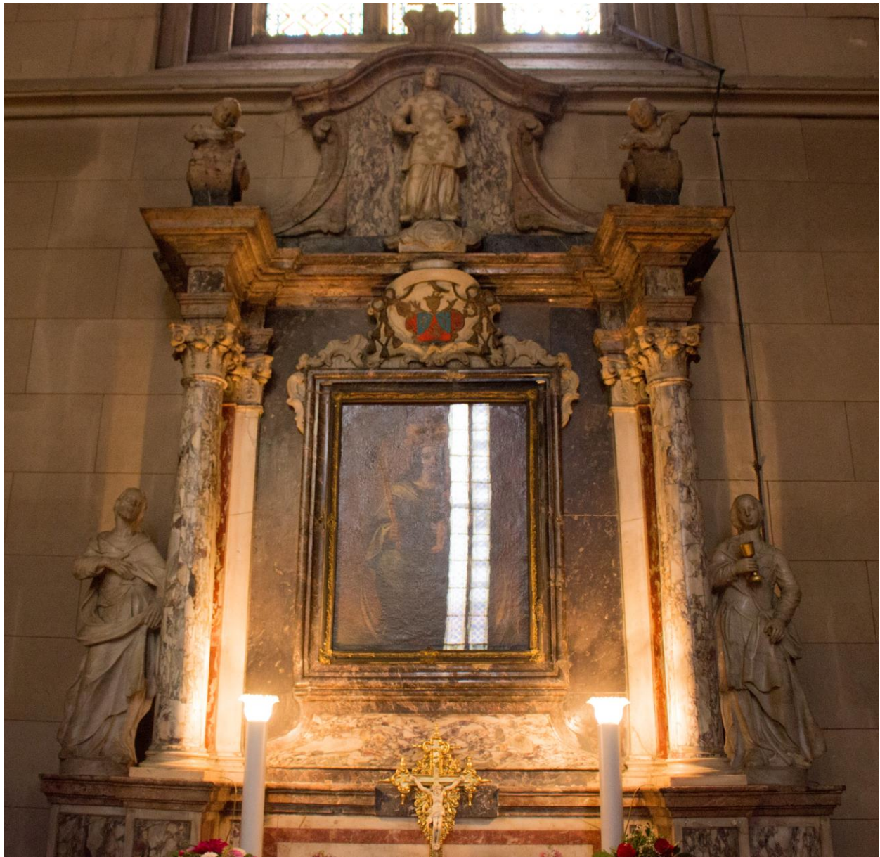
Slika 16. Sebastiano Petrucci, Oltar Marije Pomoćnice , mramor, 1778., Zagrebačka katedrala.