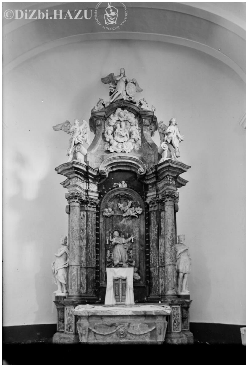
Slika 15. Oltar sv. Ivana Nepomuka (1776.), Glina, Crkva Svetoga Ivana Nepomuka, 1939.

velikim krilatim anđelom koji nosi grb. Nije poznato koje je točno dijelove radio Petruzzi, ono što je pouzdano je da je izradio skulpturu završnog anđela. 119