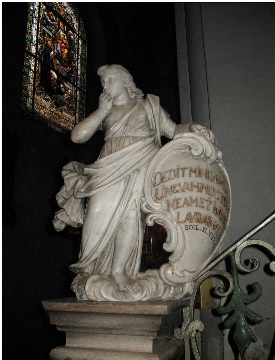
Slika 17. Sebastiano Petrucci, Anđeo s propovjedaonice , mramor, najvjerojatnije nastao krajem 70-ih ili u 80-im godinama XVIII. stoljeća, Zagreb, crkva sv. Marije od Pohoda na Dolcu.