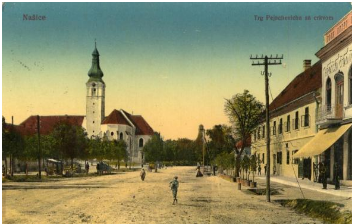
Slika 1. Našička crkva i trg 1915. godine

SHS društveni i gospodarski život polagano se normaliziraju. Grad uređenu infrastrukturu dobiva nakon Prvog svjetskog rata izgradnjom vodovoda, asfalta i električne centrale. S radom nastavljaju trgovačke radnje, društva, ciglana, a otvorena je i pilana. To je prekinuto novim svjetskim ratom. Ponovni procvat grad doživljava u drugoj polovici XX. stoljeća s ponovno oživljenim brojnim društvenim, kulturnim i obrazovnim sadržajima. Grad nije uspio umaknuti ni razaranjima Domovinskog rata te su u pucnjavama 1991. godine oštećene mnoge gradske ustanove te obiteljski domovi, a stradali su i crkva i samostan.