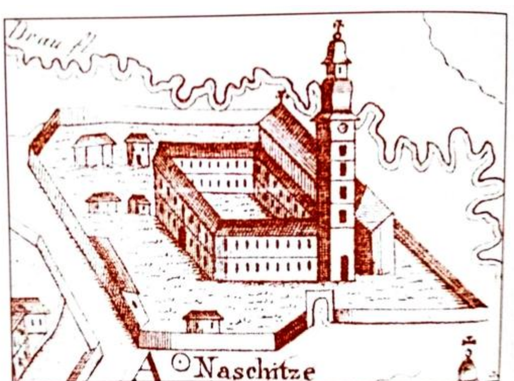
Slika 3. Crtež našičke crkve i samostana iz XVIII. stoljeća