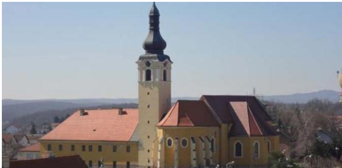
Slika 7: Pogled na svetište, zvonik i istočno krilo samostana (prije restauracije)