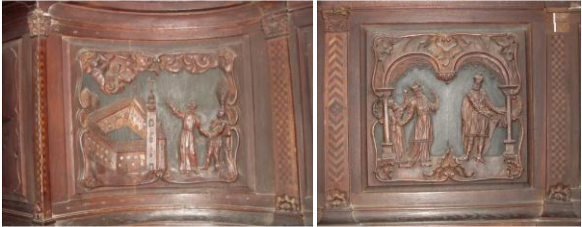
Slika 17; 18: Primjeri drvenih reljefa sjedala u pjevalištu