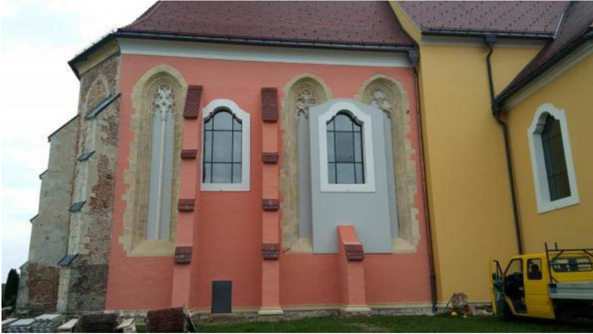
Slika 8: Pogled na svetište crkve