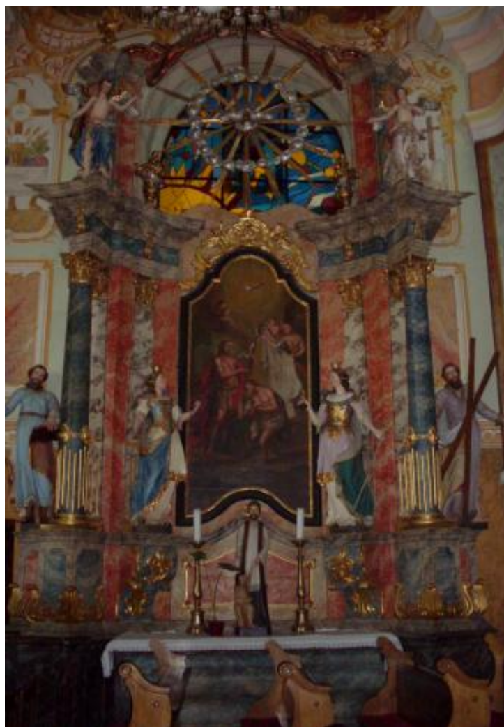
Slika 14: Oltar sv. Ivana Krstitelja

prikaz Majke Božje iz 1773. godine. 212 Slikajući našičke pale Falconer se koristio grafičkim predlošcima, što je posebno očito ako se Falconerova Sveta Obitelj usporedi s istoimenom slikom autora Martina Altomontea iz 1729. godine koja se nalazi u opatiji Heiligenkreuz u Beču, a s koje je Falconer doslovno preuzeo likove sv. Josipa i Isusa. 213 Prizor Stigmatizacije sv. Franje također je slikan ugledajući se na grafički predložak, i to na bakrorez Giuseppea Baronija iz 1702. godine, izrađenog prema djelu Antonija Balestre, a razlikuju se u odnosu likova i prostora te u svjetlosnim efektima, koje Balestra puno vještije izvodi. 214 Trećoj našičkoj oltarnoj pali, prizoru Kristova krštenja, pronalazi se više uzora, primjerice radoviCorneliusa Corta, Johanna Sadelera I., Carla Marratte ili Michaela Angela Unterbergera. 215