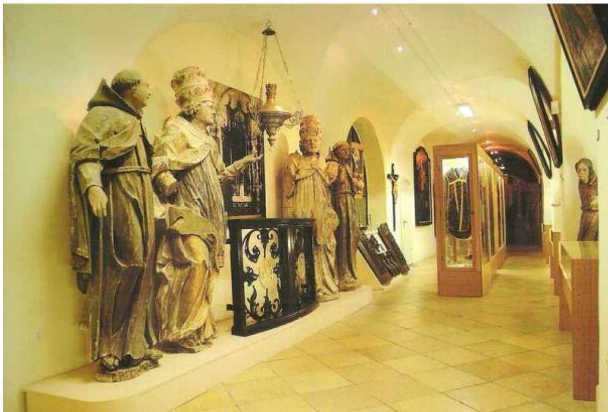
Slika 17: Skulpture izložene u samostanu

Pretpostavka je i da je kip bio postavljen na glavni oltar krajem XIX. stoljeća, tijekom preinaka koje su se zbile za gvardijana Firma Pletikapića. 235