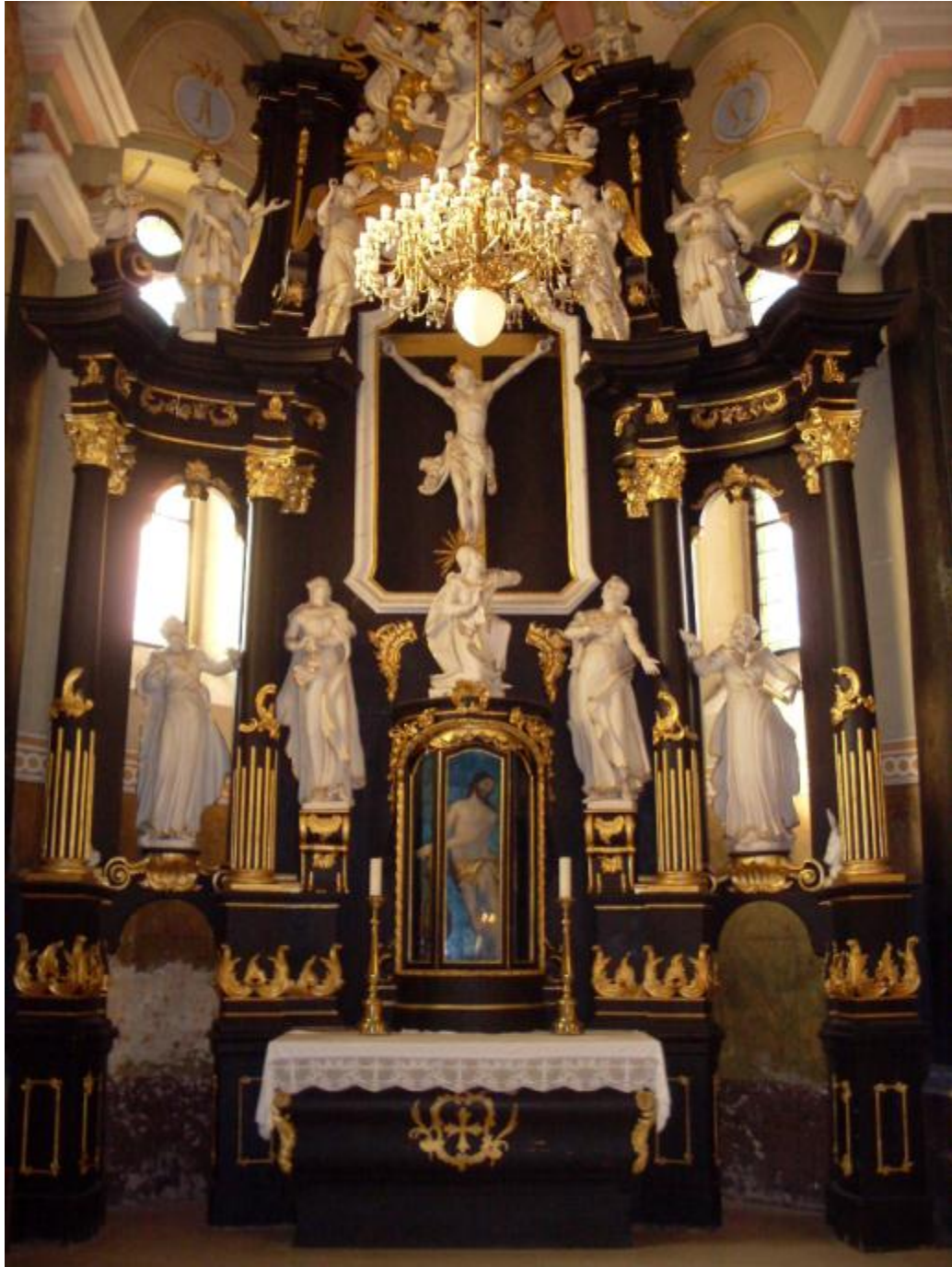
Slika 11: Oltar sv. Križa