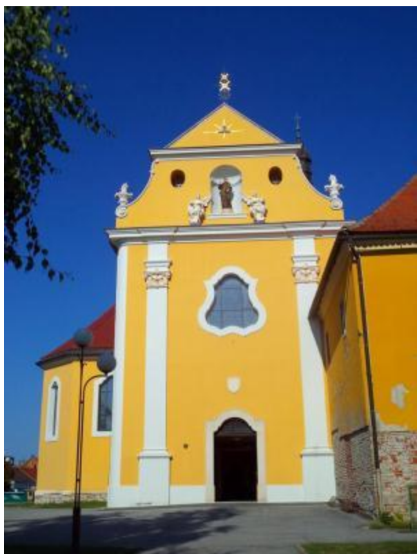
Slika 5: Zapadno pročelje crkve

zatvaraju kasetirane vratnice izrađene 1891. godine. 97 Iznad portala, u istoj osi, pročelje je rastvoreno velikim prozorskim otvorom koji osvjetljava pjevalište. Prozor je dinamičnog, kruškolikog oblika te je naglašen okvirom konkavno-konveksnih linija. Zona atike podijeljena je u dva dijela (sl. 6). U nižoj zoni nalazi se pravokutna polukružno zaključena niša sa skulpturom sv. Antuna Padovanskog prikazanog u franjevačkom habitu, s knjigom i ljiljanom u desnoj ruci. Nišu flankiraju kamene skulpture anđela na postamentima prikazanih u sjedećem položaju i raširenih krila. Sa strana niše zidnu plohu rastvaraju po jedan omanji ovalan prozor. Krajevi donje zone atike oblikovani su valovitom linijom koje u donjem dijelu završavaju volutom na koju je postavljen akroterij. U zabatnom polju atike nalazi se reljef Božjeg oka – oka prikazano u trokutu iz kojeg se šire zrake. Na vrhu pročelja nalazi se barokno oblikovano željezno raspelo.