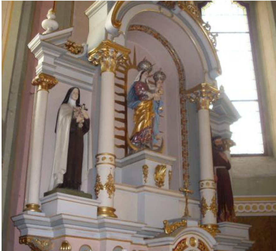
Slika 16: Kip Blažene Djevice Marije

skulptura vjerojatno bila jedna od prvih koju su franjevci bili unijeli u prostor crkve nakon njene obnove poslije povlačenja Osmanlija. 228