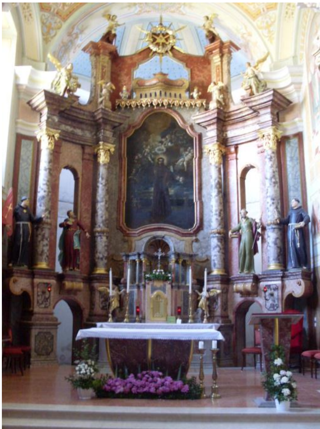
Slika 10: Glavni oltar sv. Antuna Padovanskog