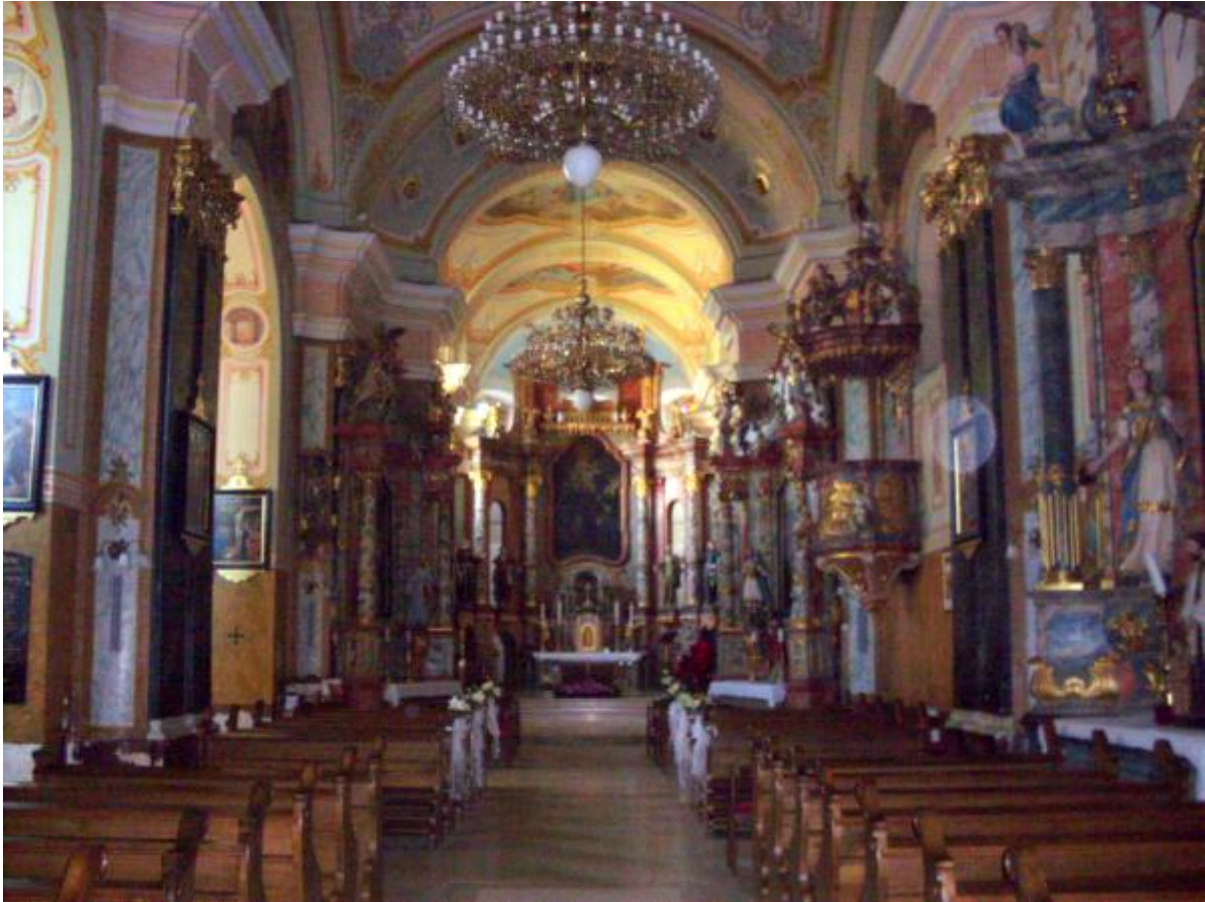
Slika 4: Pogled prema svetištu crkve

crno marmorizirani parovi pilastara s raskošnim pozlaćenim kapitelima. Profilacije vijenaca koji teku po zidu crkve razlučene su različitim koloritom. U gornjoj zoni, odnosno u zaključnom dijelu širokih i plitkih niša, izvedene su freske sa prizorima iz Kristova života. U svodnim poljima broda crkve dekorativnost se olakšava te su ona na pojasnicama i iznad njih naglašena biljnim i geometrijskim motivima. U svodnim poljima svetišta naslikani su prizori Sv. Trojstva te Djevice Marije kao Nebeske Kraljice, a na trijumfalnom luku nalaze se reljefi dvaju anđelčića koji podržavaju natpis u bogato oblikovanoj slikanoj kartuši.