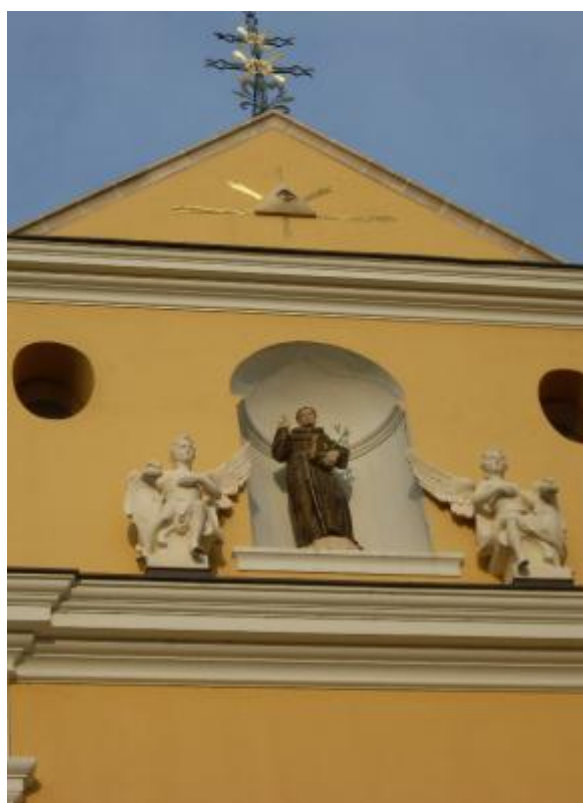
Slika 6: Skulpture pročelja crkve