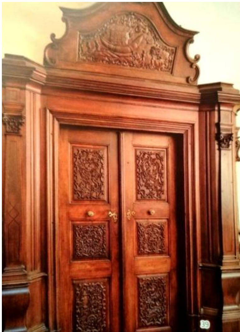
Slika 21: Vratnice refektorija

1769. godine. Rad su istog stolarsko-kiparskog dvojca, a u ukladama im se nalaze reljefni prizori Krista i Samaritanke na bunaru te Izviđači obećane zemlje s motkom s voćem. 250