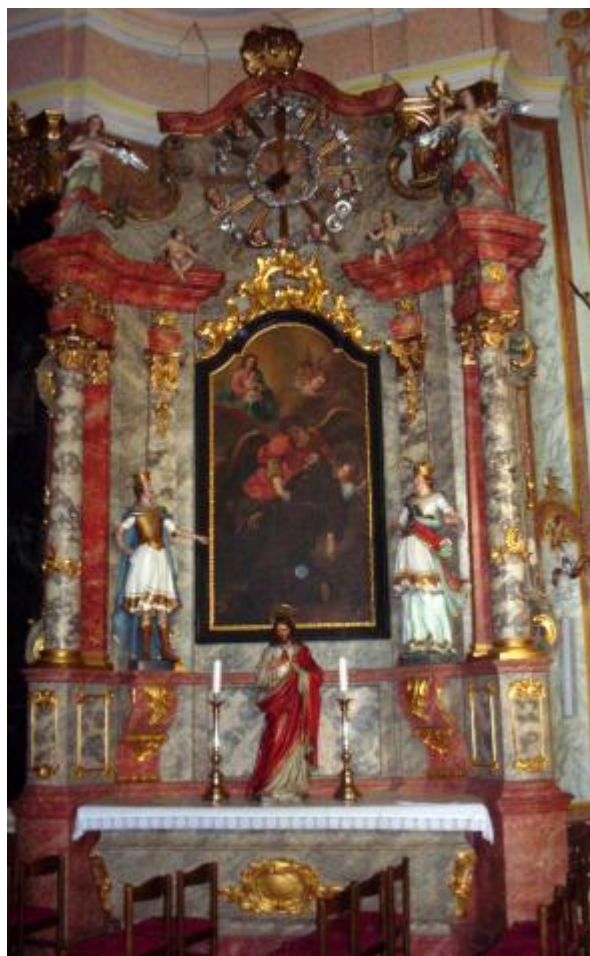
Slika 13: Oltar sv. Franje Asiškog