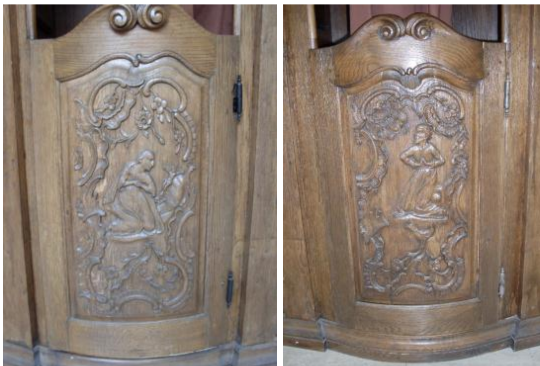
Slika 19; 20: Reljefi na ispovjedaonicama

trapezoidnu formu, zaključenu jednostavnim profilacijama. Dio za ispovjedanika sastoji se od jednostavnog klecala, naslona za ruke te manjeg otvora u bočnoj plohi kućišta ispunjenog drvenom rešetkom. Reljefni prizori prikazuju tri scene vezane uz sakrament ispovjedi – pokajnicu Mariju Magdalenu, raskajanog sv. Petra nakon zatajenja Krista, te čuvara ispovjedne tajne, sv. Ivana Nepomuka.