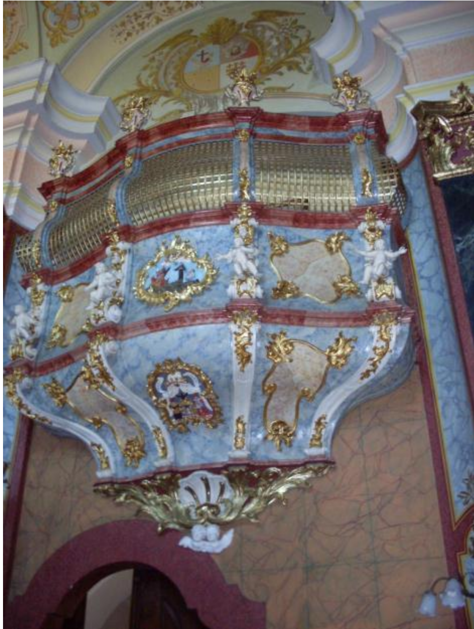
Slika 15: Oratorij