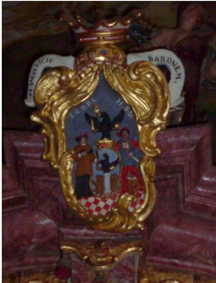
Slika 2. Barunski grb obitelji Pejačević na propovjedaonici našičke crkve

svjetskog rata, nakon kojeg su se raselili te im je oduzeta imovina za koju u novije vrijeme vode pregovore o povratu.