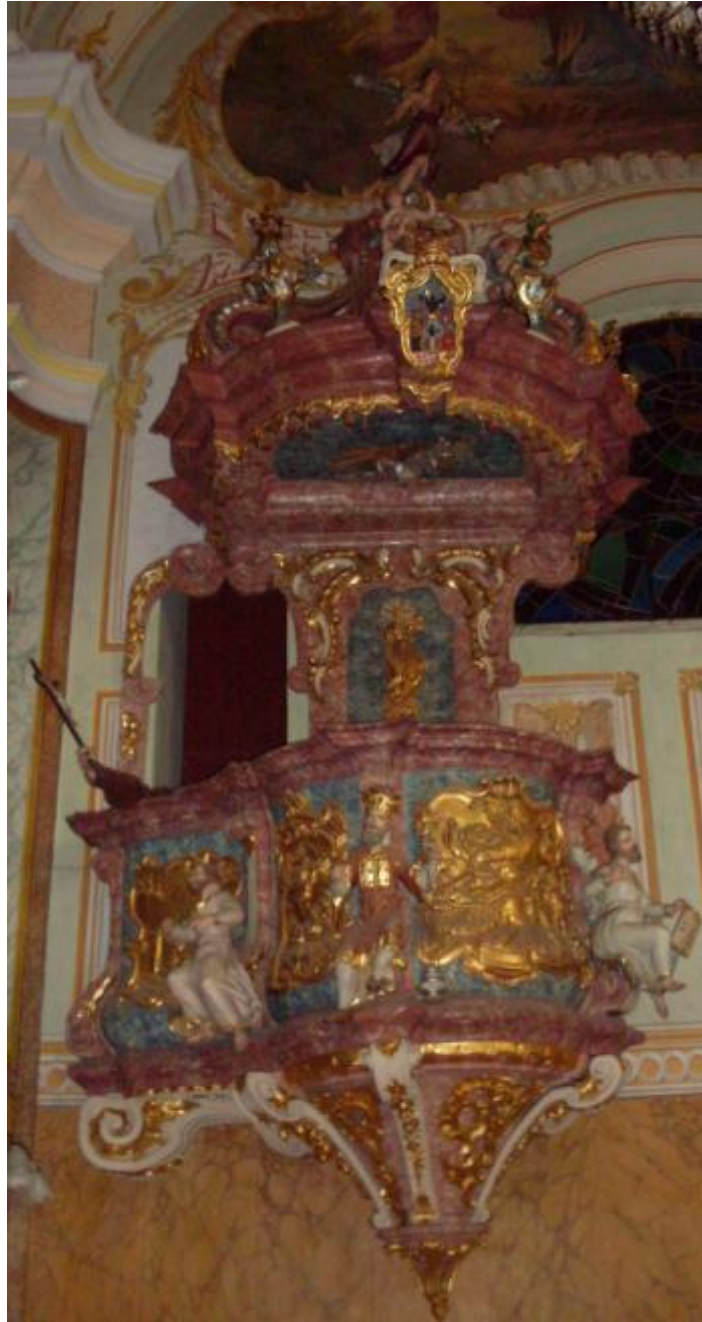
Slika 16: Propovjedaonica