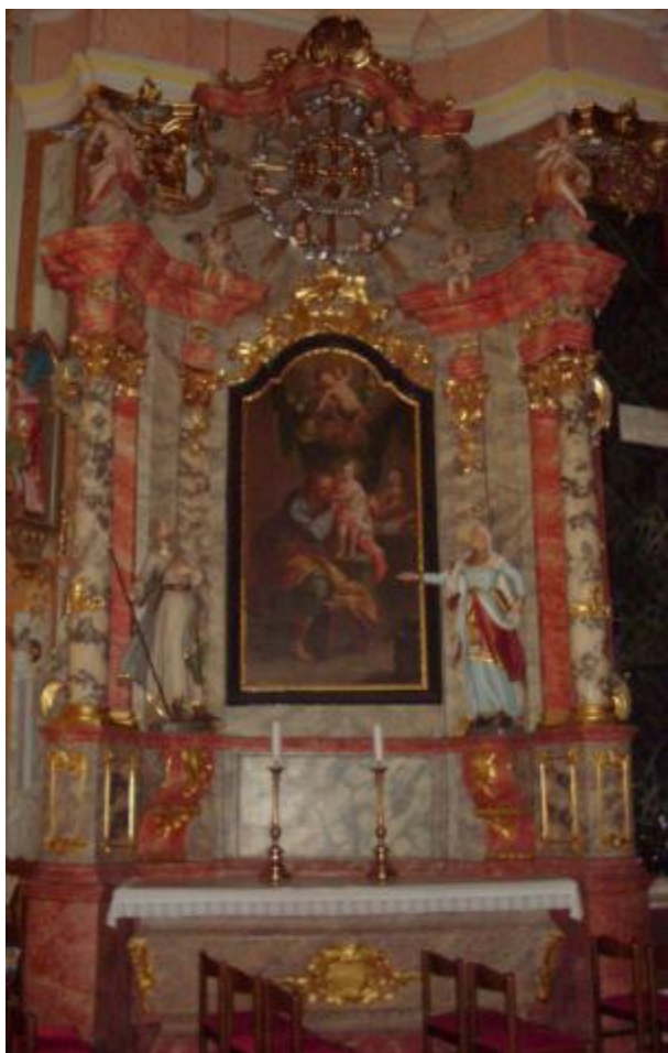
Slika 12: Oltar sv. Josipa