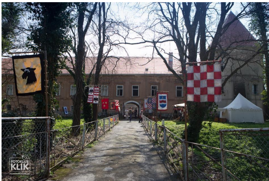
Prilog 2. Seljačka buna, Bitka kod Kerestince, 25. ožujka 2017., vanjski prostor dvorca ispred glavnog ulaza.

Obilježavanje Seljačke bune od 2013. godine održava se kontinuirano u veljači (ili ožujku) svake godine, ali bez fiksnog datuma. Najčešće se manifestacija održava u atriju dvorca, a za loših vremenskih uvjeta koristi se podrumna prostorija. Cijelo događanje sastoji se od dramskog prikaza Seljačke bune, odnosno dijaloga između grofice Barbare Alapić i nezadovoljnih kmetova i recitiranja prigodnih kajkavskih pjesama u čemu sudjeluju svetonedeljski pjesnici i učenici Osnovne škole Sv. Nedelja. Program se svake godine razlikuje jer ovisi o vremenskim prilikama, a time i o prostoru u kojem se događanje odvija te o udrugama koje sudjeluju. 30 Cilj nije samo obilježiti povijesnu zgodu već i prikazati nekadašnji, seoski način života. Prostor dvorca tada je ukrašen zastavama i grbovima, ispred samog dvorca postavljaju se šatori i barjaci, u atriju se nalazi vješalo i tlo je prekriveno sijenom, a članovi Ogranka i drugih udruga odjeveni u narodne nošnje ili jednostavne seljačke košulje s vilama u rukama doprinose ugođaju. Uza sve to, izvođači i posjetitelji imaju priliku pogostiti se „hranom koja je kuhana prema receptu u vrijeme bitke kod Kerestince 1573. godine“. 31