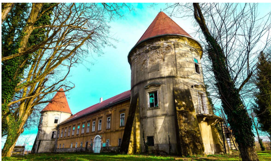
Prilog 1. Današnji izgled dvorca Kerestinec.