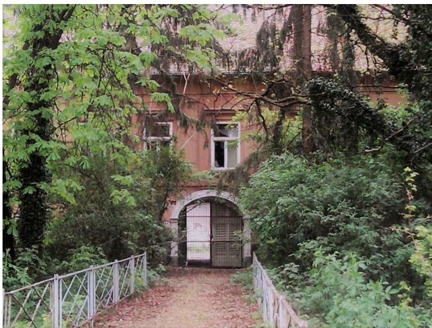
Prilog 3. Zarasli vanjski prostor dvorca kod glavnog ulaza, fotografija iz 2012. godine.

U prostorijama dvorca pronašli su ostatke uginulih životinja, mnogo otpada, prašine, stakla od razbijenih prozora i otpale žbuke, a u atriju dvorca raslo je drveće visine od gotovo dva metra. Tada su se podijelili u grupe od petnaestak ljudi; dok su jedni čistili unutarnje prostorije dvorca, drugi su se bavili uređenjem unutarnjeg dvorišta. Idući vikend organizirali su čišćenje atletske staze pored Državnog arhiva preko puta dvorca, dijela koji pripada istom zemljištu. Bez obzira na slab odaziv građana, napravio se veliki posao, a prostor je bio spreman za najavljene kulturne manifestacije.