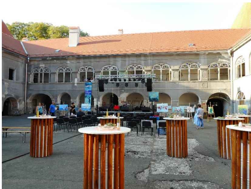
Prilog 7. 6. Festival ljubavne poezije, glazbe, meda i vina.

također koristili okrugli stolovi kao sjedeća mjesta za publiku koja je tijekom cijelog događanja sjedila na istim mjestima. Program 2018. godine utjecao je na nešto drugačiji raspored gledališta čime je promijenjen i kompletan izgled prostora dvorca u odnosu na prošle godine. Pozornicu su sa svake strane ukrašavale slike na drvenim stalcima čiji se dugačak niz širio prema istočnom zidu dvorca. Pred samom pozornicom bilo je postavljeno gledalište od četiri reda stolica s dodatnim rasklopnim klupama sa strane. Iza njih, u dnu atrija prema južnom krilu koji originalno ne pripada dvorcu, postavili su visoke okrugle stolove, bez pravilne formacije. Na stolove su kasnije bili postavljeni proizvodi od meda (rakija, medenjaci), a aranžmani načinjeni od bršljana i svjećica bili su doprinos romantičnom ugođaju. Ideja takve podjele prostora proizlazila je dakle iz samog programa jer se nakon večeri poezije publika premjestila iz prednjeg gledališta u stražnji dio za visoke stolove odakle su slušali glazbu u kojoj su se ispreplitali rock, country i blues. Time su organizatori u glazbenom dijelu ponudili nešto sasvim novo, mijenjajući time i sam prostor drugačijim izgledom i rasporedom gledališta. To je samo još jedan pokazatelj brojnih mogućnosti prostora atrija dvorca koji može izgledati drugačije i doživjeti se drugačije i nakon minimalnih intervencija.