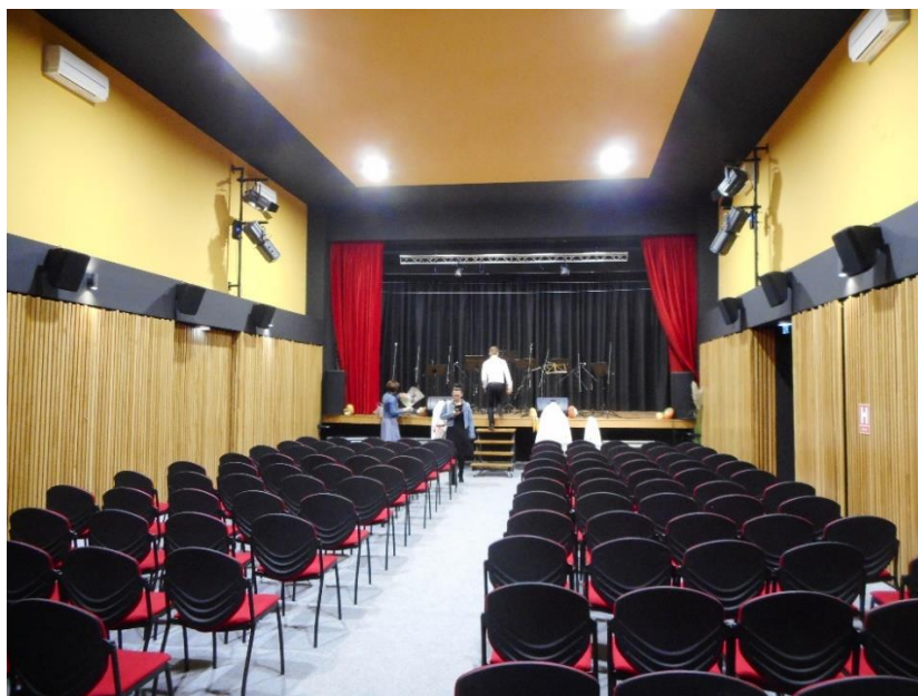
Prilog 8. Dvorana Društvenog doma Strmec.

Datum održavanja Tamburaške večeri 2018. bio je zakazan za 30. rujna i vjerovalo se da će se održati u podrumu dvorca sve dok otprilike tjedan dana prije događanja nisu objavljeni plakati s drugom lokacijom – Društveni dom Strmec. Razlog su naravno bile niske temperature, a Društveni dom u Strmcu pokazao se kao najbolji izbor zbog već ugrađene pozornice i kompletno novoobnovljenog prostora. Već je na prvi pogled bilo uočljivo da je to prostor namijenjen za glazbeno-scenska događanja, s povišenom pozornicom i zavjesama koje ju uokviruju, s profesionalnom ugrađenom rasvjetom i ozvučenjem, s fiksnim gledalištem te galerijom u stražnjem dijelu. Na rubu pozornice nalazili su se jesenski plodovi i bijeli stolnjaci s ručno šivanim detaljima, jedini dekorativni elementi u prostoru. Ništa drugo nije dolazilo do izražaja osim opreme, instrumenata i izvođača na pozornici te, najviše od svega, samog programa.