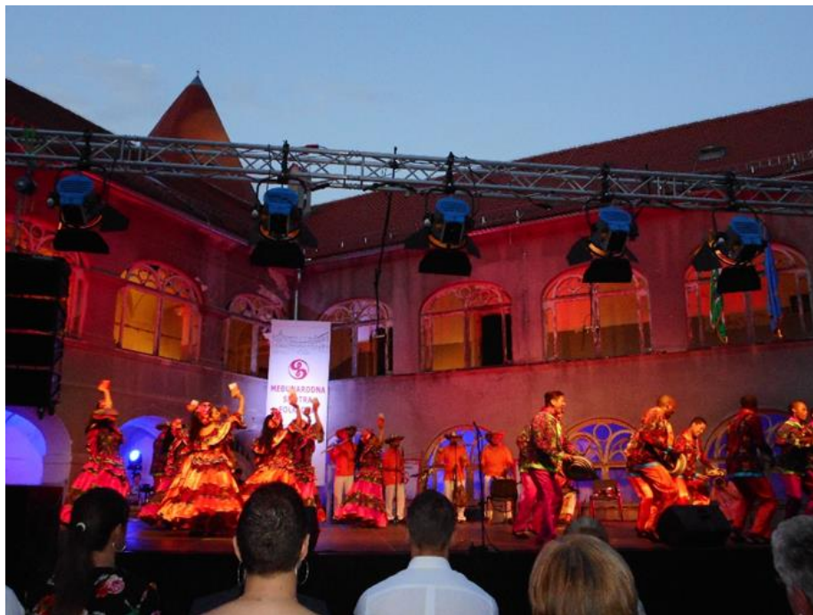
Prilog 5. Međunarodna smotra folklora u Sv. Nedelji; nastup Kolumbije.

Polu sata prije početka smotre, prostor nije bio znatno drugačiji ili uređeniji, osim što su na zidu između prozora postavljene zastave s logom smotre i nazivom svakog folklornog društva koje će nastupati. Razlika je bila u ljudima, posjetiteljima koji su zauzimali svoja mjesta, izvođačima koji su se u nošnjama šetali s jednog kraja dvorca na drugi, uzbuđenom žamoru koji se iz trenu u tren povećavao. Redari su imali završne pripreme oko pozornice, štandovi su bili puni svetonedeljskih suvenira i proizvoda, a predsjednik Zajednice davao je intervju za lokalnu televiziju. Prostor više nije bio prazan, već ispunjen i živahan, a njegova zapuštenost nije toliko dolazila do izražaja kada su pogledi bili usmjereni na pozornicu i dvorac u cijelosti. Tijekom trajanja smotre, u fokusu su bili ples i dvorac, a sve ostalo palo je u drugi plan čime je uspješno provedena ideja dvorca kao kulise. S postepenim nestajanjem sunca, dvorac bi dolazio sve više do izražaja, pogotovo zbog profesionalne rasvjete koja je njegove zidine ukrasila živim bojama.