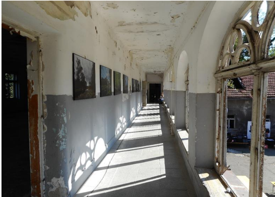
Prilog 4. Izložba fotografija na prvom katu u hodniku dvorca Kerestinec; FotOOko 2018.

konstantno se nešto događalo i to istovremeno na više mjesta. Posjetitelj je mogao birati hoće li sudjelovati na radionici, slušati predavanje ili gledati izložbu. Mnogi su koristili i samu izložbu kao dio pozadine za vlastitu fotografiju, uključujući pri tome i odabrani prostor dvorca.