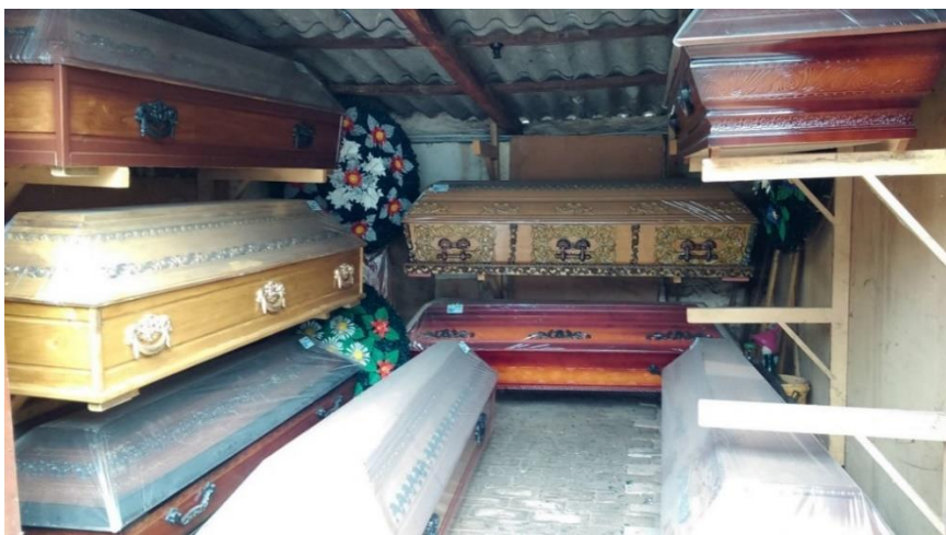
Slika 7b. Ručno rađeni lijesovi iz obrta u Golubincima. Snimila Sindy Vuković 2017. godine.