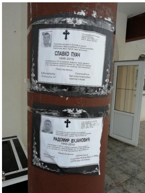
Slika 4a. Pravoslavne osmrtnice u Hrtkovcima.