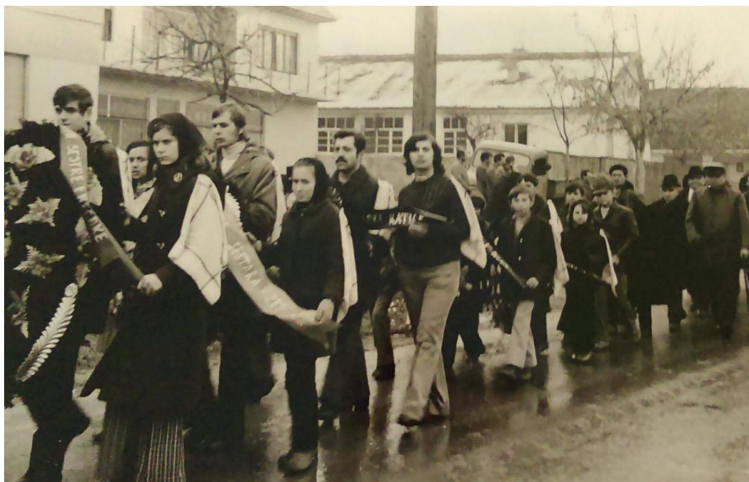
Slika 14c. Pogrebna povorka u Sotu sedamdesetih godina 20. stoljeća.