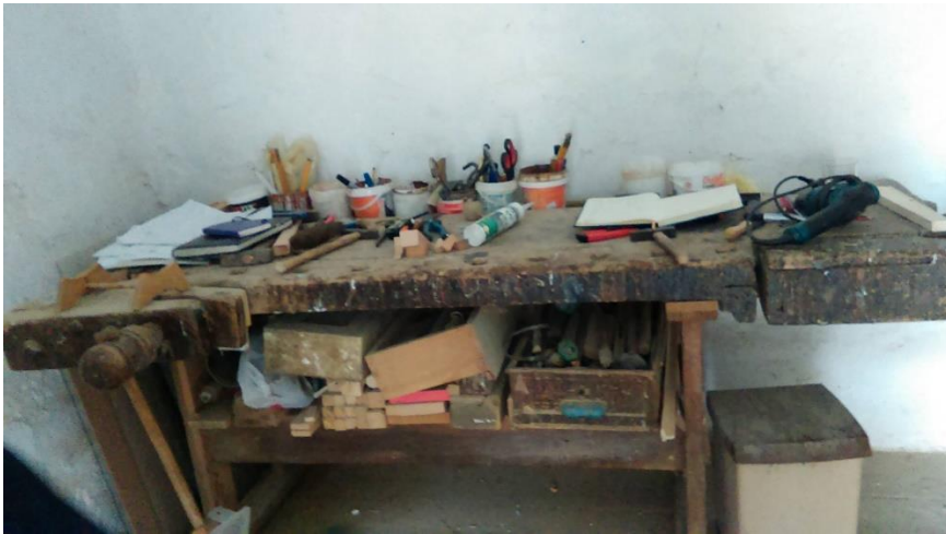
Slika 6. Stol za obradu drva/stolarska tezga u Golubincima. Snimila Sindy Vuković 2017. godine.