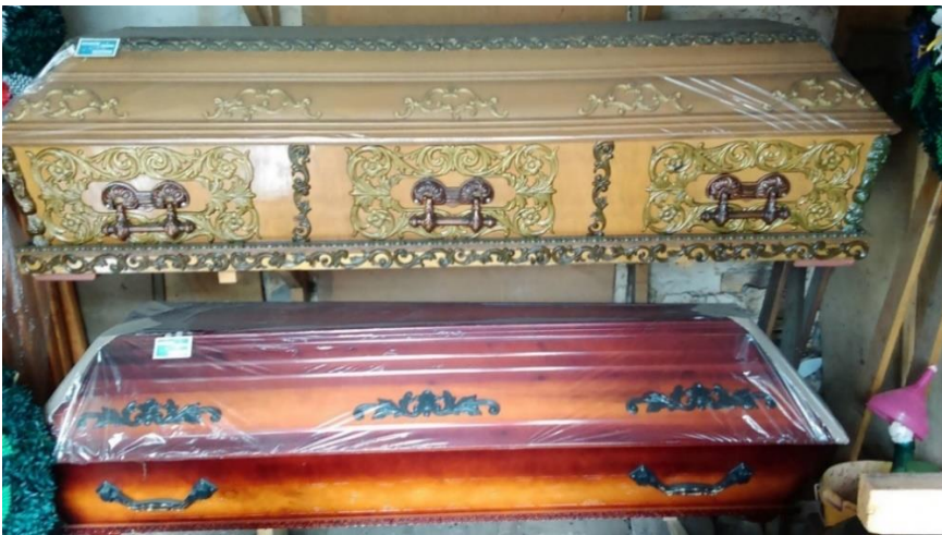
Slika 7a. Ručno rađeni lijesovi iz obrta u Golubincima. Snimila Sindy Vuković 2017. godine.