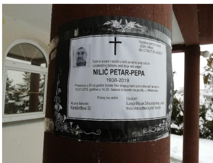
Slika 4b. Katolička osmrtnica u Hrtkovcima. Snimila Sindy Vuković 2019. godine.