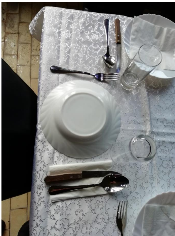
Slika 30b. Prevrnut tanjur za pokojnika na čelu stola postavljenog za daću u Hrtkovcima. 2019. godine.

U Sotu se nakon daće na čelu stola preko noći ostavlja tanjur s hranom za pokojnika i sol da se vidi „dal' je bio kod kuće“ (Katica Bohnički).