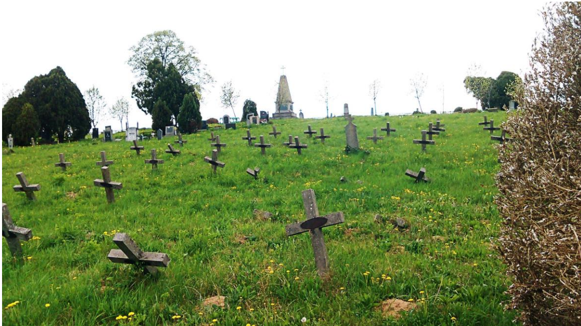
Slika 25a. Kameni nadgrobni spomenici u obliku križa u Petrovaradinu.