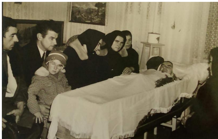
Slika 8b. Bdijenje 1973. godine u Sotu.