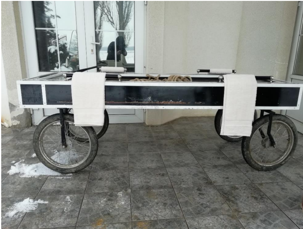
Slika 13b. Pogrebna kolica u Hrtkovcima. Snimila Sindy Vuković 2019. godine.