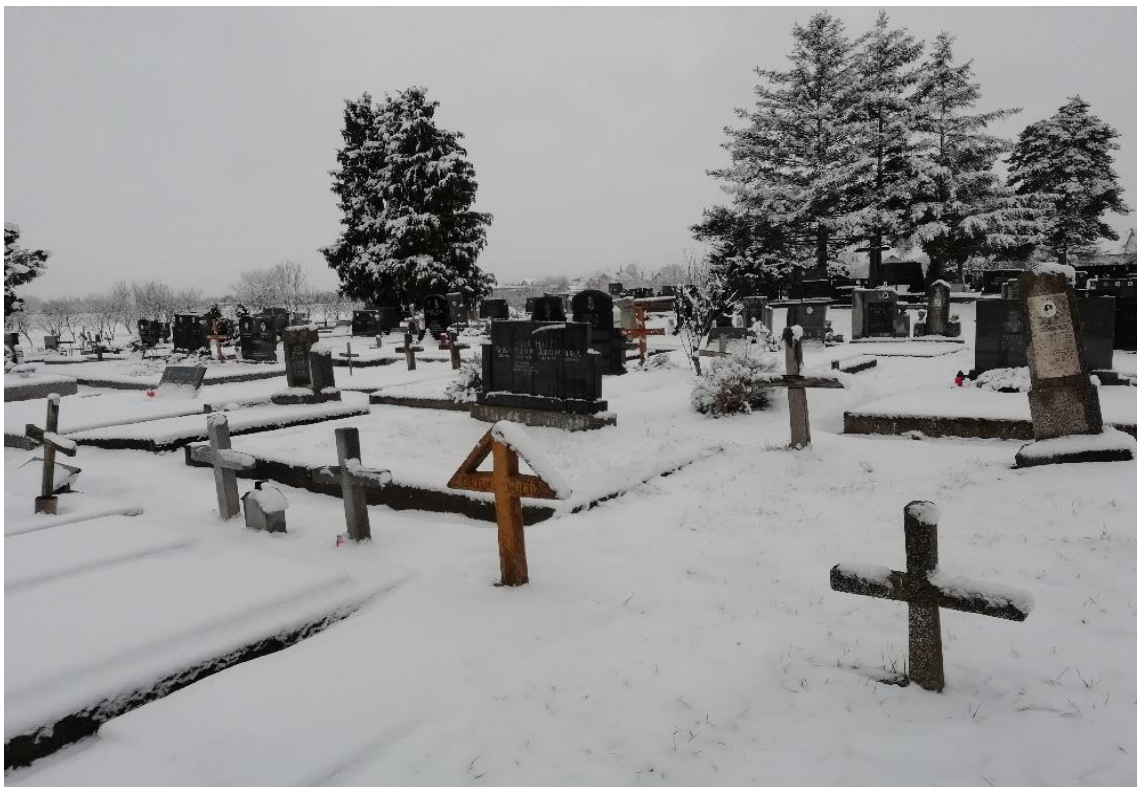
Slika 25b. Kameni nadgrobni spomenici u obliku križa u Hrtkovcima.