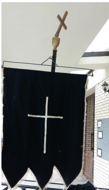
Slika 16. Barjak za pogrebe u Golubincima. Snimila Sindy Vuković 2017. godine.

U Sotu, Golubincima i Hrtkocima nose se dva crna barjaka na početku povorke (Slika 16). U Sotu obično pokojnikove kume (krsne ili vjenčane) nose barjake, u Golubincima mladići ili djevojke, a u Hrtkocima se na sedenju dogovara tko će ih nositi.