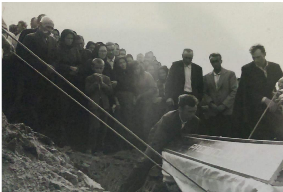
Slika 22. Spuštanje lijesa u grob u Sotu sedamdesetih godina 20. stoljeća.

Ispred kapele svećenik se pozdravlja okupljene i čita Božju riječ . Nakon toga se kaže nekoliko riječi o pokojniku, o njegovom životu i njegovim dobrim djelima. Kada se lijes spusti u raku (Slika 22), svećenik prvi baca zemlju uz riječi: „Spomeni se čovječe da si prah i da ćeš se u prah pretvoriti“, a drugi slijede njegov primjer i bacaju po grumen zemlje uz riječi: "Laka ti bila ova zemlja.“ Ivan Barat iz Srijemske Mitrovice spomenuo je kako su se nekad žene, prilikom spuštanja lijesa u raku, nerijetko naglas obraćale svojim pokojnicima, za koje se vjerovalo da su „odveli“ pokojnika u smrt: „Mama moja, evo došo ti je tvoj unuk.(...) To se više verovalo, kad je neko umro, da je odveo.“ Danas se to više ne radi, jer su ljudi suzdržaniji, smatra Ivan Barat. Pogreb najčešće završava molitvom Oče naš za onoga koji je umro i za onoga koji će prvi umrijeti ili pak molitvom za sve pokojnike.