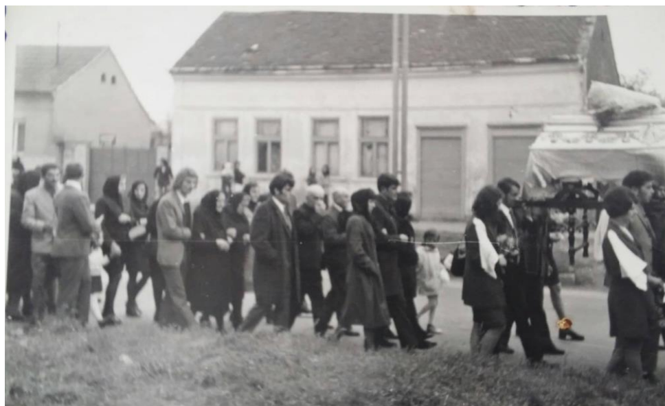
Slika 20b. Peškiri na ramenima sudionika pogrebne povorke u Srijemskoj Mitrovici 1973. godine.

U Golubincima se nekad na kraju pogrebne povorke nosio ceger (pletena torba) u kojem su bili kruh (narezan na komadiće), rakija i sol. To se nakon pogreba konzumiralo na ulazu u groblje (Slika 21): „Sad ima onaj, stoji ispred groblja, stol. Tu se stavi i svaki uzme zalogaj toga hleba. Muškarci uzmu čašicu rakije, za pokoj duše, malo prospe.“ (Katica Čaćić) Nepoznato je kada