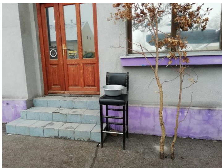
Slika 29. Lavor s vodom ispred restorana u kojemu se održava daća u Hrtkovcima. Snimila Sindy Vuković 2019. godine.

pečenje, salata i štrudla s makom . U Hrtkovcima se nekad daća također održavala kod kuće, a danas se za tu priliku iznajmljuje restoran. Kada se daća održavala kod kuće, obično su četiri žene kuhale čorbu , a posluživalo se i pečenje te salata. Siromašnije obitelji su posluživale samo krompir paprikaš . U vrijeme mog dolaska u Hrtkovce, u restoranu kojeg mještani zovu „Kod Cicvare“ spremala se daća , pa sam imala prilike fotografirati lavor s vodom ispred ulaza (Slika 29) i postavljen stol s prevrnutim tanjurom za pokojnika (Slika 30a i 30b).