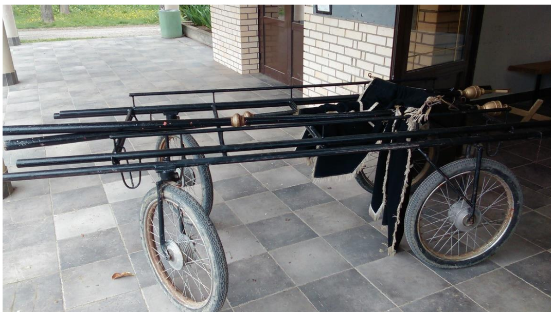
Slika 13a. Pogrebna kolica u Golubincima. Snimila Sindy Vuković 2017. godine.

Lijes se nekad nosio na nosilima. Za nošenje su bili zaduženi muškarci (njih četvero ili šestero). Budući da je put od kuće do groblja bio dugačak i naporan, nosači lijesa nerijetko su imali svoju zamjenu, tvrdi Perica Kovačević iz Hrtkovaca. Na nosila su se vezali peškiri koji su se kasnije poklanjali nosačima. Otac Katice Đerki iz Sota, koji je bio stolar, izradio je nosila za sprovede i poklonio ih lokalnoj crkvi šezdesetih godina 20. stoljeća. U nekim je mjestima za prijevoz lijesa do groblja služila kočija koju su vukli konji. Danas se za nošenje lijesa od kapele do groba koriste pogrebna kolica (Slika 13a, 13b, 13c). Na kolica se također vežu peškiri .