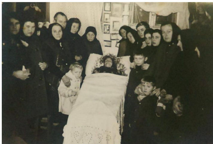
Slika 8a. Bdijenje 1969. godine u Sotu.