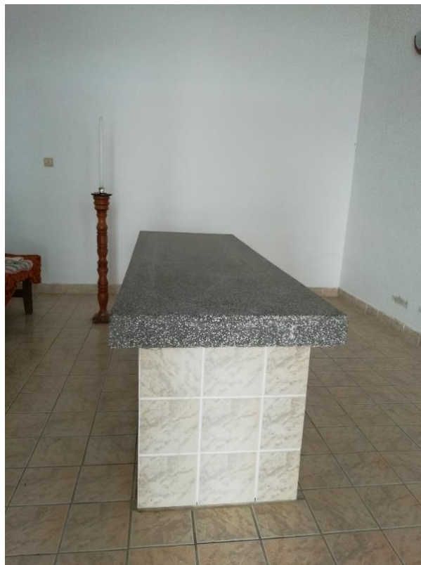
Slika 12a. Unutrašnjost kapele: stol na koji se stavlja lijes, Hrtkovci. Snimila Sindy Vuković 2019. godine.