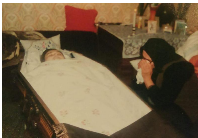
Slika 8c. Oplakivanje pokojnice na bdijenju 1983. godine u Sotu.