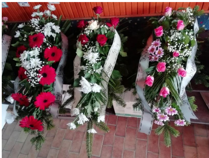
Slika 18. Cvjetni aranžmani od prirodnog cvijeća iz pogrebnog poduzeća „Suza“ u Hrtkocima.

U Petrovaradinu su muškarci nekad uz lijes nosili četiri duplira (velike, debele svijeće) ukrašena peškirima ili maramama, a Kazimir Peške iz Petrovaradina potvrdio je da se to prestalo raditi u novoj eri (21. stoljeće).