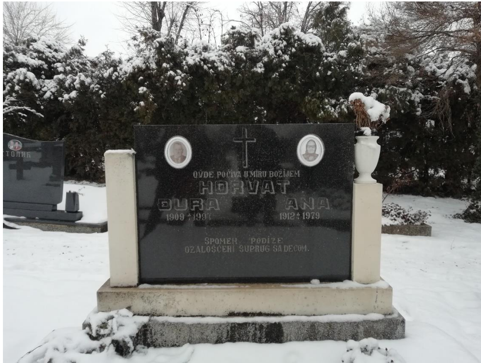
Slika 28b. Katolički nadgrobnni spomenik u Rumi.