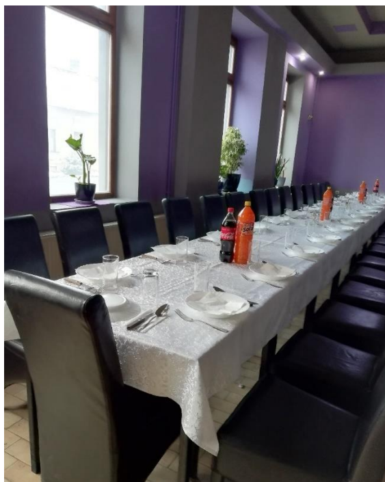
Slika 30a. Stol postavljen za daću u Hrtkovcima. 2019. godine.