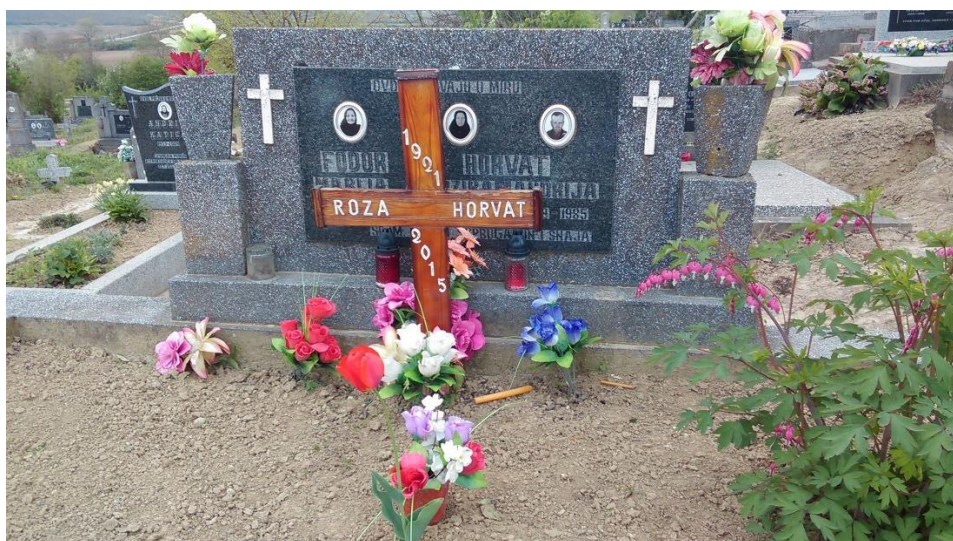
Slika 28a. Katolički nadgrobni spomenik u Sotu. 2017. godine.