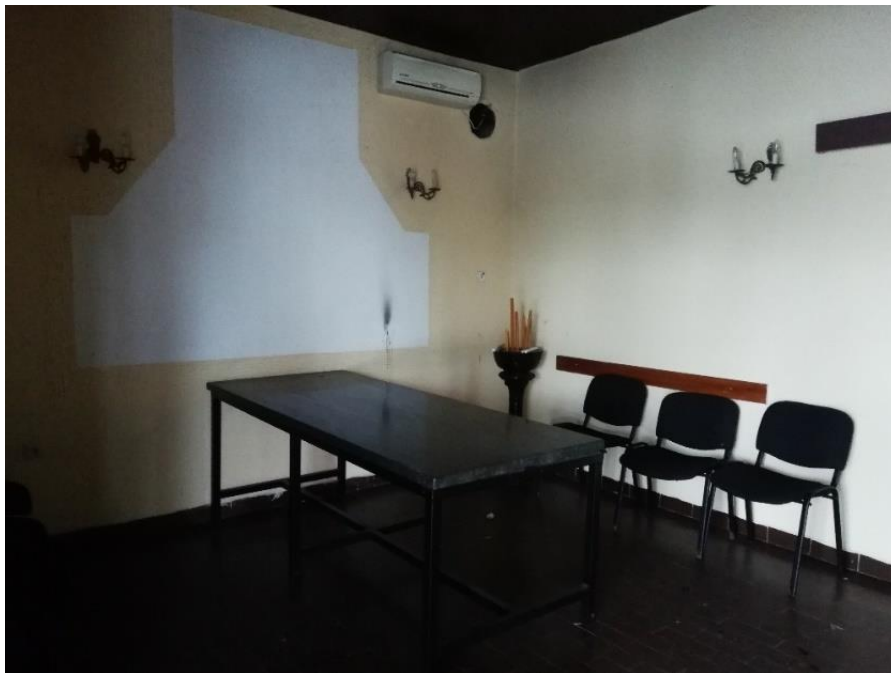
Slika 12c. Unutrašnjost kapele: klupa za sjedenje, svijeća, sveta voda za posvećivanje pokojnika, Hrtkovci. Snimila Sindy Vuković 2019. godine.