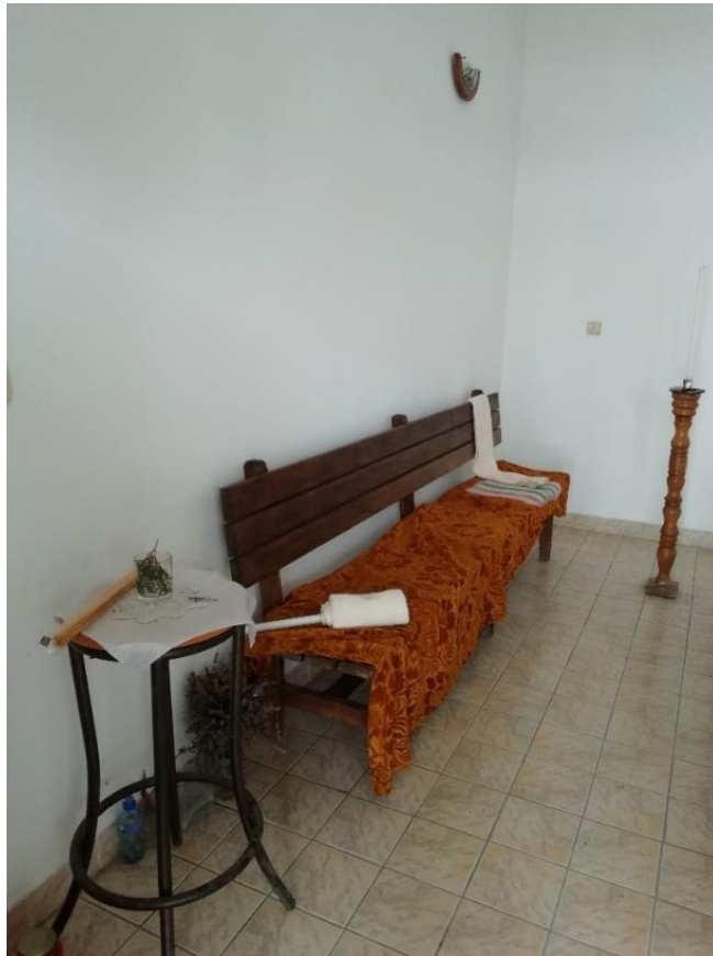
Slika 12b. Unutrašnjost kapele: stol na koji se stavlja lijes, Ruma.