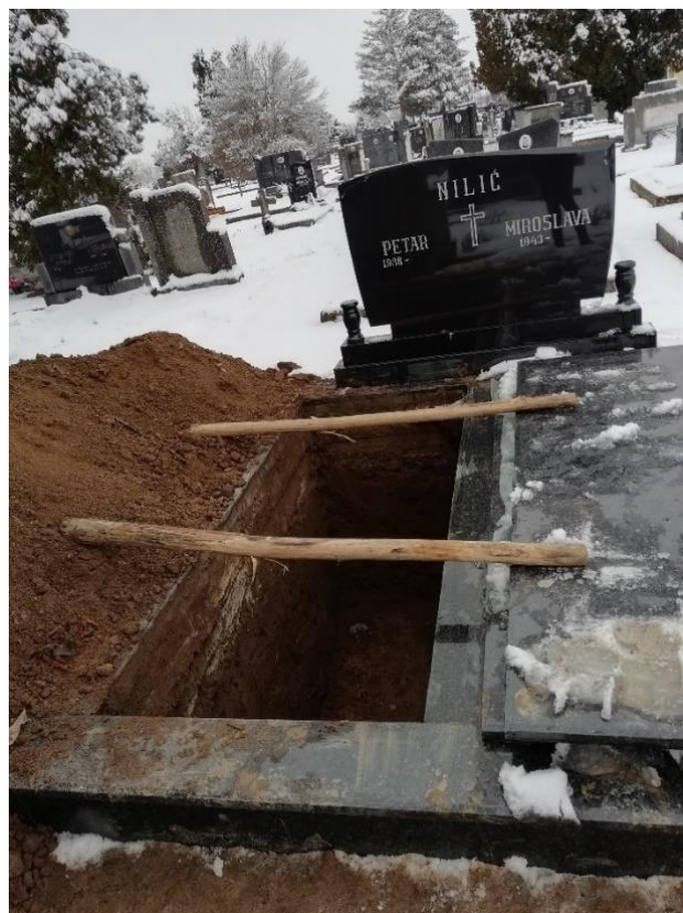
Slika 24. Syježe iskopana raka u Hrtkovcima. Snimila Sindy Vuković 2019. godine.