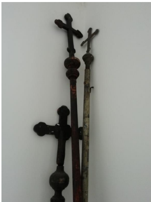
Slika 15b. Crkveni križevi u Hrtkocima. Snimila Sindy Vuković 2019. godine.

U Sotu, Golubincima i Hrtkocima nose se dva crna barjaka na početku povorke (Slika 16). U Sotu obično pokojnikove kume (krsne ili vjenčane) nose barjake, u Golubincima mladići ili djevojke, a u Hrtkocima se na sedenju dogovara tko će ih nositi.