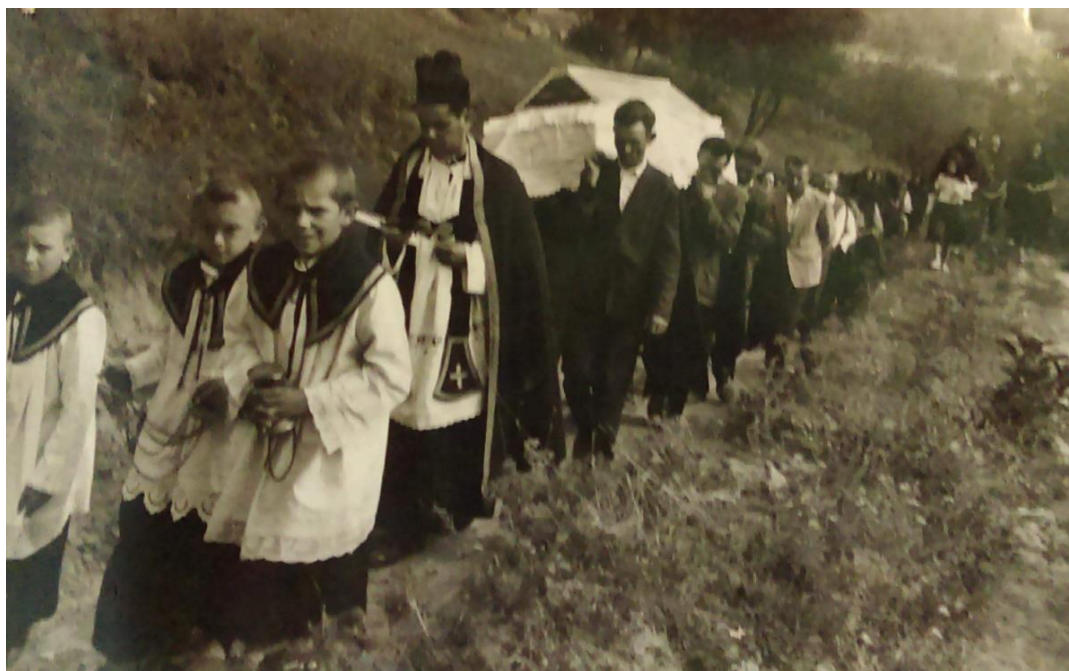
Slika 14a. Pogrebna povorka u Sotu sedamdesetih godina 20. stoljeća.

Zvonimir Kovačević tvrdi se da se i u Rumi prije tridesetak godina koristila pogrebna kočija: „Nekad, dok se išlo kroz Rumu, imali smo kočije neke, to su lepe bile kočije, onako crne, i tu se stavio sanduk, konji su to vukli, i tako je išla sahrana kroz Rumu.“ Redosljed u pogrebnoj povorci razlikuje se od mjesta do mjesta, ali uglavnom su muškarci ti koji idu prije žena u povorci iza lijesa, a svećenik, lijes i najbliža obitelj nalaze se na samom početku povorke (Slika 14a, 14b, 14c).