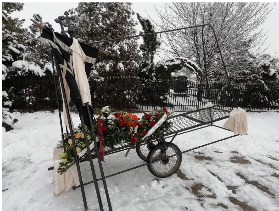
Slika 17. Kolica za cvijeće (na koja su naslonjeni barjaci i vezani peškiri) u Hrtkovcima.

Od cvijeća su na sprovodima najpopularniji karanfili i gerberi. Cvijeće se nekad nosilo u rukama, a danas se prenosi u kolicima (Slika 17). Vijence su u povorci obično nosile dvije žene. Marija Malnar iz Hrtkovaca istaknula je da je prije nekoliko godina na sprovodima svježe cvijeće zamijenilo umjetno (Slika 18).