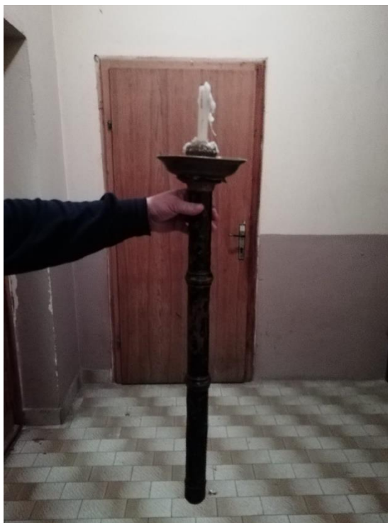
Slika 19. Čirak u Rumi.

U Rumi su uz lijes trojica s jedne i trojica s druge strane, nosila svijeće u čiracima (svijećnjacima) (Slika 19).