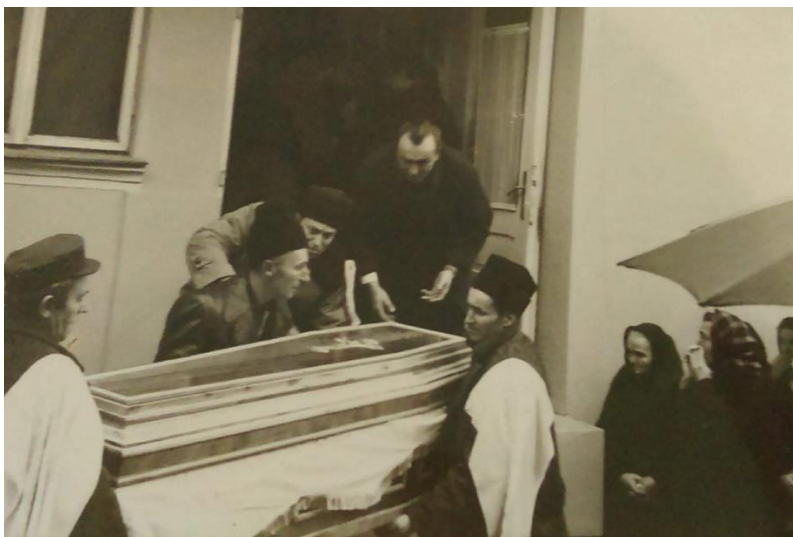
Slika 10. Iznošenje lijesa iz kuće u Sotu sedamdesetih godina 20. stoljeća.