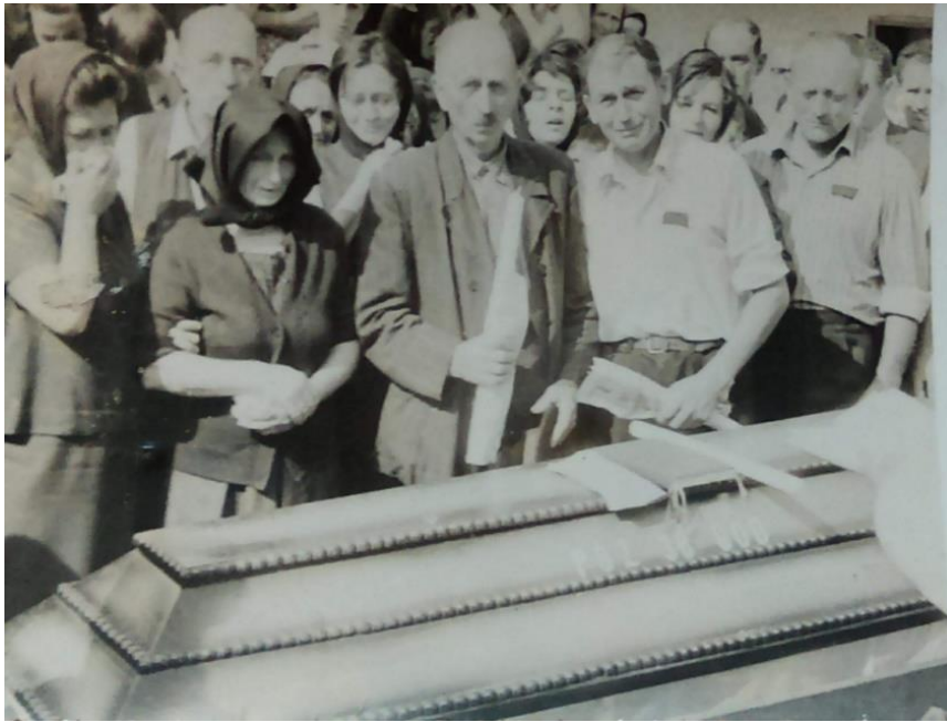
Slika 11. Pogreb u Golubincima devedesetih godina 20. stoljeća.