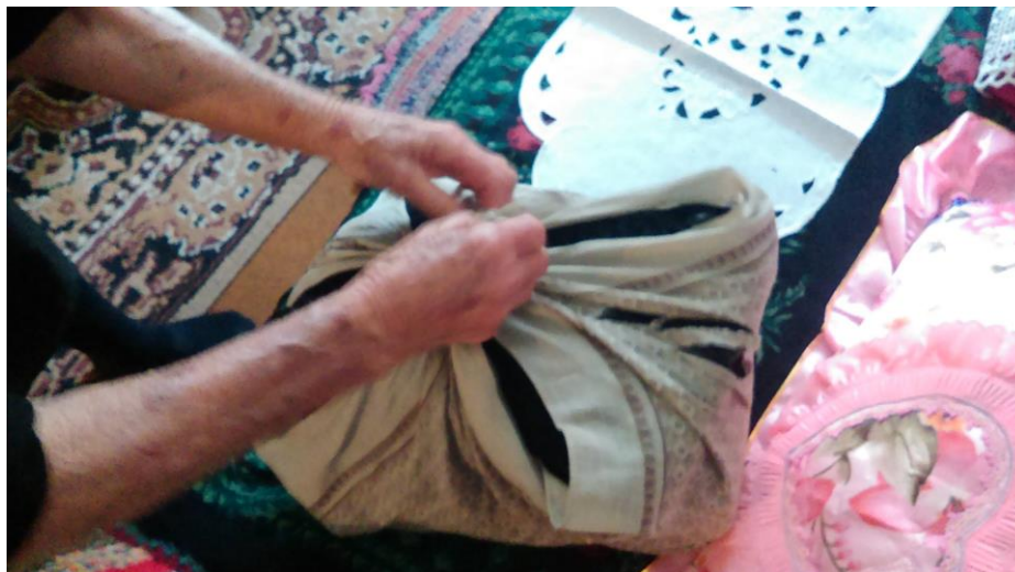
Slika 2a. Odjeća i pribor za ukop Katice Bohnički, Sot. Snimila Sindy Vuković 2017. godine.

ormara u kojem drži odjeću za ukop, nalaze se i peškiri (kupljeni, frotirni) koji će se dijeliti na sprovodu.