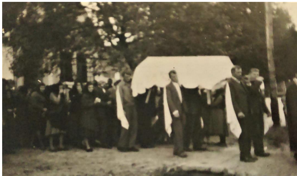
Slika 20a. Peškiri na ramenima sudionika pogrebne povorke u Sotu sedamdesetih godina 20. stoljeća.

U Sotu su i Srijemskoj Mitrovici sudionici pogrebne povorke nekad nosili peškire pričvršćene pribadačama na ramenu (Slika 20a, 20b). Te su se pribadače u Sotu kasnije bacale u raku.