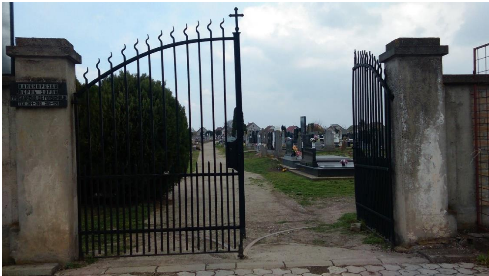
Slika 21. Ulaz u groblje u Golubincima. Snimila Sindy Vuković 2017. godine.

se to prakticalo i koliko često. Danas se to više ne prakticala, jer svećenik to ne prihvaća kao katolički običaj.