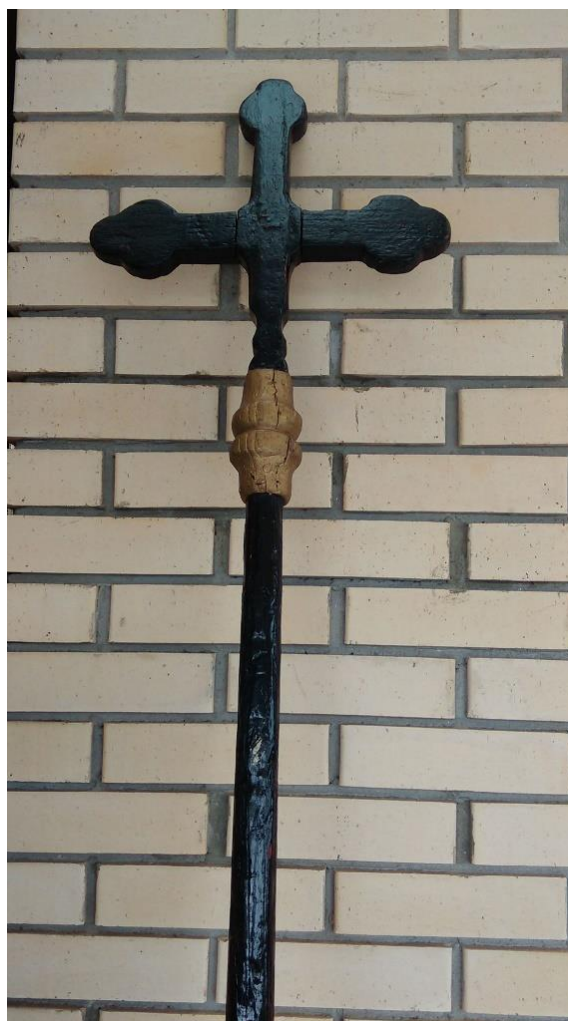
Slika 15a. Popovski krst u Golubincima. 2017. godine.

Na čelu povorke nosi se crkveni križ 22 (Slika 15a, 15b) i pokojnikov križ. Kazimir Peške naglasio je to da su se nekad mali križevi izrađivali od hrastovine i bili kvalitetniji, a danas se izrađuju od topole. Veliki križ u Petrovaradinu nosi svećenik ili njegov pomoćnik, a u Sotu su za nošenje križeva zaduženi pokojnikovi kumovi 23 . U Rumi je običaj da pokojnikov križ nosi unuk pokojnika, na početku povorke. U Hrtkovcima je pokojnikov križ bijele boje u slučaju smrti djeteta ili mlađe osobe.