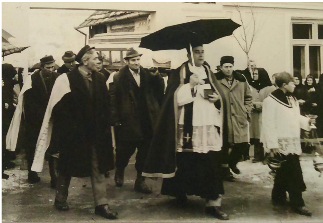
Slika 14b. Pogrebna povorka u Sotu sedamdesetih godina 20. stoljeća.