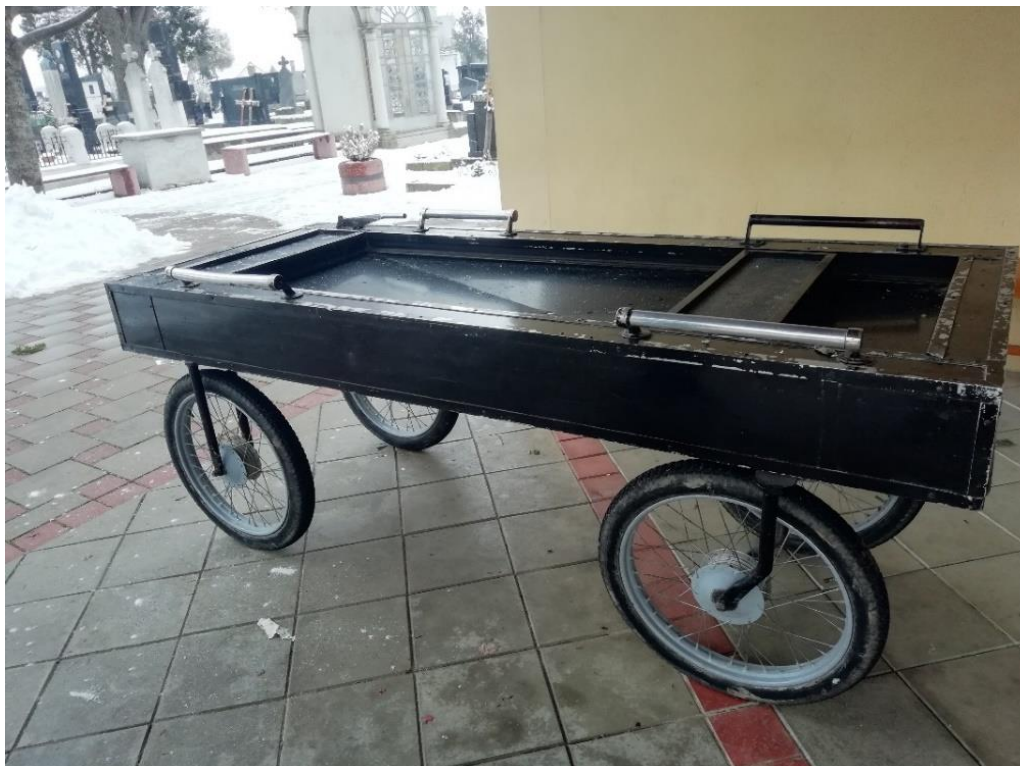
Slika 13c. Pogrebna kolica u Rumi. Snimila Sindy Vuković 2019. godine.