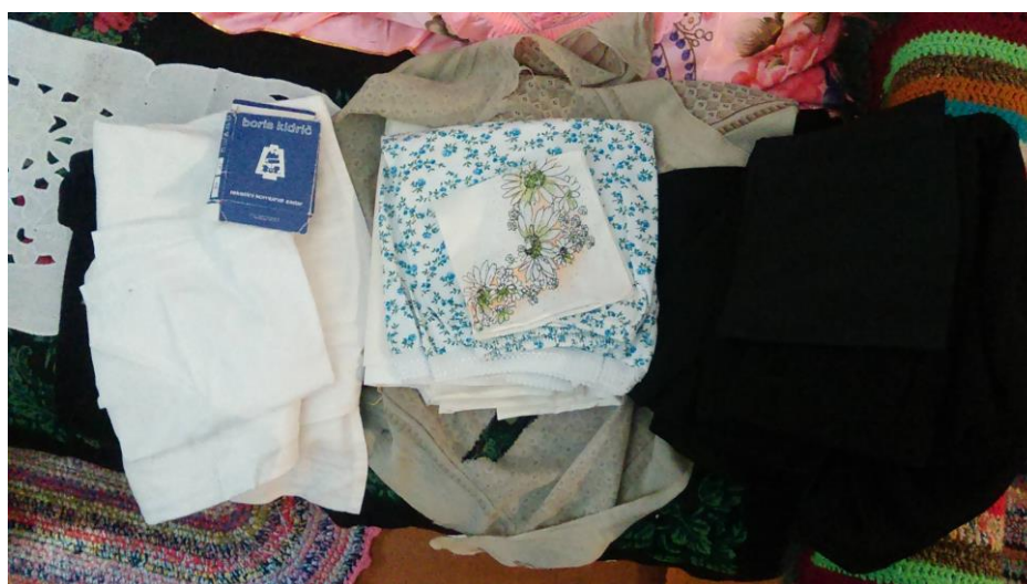
Slika 2b. Odjeća i pribor za ukop Katice Bohnički, Sot. Snimila Sindy Vuković 2017. godine.

Ivan Barat rekao je da se nekad donji pokrov obavezno tkao za života. Taj su pokrov tkale žene i bio je najčešće bijele boje. Čuvao se zajedno s ostalim priborom za ukop u posebnom dijelu ormara. Danas se donji pokrovi više ne izrađuju, već se kupuju u pogrebnom poduzeću. U Golubincima se donji pokrov izrezivao u obliku križa na mjestu gdje je bila pokojnikova glava. U Hrtkocima je donji pokrov bio izrađen od tzv. srpskog platna 10 po koje se samo za tu priliku