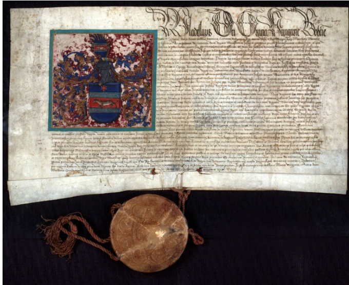
Slika 1: Slavonska grbovnica

se Kraljevina Slavonija prostirala sve do Zemuna, tj. ušća Save u Dunav. 4 Na grbu su, osim kune, starog znamenja plemstva Kraljevine Slavonije, dvije rijeke (Sava i Drava) te Marsova zvijezda, simbol neprestanih ratova koje je Kraljevina Slavonija vodila s Osmanlijama. Kako kralj Vladislav u ispravi navodi, Slavonija je „ predziđe ove naše Kraljevine Ugarske “ ( antemurale huius Regni nostri Hungarie ).