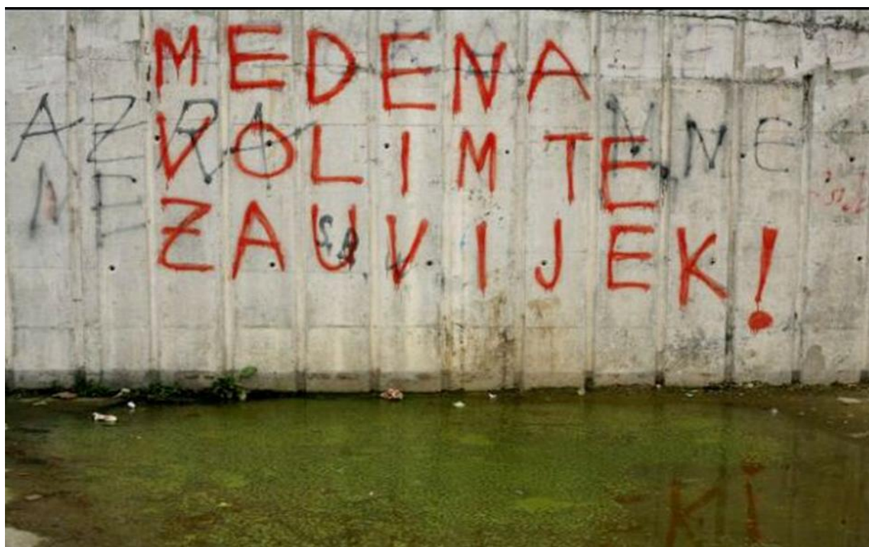
Slika 32. Grafit na Ljubljani - ljubavna poruka