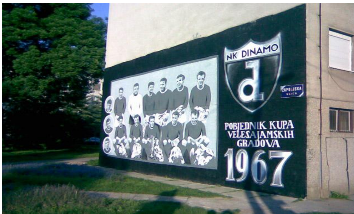
Slika 21. Grafit na Peščenici kojim se slavi veliki uspjeh NK Dinama 1967.g.

Ovo istraživanje je pokazalo da se najviše pišu grafiti sa sportsko-navijačkim sadržajima, što znači da je navijački stil jedan od najpopularnijih subkulturnih stilova u našoj metropoli. U grafitima takvog sadržaja, intenzivno se izražavaju grupni rituali, grupni identitet i osjećaj pripadanja određenoj grupi, ali su u njima najjače izraženi elementi nasilja, kao i kombinacija teritorijalnog i nacionalno-političkog određenja sa navijačkim sadržajima. Kao što je pokazalo i istraživanje grafita u Splitu, u ovoj vrsti grafita „potvrđena je teza o subkulturi kao fenomenu specifičnom za mušku omladinu i obilježenom patrijarhalnim vrijednostima i naznakama maskulinizma.“ (prema: Lalić, Leburić i Bulat, 1991)