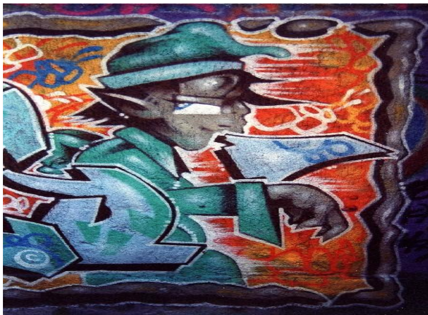
Slika 1. Grafit u Varšavskoj ulici, u samom centru Zagreba

Lalić, Leburić i Bulat (1991:33) zaključuju kako se „spontana aktivnost pisanja grafita odvija izvan strogo ograđenih kanala društveno poželjnog općenja.“ Dakle, grafiti su medij pomoću kojeg mladi ljudi komuniciraju i kao pojedinci, ali i kao pripadnici određenih grupa sa sličnim stilom ponašanja. Treba naglasiti da autori grafita pisanjem po zidu i drugim površinama šalju određeni signal koji stiže do ciljanih objekata komunikacije (grupa kojoj pripadaju, pripadnici šire društvene sredine), ali i nepoznatih primatelja, pa se često događa da primatelji ne razumiju te signale i ne shvaćaju poruke koje grafiti u sebi nose, te su upravo zbog toga mnogi današnji grafiti neprihvaćeni i proglašeni činom vandalizma.