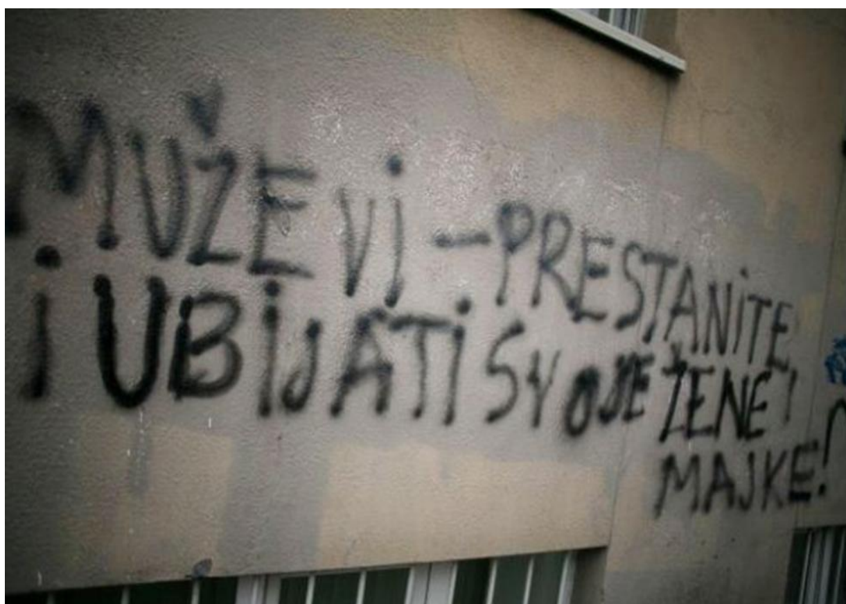
Slika 41. Grafit u Savskoj sa socijalnom tematikom - protiv nasilja nad ženama

Iako najčešće susrećemo šaljive, ironične i neozbiljne crteže i natpise po gradskim zidovima, mladi mogu itekako upozoriti i na neke ozbiljne situacije i probleme u društvu kao što su: nasilje nad ženama, politička nepravda, korupcija i sl. Pojedinaac teži ostaviti trag svoje prisutnosti i individualnosti, ali i komunikacijom prema drugima želi ostvariti sebe kao osobu koja ima pravo na svoje mišljenje o životu. Dakle, grafiti mladima omogućuju da javno kažu kako razmišljaju, a to znači da je glavni motiv autora grafita egzistencijalistički: pisati, postojati i „biti ovdje“.