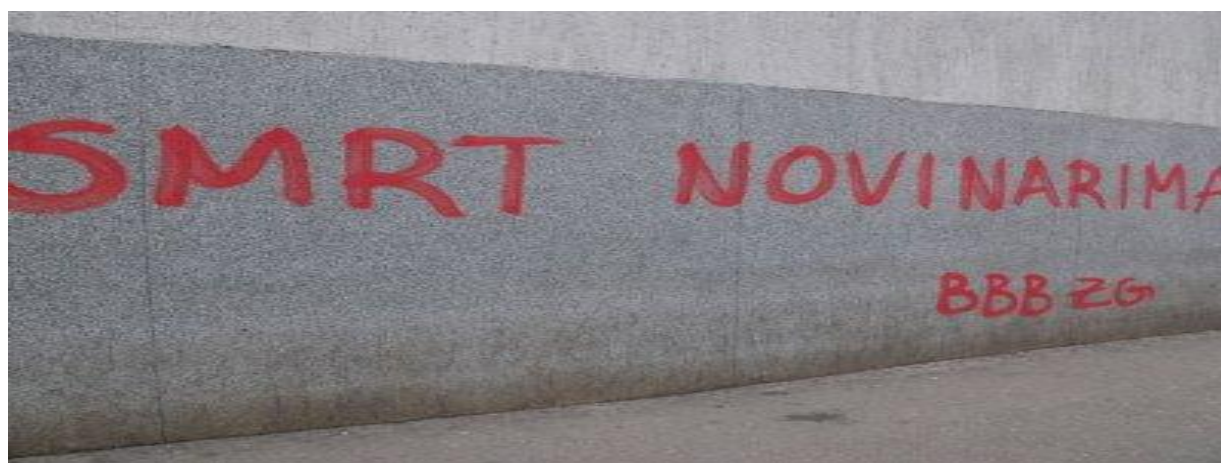
Slika 27. U Zagrebu osvanuli i prijeteći grafiti novinarima od strane navijačke skupine Bad Blue Boys

Grafiti koji nose poruku nasilja i mržnje, te u sebi sadržavaju elemente rasne, nacionalne i vjerske diskriminacije potpuno su suprotni vrijednostima prava, jednakosti i demokracije. Ovakvim načinom interakcije odašilju se uvredljive poruke pripadnicima drugih grupa i naglašava nizak stupanj tolerancije i sloboda pojedinca.