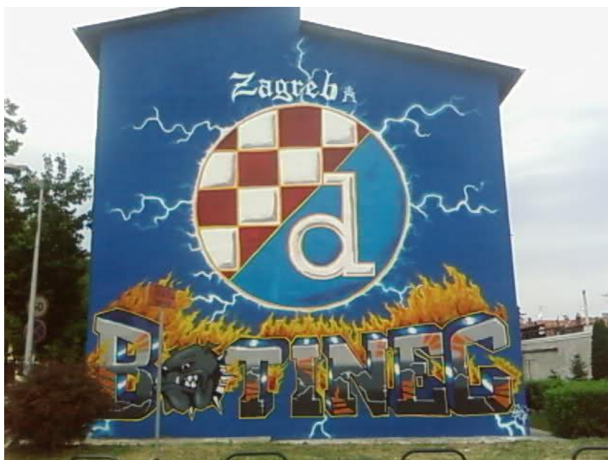
Slika 16. Veliki navijački grafit u zagrebačkom naselju Botinec

Analiza navijačkih natpisa pruža niz pokazatelja o aktivnostima navijača, obilježjima njihovog specifičnog stila ponašanja, te o vrijednostima koje oni poštuju. Uz nazive navijačkih skupina, često se ističu mjesto ili gradska četvrt iz koje dolaze autori grafita, što ukazuje na aktivnost i snagu podružnice navijačkog plemena na određenom teritoriju. Navijački natpisi također svjedoče o diferenciranosti unutar navijačkih grupa. Oni često svjedoče o prkosu prema sredini koja te mlade ljude okružuje.