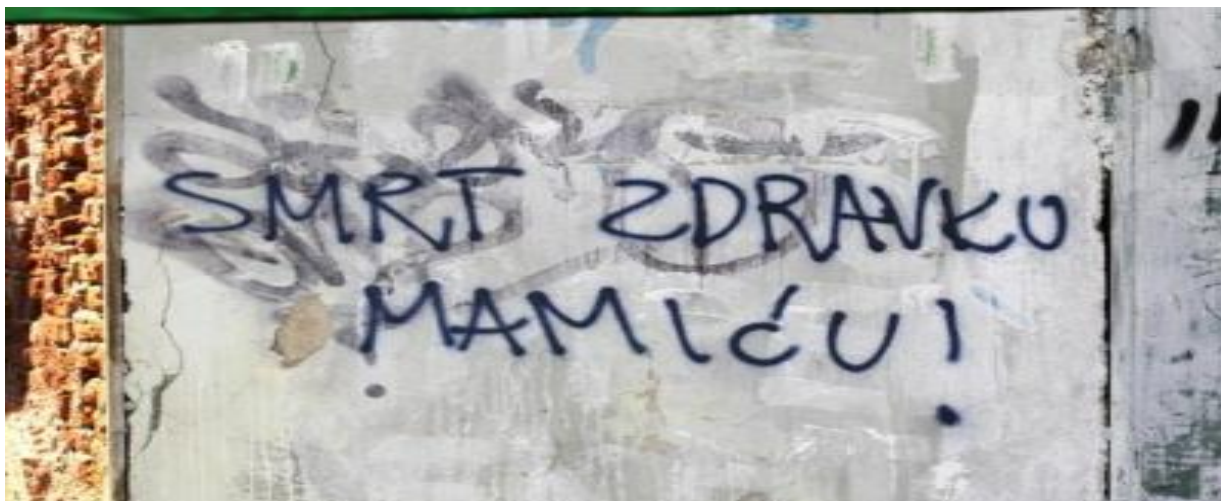
Slika 28. Prijeteći grafit vlasniku sportskog kluba NK Dinamo