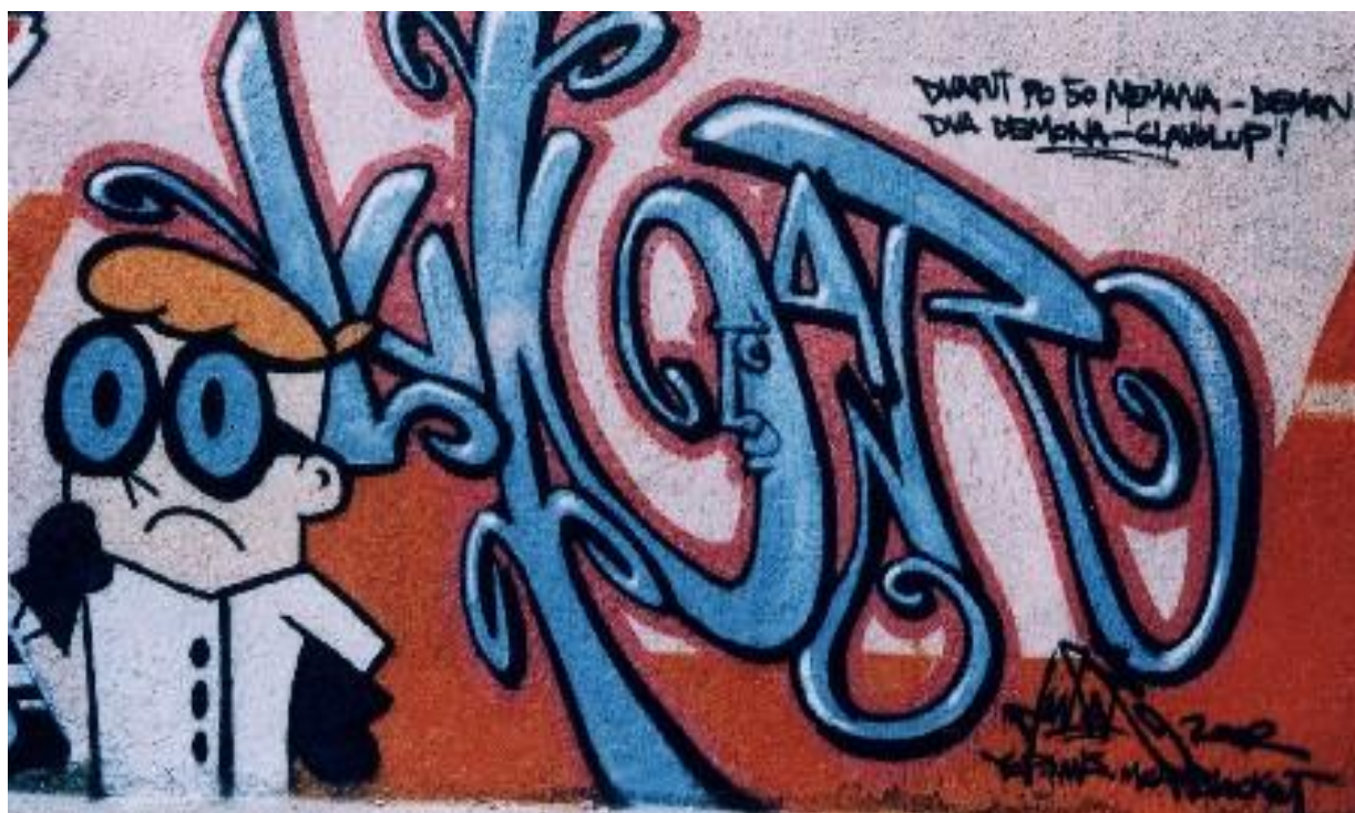
Slika 44. Grafit iz 2000, Črnomerec - Zagreb (Prilaz baruna Filipovića)