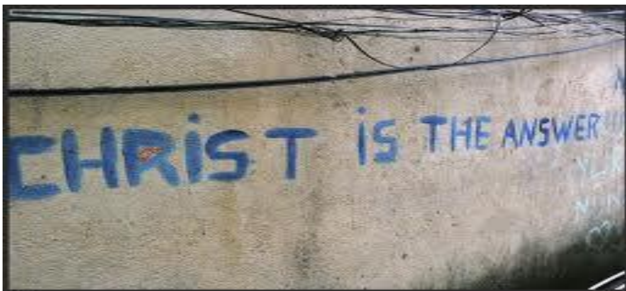
Slika 35. Vjerski grafit u naselju Susedgrad

Prizivanjem svetaca, ispisivanjem vjerskih simbola i asociiranjem na religijske sadržaje u životu mladih ljudi zapravo se potiče oslobađanje nagomilane energije i težnja za ostvarenjem