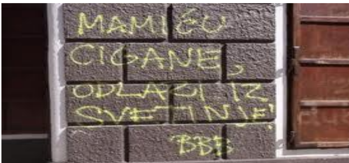
Slika 30. Navijačka skupina Bad Blue Boys grafitom prijeti sportskom direktoru NK Dinamo