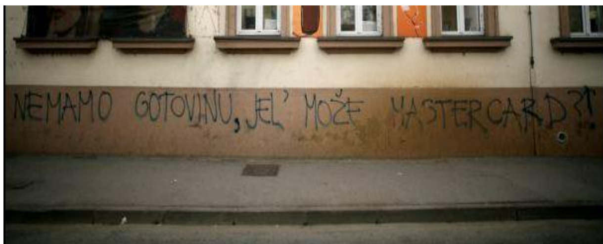
Slika 13. Grafit u Savskoj - posvećen tada odbjegli hrvatskom generalu Gotovini

Političko-ideološki grafiti jedni su od najčešćih grafita koje nalazimo na javnim zgradama i gradskim zidovima, a autori njima žele pokazati svoje duboko razočaranje i nezadovoljstvo društveno-ekonomskim prilikama u kojima žive; oni traže promjene, nove mogućnosti, prihvaćanje različitosti, a to nastoje postići simboličkim kršenjem društvenog reda i isticanju prijezira prema vrijednostima većine. Politički grafiti upućeni su političkim strankama, njihovoj ideologiji, političarima ili cjelokupnoj državi. Mladi smatraju kako imaju pravo reagirati na aktualne političke događaje koji utječu na razvoj društva. Često se politički grafiti vežu uz sadržaj nacije, i to pozitivan odnos prema vlastitoj naciji ili negativan prema pripadnicima drugih nacija.