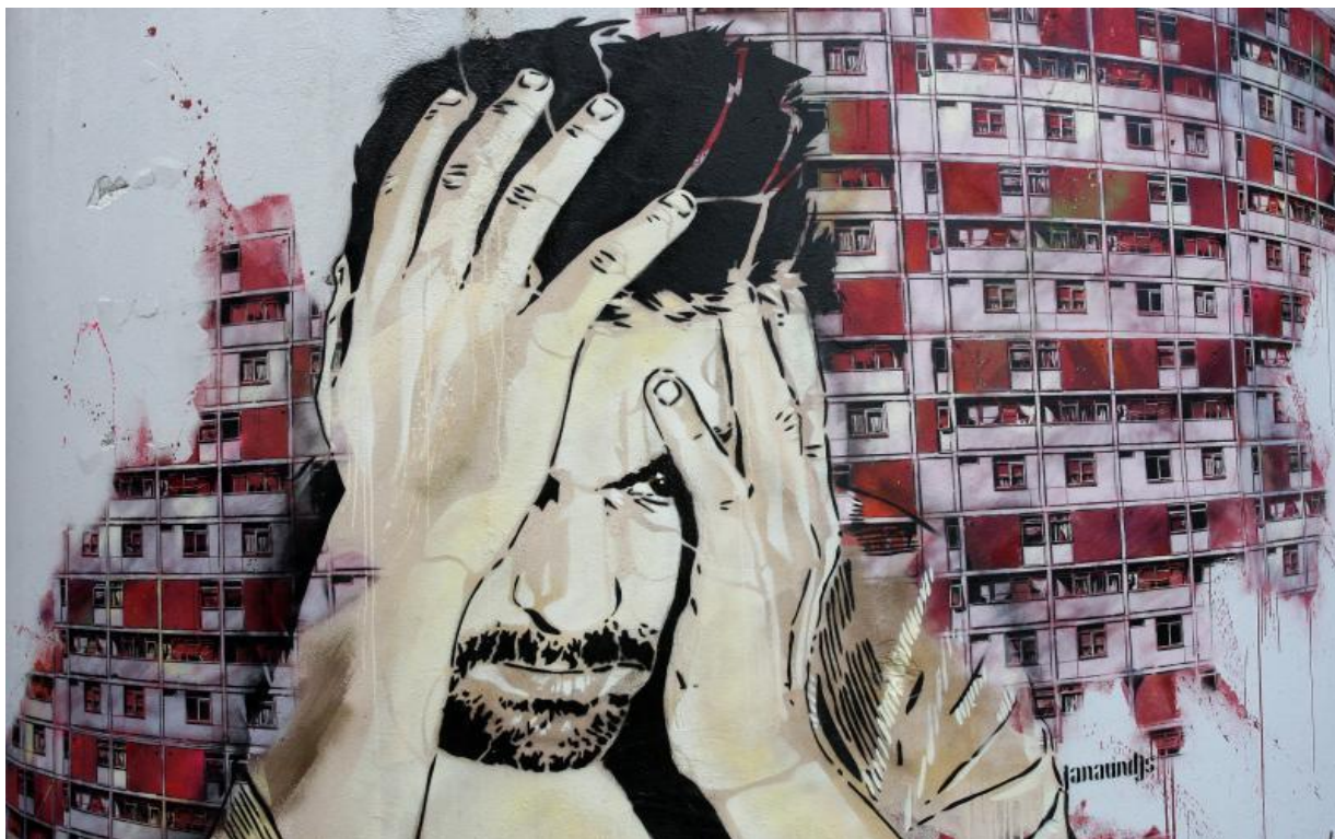
Slika 42. Prikaz psihološkog stanja pojedinca - grafit u zagrebačkim Dugavama