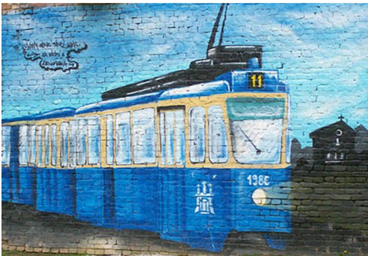
Slika 38. „Plava jedanaestica“ - simbol grada Zagreba