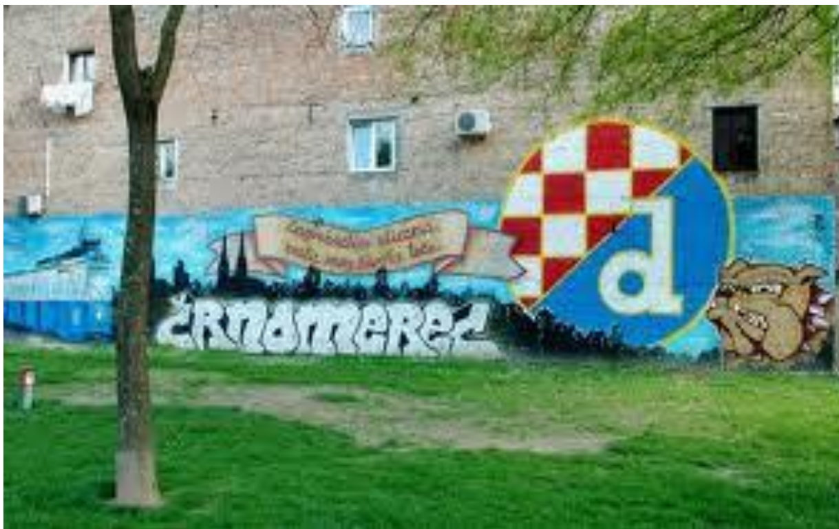
Slika 37. Grafit koji kombinira navijačko-sportske i teritorijalne elemente - crtež navijača nogometnog kluba Dinamo iz zagrebačkog kvarta Črnomerec