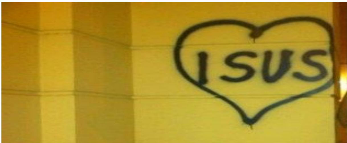
Slika 34. Grafit s religijskim elementima u centru Zagreba

Religijski grafiti proizlaze iz zanimanja za okultnim i natprirodnim, a to su oni natpisi u kojima se javljaju različiti religijski sadržaji: ispisuju se nazivi svetaca, ističu elementi religijskih molitvi, te nazivi vjerskih blagdana ili institucija, slijede općereligijske poruke i crteži religijskih simbola. Postoje i grafiti sa sotonističkim sadržajima ili natpisi antireligijskog karaktera u kojima se izražava neslaganje sa bilo kojom zapadnom religioznom institucijom, te se ističe otpor i pobuna protiv određenih dogmi i vjerskih običaja.