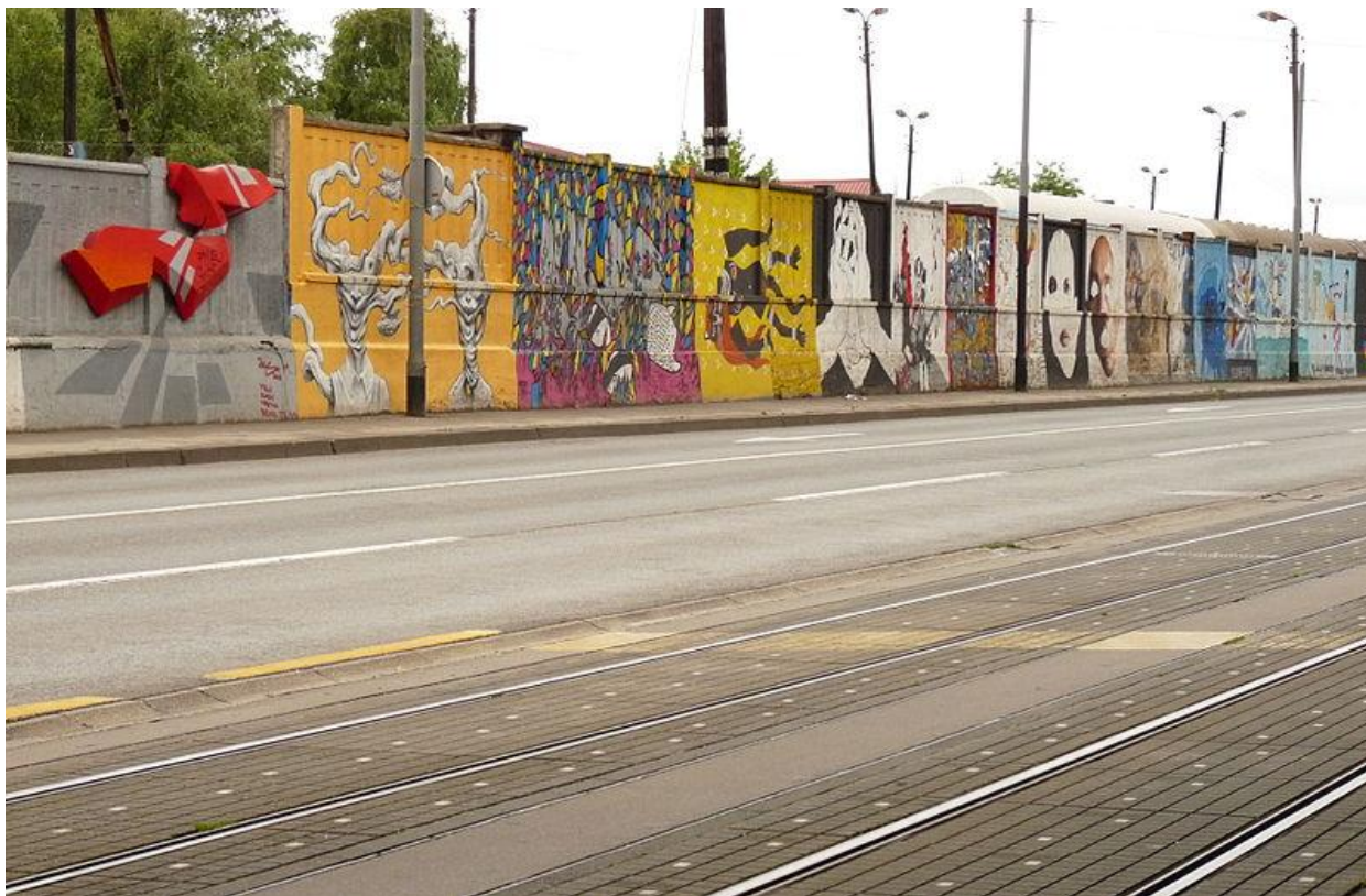
Slika 2. Zid Hrvatskih željeznica u Branimirovoj ulici u Zagrebu dobio je novo ruho, a grafitima su ga oslikali umjetnici čiji su radovi izabrani na natječaju

Riječ je o prvom projektu Muzeja ulične umjetnosti, koji nema određeni prostor, radno vrijeme ni stalne kustose. Ulična umjetnost (street art) nastaje na javnim površinama, predstavlja sve osim klasičnih sprej-grafita, dok su najpopularnije tehnike ispisi, crteži, šablone, naljepnice, plastika, kolaži i instalacije. Svrha projekta bilo je umrežavanje hrvatskih umjetnika, promicanje razvitka i unaprjeđenja kulture i umjetnosti, poticanje kreativnosti, te stvaranje platforme za razmjenu znanja i vještina. Najvažniji zadatak bio je ujediniti domaću scenu umjetnika koji se bave tim likovnim izričajem, distancirati je od vandalskog šaranja gradskih fasada, te popularizirati kvalitetnu urbanu umjetnost koja je u nekim europskim zemljama već dio službene strategije razvoja gradova. ( http://hr.wikipedia.org/wiki/Grafiti )