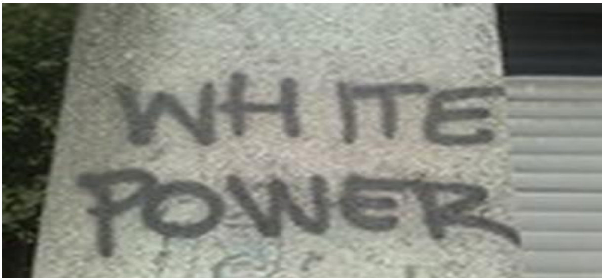
Slika 31. Grafit sa rasističkim sadržajem u Zagrebu