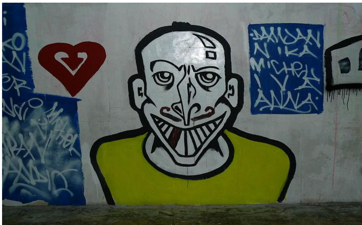
Slika 40. Grafit u pothodniku-Podsused, Zagreb