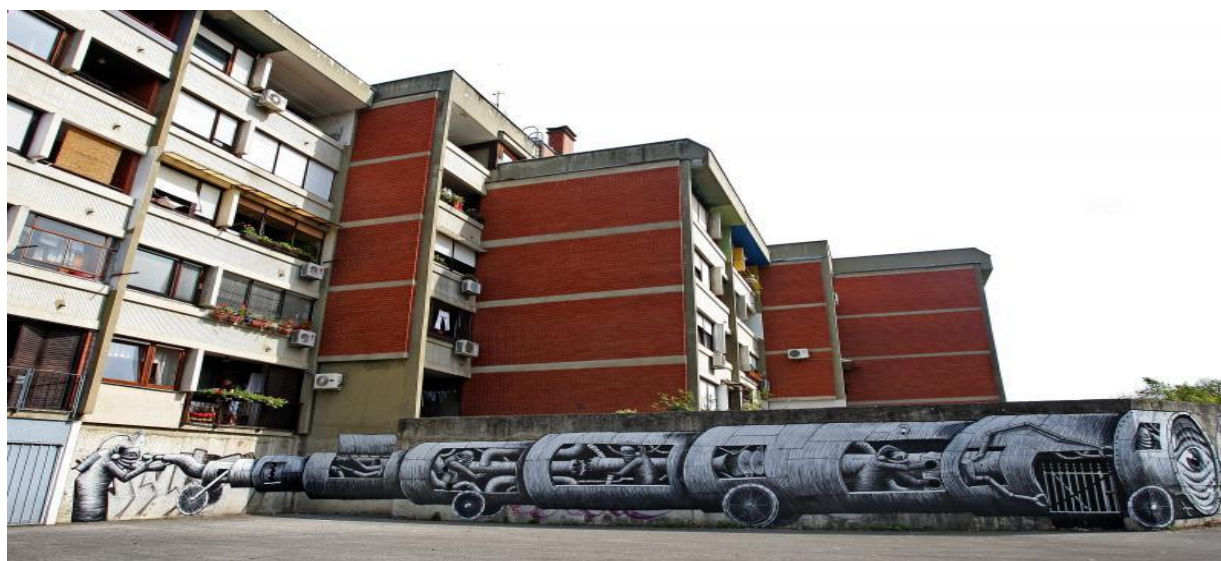
Slika 5. Grafit na zidu pokraj stambenih zgrada u zagrebačkom naselju Dugave

Afirmacijom omladinske kulture (zajedno sa njenim proizvodima i vrijednostima), dolazi i do priznanja grafita kao medija komunikacije i specifičnog oblika ljudskog izražavanja. Grafiti su proizvod subkulturnog bunta, značajni za protest grupa mladih koji imaju slične interese i okupljaju se oko zajedničkih sklonosti prema glazbi, navijanju i sl. Gradske ulice i zidovi tako postaju „simboličko-komunikacijski prostori omladinskih grupa“ koji šalju poruku da postoje i da tragaju za vlastitim identitetom, tj. grafiti postaju pozornica „kulturalnog konflikta“ (Lalić, Leburić i Bulat, 1991:36), ali oni također predstavljaju „osjetljivi barometar promjena u preokupacijama društvenog života.“ (Reisner, 1974:25) Perasović ističe da se može uočiti situacija u kojoj dominantna kultura reagira na subkulturu, „kada se javni aspekt socijalizacije koristi kao kontrola devijacije , kada nastaju prave kampanje i medijske hajke protiv pripadnika subkulture i njihovih stilova tada možemo uočiti ono što engleski sociolozi zovu moral panics ...“ (prema: Perasović, 1991)