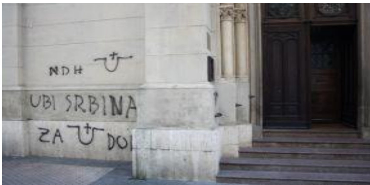
Slika 26. Pravoslavna crkva Sv. Preobraženja Gospodnjeg na Cvjetnom Trgu

U današnje vrijeme, često nailazimo na grafite koji su povezani s nasiljem. Oni imaju funkciju izražavanja grupne različitosti, te ispoljavanje netrepeljivosti prema članovima suparničkih grupa. Grafiti koji sadrže elemente ksenofobije i nacionalizma česti su među pripadnicima navijačkih skupina, a javljaju se i parole vezane uz rat, vojsku, kriminal, te prijetnje različitim subjektima.