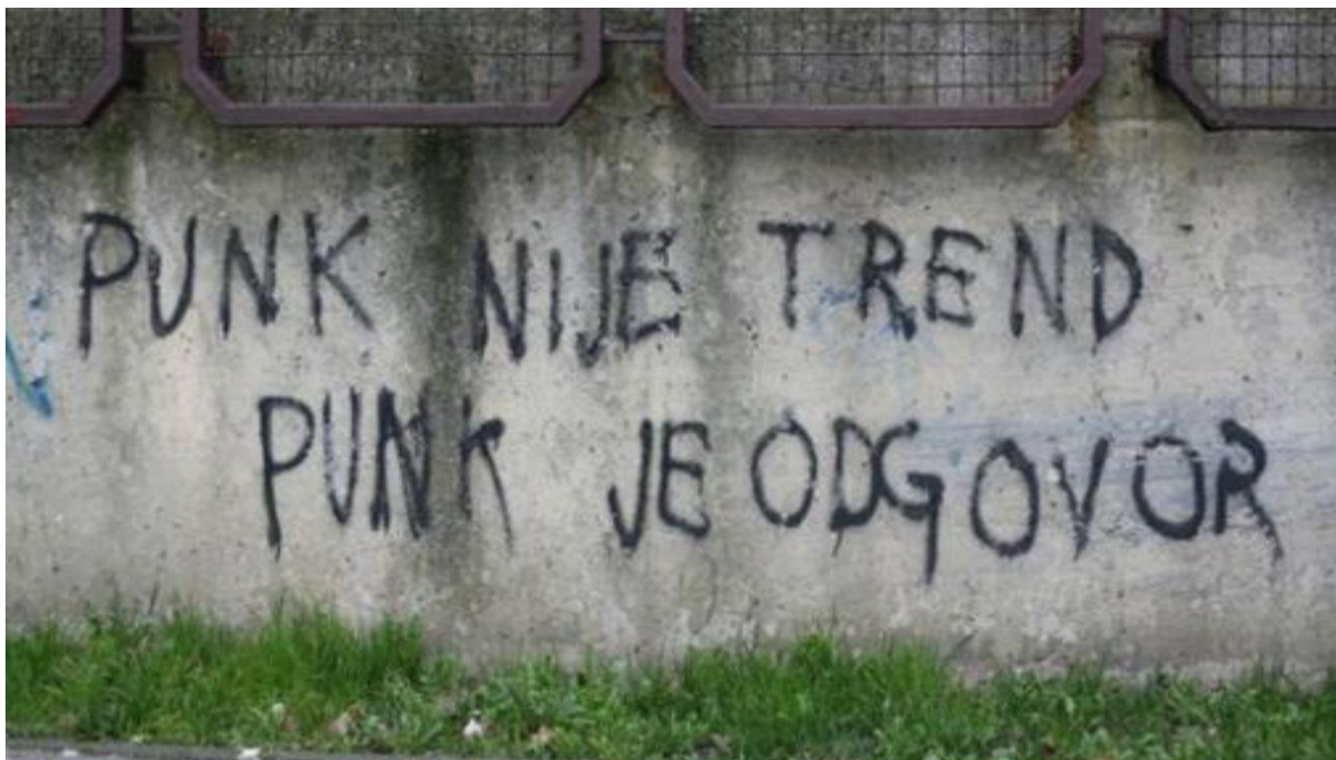
Slika 22. Grafit u Savskoj - „punk kao stil života“