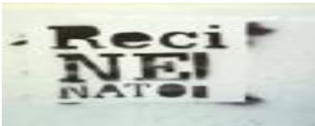
Slika 11. Politički grafit-protiv ulaska Hrvatske u NATO savez