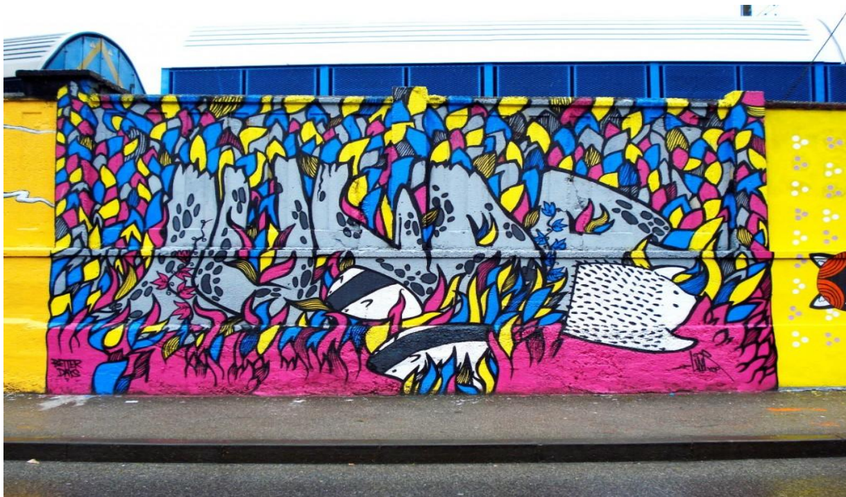
Slika 9. Branimirova ulica u Zagrebu oslikana grafitima neobičnih boja i likova

Autori grafita vjeruju u moć dosjetki i poruka, koriste riječi i stilska sredstva koja obiluju domišljatošću, humorom, nadmudrivanjem i porugama. Sam čin pisanja grafita mladi vide kao samopotvrđivanje svog naraštaja, pobjedu nad zabranama i navikama određenog društva, te mogućnost izgradnje svog identiteta. Stvara se tzv. prkosna alternativna kultura koja se nastoji oduprijeti krizi suvremenoga života i pustoši urbanoga prostora. (prema: Botica, 2001)