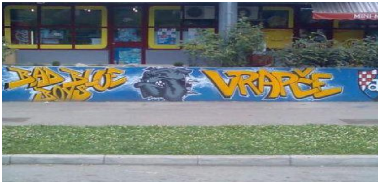
Slika 17. Grafit navijačke skupine Bad Blue Boys u zagrebačkom naselju Vrapče