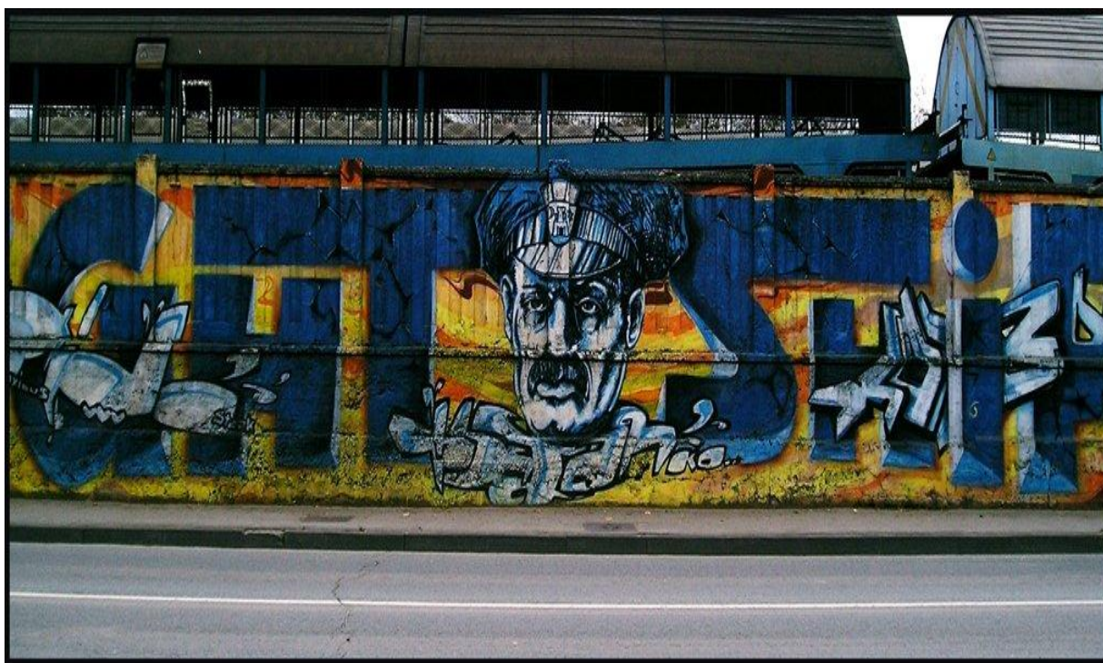
Slika 43. Primjer „humorističnog“ grafita u Zagrebu - Branimirova ulica