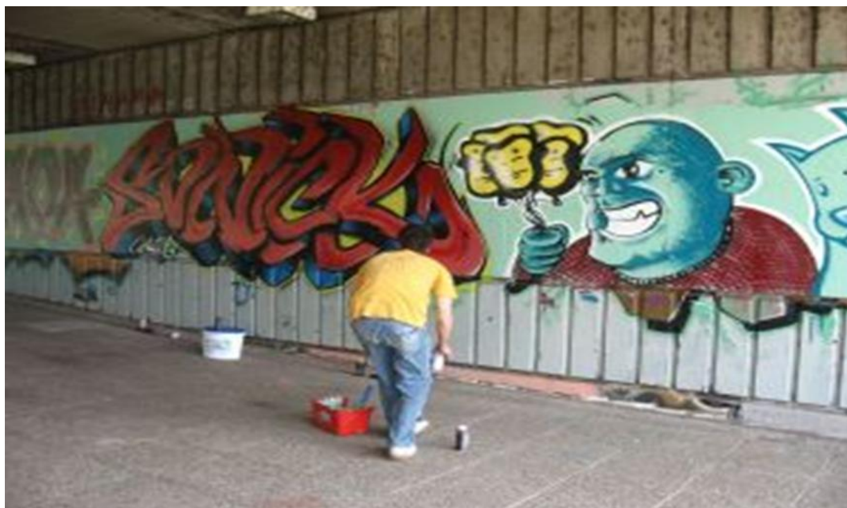
Slika 4. Mladi autor u izradi grafita

Autor grafita bilježi svoju prisutnost, ostavlja trag i upozorava na svoju individualnost, te takvim načinom komunikacije potvrđuje svoj identitet, sasvim drukčiji od onoga koji prevladava u široj društvenoj sredini. Svojom formom i sadržajem identitet predložen na zidovima funkcionira kao oporba prema toj sredini, njenim vrijednostima i ponajviše njenim institucijama.