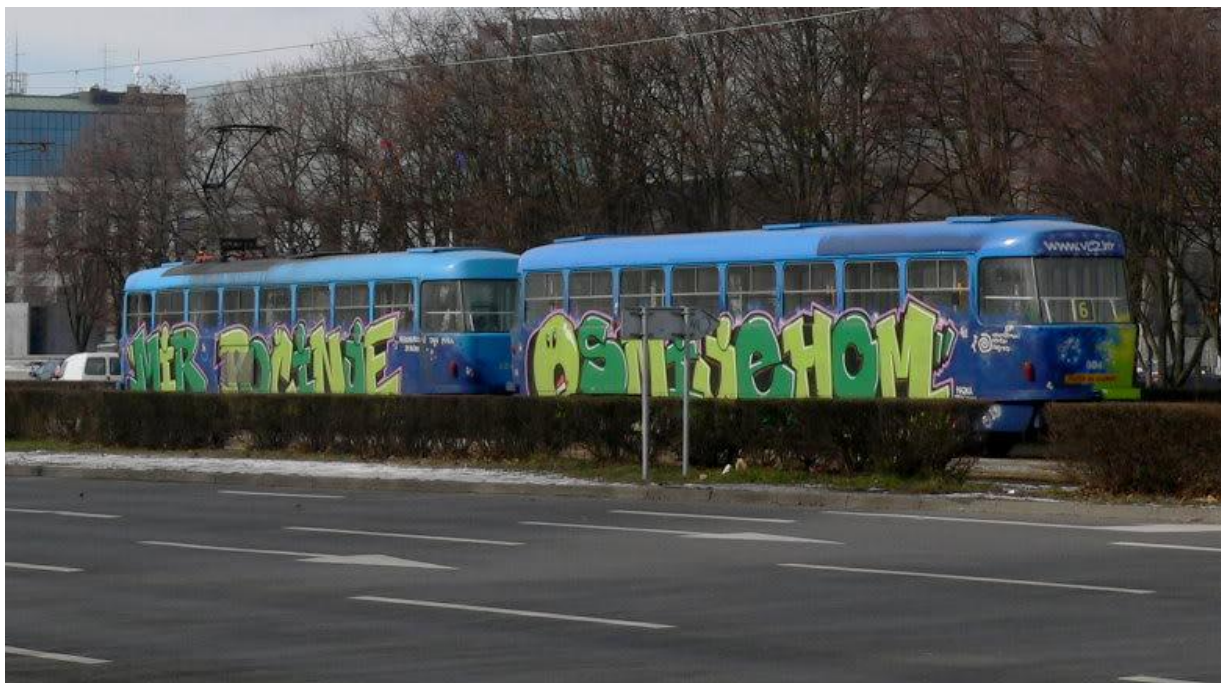
Slika 46. „Mir počinje osmijehom“ - grafitom oslikan zagrebački tramvaj