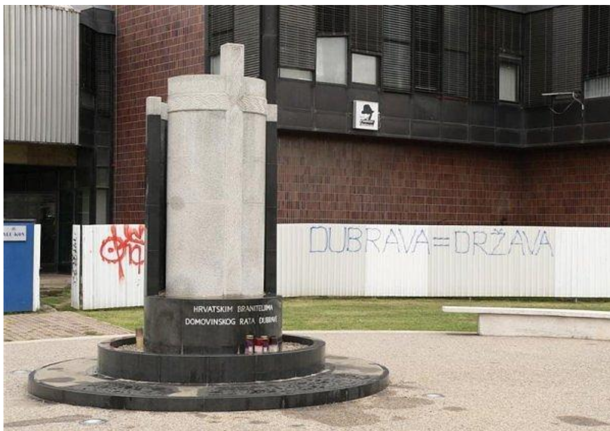
Slika 39. Teritorijalni grafit u zagrebačkom naselju Dubrava pokazuje vrlo izraženu samosvijest zagrebačkih „kvartova“