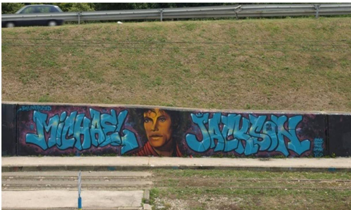
Slika 23. Grafit u Zagrebu posvećen preminulom kralju popa Michaelu Jacksonu

Pisanje grafita vezanih uz glazbu doprinosi afirmiranju različitih glazbenih stilova i stvaranju grupa koje preferiraju slične glazbene interese. Grafiti sa glazbenim sadržajima ujedno predstavljaju i medij za stvaranje identiteta grupe i specifičnog stila ponašanja. Glazba je element koji pomaže subkulturnim skupinama u definiranju sebe kao grupe (glazba kao „medij