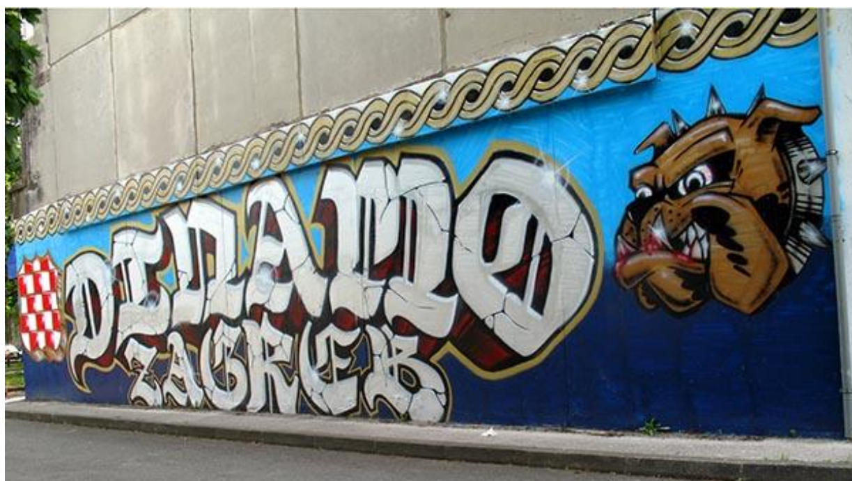
Slika 19. Još jedan navijački grafit u Zagrebu