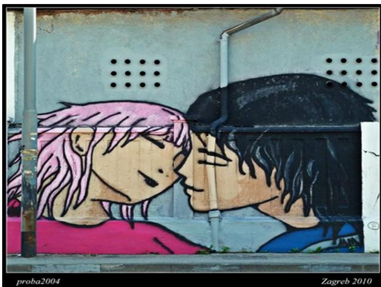
Slika 33. Grafit posvećen „zaljubljenima“, Ulica kneza Branimira, Zagreb