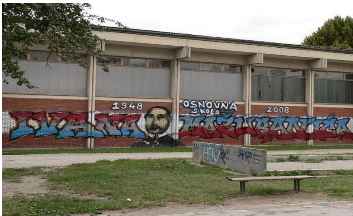
Slika 6. Grafitima oslikana O.Š. Ivana Mažuranića u Zagrebu