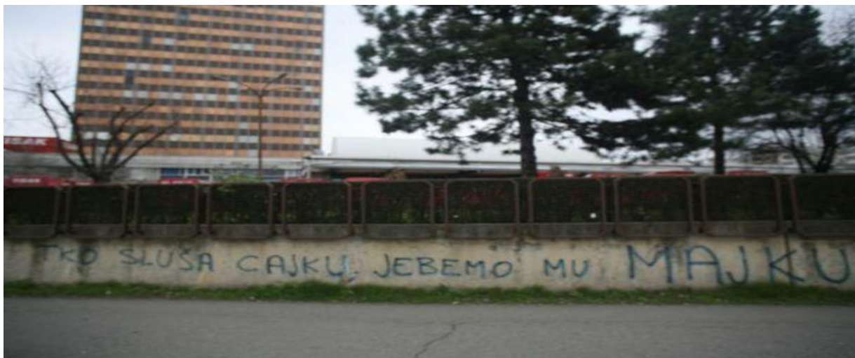
Slika 24. Grafit u Savskoj - neki mladi oštro „prosvjeduju“ protiv tzv. folk glazbe

Glazbene stilove i njihove predstavnike moguće je interpretirati kao simboličke elemente sistema vrijednosti - oni su nositelji bunta, protesta protiv ustaljenih pravila i normi. Mladi nastoje kroz glazbu otkriti svoj identitet, različitost i provokativnost, a ona ujedno prati i usmjerava život subkulturnih grupa. Zvučna kulisa ostaje nezamjenjiva pozadina aktivnosti mladih ljudi, pa tako i autora grafita.