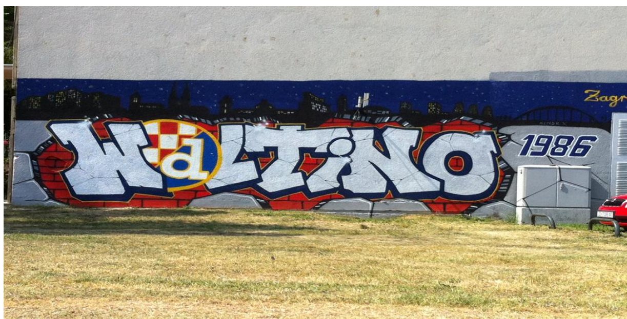
Slika 20. Novonastali navijački grafit u Voltinom naselju