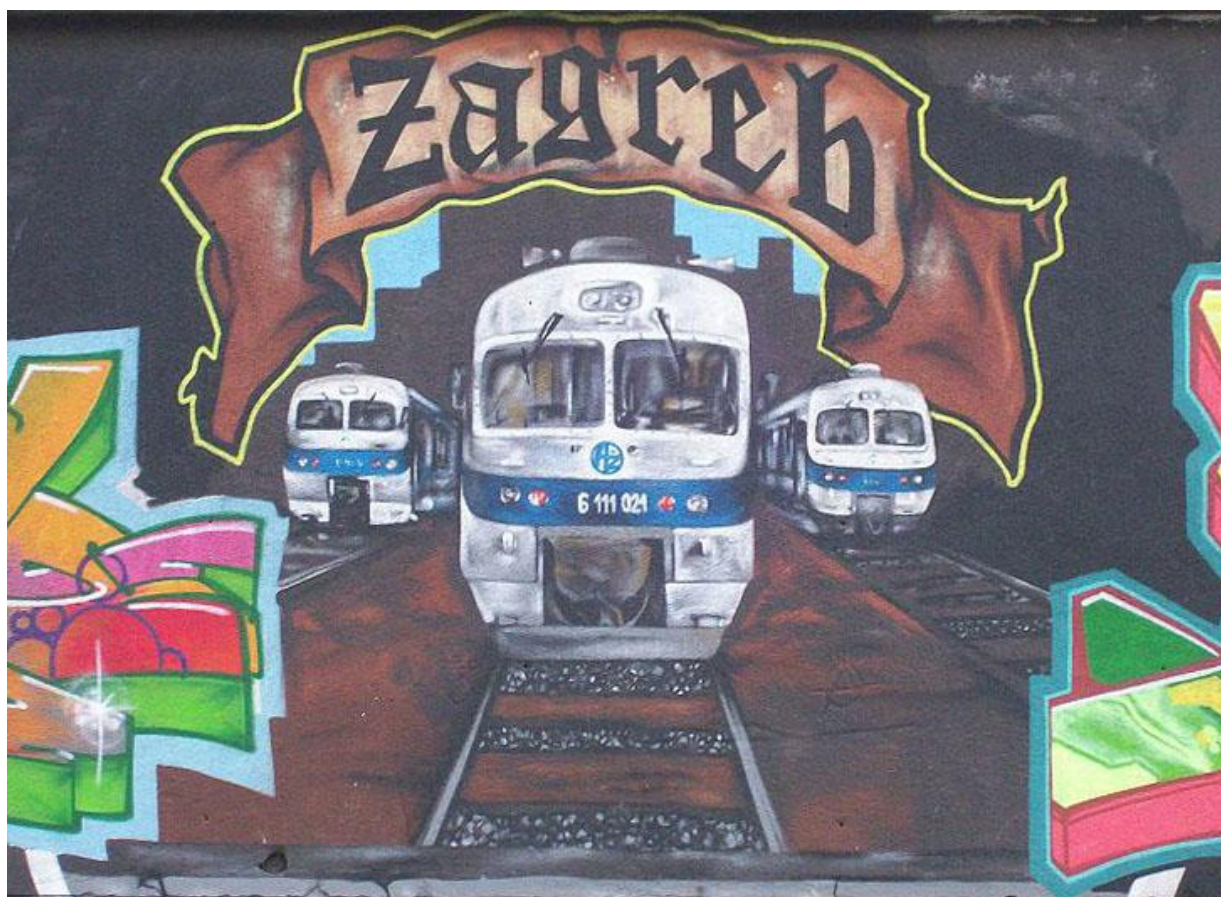
Slika 36. Grafit na Zapadnom kolodvoru posvećen gradu Zagrebu

Grafiti kao neizbježan dio gradskih pročelja, zajedno sa postojećom arhitekturom, uvelike utječu na estetiku grada. Prema tome, gradski su kvartovi dio izražaja skupine i njezino utočište. Dijelovi grada i ulice obilježene su parolama, tekstovima i imenima koja predstavljaju identitet određene grupe ili se iza jednog običnog imena na gradskoj fasadi krije pojedinac koji želi prenijeti poruku i ukazati na svoje postojanje u određenoj sredini koja ga marginalizira ili mu ne ostavlja dovoljno kvalitetnog prostora za djelovanje i donošenje odluka koji se tiču života u cjelokupnom društvu.