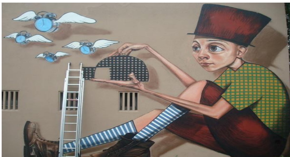
Slika 7. Grafitima oslikano pročelje zgrade Kulturnog centra Peščenica, Zagreb

U današnje vrijeme dolazi do slabljenja specifičnog značenja koje grafiti imaju kao glas otpora, te oni gube dio svojega društvenog angažmana i postaju tzv. nedjelatna riječ/slika, zbog neuspjelih pokušaja da se prostor grafita pripitomi i da se odredi gradski prostor predviđen za grafitiranje.