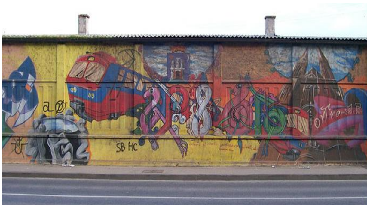
Slika 3. Prikaz grafita u Branimirovoj ulici u Zagrebu - grad omogućio legalan prostor za grafitiranje

S druge strane, „tendencija prema sterilizaciji i elitizaciji gradova, gdje nadzor prostora videokamerama postaje gotovo neizbježan, ujedno uzrokuje i nestajanje grafitne scene u modernom društvu.“ ( http://hr.wikipedia.org/wiki/Grafiti ) Grad Zagreb je prije nekoliko godina formirao Povjerenstvo za utvrđivanje i realizaciju programa mjera za sprječavanje uništavanja fasada zgrada grafitima, kako bi se djelotvorno i sustavno prevladao velik problem s grafitima, posebice u središtu grada. Naime, smatra se kako većina grafita nagrđuje izgled zgrada, te utječu na uređenost četvrti i naselja, stoga nisu poželjni kao dio urbanog identiteta naše metropole, te postoji samo nekoliko lokacija na kojima je ispisivanje grafita dozvoljeno.