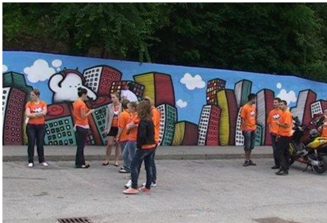
Slika 48 Zid u Ulici Stare Gajnice napokon vrvi vedrima bojama, crtežima i moralnom porukom koja promiče urbanu kulturu

njihove poruke ipak primijete, a grafiti time postaju bitan element u stvaranju novih kanala komunikacije i novih kulturnih vrijednosti. Dakle, ukoliko mladi imaju potrebu reagirati na rastuću nezaposlenost ili problem korupcije u našoj državi, oni će to ispisati na zgradama ili ulicama, te time doprinijeti jačanju svijesti o problemima koji obilježavaju naše društvo. Također, ako su pojedinci nezadovoljni vođenjem ili aktivnostima omiljenog sportskog kluba, oni će izraditi grafite koji će im pomoći da izraze svoje neslaganje i potaknu promjene. Grafiti su njihov glas otpora i promjena, te njihovo oružje u komunikaciji sa društvenim institucijama.