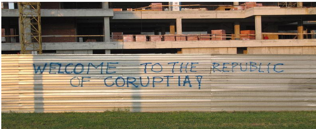
Slika 12. Grafit na jednom od zagrebačkih gradilišta koji ukazuje na raširenost korupcije u našoj državi

Političko-ideološki grafiti jedni su od najčešćih grafita koje nalazimo na javnim zgradama i gradskim zidovima, a autori njima žele pokazati svoje duboko razočaranje i nezadovoljstvo društveno-ekonomskim prilikama u kojima žive; oni traže promjene, nove mogućnosti, prihvaćanje različitosti, a to nastoje postići simboličkim kršenjem društvenog reda i isticanju prijezira prema vrijednostima većine. Politički grafiti upućeni su političkim strankama, njihovoj ideologiji, političarima ili cjelokupnoj državi. Mladi smatraju kako imaju pravo reagirati na aktualne političke događaje koji utječu na razvoj društva. Često se politički grafiti vežu uz sadržaj nacije, i to pozitivan odnos prema vlastitoj naciji ili negativan prema pripadnicima drugih nacija.