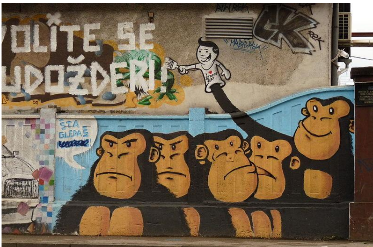
Slika 47. „Volite se ljudožderi“ - noviji grafit u Branimirovoj ulici u Zagrebu