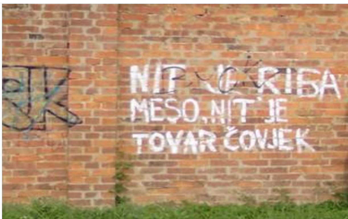
Slika 45. Humoristični grafit u Kranjčevićevoj ulici, Zagreb