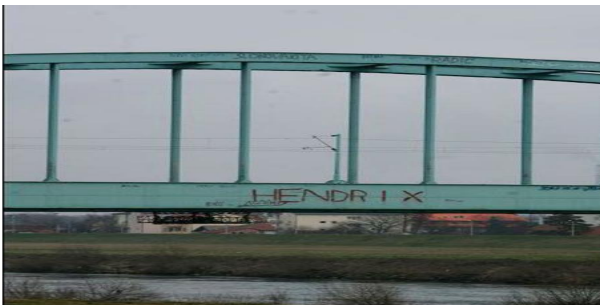
Slika 25. Grafit na Jadranskom mostu posvećen legendarnom rock gitaristu Jimiju Hendrixu