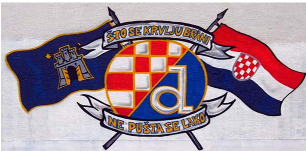
Slika 18. Navijački grafit u Zagrebu posvećen nogometnom klubu Dinamo Zagreb

Grafiti se označavaju kao specifičan »subkulturni izlog« u kojem autori grafita progovaraju svojim jezikom, upozoravaju nas na vrijednost „ekipe“, te postojanje osjećaja pripadnosti. (Lalić, Leburić i Bulat, 1991) U navijačko - sportskim grafitima očituje se kreativan iskaz navijačke odanosti i promiče se specifičan stil ponašanja zasnovan na određenim vrijednostima, ali se istodobno slave uspjesi nekoga sporta i kluba. Postoje četiri grupe ovih grafita: grafiti o igračima i trenerima, grafiti koji se neposredno odnose na sportove i sportska natjecanja, grafiti s tematikom sportskih klubova i grafiti koji se odnose na navijačke grupe i navijače. (Lalić, Leburić i Bulat, 1991)