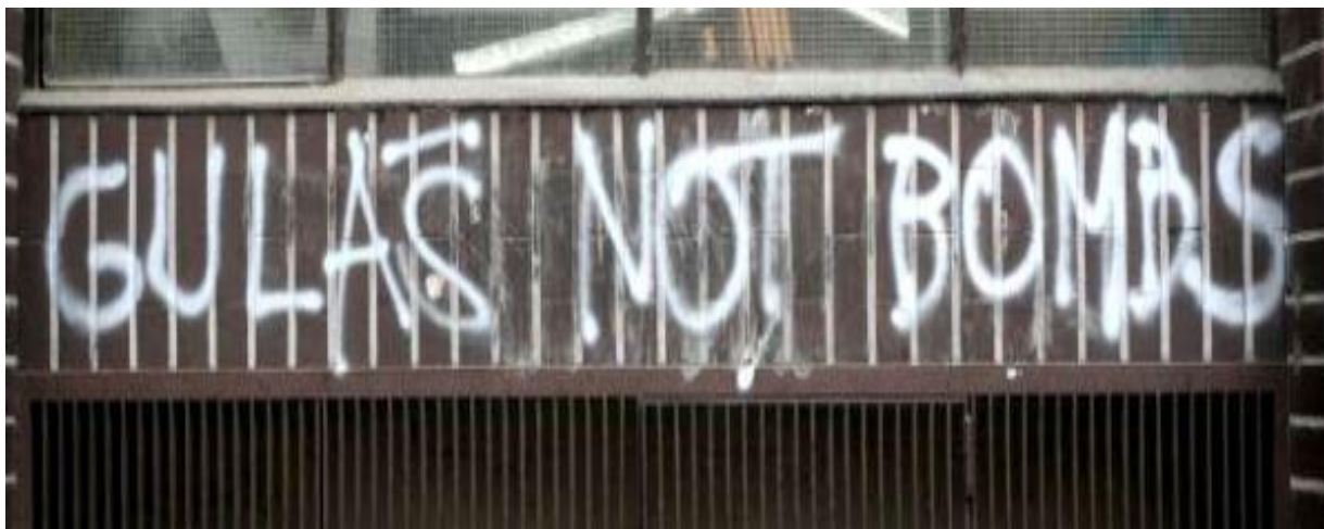
Slika 14. Grafit u Savskoj - antiratna tematika