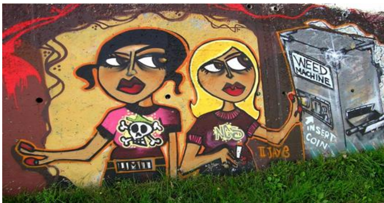
Slika 8. Sadržaj i likovni izraz grafita uvelike doprinose lakšoj komunikaciji autora grafita i njihove društvene sredine

Ispisivanje grafita danas ipak postaje znak specifične kulture i društvenog angažmana. Sami akteri grafitarenja brane vrijednost i „svetost“ svoje djelatnosti, a grafiti postaju svojevrsna ekspresija duha i duševna relaksacija onima koji prkose tehnicizmu, modernizmu, dehumanizmu i urbanizmu. (Botica, 2001) Većina grafita 'rođena' je iz zabave, iz čiste radosti stvaranja, u ugodnim trenucima provedenim među prijateljima. Nastaju u ilegalnom okruženju, ali nose jednostavne i primitivne, šaljive i čudne, političke, ali i intrigantske poruke. U tom smislu, grafiti se predstavljaju kao pokušaj potvrđivanja mladih ljudi koji ne mogu naći mjesto u društvu, kao linija za označavanje područja što ga kontroliraju razne grupe i kao stvaralački eksperiment potencijalnih umjetnika kojima je uskraćena mogućnost uspjeha u društvu.