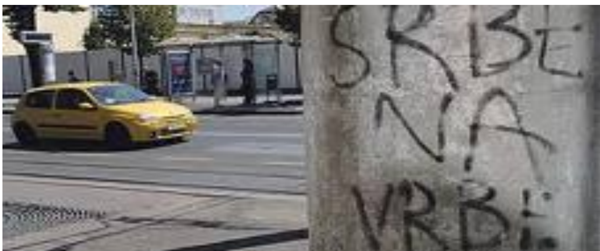
Slika 29. Grafit s elementima nacionalne diskriminacije u Savskoj ulici, Zagreb