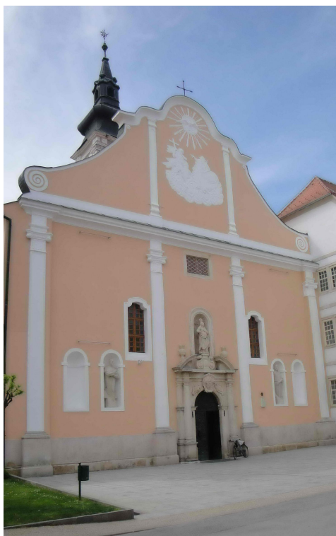
Slika 7. Varaždinska katedrala