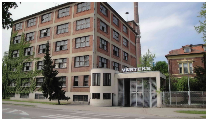
Slika 1. Ulaz u tvornicu „Varteks“ (autor: L. Gotal)

jedan srednjogradski svijet koji se oko njega, i u kojemu se ono, samooblikuje. Za razliku od poduzeća (koje je zamjenjivo), svijet oko i u koje je poduzeće uronjeno nije zamjenjiv“ (Rogić, 1999: 124).