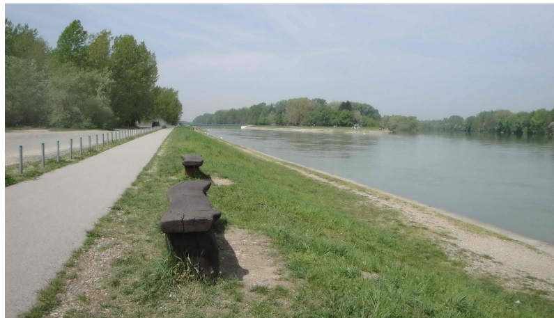
Slika 13. Šetnica uz rijeku Dravu

U športske, ali i rekreacijske svrhe izgrađeni su Gradski bazeni koji uz dva unutarnja i jedan vanjski bazen pružaju mogućnosti korištenja saune, masaža te različitih drugih tretmana i sadržaja. 73 Uz stadion „Sloboda“ nedavno je otvoren TTS Športski centar koji omogućuje bavljenje dvoranskim športovima, a nudi i mogućnost rekreacijskih, rehabilitacijskih i zabavnih sadržaja. 74 Nadalje, prostor uz rijeku Dravu izvor je rekreacijskih sadržaja poput trčanja, šetnje ili vožnje biciklom. Osim toga, nekoliko kilometara od Varaždina nalazi se i Aquacity, tzv. varaždinsko more, koji posjeduje Plavu zastavu, a jezero je stalno mjesto rekreacije i opuštanja, posebno u ljetnim mjesecima. 75