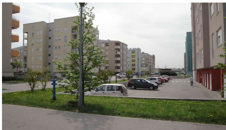
Slika 3. Novoizgrađeno POS naselje (autor: L. Gotal)