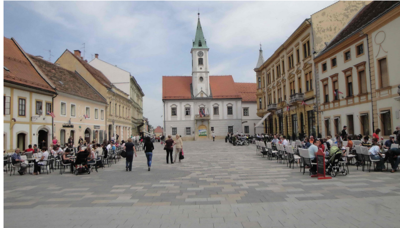
Slika 9. Glavni gradski trg – Korzo