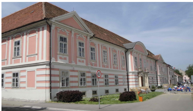
Slika 5. Glazbena škola smještena u palači Erdödy-Patačić (autor: L. Gotal)