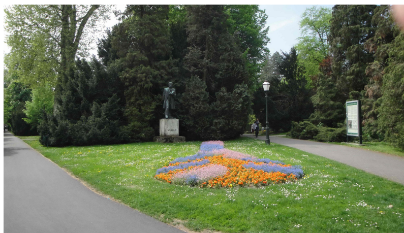
Slika 10. Šetalište Vatroslava Jagića