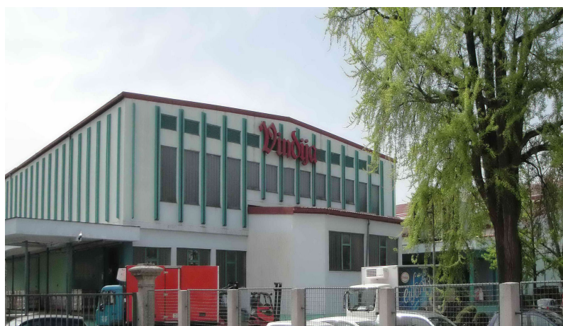
Slika 2. Tvornica „Vindija“

Od ostalih je industrijskih grana potrebno spomenuti obućarsku industriju. Tvornica „VIKO“ (Varaždinska industrija kože i obuće) još je prije 15-ak godina dobro poslovala i zapošljavala preko 5.000 radnika, no danas više ne postoji. Očuvala se jedino kožara i poneki obućarski pogoni (Ruža i Kaštela, 2009). Metalna je industrija u Varaždinu okupljala nekoliko poduzeća od kojih je glavna bila „Ljevaonica i tvornica armatura“, koja je zbog dobre kvalitete dio proizvoda isporučivala brodogradnji (Šimunić, 2009). No, ta je industrija, kao i tekstilna, od 90-ih godina počela bilježiti pad proizvodnje i velike gubitke. Nadalje, poznato graditeljsko poduzeće „Zagorje-Tehnobeton d.d.“ u uvjetima gospodarske krize ostvaruje dobre prihode i rezultate te se pridružuje najboljim graditeljskim poduzećima u