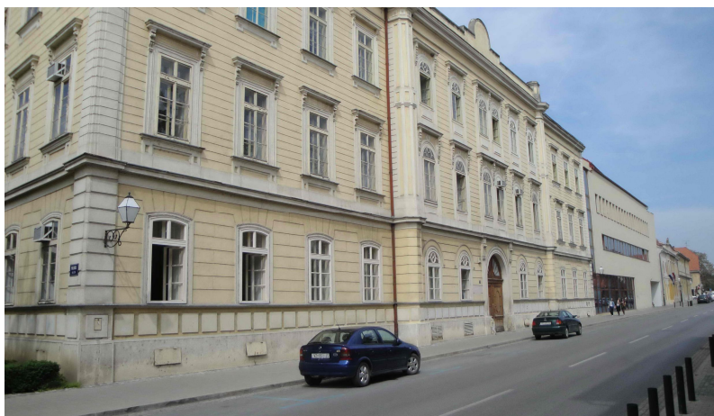
Slika 4. Zgrada Prve gimnazije s nadograđenim novim dijelom (autor: L. Gotal)

godine kao isusovačka gimnazija, osnovana s ciljem slabljenja protureformacijskih ideja. Gimnazija je do 1870. djelovala uz isusovačku crkvu, a tada je premještena u novu zgradu u Preradovićevoj ulici u kojoj djeluje i danas. Škola je uvrštena u zajednicu UNESCO-vih udruženih škola, a nudi programe općeg, jezičnog i prirodoslovno-matematičkog smjera. Od školske godine 2005./06. provodi program međunarodne mature (IB program – International Baccalaureate Diploma Program) te uz zagrebačku XV. gimnaziju postaje prvom školom u Hrvatskoj koja svojim učenicima pruža mogućnost školovanja po tom programu (Ptiček i dr., 2006).