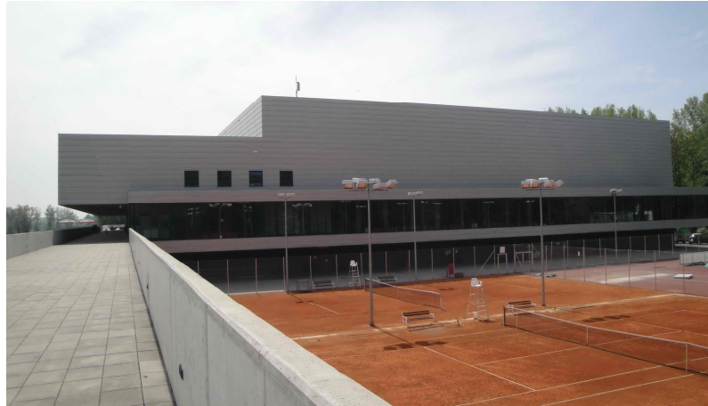
Slika 12. Gradska športska dvorana Varaždin s uređenim teniskim terenima

U športske, ali i rekreacijske svrhe izgrađeni su Gradski bazeni koji uz dva unutarnja i jedan vanjski bazen pružaju mogućnosti korištenja saune, masaža te različitih drugih tretmana i sadržaja. 73 Uz stadion „Sloboda“ nedavno je otvoren TTS Športski centar koji omogućuje bavljenje dvoranskim športovima, a nudi i mogućnost rekreacijskih, rehabilitacijskih i zabavnih sadržaja. 74 Nadalje, prostor uz rijeku Dravu izvor je rekreacijskih sadržaja poput trčanja, šetnje ili vožnje biciklom. Osim toga, nekoliko kilometara od Varaždina nalazi se i Aquacity, tzv. varaždinsko more, koji posjeduje Plavu zastavu, a jezero je stalno mjesto rekreacije i opuštanja, posebno u ljetnim mjesecima. 75