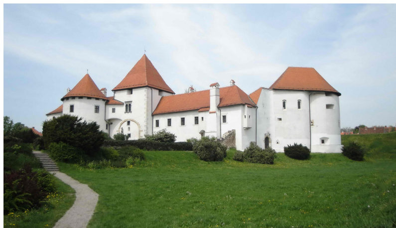
Slika 6. Utvrda Stari grad (autor: L. Gotal)

Zasigurno je jedna od najvažnijih znamenitosti Varaždina feudalna utvrda Stari grad, građena od 14. do 19. stoljeća. Utvrda je oduvijek bila plemićki posjed i tijekom godina vlasništvo mnogih plemićkih obitelji (grofovi Celjski, Juraj Brandenburg, obitelj Erdödy i dr.), a od 1925. godine u vlasništvu je Grada Varaždina. Veliku je važnost imala u obrani protiv Osmanlija u 16. stoljeću kada je pregrađena u renesansnu utvrdu-dvorac okruženu bedemima (tzv. Wasserburg), čiji su ostaci vidljivi još i danas. Uz Stari grad smještena je Lančana kula (Kula stražarnica), izgrađena u drugoj pol. 16. stoljeća u renesansnom stilu te se kao takva održala do danas, a povezuje područje Strossmayerova šetališta (Stari grad s bedemima) sa živopisnim Trgom Miljenka Stančića. 43