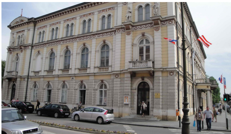
Slika 8. Ulaz u Gradsku knjižnicu i čitaonicu „Metel Ožegović“ u zgradi Hrvatskog narodnog kazališta

čitaonice. Danas ona djeluje na trima gradskim lokacijama: Odjel za odrasle (u dijelu zgrade HNK-a), Odjel za djecu, Odjel za mlade i strane literature (u vili Bedeković) te Ogranak Banfca. Koliku važnost knjižnica ima, pokazuju podaci o broju članova i posudbi knjiga. Tako su se, primjerice, 2007. godine knjižnicom koristile 10.932 osobe, a ukupna je posudba iznosila približno 290.000 knjiga i ostale građe (Kraš, 2009).