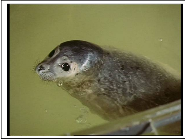
Standfoto 1. Der Seehund

Vor der Präsentation dieser Szene zeigt der Lehrer das Standfoto des Seehundes und fragt die Schüler, ob sie wissen, wie das Tier auf Deutsch heißt.