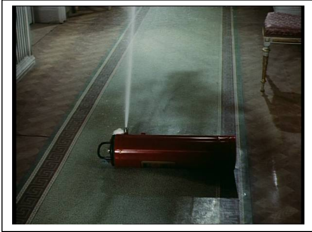
Standfoto 10. Die Feuerlöscherszene (IV)