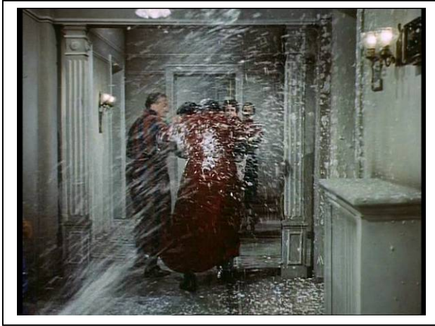
Standfoto 13. Die Feuerlöscherszene (VII)