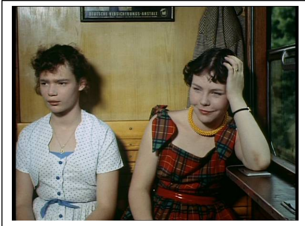
Standfoto 5. Im Zug (3)