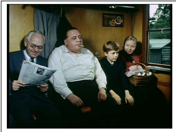
Standfoto 3. Im Zug (1)

Der Lehrer zeigt den Schülern das erste Standfoto Im Zug (1) . Er stellt ihnen die folgenden Fragen: „Wo spielt sich diese Szene ab? Wen könnt ihr auf dem Foto sehen? Was machen die Personen? Wie würdet ihr diese Personen beschreiben (Aussehen, Kleidung)“?