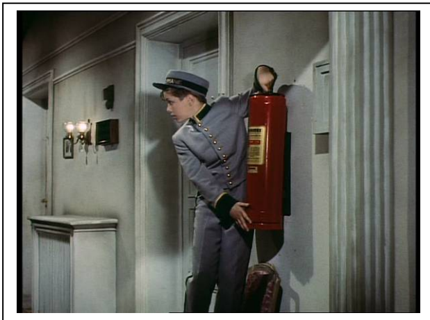
Standfoto 8. Die Feuerlöscherszene (II)