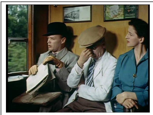
Standfoto 4. Im Zug (2)

In einem Plenumsgespräch einigen sich der Lehrer und die Schüler darüber, wie sie die Personen auf dem Standfoto genau kennzeichnen möchten (z. B. der Mann im weißen Hemd, der Mann im Overall, der alte Mann usw.). Die Ergebnisse dieser Diskussion werden an die Tafel geschrieben. Auf dieselbe Weise geht der Lehrer mit weiteren drei Standfotos vor.