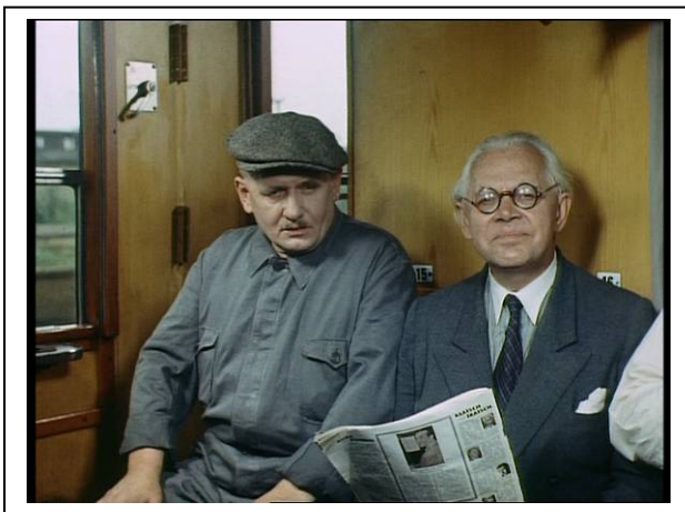
Standfoto 6. Im Zug (4)

Die Schüler bekommen anschließend die Sätze aus dem Gespräch im Zug auf Zetteln. Entweder kann der Lehrer selbst die Sätze vor dem Unterricht ausschneiden oder er kann sogar im Unterricht die Schüler bitten, das zu machen. Die Sätze sollen die Schüler in eine für sie sinnvolle Reihenfolge bringen. Außerdem sollen sie gleichzeitig versuchen, festzustellen, wer was sagt. Der Anfang und das Ende des Gesprächs sind vorgegeben und durch Fettdruck hervorgehoben. Die Reihenfolge der Sätze ist natürlich durcheinander. Während die Schüler die Sätze in die richtige Reihenfolge bringen, sollen sie auch gleichzeitig neben jedem Satz die Person schreiben, die diesen Satz ihrer Meinung nach sagt. Die ganze Unterrichtsaktivität wird deutlicher, wenn man einen Blick auf die folgende Tabelle wirft.