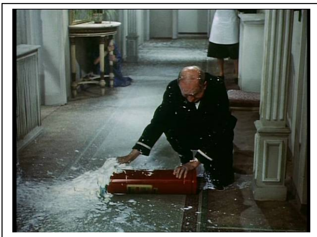
Standfoto 15. Die Feuerlöscherszene (IX)