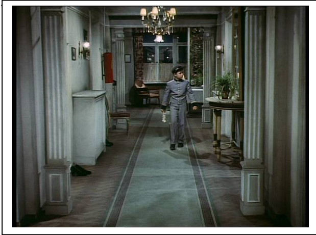
Standfoto 7. Die Feuerlöscherszene (I)