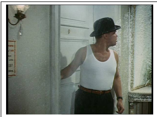
Standfoto 12. Die Feuerlöscherszene (VI)