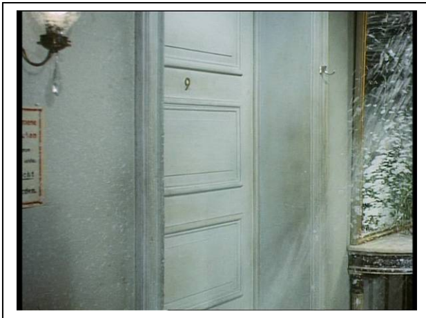
Standfoto 14. Die Feuerlöscherszene (VIII)