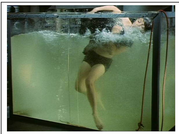
Standfoto 2. Im Aquarium

Es wird festgestellt, dass das Tier auf Deutsch Seehund heißt. Danach fragt der Lehrer: „Was bedeuten die Wörter die See und der Hund auf Kroatisch“? Dabei verfolgt der Lehrer die folgende Absicht: Er möchte, dass die Schüler einsehen, dass man eigentlich nie wortwörtlich übersetzen soll. Zum Ziel der weiteren Vorbereitung auf die Szene stellt der Lehrer die folgenden Fragen: „Wo könnte sich das Tier befinden? Woran kann man das auf dem Standfoto erkennen? Wen oder was könnte es beobachten“? Danach zeigt der Lehrer den Schülern ein weiteres Standfoto.