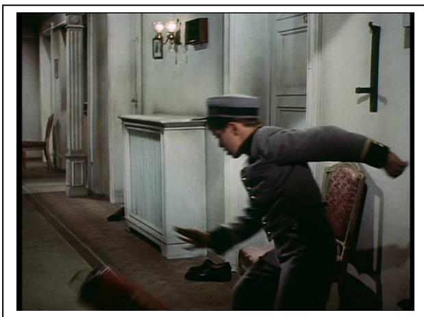
Standfoto 9. Die Feuerlöscherszene (III)