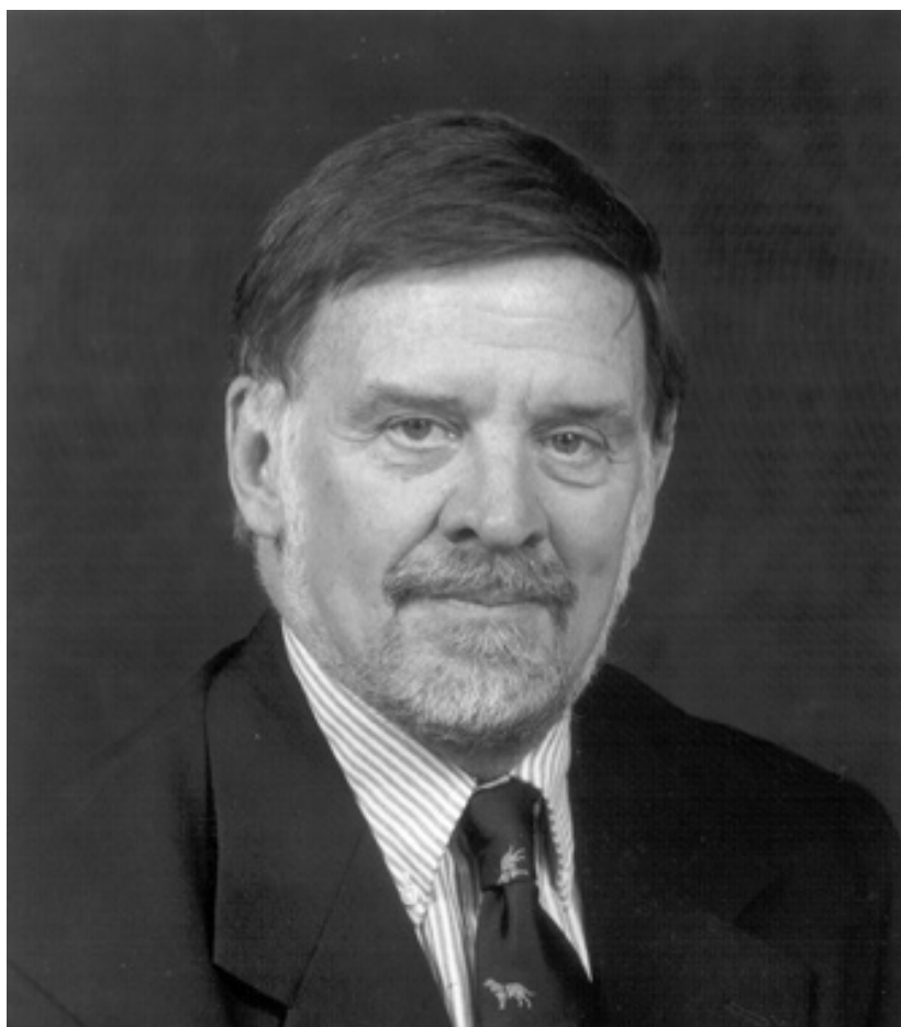
Slika 4 Gary Nash

Zato je Nash smatrao će Nacionalni standardiza američku povijest biti korisni nastavnicima koji žele da njihovi učenici savladaju povijesne sadržaje ali i da usvoje vještine povijesnog mišljenja.