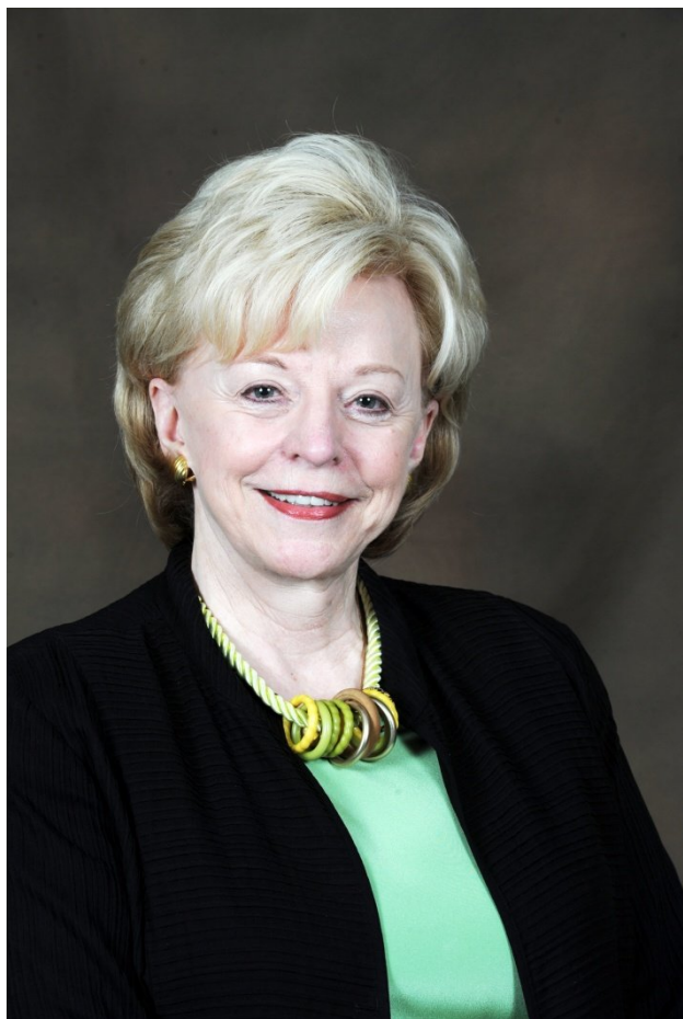
Slika 3. Lynne V. Cheney

Članak dramatičnog naziva „Kraj povijesti“ koji je pokrenuo niz debata o nacionalnim standardima objavljen je 20. listopada 1994. godine u Wall Street Journalu , dva tjedna prije nego što su sami standardi trebali biti objavljeni (na kraju su objavljeni ranije, 26.10., upravo zbog ovog članka). Autorica članka bila je Lynne V. Cheney, bivša urednica časopisa „Washingtonian Magazine“ (od 1983. do 1986. godine) te bivša predsjednica Nacionalne zaklade za humanističke