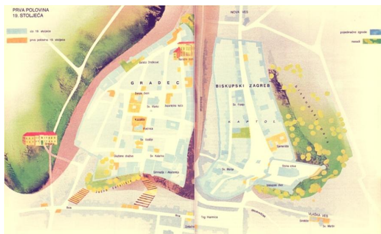
Sl.2. Zagreb u prvoj polovici 19. stoljeća

Ali i Donji se grad vrlo dobro razvija, a sve dobre i danas upotrebljive zgrade grade tadašnji majstori od kojih je najbolji Bartol Felbinger, koji je svojim bezbrojnim djelima preobrazio Zagreb. Da samo spomenem neke u Gornjem gradu; ulazne dveri u Jurjevsko groblje, izgradnja i dogradnja palače Drašković, Friganova kuća na uglu Demetrove i Opatičke (Sl.3.), kuća u Dugoj ulici 32 (danas Radićevoj) kasnije korištena za sastanke pjevačkog društva Kolo , tu je povremeno bila i Gajeva tiskara pa ženska škola, a zatim i Prva hrvatska štedionica, zatim trgovačka kuća u Ilici br.10 te kuća pravoslavne općine i kuća trgovca Hatza iz 1828. (Sl.4.) na Trgu bana Jelačića br.16 koja je početak preobrazbe trga u velegradski trg. Do te kuće Felbinger je sagradio kuću za sebe, dvokatnicu, gdje se do 1826.g. nalazila zgrada klaonice i mesnice. Radio je i za biskupa Alagovića te u biskupskim dvorima, sudjelovao je i kod izgradnje zgrada u Maksimiru, starog kemijskog laboratorija u Novoj Vesi i dijelu do nekadašnje Draškovićeve palače. Uređuje i Ribnjak i pretvara ga u perivoj, 1831.g. gradi crkvicu uz grkokatoličko sjemenište te crkvicu Trpećeg Spasitelja uz staru bolnicu. 1834.g. gradi novo kazalište, ruši ostatak crkve i gradi Dvoranu , 1842.g. uređuje Poštanski ured, a ruše se i stara „Nova vrata“.