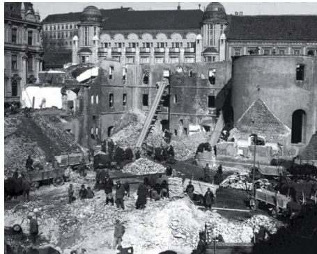
Sl.19. Rušenje zakladne bolnice 1831.g.

1879. godine u Stenjevcu je podignut Zemaljski zavod za umobolne, a od 1893.g. Gradska kužna bolnica postaje Bolnica za zarazne bolesti. 54