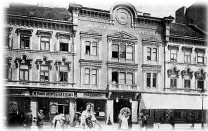
Sl.11. Hotel K caru austrijanskom

Majcen, u kojoj je neko vrijeme bio telegrafski ured. Velika je bila novogradnja zgrade u kojoj je postojao hotel K caru austrijanskom (1867.g.), a koji je pregrađen u trgovačku kuću Kastnera i Oehlera (Sl.11.). Uz tu zgradu nalazio se jednokatni hotel K ugarskoj kruni (danas Nama, Ilica br. 4 i 6), koji je pripadao potkancelaru barunu Jelačiću koji je posjed ostavio polovicu Hrvatskoj, a polovicu Ugarskoj. Mađari su uzeli hotel, a mi kuću na suprotnoj strani i dva kućerka, sve do bolnice milosrdnika, s prostranim zemljištem koje je prodano, te dalo veći dio glavnice za izgradnju novog kazališta. Na starom kazališnom zemljištu vlada je namjeravala podići novo, 1878.g. su napravljene dvije osnove, a vlada je dala izgraditi treću. Zemljište je kupila Prva hrvatska štedionica, 1897.g. porušeni su svi manji objekti i izgrađena je palača po Vancaševim nacrtima. Malo je snimaka iz tog razdoblja koji bi pokazali Ilicu dok je još postojala seoska ograda uz Wernerovu kuću (Ilica br.19). Potkraj ovog razdoblja nadograđena je Stankovićeva kuća u trokatnicu (Sl.12.), kako i danas stoji, malo popravljena (Trg bana Jelačića br.1 i Ilica br.2, nekad gostiona Carski gostioničar ). 39