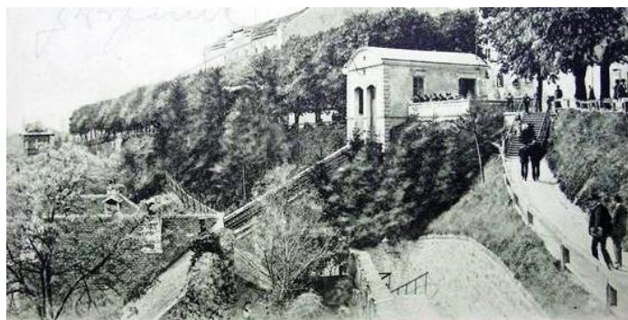
Sl.9. Strossmayerovo šetalište