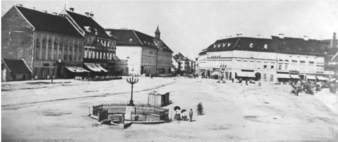
Sl.10. Jelačićev trg 1864.

U razdoblju od 1860.g. do 1880.g. u gradu dolazi do mnogih promjena, posebno onih političkih. Carskim manifestom mijenjaju se uprava i zakonodavstvo. 1860.g. dolazi patent o sazivanju pojačanog carskog vijeća, u to vrijeme ban postaje Šokčević. 1873.g. bansku vlast preuzima Mažuranić. Razdoblje njegove vlasti okarakterizirale su mnogobrojne reforme, uz to je sagrađen i sudbeni stol, ženska kaznionica i Zavod za umobolne u Stenjevcu. 35