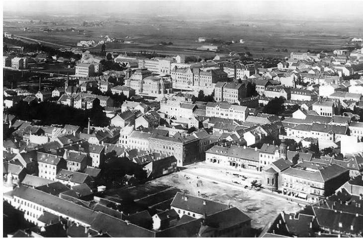
Sl.18. Trg Petra Preradovića 1897.g.

Potkraj 19. stoljeća na području Nove Vesi, od Ribnjaka do Zvijezde nalaze se polja i vrtovi. Gornji grad je nepromijenjen, na Josipovcu je tek dvanaest vila. Donji grad je najzanimljiviji; Obzor 1897.g. gradi svoju zgradu u Marovskoj ulici (danas Masarykova). Ilica je raščišćena. Odstranjene su kuće na Preradovićevom trgu. Priprema se gradnja nove palače Prve hrvatske štedionice. Kada je zgrada dovršena, izgrađena je i okolica; Bogovićeve ulice i Ulice baruna Jelačića. Ilica se mijenja, Ilički trg je dovršen. Radi se na izgradnji Akademskog trga (danas Strossmayerov trg) i Trga Franje Josipa (Trg kralja Tomislava) koji će do 1900.g. biti dovršen. Uz Starčevićev dom niču počeci Mihanovićeve ulice. Izgrađuje se i Svačićev trg te se i tu grad primiče pruge koja koči razvoj grada na jug. Pomišlja se na izgradnju podvožnjaka na Miramarskoj cesti. 51