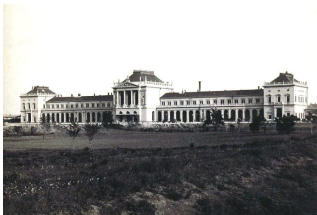
Sl.17. Zgrada zagrebačkog Glavnoga kolodvora

1890.g. promet se znatno povećao u odnosu na 1860. godinu, a broj stanovnika porastao je na 38 tisuća. Tada se morao pristupiti gradnji novog kolodvora državnih željeznica, gradnja je počela 1890. i završila je 1892. godine (Sl.17.). Kolodvor je ubrzo smatran zaprekom za razvitak prema Savi, kako prirodni razvoj i zahtjeva iako se onda udaljenost činila i prevelikom, no oni dalekovidniji pa i Ante Starčević, tražili su da se kolodvor sagradi kilometar južnije. Započela je i gradnja novog željezničkog mosta preko Save, umjesto drvenog. Kako je sajmište postalo neupotrebljivo, vlada dopušta da se u roku dvije godine uredi novo na Zavrtnici (danas Trg žrtava fašizma). Grad je otkupio zemljište kako bi se već sljedeće godine tamo mogao održati kraljevski sajam. Sajmište je dugo služilo i oko njega je nastala nova četvrt. Jašionica je dovršena, šumarsko društvo dobilo je gradilište i počela je gradnja palače. Tada se riješilo i pitanje Dalmatinske ulice koja je produljena i promijenjen joj je pravac, ali se odustalo od spajanja s Kačićevom ulicom na molbu Štokana i uprave zemaljske pivnice.