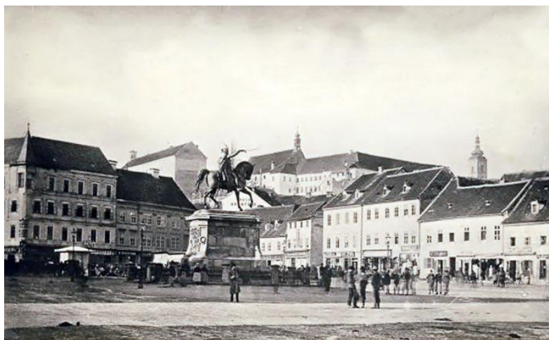
Sl.12. Palača Stanković, prva trokatnica na Jelačićevu trgu