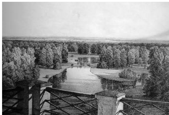
Sl.7. Park Maksimir 1852., pogled s Vidikovca na Gornje i Donje jezero

Razdoblje prve polovice 19. stoljeća također je i doba vrtova i parkova, nekoliko ih je u Zagrebu; vrtovi Krieger, Felbinger, Nikolić, Czappan na Cmroku te Sjeverna i Južna promenada, danas Strossmayerovo odnosno Vrazovo šetalište te park Maksimir (Sl.7.), remek-djelo umjetnosti. O vrtovima tada pišu i Zagrebačke novine, posebno Allgemeine Deutsche Gartenzeitung , 1828.g. pišu o ranije spomenutim vrtovima, a 1831.g. donose priču o građevinama, ali i o djelatnostima pa tako i o trgovcu kovine koji ima dućan na Trgu sv. Marka, Wohlfahrt i Popović trguju suknom, Liederkron staklom i porculanom, a De Negro i Vidale prekomorskom robom. Glavna trgovačka ulica tada je Duga ulica (danas Radićeva) te trgovci imaju u njoj glavne dućane, a u Ilici podružnice. Nalaze se tu i ljekarna K Spasitelj i Zeiningerova pekarna. Sav je trgovački posao u Gornjem gradu, čak se i veliki sajmovi održavaju na Trgu sv. Marka i u Pivarskoj ulici (danas Basaričekovoj), dok na Harmici (Trg bana Jelačića) rade samo pečenjari i slaninari. Krčme i gostionice kao i trgovine, uglavnom su u vlasništvu Nijemaca i imaju isključivo njemačke natpise. 31