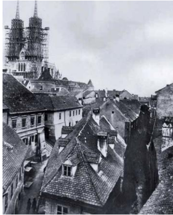
Sl.13. Ulica Pod zidom (lijevo) i potok Medveščak (desno), 1895.

Na sjeveru su vrata odstranjena sedamdesetih godina 19. stoljeća, južna – Bakačeva nestala su 1862. godine. Okoliš je promijenjen; kuće su preinačene i Bakačeva je ulica ostala tjesnac do 1899. g. kad je počelo rušenje tih kuća (Sl.14.). Usred podosta zatvorenog trga stajala je od 1660. godine kaptolska vijećnica. 1875.g. općina je kupila kuriju kod sjevernih vrata te je tu 1876.g. podigla prvu pučkoškolsku zgradu koja i danas postoji. Tamo su se inače nalazile same stare kurije i poslovnom svijetu nije bilo mjesta.