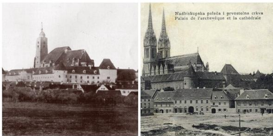
Sl.15. Stara i nova katedrala

Sa širenjem naseljenog područja u Zagrebu javila se potreba za uvođenjem suvremenog sustava ulica i kućnih brojeva. 1878. godine ukinuta je prijašnja numeracija po kronološkom slijedu, što je otežavalo orijentaciju jer su susjedne kuće često imale razdaleke brojeve. Sada svaka ulica, šetalište ili trg dobiva ime, a zgrade u njima ili oko njih označene su kućnim brojevima po današnjem načinu. Izmijenjena su 22 imena, 26 ulica dobiva novi naziv. Gradsko poglavarstvo izdalo je Novu numeraciju kuća , s oznakom vlasnika svake kuće te se lako uočava promjena vlasnika kada usporedimo s popisom iz 1864.g. učinjenim za katastarsko snimanje. Treba spomenuti još i novo centralno groblje - Mirogoj, na kojem je 3. veljače 1876. godine prvi pokopan Miroslav Singer, učitelj gimnastike. Stara groblja polako su napuštana.