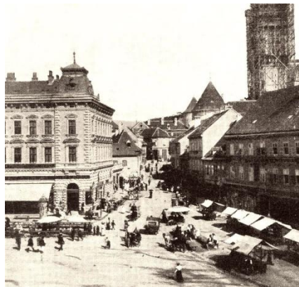
Sl.14. Bakačeva ulica 1898.g.

Na sjeveru su vrata odstranjena sedamdesetih godina 19. stoljeća, južna – Bakačeva nestala su 1862. godine. Okoliš je promijenjen; kuće su preinačene i Bakačeva je ulica ostala tjesnac do 1899. g. kad je počelo rušenje tih kuća (Sl.14.). Usred podosta zatvorenog trga stajala je od 1660. godine kaptolska vijećnica. 1875.g. općina je kupila kuriju kod sjevernih vrata te je tu 1876.g. podigla prvu pučkoškolsku zgradu koja i danas postoji. Tamo su se inače nalazile same stare kurije i poslovnom svijetu nije bilo mjesta.