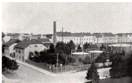
Sl.20. Stara plinara