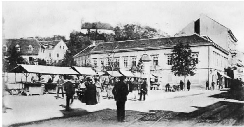
Sl.16. Ilički trg (Britanski trg)

I nakon 1885.g. grad se razvija polaganim tempom, no jednolično. 1886. godine broj stanovnika je preko 34 tisuće za koje je bilo 1939 kuća. Sagrađena je još jedna trokatnica, četiri dvokatnice, deset jednokatnica i 4 prizemnice. Otvoren je Akademski trg (danas Strossmayerov trg), Boškovićeve ulica, a priprema se izgradnja Iličkog trga (danas Britanski trg, Sl.16.). Za gradnju novog kazališta grad je 1885.g. ustupio zemljište na Sajmištu, no zastupnici smatraju da je za kazalište bolje mjesto „unutar grada“. 48