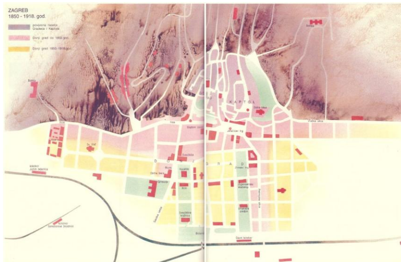
Sl.8. Zagreb od 1850. – 1918.g.

Promatrajući razvoj Zagreba u razdoblju nakon 1850. godine (Sl.8.) moramo imati na umu i političke okolnosti i činjenicu da se grad usprkos neprilikama razvio i neočekivano napredovao.