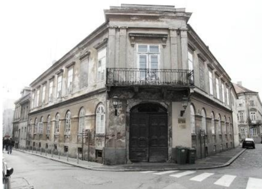
Sl.3. Kuća Frigan, ugao Opatičke i Demetrove