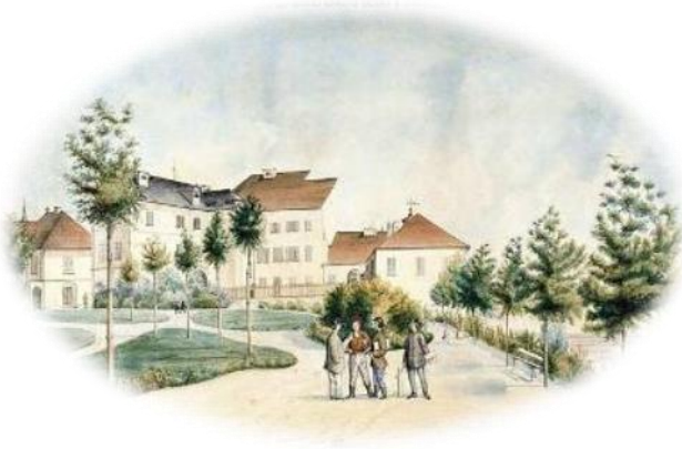
Sl.5. Šetalište Grič