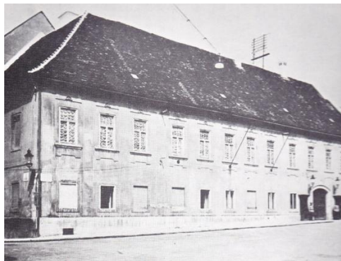
Sl.21. Banski dvori

naposljetku radi pohrane arhivskih spisa nastalih poslovanjem tih ustanova, započeo ban Gyulay. Banske vlasti kupile su 1808.g. ugaonu palaču obitelji Kulmer i preuredile ju budući da je bila premala za novonastale potrebe. Tijekom obnove podignut je drugi kat čime je prvi put na Gornjem gradu sagrađena dvokatnica. U istu svrhu je 1839. g. kupljena susjedna palača obitelji Rauch, koja se vremenom spojila sa starim dijelom u sukladnu cjelinu. Tako se tijekom prve polovice 19. stoljeća na zapadnoj strani Trga sv. Marka oblikovao vladin kompleks, usmjeren reprezentativnim pročeljem prema središnjem gornjogradskom trgu, koji krilima zatvara zapadni dio od crkve sv. Marka.