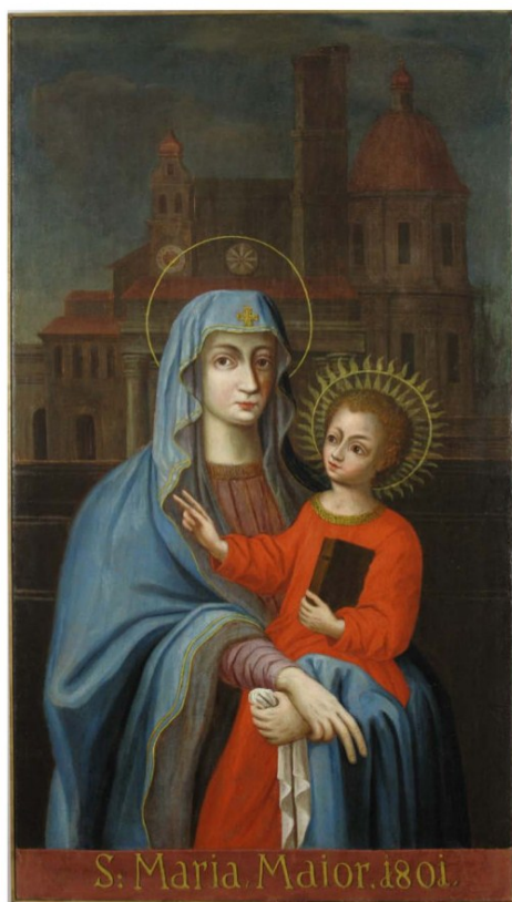
Slika nakon završenih radova