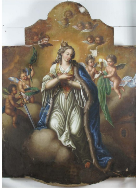
Slika s rekonstruiranim dijelovima podložnog sloja nad ranijim oštećenjima. Završetak prve faze radova

program radova), njezino restauriranje je odobreno i trenutno se nalazi u restauratorskoj radionici, u drugoj fazi obnove. Poslije rendgenskog snimanja, snimanja pod UV rasvjetom i zračenja infracrvenim zrakama, restaurator je zaključio kako je donji (originalni) sloj vrlo loše očuvan i vidljiv tek u tragovima, te je Hamerlić s razlogom izveo preslik. 23 Stoga je odlučio prezentirati upravo Hamerličev sloj, dok je autor originalne slike možda Andreas Herrlein (Kleinbarsdorf, Würzburg, 6. 9. 1738. – Ljubljana, 2. 5. 1817.). 24