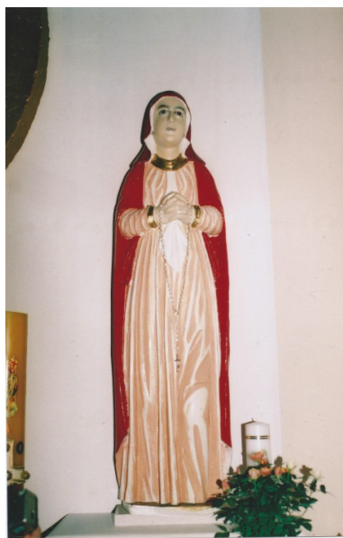
sl. 11 – Sadašnje stanje skulpture Bl. Dj. Marije iz 17. stoljeća

Nažalost, konzervatori su jedva prepoznali da se radi o istoj, ranije spomenutoj baroknoj skulpturi. Fotografija njezina prijašnjeg izgleda nema.