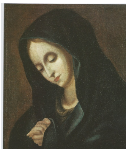
sl. 10 – Bl. Dj. Žalosna iz Svetica

Ikonografski komparativni primjer ovoj slici nalazimo u geografski blizu smještenom pavlinskom samostanu u Svecicama (danas u Muzeju za umjetnost i obrt), a podrijetlo rješenja te teme nalazimo u opusu Carla Dolcija (Firenca 1616. – 1686.), o čemu je pisao u više navrata Radoslav Tomić. 26