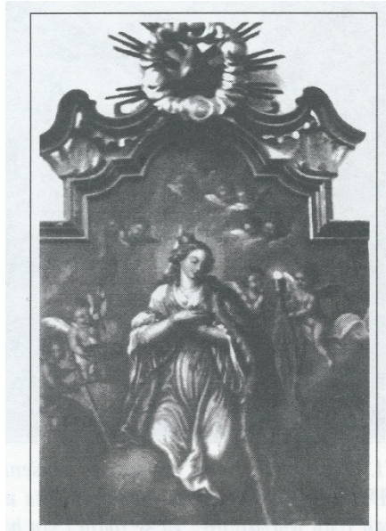
sl. 5 – Fotografija dijela glavnog oltara crkve sv. Barbare

Slika je zatim premještena u crkvu sv. Ćirila i Metoda, a po rušenju i ove crkve (1848. godine) premještena je na lijevi zid svetišta crkve Majke Božje Snježne na Dubovcu. Nemamo podatak kada je sklonjena u Zbirku, vjerojatno također kako bi se zaštitila i sačuvala. Smještena tik uz prozor, u neadekvatnim mikroklimatskim uvjetima, zatečena je opuštenog platna, presvučena slojem prljavštine i oksidiranog laka, s tragom razlivene bijele boje (vjerojatno za zid) po licu sv. Barbare i velikom probojnom rupom (3 x 8 cm) desno od svetičine glave.