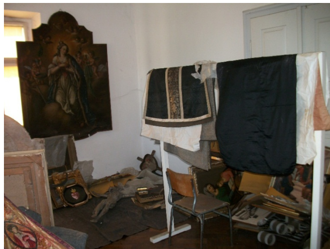
sl. 6 – Zatečeno stanje 2012. godine, slika sv. Barbare

Slika je zatim premještena u crkvu sv. Ćirila i Metoda, a po rušenju i ove crkve (1848. godine) premještena je na lijevi zid svetišta crkve Majke Božje Snježne na Dubovcu. Nemamo podatak kada je sklonjena u Zbirku, vjerojatno također kako bi se zaštitila i sačuvala. Smještena tik uz prozor, u neadekvatnim mikroklimatskim uvjetima, zatečena je opuštenog platna, presvučena slojem prljavštine i oksidiranog laka, s tragom razlivene bijele boje (vjerojatno za zid) po licu sv. Barbare i velikom probojnom rupom (3 x 8 cm) desno od svetičine glave.