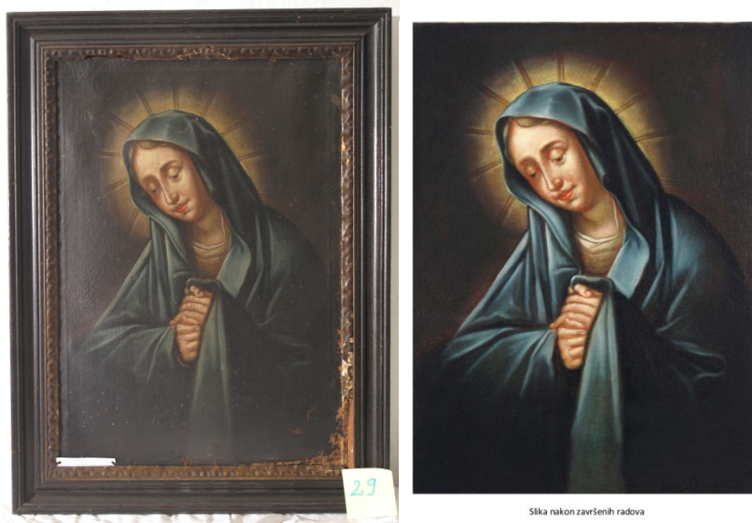
sl. 8/9 – Usporedba stanja slike Bl. Dj. Žalosna: prije i poslije restauriranja

došlo do stvaranja plijesni i krakelira te crvotoka u ukrasnom okviru. Restaurirana slika nije vraćena u Zbirku zbog neodgovarajućih uvjeta čuvanja i nalazi se u župi.