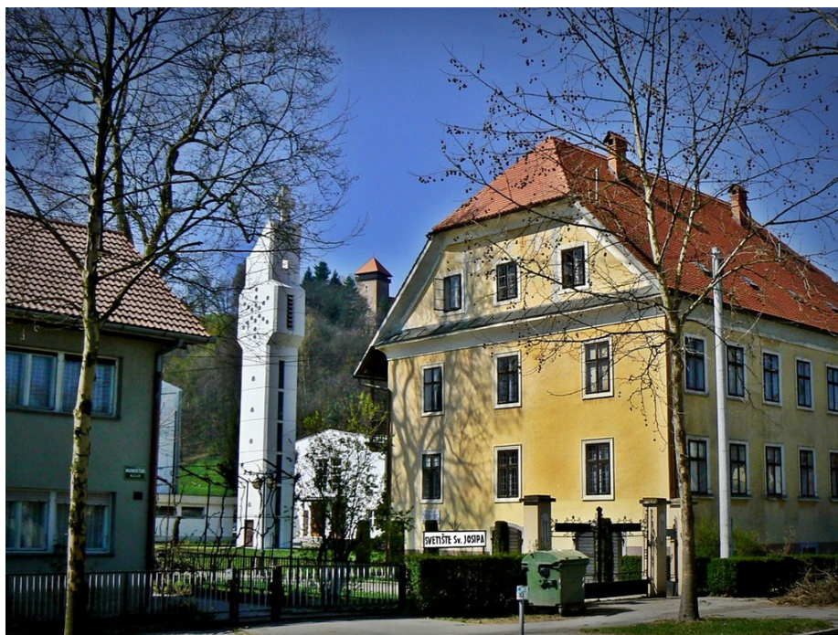
sl. 2 – Šporerova kurija, pogled s Marmontove aleje (sjeveroistok)