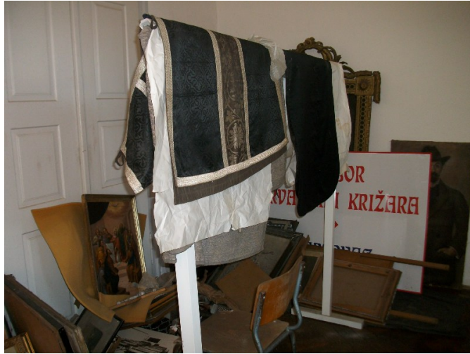
sl. 3 – Zatečeno stanje 2012. godine, iza stalka s paramentima vidljiv dio profiliranog okvira Majke Božje Snježne

sigurnosti je povučena u zbirku Dijecezanskog muzeja u Dubovcu 20 . Zbog položaja u kojem je provela mnogo godina, naslonjena na zid u neprovjetravanoj prostoriji s paramentima i drugim slikama naslonjenima upravo na „lice“ slike, to jest slikani sloj, platno je bilo nabrano, slikani sloj crvotočan, a lik Djevice Marije imao je mehanički urez preko lica.