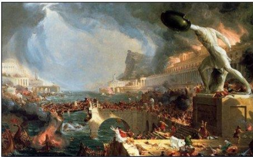
Slika 3. Veliki požar u Aleksandriji

Moguće je da je sama zgrada Knjižnice oštećena prilikom izgradnje barikada jer se za utvrđivanje grada koristio najvećim dijelom kamen, a jedini izvor kamena bile su zgrade. O tome piše i Cezar „ Iz otvora jednih zgrada također su prodirali u druge zgrade zidovima “, pa koliko su mogli bolje raskrčiti ruševine, toliko su više dobivali slobodna prostora za utvrđivanje “. 51 Iako izričito ne navodi o kojim se zgradama radi sasvim je sigurno da je s obzirom da je bio opkoljen u Kraljevskoj četvrti riječ o zgradama unutar četvrti. U očajničkom pokušaju da se odupru mnogobrojnijem napadaču Rimljani zasigurno nisu imali milosti ni prema jednom arhitektonskom dragulju kao što je Aleksandrijska knjižnica.