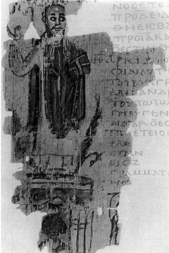
Slika 4. Patrijarh Teofil pobjedonosno stoji iznad Serapeja

Bez daljnjege možemo pretpostaviti da, ako je knjižnica još uvijek postojala do provale kršćana u hram, nakon toga konačno bi prestala postojati. Teodert Cirski piše da je hram razrušen do temelja, a jedan drugi izvor, poganin Eunopije piše da su Teofil i njegovi sljedbenici donijeli uništenje hramu i da samo najveće kamenje nisu odnijeli, a sve ostalo je upropašteno i uništeno. 83 S pobjedom kršćanstva u cijelom Carstvu nastaje novo ozračje, vjera i vjerski sadržaji postaju dominantno područje interesa, dok knjige i knjižnice starog svijeta polagano nestaju. Tome svjedoči i Amijan Marcelin kada kaže da su „ knjižnice zauvijek zatvorene kao grobovi. “ 84 Poganke knjige i knjižnice uništavane su diljem Carstva, tako car Jovijan zapovijeda da se spali knjižnica u Antiohiji. 85