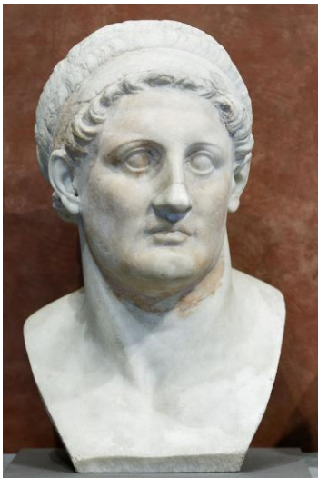
Slika 1. Ptolomej I. Soter

Ptolomej I. Soter je pored svoje umjetničke i znanstvene ambicije imao i prizemnije probleme: u Egiptu su on i Grci stranci, neusporedivo malobrojniji nasuprot premoćnom broju autohtonog stanovništva. Stoga je morao pomiriti i približiti dvije strane – egipatsku i grčku. Za novodoseljene Grke Knjižnica i Museion predstavljali su važan element u povezivanju s njihovom grčkom prošlošću. 16 Također, i Aleksandrovo tijelo što ga je oteo te mauzolej koji mu gradi u Aleksandriji dat će mu važnu političku težinu među Grcima, s obzirom da je Aleksandar Makedonski imao iznimno, gotovo mistično značenje za Grke.