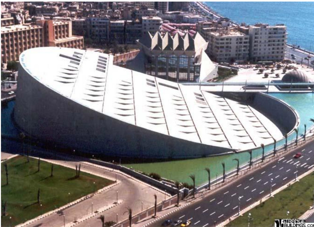
Slika 7. Bibliotheca Alexandrina

Zgrada ima geometrijski oblik kruga, tj. diska s namjerom da simbolizira univerzalnu geometriju bez početka i kraja – u neprekidnom obliku kruga. Također, ovakav oblik zgrade simbolizira i rađanje sunca jer je konstrukcija tako dizajnirana da je nagnuta pod kutom od 16,08^\circ i prednjim dijelom uranja u bazen s vodom koji okružuje zgradu. Krov zgrade posebno je dizajnirana betonska konstrukcija sa 600 betonskih niša koje vizualno podsjećaju na mikročip. Upravo ovaj izgled mikročipa simbolizira Knjižnicu okrenutu k novim tehnologijama. 133 Zgrada ima 11 katova od kojih su četiri pod zemljom, a sedam nad zemljom. Promjer diska je 160 metra i okrenut je prema Sredozemnom moru. Zid zgrade je od sivog asuanskog granita i na njemu se nalaze urezani znakovi svih svjetskih pisama. Cijela zgrada je okružena vodenim bazenom, kao još jedan moćan simbol.