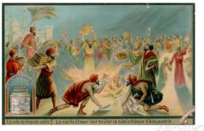
Slika 6. Kalif Omar zapovijeda uništavanje knjiga iz Aleksandrijske knjižnice

Zapadno društvo za priču o Arapima kao krivcima za uništavanje knjižnice prvi put doznaje iz djela koje 1663. objavljuje Edward Pococke, profesor na Oxfordskom sveučilištu. On donosi tekst koji je napisao Bar-Hebrej (1226.-1289.) svećenik sirijske pravoslavne crkve, a koji piše da su koptski svećenik Ivan Gramatik i novi gospodar grada Amra diskutirali o mnogim religijskim i filozofskim pitanjima. Među ostalim Ivan Gramatik se zanimao za sudbinu knjiga iz Aleksandrijske knjižnice, pojasnivši mu kako su drevni vladari Egipta Ptolomejevići sakupljali brojne knjige iz svih područja sa sve četiri strane svijeta te je upitao Amra mogu li tako važne knjige ostati netaknute. Autor dalje donosi da Amr nije mogao sam donijeti odluku, već upućuje pismo kalifu Omaru u kojem ga pita što da radi s knjigama. Kalif u odgovoru Amru iznosi svoje poznato stajalište u kojem mu nalaže da ih uništi. Amr potom izdaje zapovijed da knjige iz knjižnice budu iskorištene kao gorivo za kupališta diljem Aleksandrije. Kupališta su se grijala knjigama tijekom punih šest mjeseci. 101