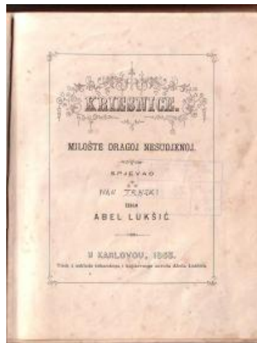
Slika br. 1

U ovu grupu građe ulaze radovi ljudi koji su rođeni i/ili žive i rade u zavičaju bilo da pišu o zavičaju ili su ga svojim postignućima proslavili. Tu su književna djela Mate Lovraka, Milana Taritaša, Đure Sudete, Slavka Kolara, Mirka Sabolovića, Željka Sabola, Gorana Tribusona i mnogih drugih. Posebnost su prva izdanja djela Ivana Trnskog i Petra Praradovića.