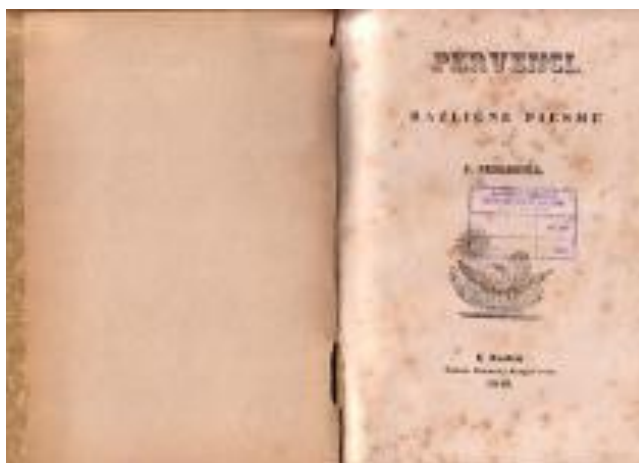
Slika br. 2

Preradović, Petar. Pervenci: različne pjesme / od P. Preradovića. U Zadru : Tiskom Demarchi-Rougier'ovim, 1. izd.; 1846. god. 19