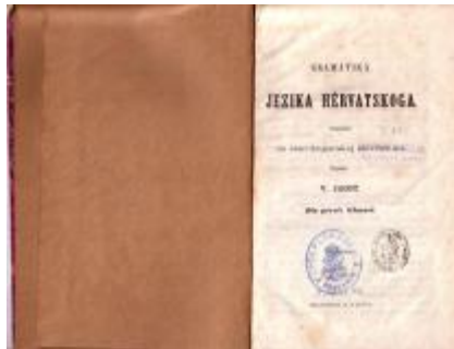
Slika br. 4

Relković, Matija Antun. Satir iliti divji csovik / Matija Antun Relković.[Trechi put na svitlo dat]. U Osiku : [s.n.], 1822. 25