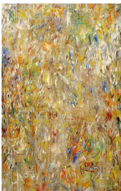
Slika 11: Zlatan Vrkljan, Bez naziva, 2002.