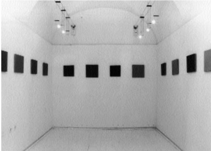
Slika 12: Jelena Perić, Pale Pink Square, Muzej suvremene umjetnosti u Zagrebu, 1992./93.