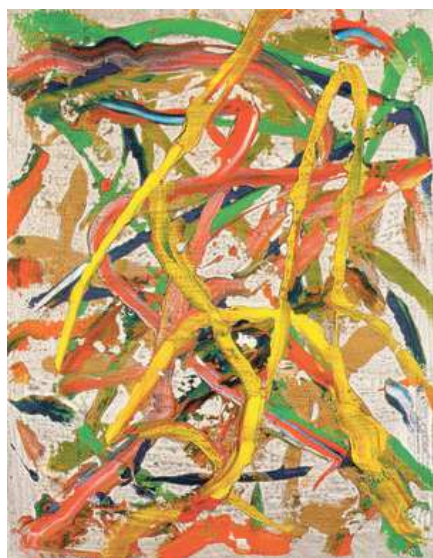
Slika 7: Igor Rončević, Žuti anagram 2, 2010.