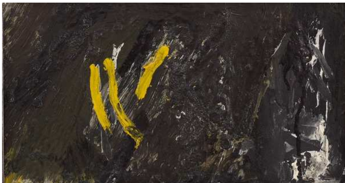
Slika 2: Ivo Šebalj, Slikar I, 1998.