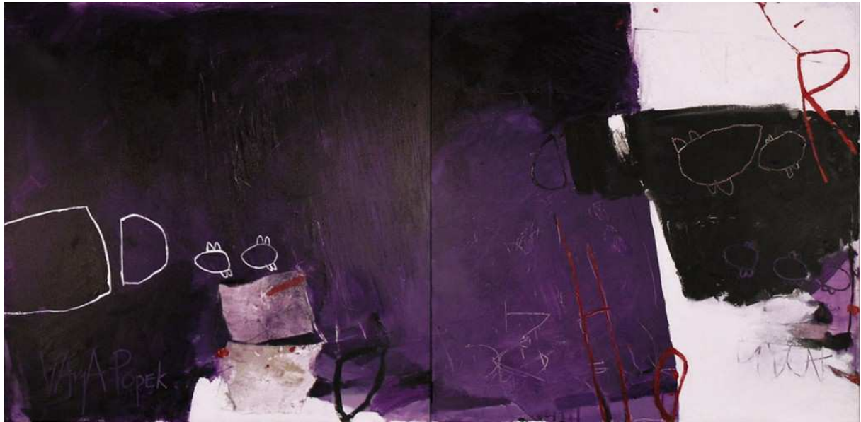
Slika 16: Vanja Popek, Ljubičasta 2, 2009.