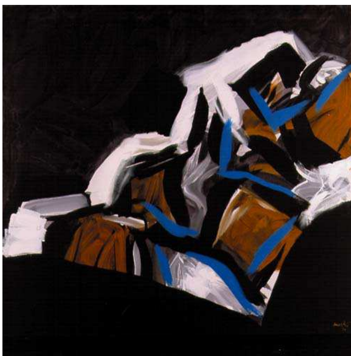
Slika 4: Edo Murtić, Montraker V, 1997.