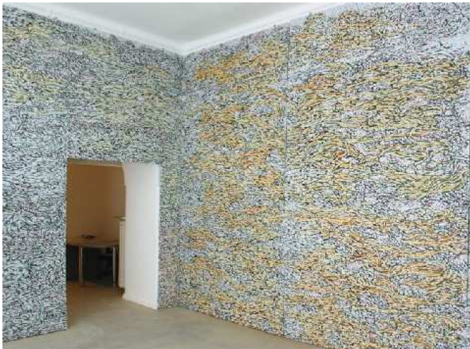
Slika 17: Gordana Bakić, Gameoverland, 2005.