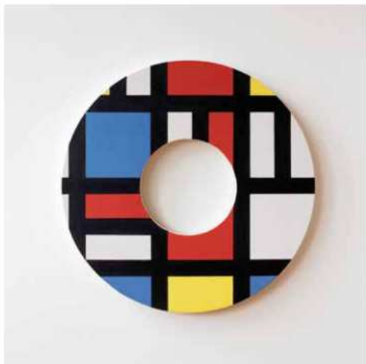
Slika 6: Damir Sokić, Bez naziva, 2002.