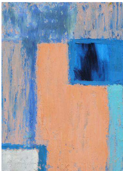
Slika 14: Koraljka Kovač, Bez naziva, 2003.