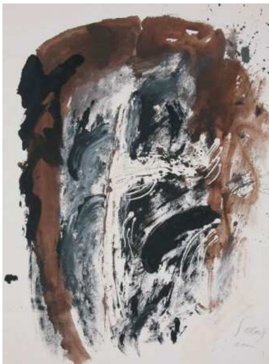
Slika 3: Ivo Šebalj, Šebalj i križ, 2001.