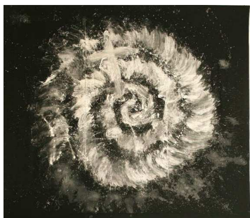
Slika 8: Boris Demur, Requiem in Croatia, 1991.