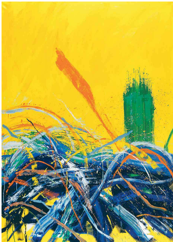
Slika 5b: Vatroslav Kuliš, Riffovi, 2002. – 2006.