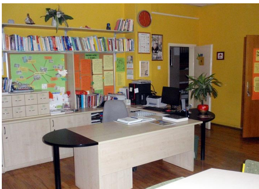
Slika 3. Info pult i radni stol knjižničarke

Ulaskom u knjižnicu korisnik prvo nailazi na informacijski pult (Slika 3), koji ujedno služi i kao stol za posudbu i rad knjižničara. Na stolu je računalo koje je namijenjeno samo knjižničaru za obavljanje poslova vezanih uz školsku knjižnicu. Pokraj stola knjižničara nalazi se ormar sa raznom tehničkom opremom kao što su 5 CD playera, 2 LCD projektora, razglas, televizor, DVD player i VHS player. Neknjižni fond sadrži 189 komada VHS-a, 206 DVD-a, 56 komada CD-a, 17 komada CD-ROM-a, i 2 komada DVD-ROM-a.