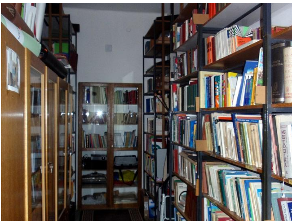
Slika 9. Nastavnički odjel

Prostorija u kojoj se nalaze djela svjetske književnosti složena je također po UDK oznakama: engleska, američka, njemačka, talijanska, francuska, ruska i književnost ostalih naroda. Također imaju i djela hrvatske književnosti koja nisu lektirna djela te se nalaze u sklopu ostalih ranije navedenih književnosti. U fondu se nalaze i književnosti naroda bivše države: srpska, slovenska, crnogorska, makedonska i književnost Bosne i Hercegovine. Važno je napomennuti da knjižnica sadrži i zavičajnu zbirku, te uvezane brojeve starih časopisa Drva znanja, Meridijani, Priroda, National Geographic i drugih. U prostoriji se još nalazi stol za skupni ili individualni rad te jedno računalo spojeno na internet.