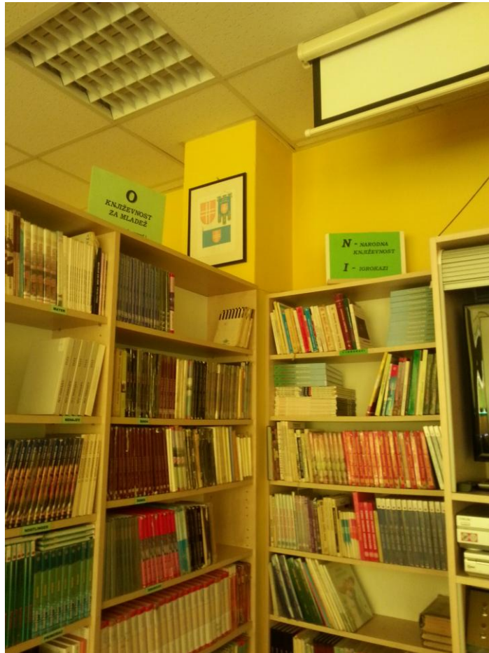
Slika 7. Klasifikacija učeničkog fonda

građa u školskoj knjižnici Novska u slobodnom pristupu i kako joj mogu pristupati učenici, nastavnici, a isto tako i ostalo osoblje osnovne škole. Također knjižnica se drži propisanih odredbi pa je tako njezina građa raspoređena i obrađena u skladu s člankom 16. Standarda za školske knjižnice .