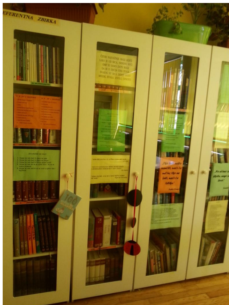
Slika 6. Ormar sa referentnom građom

Nadalje, knjižnica ima bogatu referentnu zbirku koja se nalazi u zasebnim ostakljenim ormarima koji su fizički odvojeni od ostatka fonda (Slika 6). Referentna građa složena je abecednim redom.