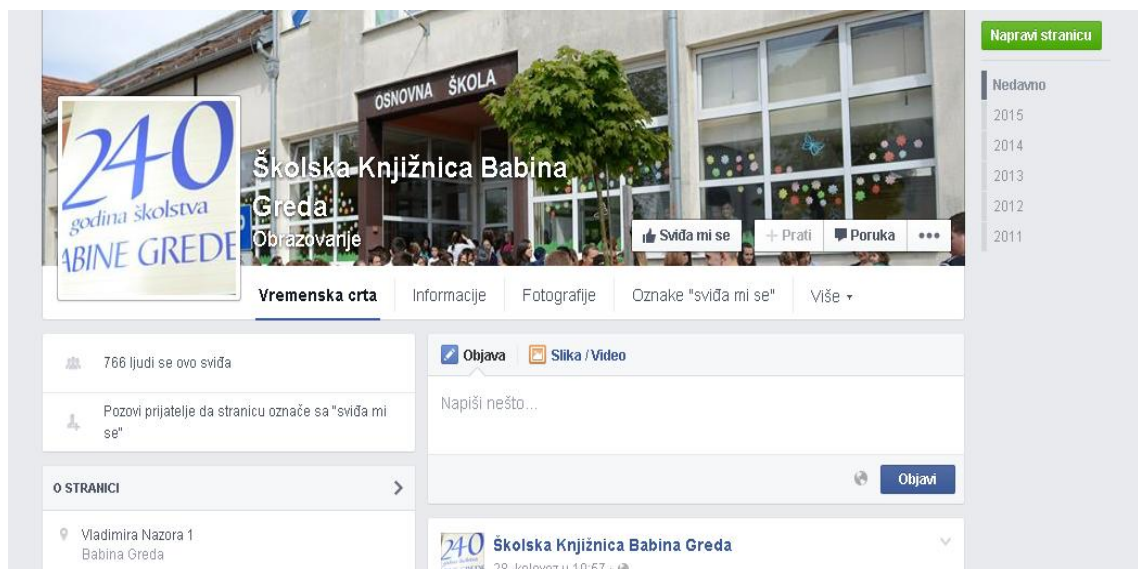
Slika 20. Facebook stranica Školske knjižnice Babina Greda

Također korisnicima se nudi mogućnost da uz pomoć svoga email-a i lozinke provjere pročitane knjige (knjige koje su do sad posudili), rezervacije te da produže određenu rezervaciju ako je potrebno. Nadalje, knjižnica nudi poveznicu na svoju facebook stranicu 33 , što znači da je knjižnica dostupna i na jednoj od društvenih mreža. Knjižnica na svojoj facebook stranici nudi razne poveznice na korisne sadržaje i zanimljive članke i objave drugih korisnika (Slika 20).