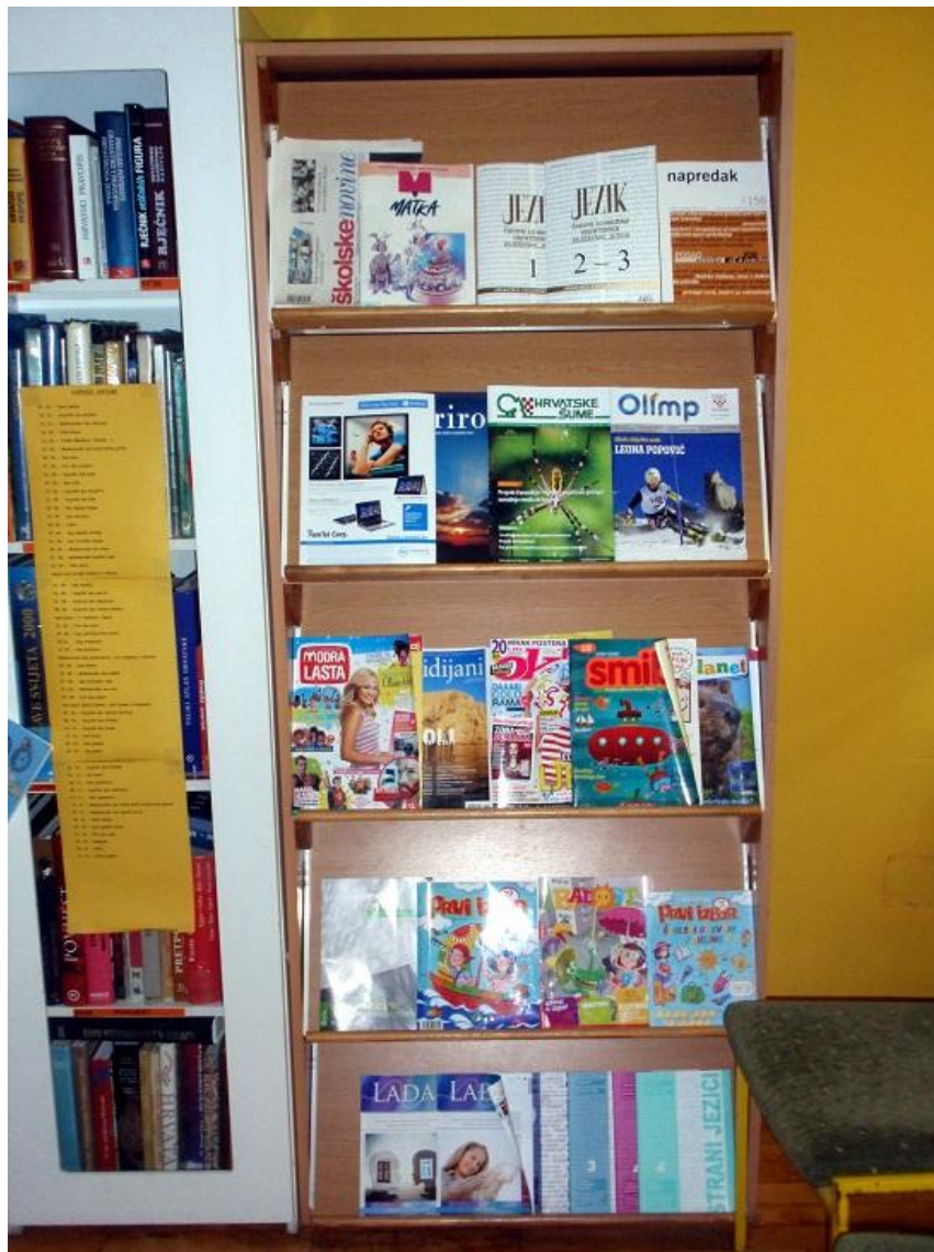
Slika 5. Polica s časopisima

časopise za mlade matematičare, časopis za djecu razredne nastave, za tinejdžere, enciklopedijski časopis za mlade, časopis za informatiku, časopis za promicanje prava djeteta i časopis za kulturu hrvatskog jezika. Ukratko, knjižnica sadrži i nabavlja iznimno veliki broj stručnih, znanstveno-popularnih i pedagoških časopisa, te časopise i listove za djecu i mladež kako je to propisano Standardom . U knjizi Knjižnica osnovne škole autorica navodi kako su za časopise vrlo praktične police s kosim pregradnim daskama. 20 Iz priložene Slike 5 može se jasno zaključiti da je knjižnica vodila brigu i o smještaju časopisa i izgledu polica, te za smještaj časopisa uzela police s kosim pregradnim daskama. Također, ovakav smještaj časopisa je često prisutan i u drugim knjižnicama.