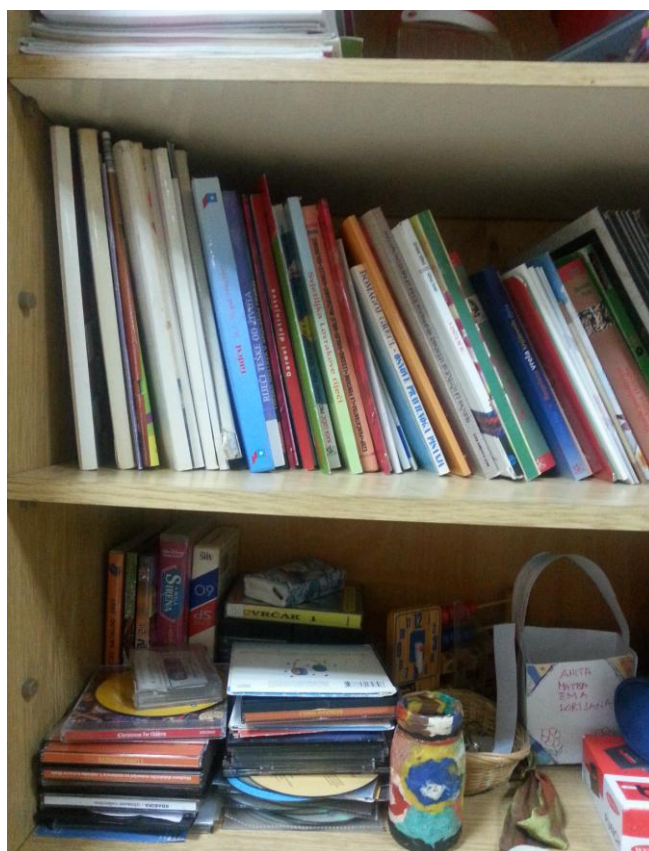
Slika 21. Ormar za knjige i pribor Područne škole Grabovac

Područna škola Brestača broji 33 učenika koji su raspoređeni u tri razredna odjela. Nastava se odvija također u dvije smjene. Zgrada škole izgrađena je 1972. godine. 35 Kao i kod prethodne škole i u ovoj se školi nalazi samo jedan ormar s knjigama koje nisu složene ni abecedno ni po skupinama UDK. U ormaru se ne nalaze lektirna djela, nego je to fond raznih knjiga, razne tematike. Nalaze se neka referentna djela poput rječnika stranih riječi, te ima i jedna društvena igra. Kao i kod prethodne škole u istom tom ormaru se nalaze i predmeti potrebni za održavanje nastave.