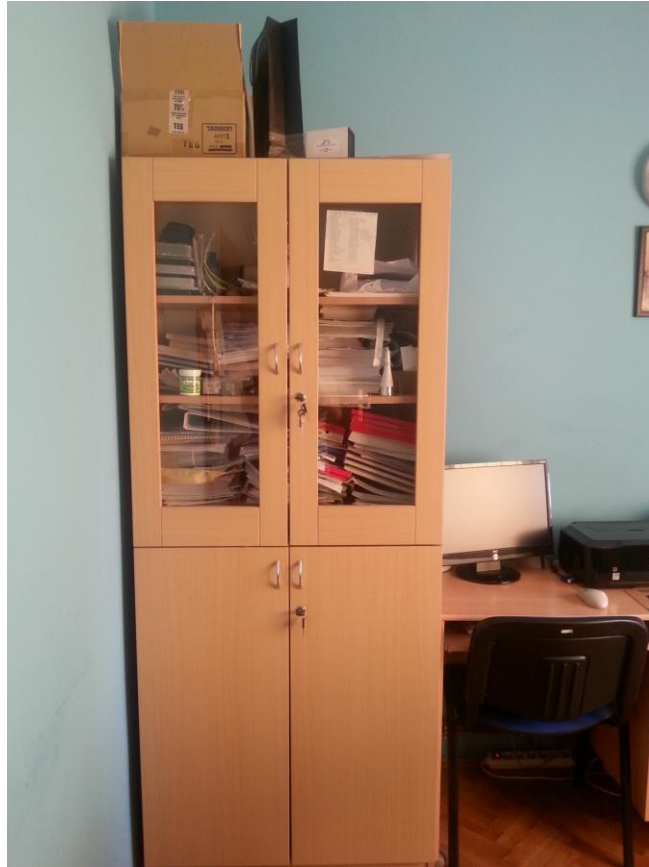
Slika 23. Ormar s knjigama područne škole Bročice

Područne škole i učenici koji je pohađaju do svojih lektirnih naslova dolaze tako što knjižničarka u Osnovnoj školi Novska napravi prije početka školske godine godišnji raspored posuđivanja lektire. On se iznosi pred učitelje na sastanku prije početka nastave gdje svaki učitelj dobije popis na kojem je redosljed posuđivanja lektirnih naslova za njihov razred. Nakon toga učitelji dolaze u knjižnicu i posuđuju lektirna djela za učenike svoje područne škole i na satu im svakome ponaosob dijele. Na kraju mjeseca svaki učenik učitelju nazad vraća posuđena djela i uzima nova koja su redom propisana.