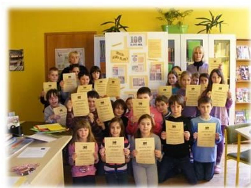
Slika 14. 100 godina šegrta Hlapića

Knjižničarka i učiteljice trećih i četvrtih razreda organizirale su u knjižnici radionicu pod nazivom „Pričosvijet“ prema knjizi Pričosvijet – otključajte vrata mašte. Knjiga se sastoji od četrdeset karata uz pomoć kojih se može ispričati vlastita priča. Na početku sata knjižničarka je ispričala učenicima priču iz knjige uz pomoć deset karata. To je poslužilo kao primjer i motivacija učenicima za stvaranje njihovih priča. Učenici su bili podjeljeni u grupe te je svaka grupa dobila šest karata uz pomoć kojih je morala složiti