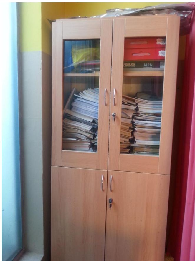
Slika 22. Ormar s knjigama Područne škole Brestača

Područna škola Bročice izgrađena je 1972. Godine i sastoji se od dvije učionice. Ove školske godine školu je pohađalo 39 učenika koji su bili podjeljeni u četiri razredna odjela. Nastava se odvija u dvije smjene. Istu situacija je i u ovoj školi s pohranom knjiga. Sve se one nalaze u jednom ormaru također složene bez abecednog reda i bez UDK skupina.