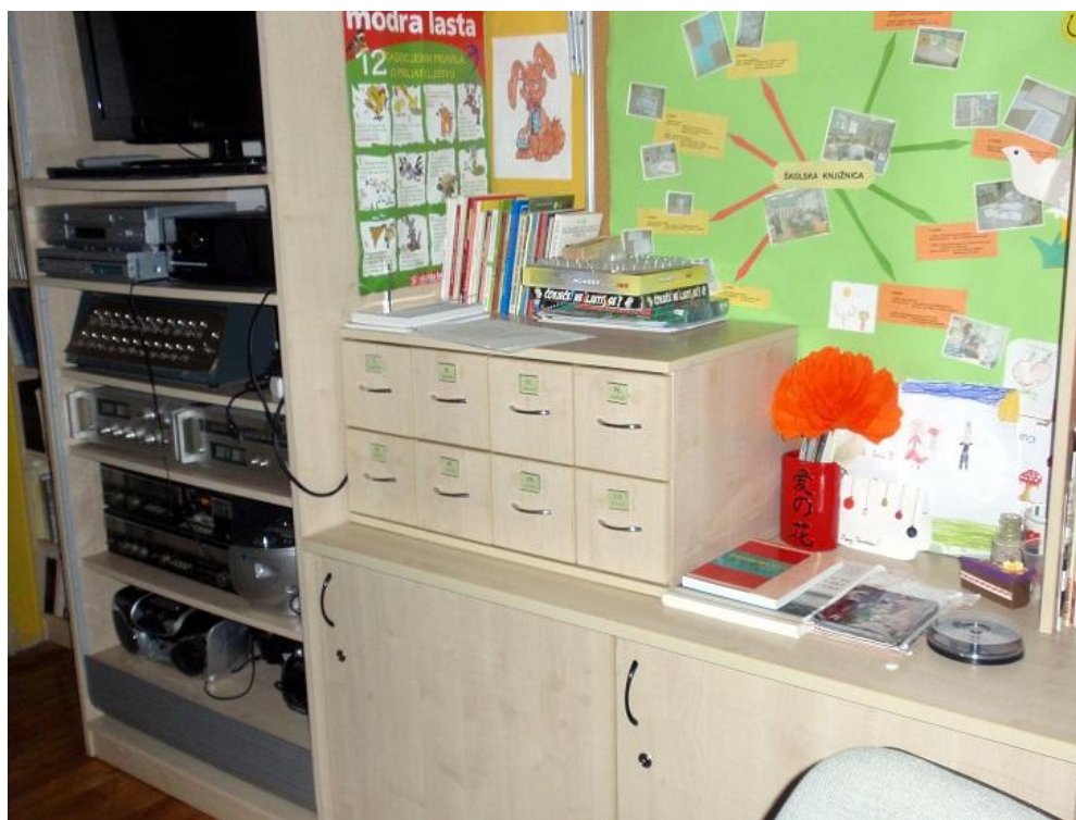
Slika 4. Ormar sa listićima za posudbu i razduživanje, ormar sa tehničkom opremom

U prostoriji se nalaze i police s knjigama. Ukupan knjižni fond broji 8119 knjiga, od toga 5498 jedinica građe namijenjeno je učenicima dok nastavnički fond sadrži 2621 jedinica građe. Prema Članku 13. Standarda za školske knjižnice fond školske knjižnice treba sadržavati obvezatnu lektiru koja će imati 15-30 primjeraka po naslovu, referentnu zbirku i stručne, znanstveno-popularne i pedagoške časopise te časopise i listove za djecu i mladež. 19 Školska knjižnica Novska nabavlja, obvezatnu lektiru koju propisuje Ministarstvo znanosti, obrazovanja i športa i to 25-30 primjeraka određenog naslova kako je utvrđeno Standardom za školske knjižnice . Važno je napomenuti da knjižnica nema online katalog knjiga nego i dalje koristi kataložne listiće koji se nalaze u zasebnim ladicama (Slika 4). Također, svaki učenik ima svoj listić s osobnim podacima koji knjižničar koristi prilikom zaduživanja građe i na njega upisuje naslov posuđenog djela i datum do kojeg posudba traje.