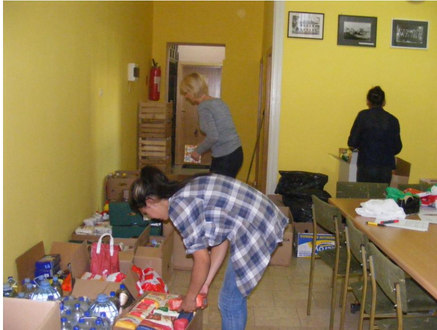
Slika 15. Humanitarna pomoć

Itekako je važno da knjižnica organizira razne aktivnosti kako u samom prostoru knjižnice tako i izvan nje. To je bitno zbog toga da bi se učenike privuklo u knjižnicu, da nauče kako čitati i da zavole čitanje. Važno je da knjižnica osvijesti učenike da ima ljudi kojima je pomoć potrebna. Tako je knjižnica organizirala darivanje knjiga za najmlađe kako bi se učenike naučilo da pomažu drugima i da budu svjesni da je dobro i poželjno činiti dobra djela.