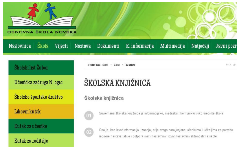
Slika 16. Mrežna stranica školske knjižnice

unaprijed pripremljen. 28 Takav oblik mrežnih stranica zadržao se uglavnom u knjižnicama koje i dalje ne dopuštaju korisniku sudjelovanje u samoj izradi stranice i u oblikovanju sadržaja koji se nalazi na njoj. Web 2.0 promijenio je takav položaj korisnika mrežnih stranica te je sada korisnika postavio u središte aktivnosti stvaranja, prikupljanja, organiziranja, integriranja i predstavljanja sadržaja prema njegovim vlastitim kriterijima. 29 Korisnici na takvim stranicama koje su okarakterizirane kao web 2.0 stranice odnosno mrežna mjesta, mogu sudjelovati u njezinoj izradi, te one više nisu statične nego se mijenjaju uz pomoć korisnika. Svatko može dodavati i brisati sadržaj na stranici po svojim kriterijima, no problem koji se javlja na takvim stranicama je pitanje jesu li onda te stranice i sadržaj na njima relevantni? Mrežno mjesto Školske knjižnice Novska karakteristično je Web-u 1.0 što znači da je stranica statična i da je samo jedna osoba osposobljena i odgovorna za njezino održavanje (Slika 16).