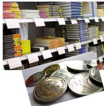
Slika 10. Primjer powerpoint prezentacije za prve razrede osnovne škole (nastava u knjižnici)

Učenici drugog razreda trebaju prepoznati i imenovati dječje časopise, znati kako razlikovati dječji tisak od dnevnog tiska i časopisa, prepoznati je li sadržaj poučnog ili zabavnog karaktera, razlikovati časopise prema vremenu izlaženja, te kako steći naviku čitanja dječjih časopisa.