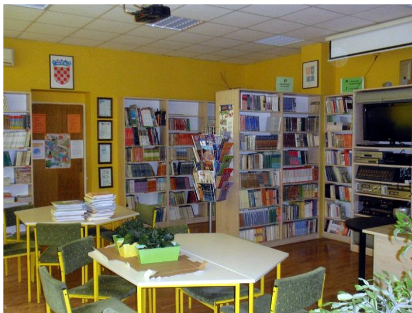
Slika 2. Učenički fond

Ulaskom u knjižnicu korisnik prvo nailazi na informacijski pult (Slika 3), koji ujedno služi i kao stol za posudbu i rad knjižničara. Na stolu je računalo koje je namijenjeno samo knjižničaru za obavljanje poslova vezanih uz školsku knjižnicu. Pokraj stola knjižničara nalazi se ormar sa raznom tehničkom opremom kao što su 5 CD playera, 2 LCD projektora, razglas, televizor, DVD player i VHS player. Neknjižni fond sadrži 189 komada VHS-a, 206 DVD-a, 56 komada CD-a, 17 komada CD-ROM-a, i 2 komada DVD-ROM-a.