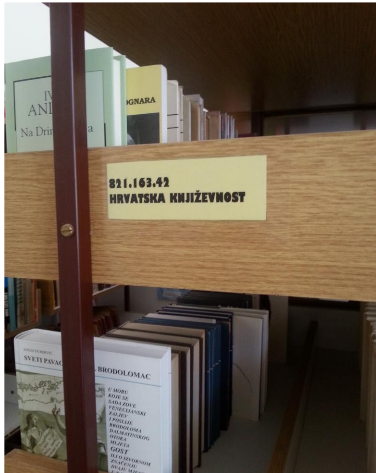
Slika 8. Klasifikacija djela svjetske književnosti

Unutar svake podjele knjige su raspoređene abecednim redom. Iznad svake police nalazi se karton s natpisom, odnosno, sa velikim pisanim slovom i objašnjenjem za koji razred su knjige namijenjene (Slika 7). Fond koji ne spada u lektirnu građu i nastavnički fond obrađen je u skladu sa UDK tablicama (Slika 8).