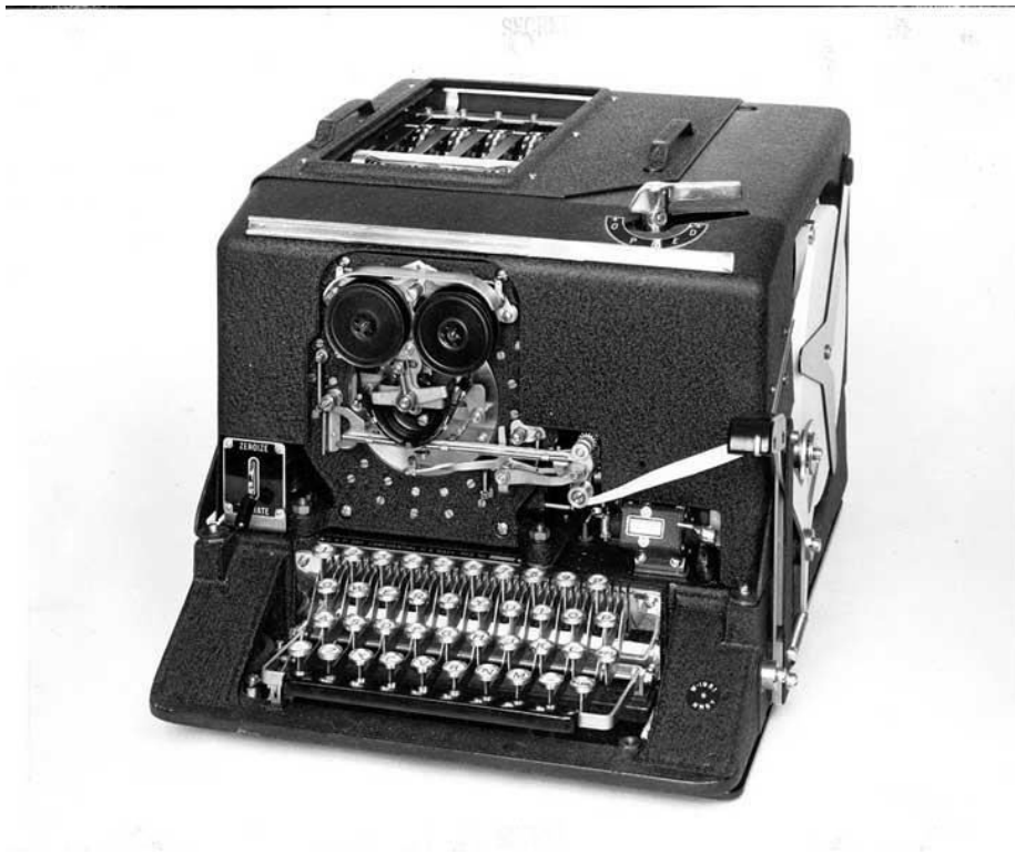
Slika 6: SIGABA

pokretanje rotora, tako da su se pokretali nasumično. Za razliku od Enigme, taj stroj neprijateljski kriptanalitičari nikad nisu uspjeli razbiti, a njegovu neprobojnost potvrdila je i Signal Security Agency, posebna grupa unutar kopnene vojske koja se bavila testiranjem neprobojnosti američkih sustava za šifriranje.