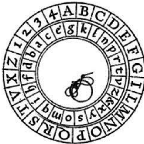
Slika 1: Shema Albertijevih diskova