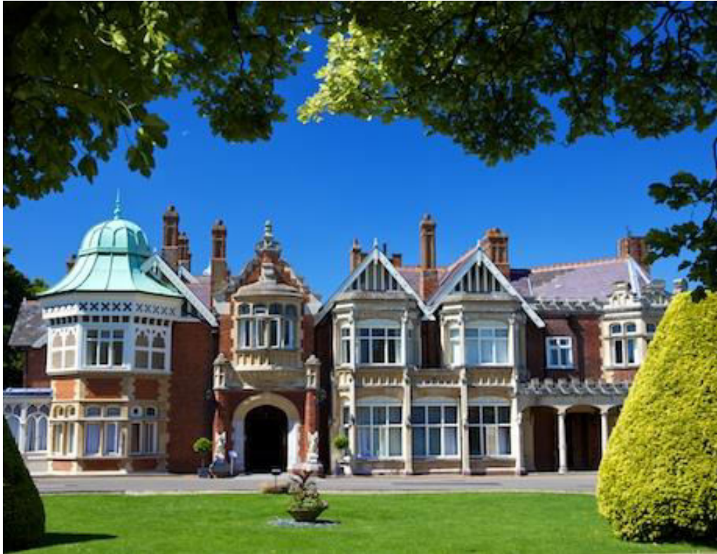
Slika 5: Vila na posjedu Bletchley Park