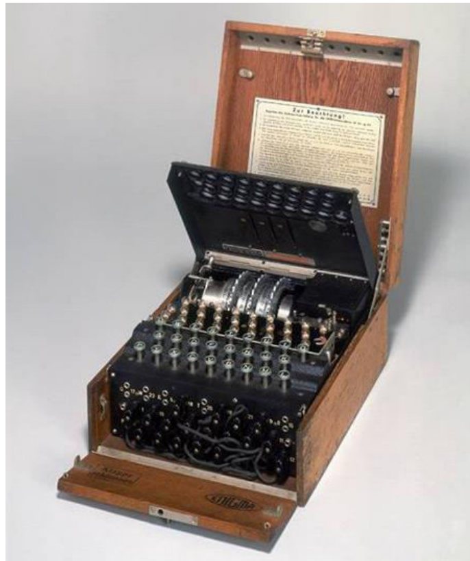
Slika 3: Enigma