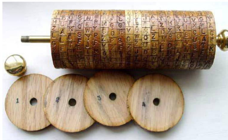
Slika 2: Jeffersonov kotač