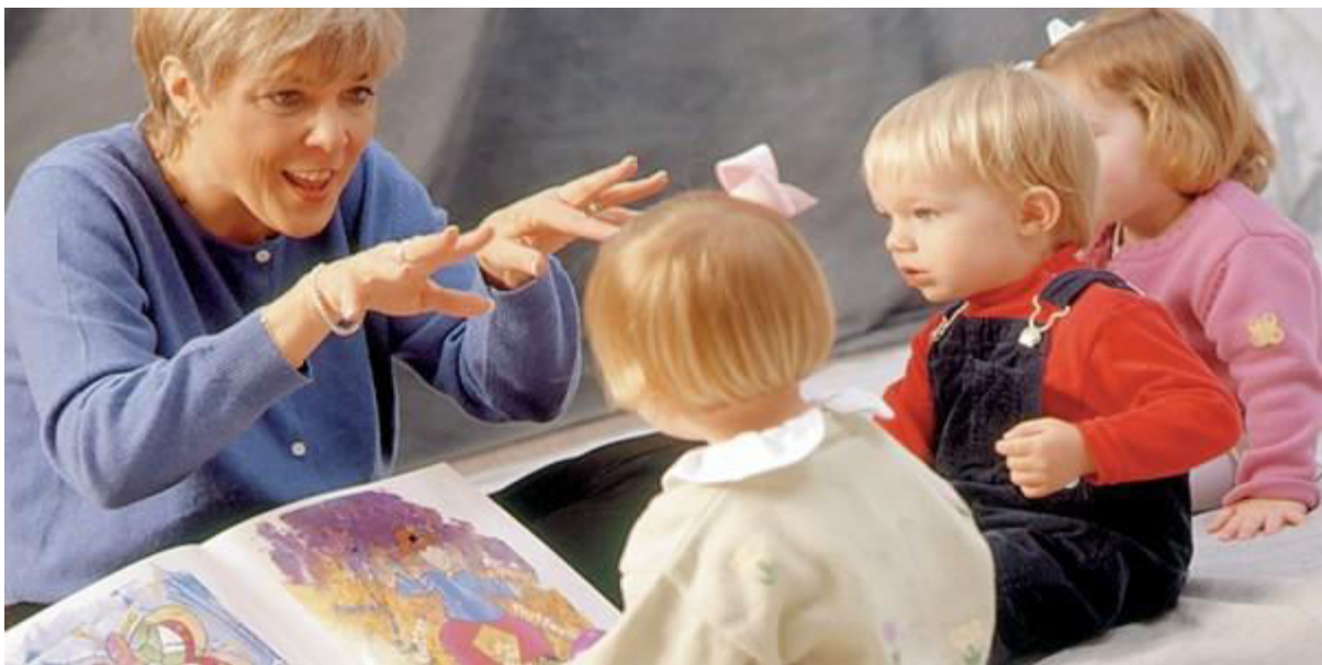
Slika2. Kako čitati djeci

Mala se djeca uglavnom teško koncentriraju i lako im je odvući pozornost pa pričajući priče treba znati kako osvojiti i zadržati njihovu pozornost. Ako se u priču ne unese uživljavanje u uloge, događaje i prizore, priča neće imati željeno djelovanje. Uživljavanjem u različite uloge i dramatizacijom likova ne samo da će priča postati zabavnija i privlačnija te djetetu produljiti koncentraciju, nego će mu i pomoći u oblikovanju tzv. kritičkog slušanja. Tonom, ritmom i izrazom lica, dijete će doživjeti sva iznenađenja i uzbuđenja koja donosi priča.