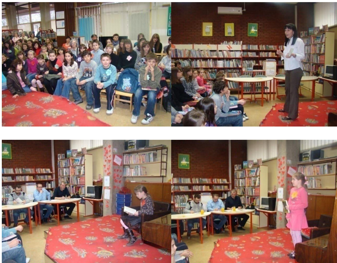
Slika 9. Natjecanje u čitanju naglas 2009.

mlađoj (učenici 3. - 5. razreda osnovnih škola) i starijoj (učenici 6. - 8. razreda osnovnih škola), od čega je odabrano šest najboljih čitača, po tri u svakoj kategoriji.