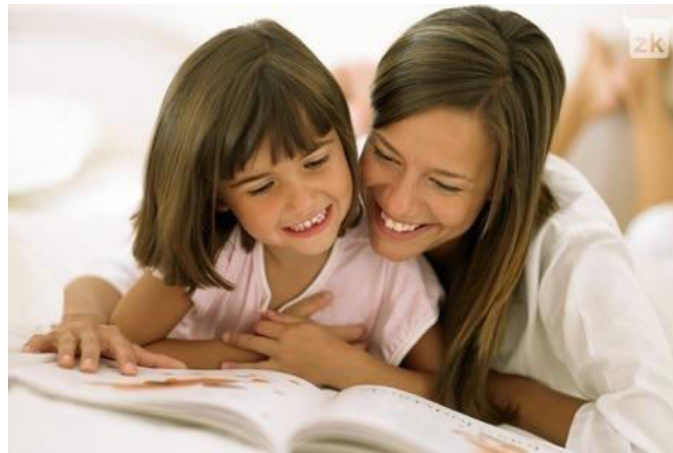
Slika 3. Čitanje djeci od najranije dobi.

U predškolskom razdoblju razvija se zainteresiranost i ljubav za čitanje ako roditelji uživaju u čitanju, ako djetetu daju primjer uživanja u čitanju te ako mu omoguće uživanje u zajedničkom čitanju slikovnica uz emocionalni doživljaj i humor.