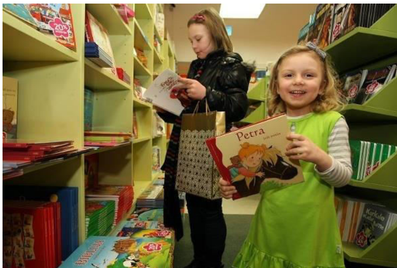
Slika 3. Djeca i knjižnice.

Knjižnice su ustanove koje služe obrazovanju, širenju znanja i obavijesti. Čitanjem djeca razvijaju sposobnosti, interese i znanje te u određenoj dobi oblikuju svoj svjetonazor na temelju spoznaja o životu koje su uspjela steći. Iako se osnovna znanja o životu stječu u obitelji, ne postoji obitelj u kojoj bi se moglo naučiti sve. Čitanjem se upoznaju druge obitelji, različiti ljudi i događaji koji se ne mogu susresti u neposrednoj djetetovoj okolini.