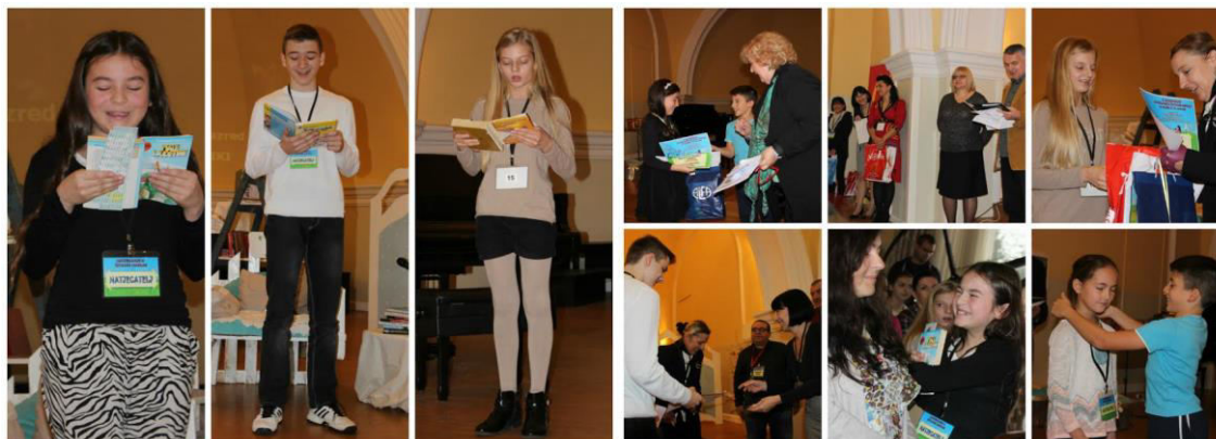
Slika 15. 2. nacionalno natjecanje u čitanju naglas.

Novost natjecanja bila je i nagrada publike.