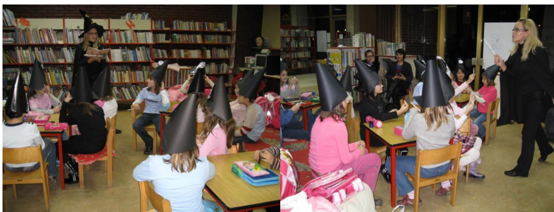
Slika 6. Mala vještica .

U Ogranku Caprag, također se, jednom mjesečno održavaju književne radionice za djecu osnovnoškolskog uzrasta kojima je cilj potaknuti djecu na čitanje u slobodno vrijeme, izvan školskih obveza. Prva u nizu radionica bila je Mala vještica , prema dječjem klasiku Otfrieda Preusslera. Tijekom radionice korišteni su različiti poticaji kako bi se literarni tekst približio mladom čitatelju. Radionica se temeljila na dramskoj igri, čitanju ulomaka knjige te rezultirala literarnim stvaranjem, a sve s ciljem čitanja triju preporučenih djela autora Otfrieda Preusslera. Putem plakata i letaka djeci su zadane čarobne riječi pomoću kojih će moći sudjelovati u radionici tako da je susret u knjižnici započeo upravo čarobnim riječima: Dobar dan! Volim abra-ka knjige abra-ka! I Malu vješticu abra-ka tražim! Voditeljica radionice bila je kostimirana u vješticu tako da je igra započela samim ulaskom u knjižnicu. Djeca su se okupila oko vještice koja je imala čarobni štapić i čarobni kotao. Zajednički su trebali začarati priču za koju je bila potrebna šaka riječi, malo mašte, smijeh, suze, dobra volja i pažljivo slušanje. Pomoću čarobnog štapića i čarobnih riječi stvorena je knjiga. 20