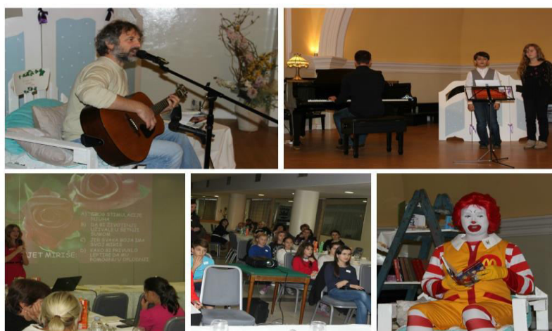
Slika 19. 2. nacionalno natjecanje u čitanju naglas.