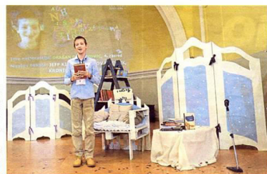
Na pozornici Glazbene škole u ulozu čitača našao se i pokoji dječak.

- Kolegice su našle na članak o nizozemskom projek-