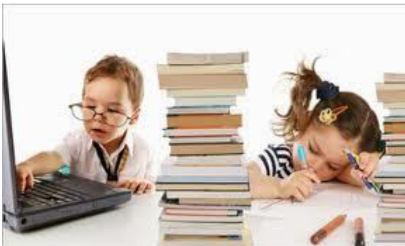
Slika 1. Djeca i čitanje.

Djeci treba početi čitati od najranije dobi jer ih potiče na razmišljanje, razvija maštu, kreativnost, kritičko razmišljanje te obogaćuje njihov rječnik. Predškolskom je djetetu slikovnica prvi prozor u svijet, prvi udžbenik i prva umjetnička knjiga. O prvom susretu djeteta sa slikovnicom i koliko je slikovnica bila prisutna u najranijoj dobi ovisit će i njegov odnos kao učenika, a i poslije u životu, prema knjizi. Zato naviku čitanja treba razvijati i njegovati. Roditelj koji čita svojem djetetu ne potiče samo osjećaje uzajamnosti i bliskosti, nego ga i uči razumijevanju vlastitih i tuđih osjećaja, shvaćanju i prihvaćanju socijalnih načela i odnosa, potiče razvoj govora, zapažanja, pamćenja i zaključivanja. 1