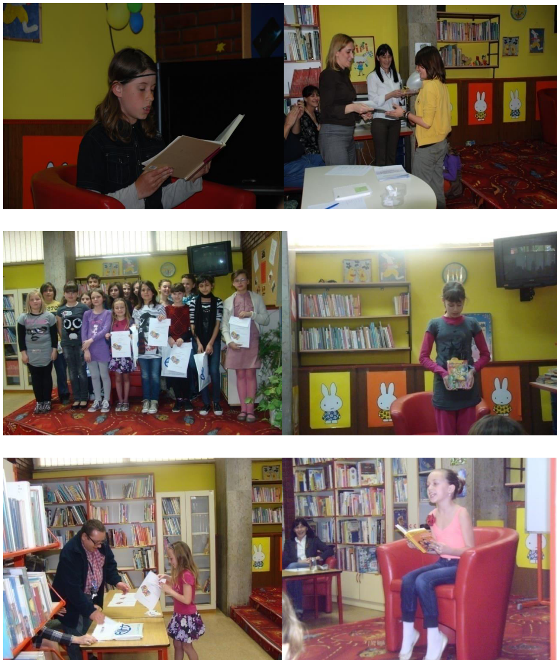
Slika 10. Natjecanje u čitanju naglas 2013.

Dugi niz godina namjera je bila proširiti natjecanje na razinu Županije, no to nije bilo moguće iz financijskih razloga.