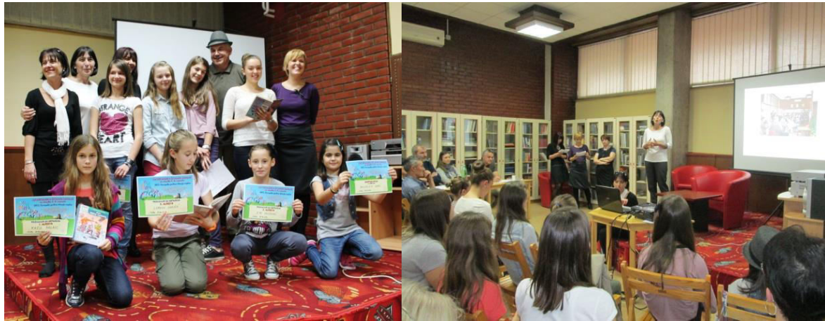
Slika 12. 1. županijsko natjecanje u čitanju naglas, 2013.

svoje omiljene knjige te naglas pročitale odabrane ulomke. Prema pravilima i kriterijima natjecanja Prosudbena komisija odabrala je pobjednice u dvije kategorije koje su predstavljale Sisačko-moslavačku županiju, među 14 hrvatskih županija, na 1. nacionalnom natjecanju u čitanju naglas i borile se za laskavu titulu nacionalnog pobjednika.