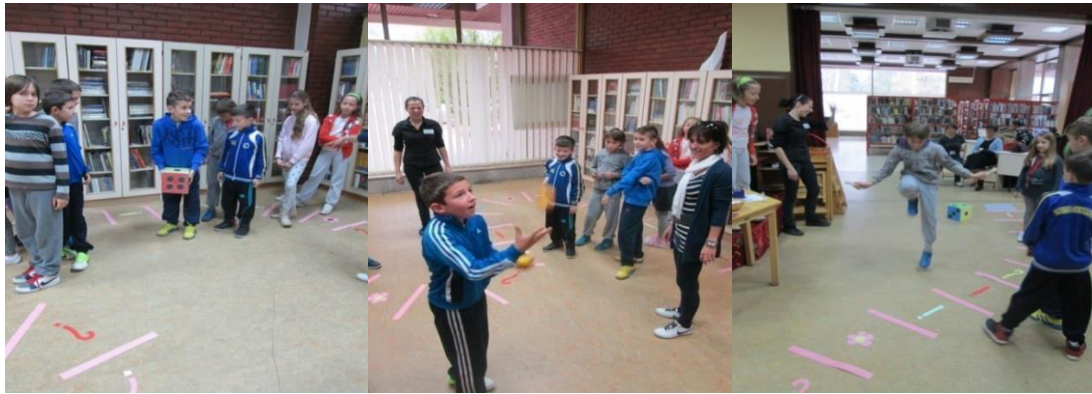
Slika 4. Pomozi Hlapiću doći do cilja.

Od 2010. godine, u sklopu Dječjeg odjela Ogranka Caprag, pod stručnim vodstvom voditeljice Dječjeg odjela Dragane Čubrilo Bila, djeluje Čitateljski klub za djecu od 6 do 10 godina s ciljem razvijanja čitateljskih vještina i motivacije djece za čitanjem, a od 2013. godine i novinarska grupa Mali novinari . Istraživanjem, pisanjem i kreativnim stvaranjem kroz druženje i igru mala grupa entuzijasta, četiri puta godišnje izdaje časopis pod nazivom Mali radoznalci u kojem obrađuju različite, njima aktualne teme, a namijenjene su djeci i njihovim roditeljima, kao na primjer: intervjui s učiteljima, kulinarski recepti, moda, sport, glazba, kulturna događanja, zdravstveni savjeti.