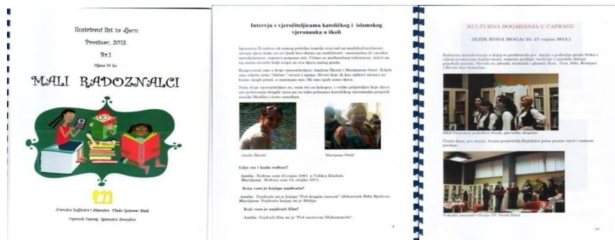
Slika 5. Časopis Mali radoznalci .

Od 2010. godine, u sklopu Dječjeg odjela Ogranka Caprag, pod stručnim vodstvom voditeljice Dječjeg odjela Dragane Čubrilo Bila, djeluje Čitateljski klub za djecu od 6 do 10 godina s ciljem razvijanja čitateljskih vještina i motivacije djece za čitanjem, a od 2013. godine i novinarska grupa Mali novinari . Istraživanjem, pisanjem i kreativnim stvaranjem kroz druženje i igru mala grupa entuzijasta, četiri puta godišnje izdaje časopis pod nazivom Mali radoznalci u kojem obrađuju različite, njima aktualne teme, a namijenjene su djeci i njihovim roditeljima, kao na primjer: intervjui s učiteljima, kulinarski recepti, moda, sport, glazba, kulturna događanja, zdravstveni savjeti.