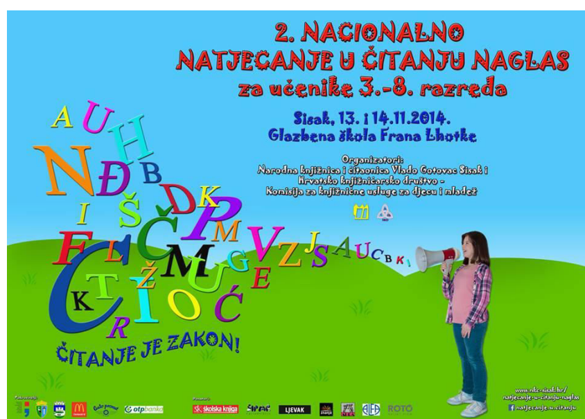
Slika 14. Plakat 2. nacionalnog natjecanja u čitanju naglas.

Velik odaziv natjecatelja, pozitivni osvrti članova Prosudbenih komisija i osmijesi na licima pobjednika, ali i sudionika bili su poticaj organizatorima za pripremu 2. nacionalnog natjecanja u čitanju naglas 2014. godine. Za mjesto održavanja bio je predviđen Sisak, grad u kojem je priča o čitanju naglas i započela. Formiran je organizacijski tim, počela se formirati financijska konstrukcija praćenjem mnogih natječaja, jasnije su usustavljene upute i pravila za provedbu natjecanja na svim razinama, a izrađeni su i promidžbeni materijali. Facebook stranica te mail adresa Natjecanja postale su ključni kanali komunikacije sa zainteresiranim potencijalnim sudionicima Natjecanja.