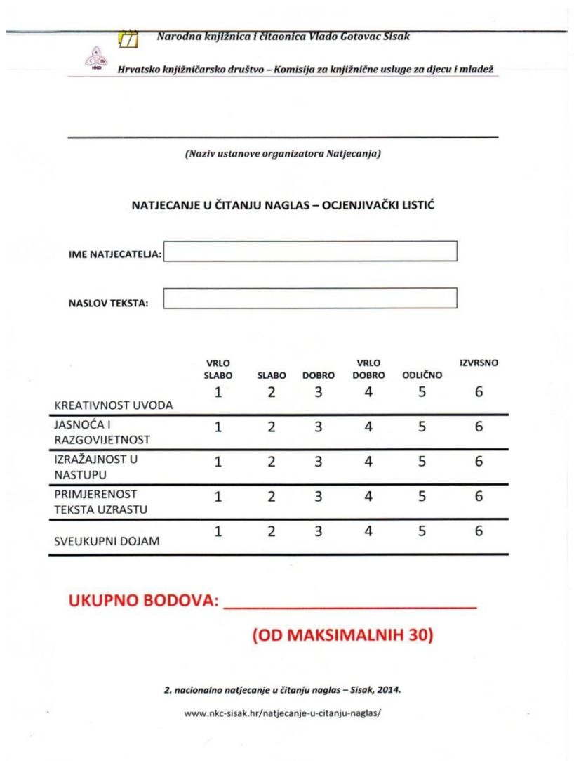
Slika 7. Ocjenjivački listić.

Kriteriji ocjenjivanja kandidata uključuju kreativnost uvoda, jasnoću i razgovijetnost čitanja ulomka, izražajnost u nastupu, primjerenost teksta uzrastu te sveukupni dojam. Ovi parametri samo su smjernice, a ocjenjuju se ocjenama od 1 do 6 te konačnu odluku donosi Prosudbena komisija sastavljena od tri člana. U Prosudbenim su se komisijama tijekom godina održavanja sisačkog gradskog natjecanja izmijenjivali ugledni sisački kulturni djelatnici profesionalno vezani uz knjigu, čitanje i kazališnu umjetnost. 22