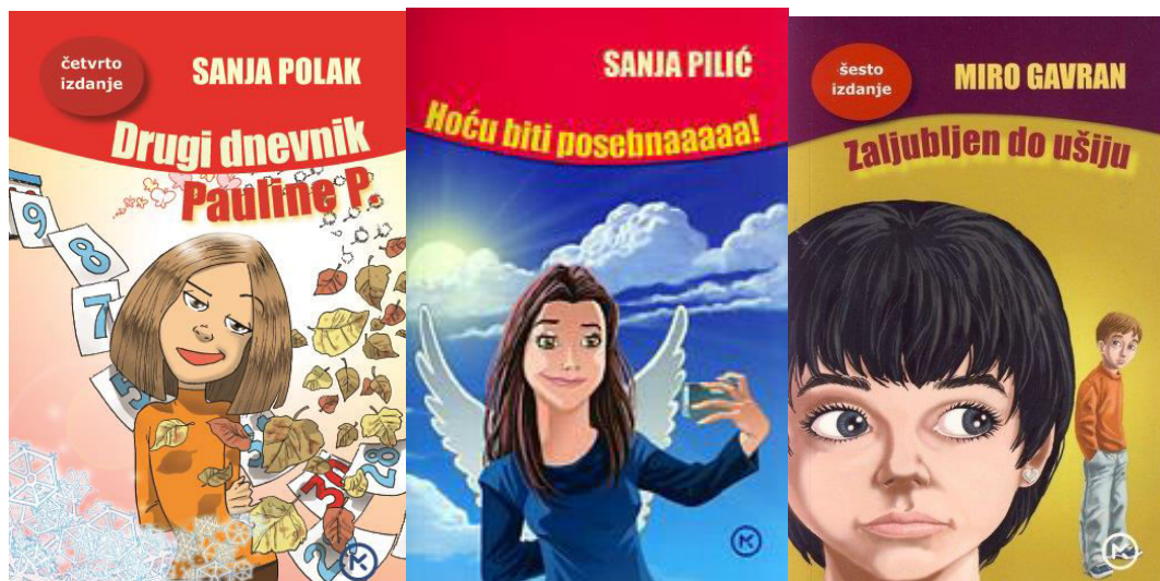
Slika 21. Najčitanije knjige Natjecanja.

Tijekom osam godina provođenja gradskih natjecanja u Sisku, odabirani su najčešće naslovi suvremenih tema i zabavnog sadržaja, s dosta dijaloga koji su djeci i njihovim interesima bliski, poput Sanje Pilić, Sanje Polak, Mire Gavrana i sl.