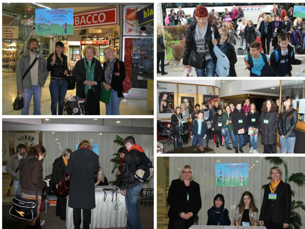
Slika 15. 2. nacionalno natjecanje u čitanju naglas.

2. nacionalno natjecanje u čitanju naglas održano je 13. i 14. studenoga 2014. godine. Svečanost natjecanja odvijala se u dvorani Glazbene škole Frana Lhotke koja svojom vizualnom estetikom i akustikom zadovoljava potrebe ovakvog natjecanja. Predstavnici mlađe i starije kategorije i njihovi mentori iz 16 županija dočekani su u hotelu Panonija u Sisku.