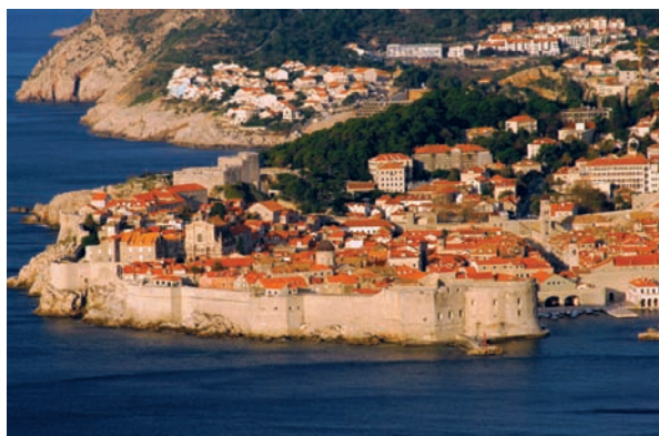
Slika 15. Dubrovnik – panorama povijesne jezgre. Figure 15: Dubrovnik – panorama of the historical core.