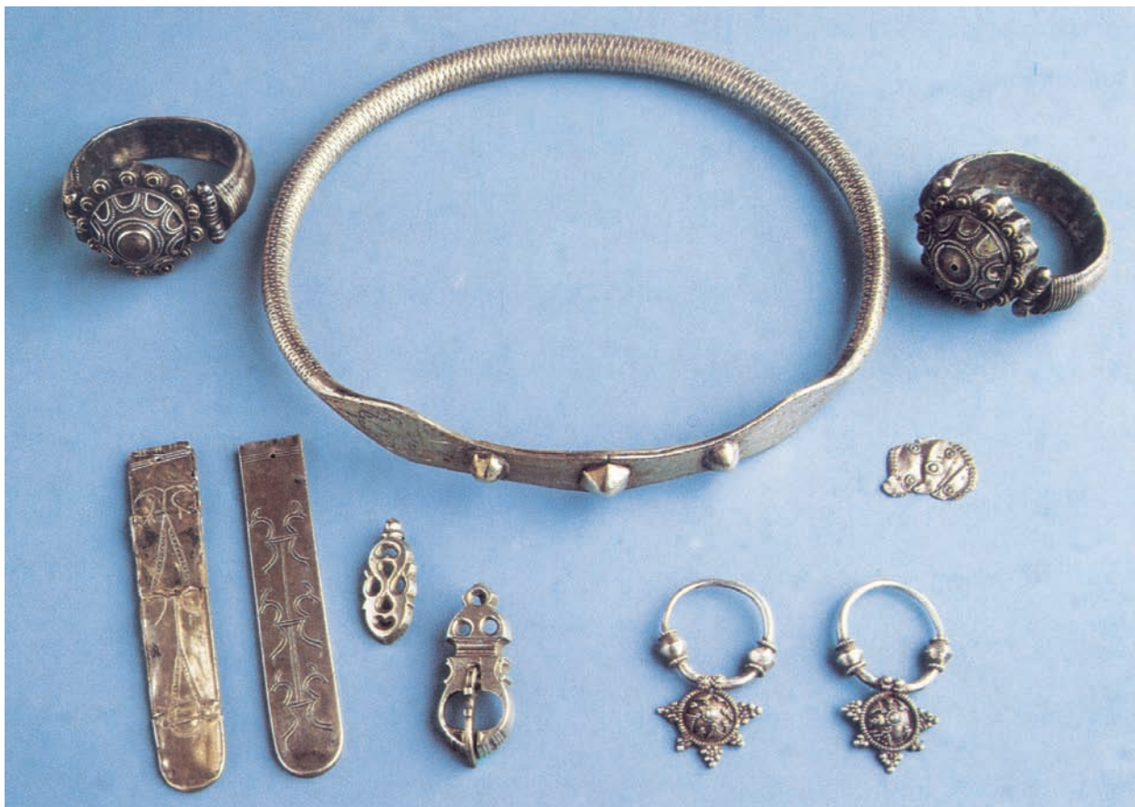
Slika 3. Čađavica, nalazi iz kneževskog groba (Milošević et al. 2001: 81).

was published for the first time several years earlier in the journal Archaeologia Jugoslavica (Vinski 1954: 78, fig. L), on which basis J. Werner included it in his supplemented overview of Slavic bow fibulae (Werner 1960: 118–119). Since the number of Slavic finds from the end of the sixth and beginning of the seventh centuries has thus far not increased significantly in the Croatian portion of the Drava, Sava and Danube interfluvium—with exceptions such as the incineration graves from Vinkovci (Tomičić 2000: 142–147), the discoveries about which Vinski wrote are still the focus of attention. With reference to the proposed cultural affiliation of these discoveries to the Martynovka circle, it can be established that in the contemporary literature, a more certain attribution of this circle to Slavic finds has emerged. While N. Fettich once interpreted the Martynovka circle without mentioning its association with the Slavs (Fettich 1941–1942), in more recent years, based on a series of Martynovka type discoveries in proven Slavic settlements and cemeteries in Ukraine (Prichodnjuk 1994), the Martynovka circle is associated with the historically proven Antes. In this context, the Čađavica find can also be attributed to the Antes with greater certainty than was possible in the 1950s, and interpreted as an archaeological indicator of the direction of Slavic movement.