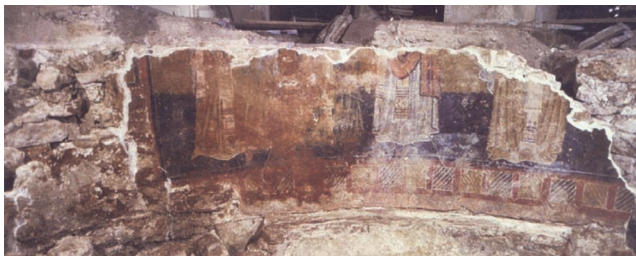
Slika 10. Katedrala u Dubrovniku, apsida bizantske bazilike (Durman 2006: 123).