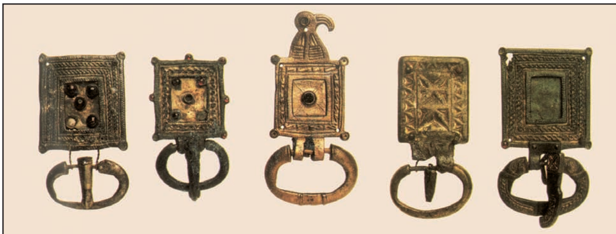
Slika 4. Pojasne kopče 6. stoljeća s lokaliteta Knin – Greblje i Unešić (Milošević et al. 2001: 34).

An article by Ivana Iskra-Janošić on graves discovered at the Meraja site in Vinkovci also deals with the problem of the Bijelo Brdo culture complex (Iskra-Janošić 1997). Continuing earlier research conducted by Stojan Dimitrijević, in which the foundations of a small early Romanesque church and approximately one hundred graves were discovered (among them several Bijelo Brdo graves), in her research Iskra-Janošić discovered a larger number of late medieval and early modern era graves and two graves from the late period of the Bijelo Brdo culture. The site is also interesting because it provides an opportunity to study the relationship between Bijelo Brdo graves