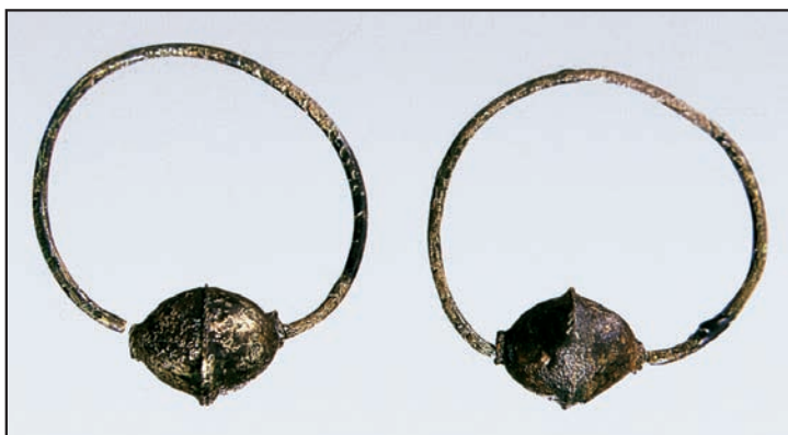
Slika 6. Jednojagodne naušnice s groblja Stranče – Gorica kod Crikvenice (Cetinić 1998: 106–50). Figure 6. Single-bead earring from the Stranče – Gorica cemetery near Crikvenica (Cetinić 1998: 106–50).