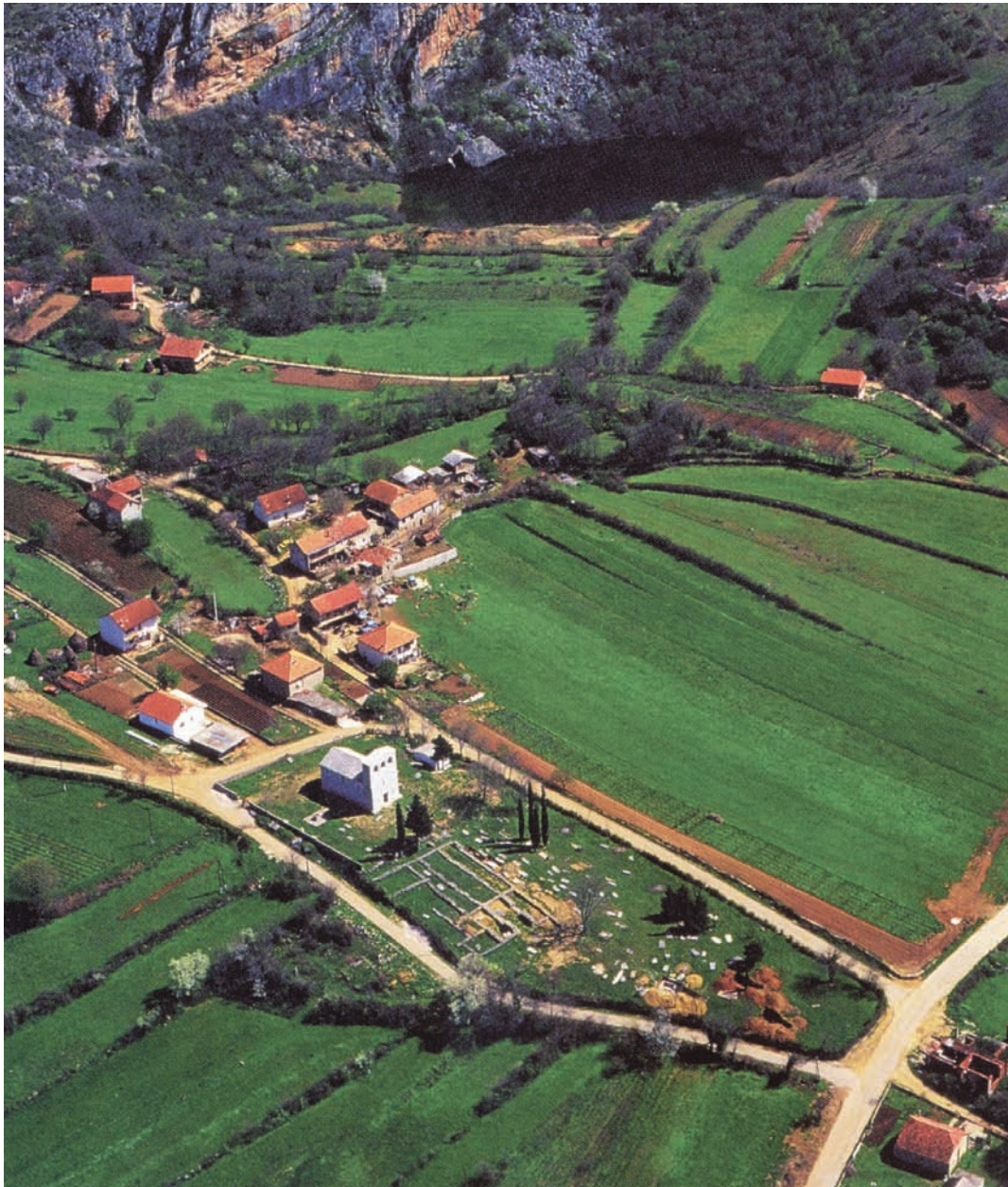
Slika 1. Crkvina u Biskupiji, crkva Sv. Marije s grobljem (Durman 2006: 95).

the development of various thematic units within medieval archaeology, such as, for example, the typological classification of church architecture and the study of sculpture and grave finds.