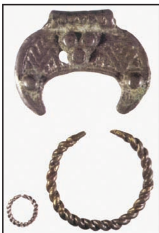
Slika 5. Bijelo Brdo, srednjovjekovni nakit (Durman 2006: 91). Figure 5. Bijelo Brdo, medieval jewellery (Durman 2006: 91).