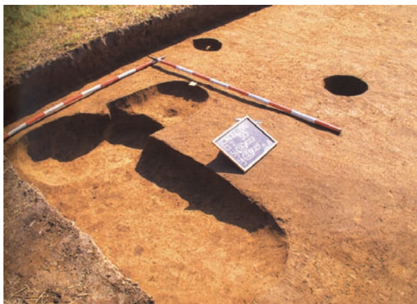
Slika 13. Torčec, ranosrednjovjekovno naselje (Mesić 2004: 65). Figure 13. Torčec, early medieval settlement (Mesić 2004: 65).

zanimljiv primjer u tom kontekstu pojavljuje se primjer Dubrovnika, u kojemu je urbana arheologija u pravome smislu pozvana riješiti pitanje razvoja grada od njegovih prvih početaka do završetka srednjovjekovnoga razdoblja. Jedno od nekada otvorenih pitanja vezanih uz razvoj Dubrovnika – pitanje o vremenu nastanka ranoga naselja na mjestu današnje povijesne jezgre grada – već je prije nekoliko desetljeća zahvaljujući arheološkim nalazima sigurno riješeno. Naime, kako je već u jednome davno napisanu radu o kasnoantičkim nalazima s područja Dubrovnika nagovijestio Cvito Fisković (1958–1959), rano naselje na području Dubrovnika nastalo je znatno ranije od doseljavanja stanovnika