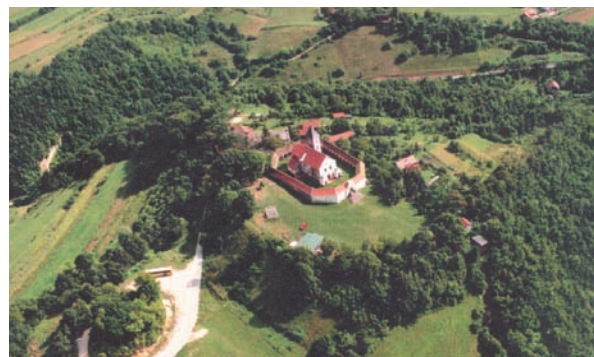
Slika 14. Lobar, svetište Majke Božje Gorske (Durman 2006: 157). Figure 14: Lobar; Shrine of the Madonna of the Mountains (Dman 2006: 157).

The medieval phases in the lives of the cities of Antiquity are an important component of research in urban archaeology. In the case of the large Dalmatian cities, Zadar and Split, the urban cores of the Late Antiquity were preserved into the Middle Ages. The expansion of the urban space that occurred during the Middle Ages in both cities can be clearly followed (Petricioli 1965; Marasović 1980). In these cities, as in most other Dalmatian cities of Antiquity, the location of the earliest urban core is well known, and the relationship between the medieval city and the initial urban core can thus be followed. A particularly interesting example in this context is the example of Dubrovnik, in which urban archaeology in the authentic sense is called upon to resolve the question of the city's development from its very beginnings to its completion in the medieval period. One of the formerly open questions associated with Dubrovnik's development – the question of the establishment of an early settlement at the site of today's historical urban core – was definitively resolved several decades ago thanks to archaeologi-