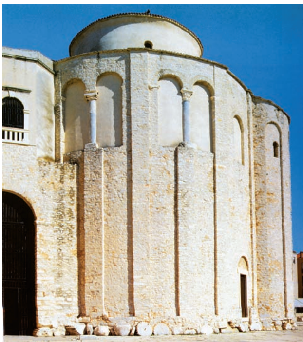
Slika 8. Sv. Donat (Vežić 2002: 56). Figure 8. St. Donatus (Vežić 2002: 56).

Možda najbolji primjer koji govori o ranome nastanku nekih oblika predromaničke arhitekture crkva je Sv. Donata u Zadru. U starijoj literaturi smatrana tipičnom karolinškom rotundom i datirana u početak 9. stoljeća, danas je, zahvaljujući brojnim istraživanjima i otkrivenoj građi, njezin nastanak pomaknut u ranije doba, vjerojatno u drugu polovinu 8. stoljeća, kada se može datirati njezin prvobitni sloj, koji je zatim, vjerojatno u prvoj polovini 9. stoljeća, dobio konačnu formu složene rotunde s galerijom iznad kružnog ambulatorija (Vežić 2002).