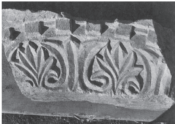
Slika 11. Dio lučnog nadvoja s motivom palmeta – crkva Uznesenja Blažene Djevice Marije u Gori (Miletić 1996–1997: 141).

Knowledge of the early emergence of a larger number of early medieval buildings in Istria fit in well with previous observations. All of these examples point to the importance of events during the seventh and eighth centuries, to which the later time of the ninth century is continually linked.