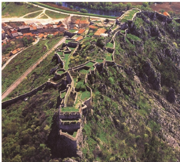
Slika 12. Knin, tvrđava (Durman 2006: 61). Figure 12. Knin, fortress (Durman 2006: 61).

(Petricioli 1965; Marasović 1980). Kod tih gradova, kao i kod većine drugih antičkih gradova u Dalmaciji, dobro je poznat položaj najranijega gradskog središta, i može se pratiti odnos srednjovjekovnoga grada spram prvotne gradske jezgre. Kao posebno