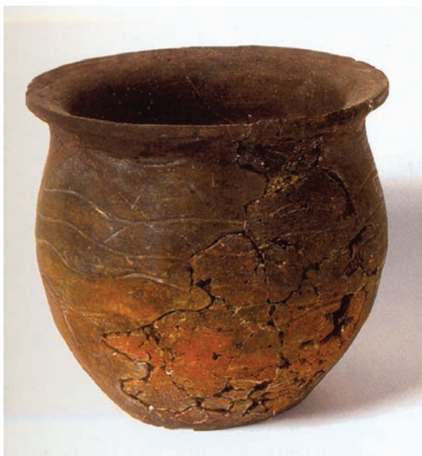
Slika 2. Posuda iz groba u Žminju (Milošević 2000: 77).

Već 50-ih godina 20. st. došlo je do istraživanja važnoga starohrvatskog groblja u Žminju (Bačić 1958). To je groblje, koje svjedoči o prisutnosti hrvatskoga stanovništva u Istri, kasnije monografski obradio B. Marušić (1987a).