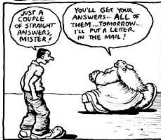
Slika 3. Mr. Natural (R. Crumb)

Njegovi kontrakulturni stripovi bili su sušta suprotnost svemu što je Comics Code propisivao. Bili su hiperseksualizirani, nasilni i prikazivali su konzumaciju alkohola i droga. Unatoč često lascivnom sadržaju čiji je cilj bio šokirati, Crumbovi su stripovi su zapravo inteligentni i duboko kritični spram modernog američkog društva.