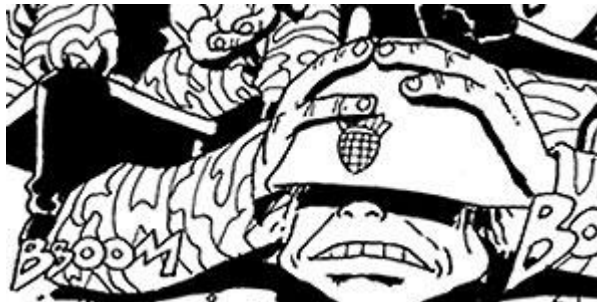
Slika 9. Mudraci (Štef Bartolić)

Nema sumnje da je analizirane stripove moguće vidjeti i kao propagandne uratke. Takva se propaganda pokušala prilagoditi ukusu i vrijednostima velikog dijela mladih. S druge strane, stripu je svojstveno da apsorbira i na sebi svojstven način probavlja informacije iz drugih medija, što svakako valja imati na umu pri analizi, a pogotovo analizi stripova publiciranih u doba rata. 31