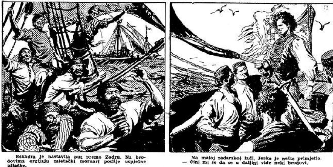
Slika 5. Maurovićevo umijeće

Maurovićev vrhunski talent legitimirao je hrvatski strip kao ravnopravan novi medij koji ni u čemu ne zaostaje za preookeanskim ostvarenjima te se može reći da čak može ravnopravno stajati s velikanima realizma poput Hala Fostera.