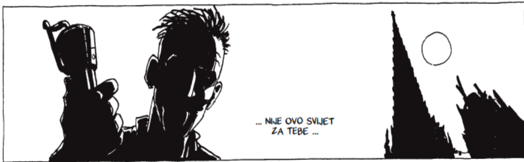
Slika 10. Zagrebačka katedrala nakon apokalipse (Edvin Biuković)