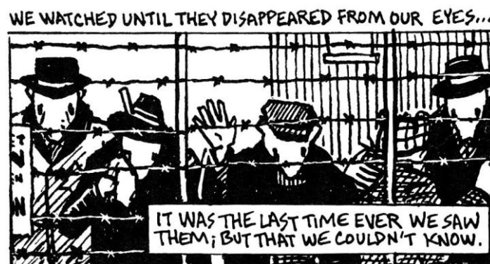
Slika 4. Snaga metafore

Dodatno prepoznavanje stripa kao umjetnosti došlo početkom 90- ih. Biografski strip Maus Arta Spiegelmana izlazio je u strip časopisu RAW od 1980. do 1991.godine. Glavni lik stripa je Vladek Spiegelman, autorov otac, Poljak koji preživio II. Svjetski rat i koncentracijski logor. Maus je istovremeno biografija i autobiografija jer postoje dvije narativne struje: ona Vladeka i njegovog života i paralelna radnja koja se dešava u vremenu kada ga sin intervjuira o vremenu provedenog za vrijeme rata. Maus je također metastrip ili strip o stripu jer je tijekom izlaženja Spiegelman svoj rad na njemu komentirao u samom djelu.