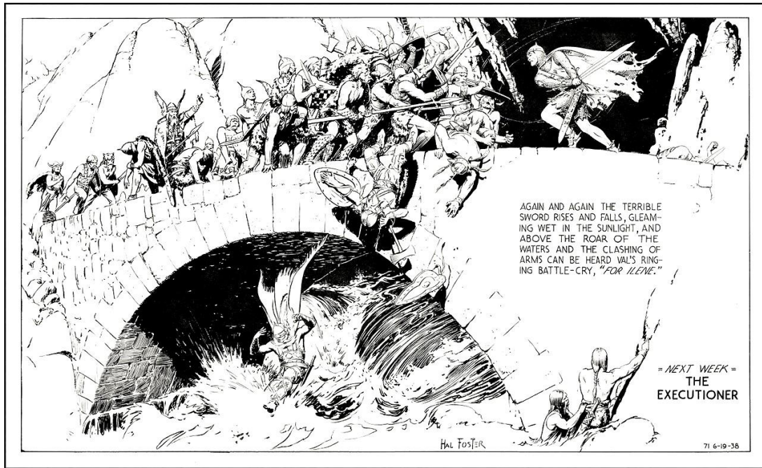
Slika 2. Princ Valiant

http://www.neogaf.com/forum/showthread.php?t=650895