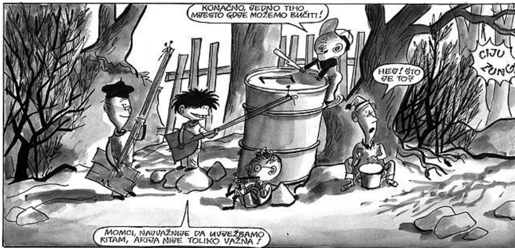
Slika 7. Štefekove pustolovine