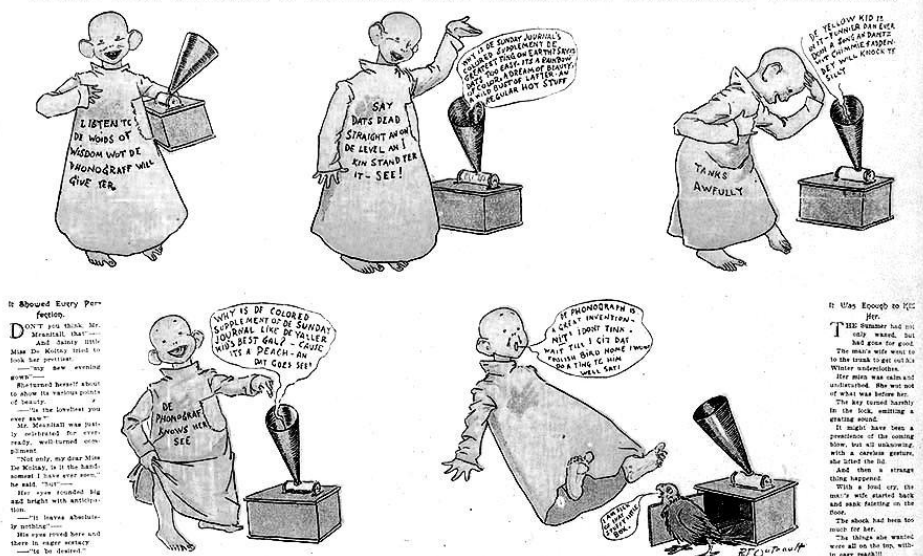
Slika 1. Tabla Žutog Dječaka

http://xroads.virginia.edu/~ma04/wood/ykid/imagehtml/yk_phonograph.htm