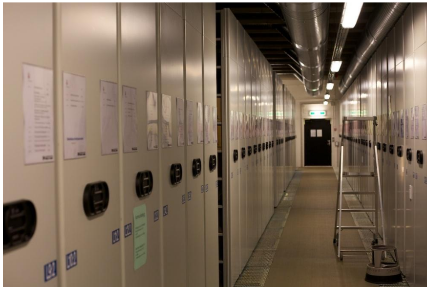
Slika 11. Spremište arhiv stripa u Malmöu

U Švedskoj postoji Svenskt Seriearkiv (Švedski arhiv), arhiv osnovan 2003. posvećen isključivo stripu koji djeluje u sklopu Seriefrämjandet (Švedsko udruženje stripa) koje je 2005. također osnovalo i Seriecenter (Centar za strip) u Malmöu.