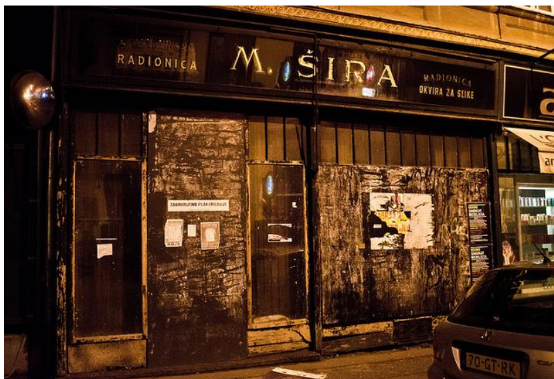
Slika 2. Radionica Šira u Preradovićevoj 13

Osim prirode koja im je pružala mogućnost kreacije bez pravila i granica, predstavnici Gorgone su formirali pionirski prostor izlaganja u pogledu izvaninstitucionalnog pozicioniranja suvremene umjetnosti. Salon G (Salon Šira) u Preradovićevoj ulici 13 u Zagrebu bio je prostor prvih samoorganiziranih izložbi koji je donosio novo promišljanje izložbenog aspekta umjetničke djelatnosti. 19 Članovi Gorgone od 1961. do 1963. vodili su Studio G u prostoru koji je u to vrijeme paralelno funkcionirao kao radionica okvira za slike. Na taj su način mogli djelovati neovisno od bilo kakve institucije, a svi troškovi organizacije izložbi (uređenje prostora, plakati, katalogi) pokriveni su iz zajedničke blagajne društva, od članarine koja je prikupljena na pomalo bizaran način: blagajna Gorgone bila je kod jedne prodavačice knjižare "Naprijed" kojoj je svaki član uplaćivao iznos prema svojoj trenutnoj financijskoj situaciji, a isto je tako iz blagajne mogao uzeti potrebnu mu sumu. Iz tog fonda pokriveni su, osim troškova izložbi i tiskanja publikacije, i svi ostali eventualni izdaci. 20