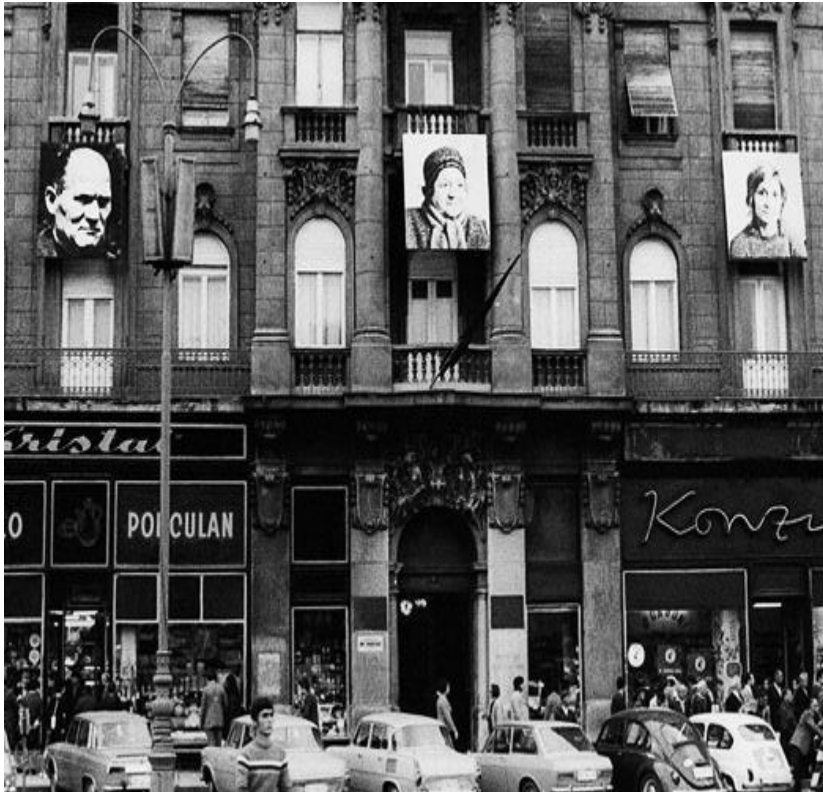
Slika 5. Braco Dimitrijević, "Slučajni prolaznici koje sam sreo u 13.15, 16.23 i 18.11", Zagreb 1971.

Godine 1969. Braco Dimitrijević je na pročeljima zgrada u Zagrebu izvjesio šest portreta dimenzija 2 x 3 metra. Osobe je odabrao na osnovu slučajnosti, a radove izložio ne pojašnjavajući kriterije svog odabira niti identitet portretiranih osoba. Ono što je u ovome radu od izuzetne važnosti jest upravo javni prostor, koji nije slučajan, koji ne priznaje pravila kulturnih institucija, a opet funkcioniра po nekim društveno-političkim konvencijama. Dimenzije samog rada čine ga monumentalnim i sličnim načinu kako se u javnom prostoru predstavljaju državnici (u ovom slučaju možemo govoriti o Josipu Brozu Titu), a ne slučajno odabrane osobe. Arbitrarnost pri određivanju nekog slučajnog prolaznika kao dovoljno važnog da se njegov portret izvjesi na pročelju u centru grada parafraza je mnogo manje transparentnih, ali isto tako arbitrarnih kriterija vrijednosti kojima se vode stručnjaci pri odabiru radova i umjetnika koje će smjestiti unutar svoga kanona i upisati ih time u povijest umjetnosti. Slučajnim prolaznikom "pokušava se stvoriti napuklina u pažljivo konstruiranoj zgradi historije, i izmijeniti odgojem i tradicijom usađeni refleks da poruke stavljene u