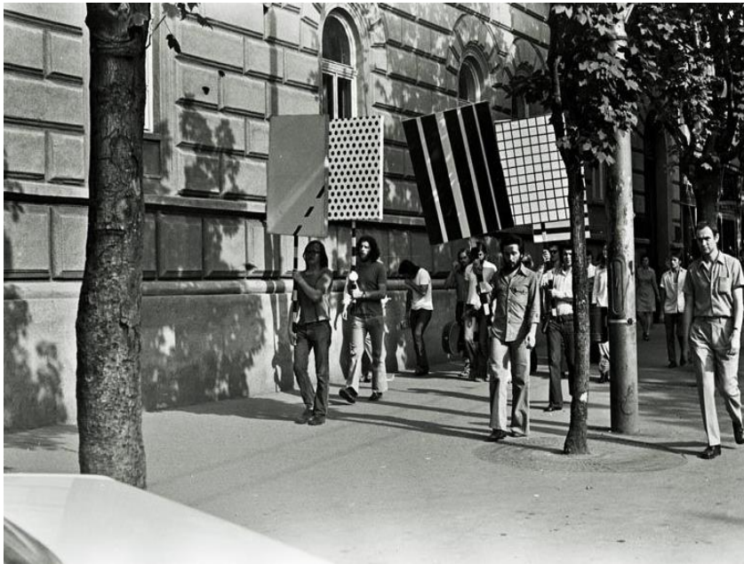
Slika 7. Grupa TOK, performans u Beogradu, 1973.