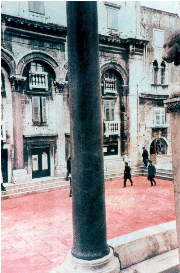
Slika 3. Peristil obojen u crveno, 11. siječnja 1968.

Akcija Crvenog Peristila, u kojoj su osmorica mladića u siječnju 1968. prebojali središnji splitski trg Peristil, reprezentativni spomenik antičke rimske kulture, postala je jednom od urbanih legendi grada Splita, ali i cjelokupne povijesti hrvatske umjetnosti. Akcija je često bila predmetom rasprava koje su tražile odgovor na pitanje o karakteru njezine