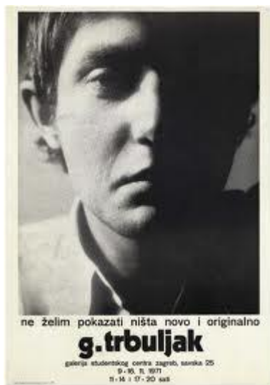
Slika 6. Plakat za izložbu "Ne želim pokazati ništa novo i originalno" Gorana Trbuljaka, Galerija SC

tradicionalni odnos umjetnik-pokrovitelj – da pozove lorda Weymoutha da dođe u Zagreb i oslika zidove njegove garsonijere na Knežiji. U ovom radu se ističe suptilnost njegove poruke jer se na prvi pogled može činiti da je riječ o demokratizaciji umjetnosti, o nekome tko je izvan umjetničkog svijeta a ipak ima pristup kulturnim praksama. Ipak, kada se promotri s klasne pozicije jasno je da su češći slučajevi u kojima pripadnici elitne i dominantne kulture dobivaju pristup tzv. niskoj kulturi nego oni gdje se događa obratno. Neproporcionalnost pristupa kulturi i umjetnosti za različite klase nije ukorijenjena samo u mehanizme institucije umjetnosti, nego se proteže i čitavim društvom.