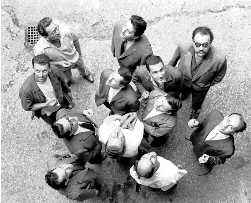
Sl. 1. Grupa Gorgona, prva polovica 1960-ih

Dok se EXAT 51 pojavljuje s manifestom, 12 Gorgona se, kao istinski prethodnik neprogramatskih skupina umjetnika, ne javlja već samo postoji, 13 a ipak je svojom egzistencijom obilježila vrijeme nakon svog djelovanja do danas.