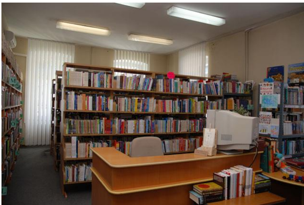
Slika 3. Narodna knjižnica Buzet – posudbeni odjel

Zahvaljujući novom knjižničnom sustavu, bužetska knjižnica svojim sugrađanima omogućuje pretraživanje građe putem web kataloga koji se nalazi na stranici: www.poubuzet.zaki.com.hr , a dostupan je preko naslovne stranice www.poubuzet.hr .