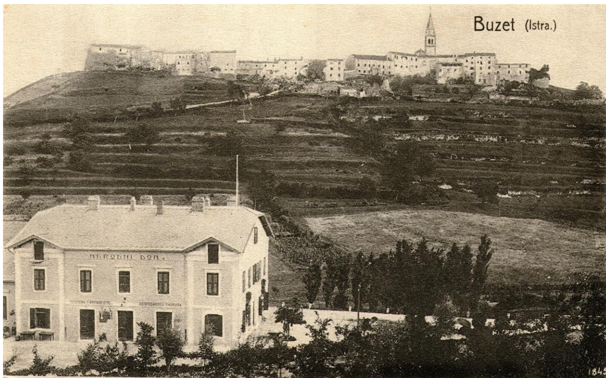
Slika 1. Razglednica s motivom Narodnog doma 22

Od početka djelovanja 1888. godine (iako je službeno otvorena 6. srpnja 1890. godine 20 ) Hrvatska je čitaonica u Buzetu postala mjesto za naobrazbu, informiranje i razmjenu ideja, mjesto za dogovor i donošenje političkih odluka, organizator kulturnih i zabavnih sadržaja te čvrsti branitelj jezičnog i kulturnog obilježja buzetskih Hrvata. 21