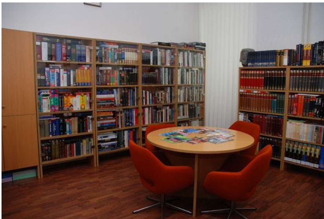
Slika 2. Studijski odjel i čitaonica