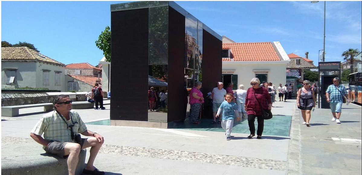
Prostor oko spomenika, Dubrovnik, 13.5.2017.