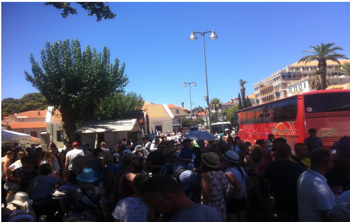
Čekanje transfera, Dubrovnik, 28.7.2017.

Promatrajući ponašanje prolaznika na prostoru spomenika vođena definicijom mjesta sjećanja postavljam si pitanje kako bi se korisnici prostora na takvom mjestu trebali ponašati.