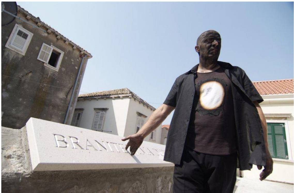
Performans: umjetnik pored spomen ploče, Dubrovnik, 25.8.2007.