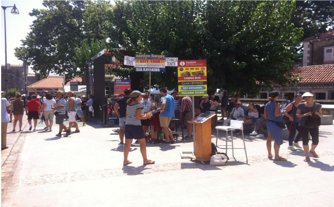
Prostor spomenika i pultevi u ljetnim mjesecima, Dubrovnik, 4.7.2017.

koji ih prevoze do luke ili nekog drugog dijela grada. Promatranje vlastitih odraza ispred velikog „ogledala“, nanošenje kreme za sunčanje, šminkanje, te ponekad i fotografiranje cijele obitelji u zrcalu, česti su prizori koji se mogu doživjeti na prostoru spomenika.