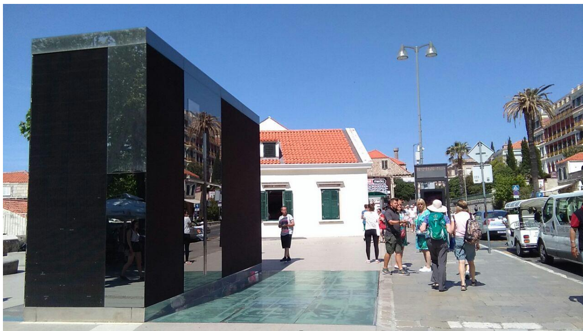
Spomenik dubrovačkim braniteljima, Dubrovnik, 13.5.2017.