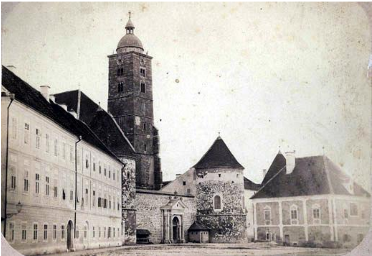
Slika 1 – Katedrala prije potresa 1880. godine.

Neki elementi povijesti Zagrebačke katedrale će bez daljnjih arheoloških iskopavanja ostati nerazjašnjeni, dok će dio njene prošlosti biti „izbrisan“ najvećom obnovom koja će te uslijediti.