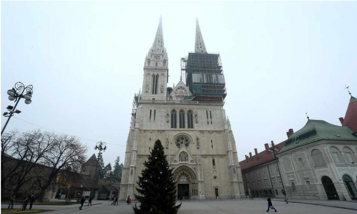
Slika 3 - Zagrebačka katedrala u 2014. godini

U istom članku se navodi da će poruka „ zajedno sa svim starim kamenjem, ornamentima s fasade, dokumentima te fotografijama “ biti smještena u muzej obnove 9 koji bi se trebao otvoriti odmah po završetku katedrale.