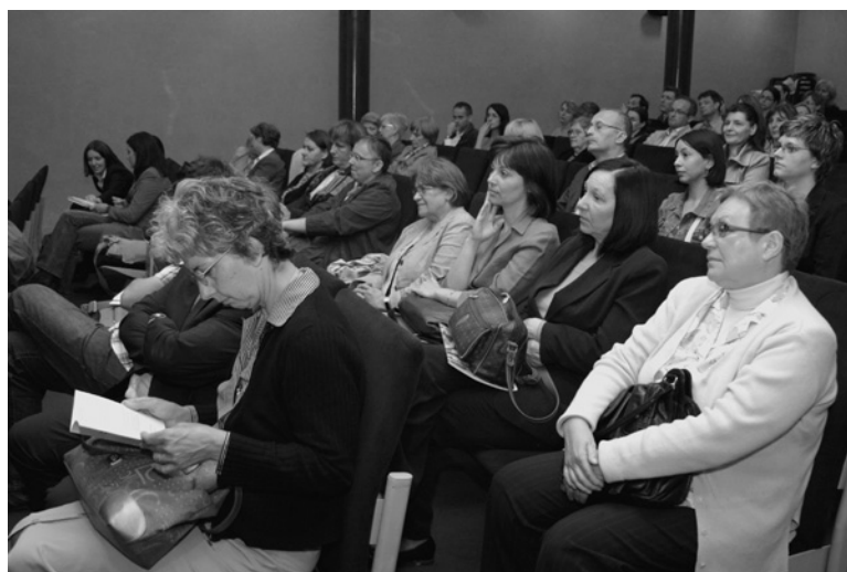
Sudionici svečane skupštine 4. 6. 2009. godine