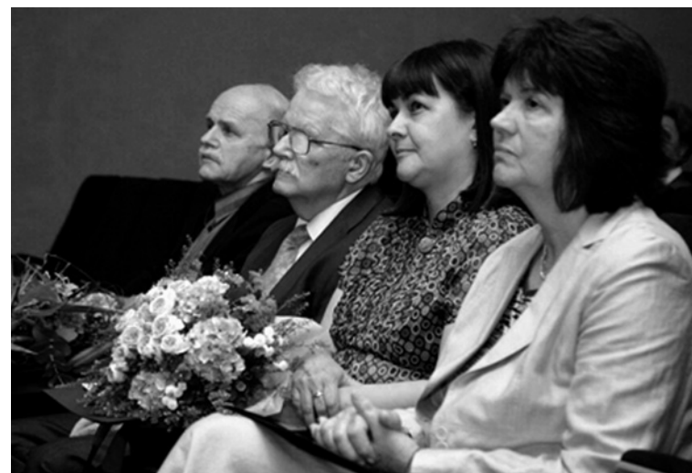
Dobitnici nagrade "Milovan Gavazzi" i uzvanici 4. 6. 2009. godine