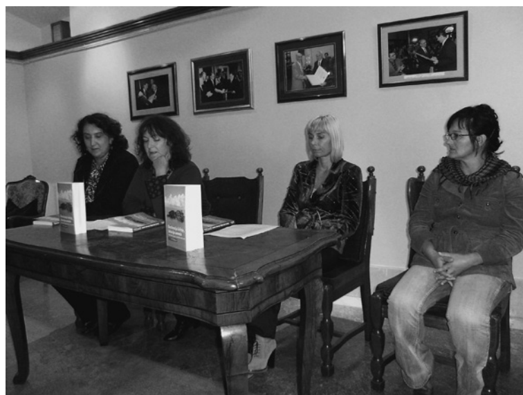
Predstavljanje zbornika Destinacije čežnje, lokacije samoće u Klubu hrvatskih kulturnih radnika u Zagrebu 14. 10. 2009. godine