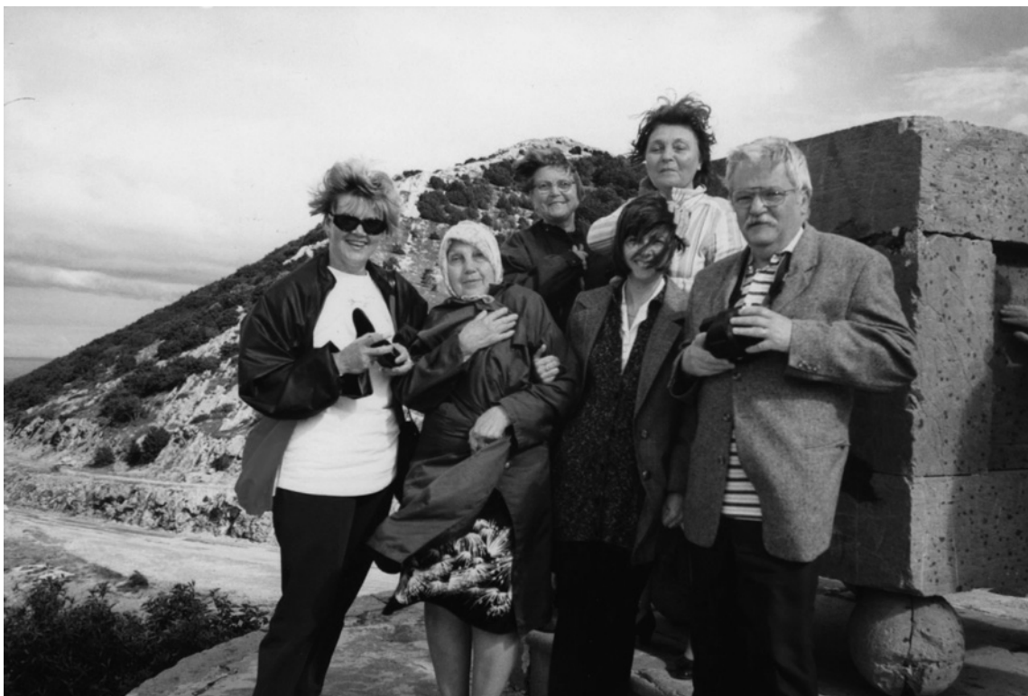
Na velebitskom prijevoju. Godišnji skup HED-a 1998. godine