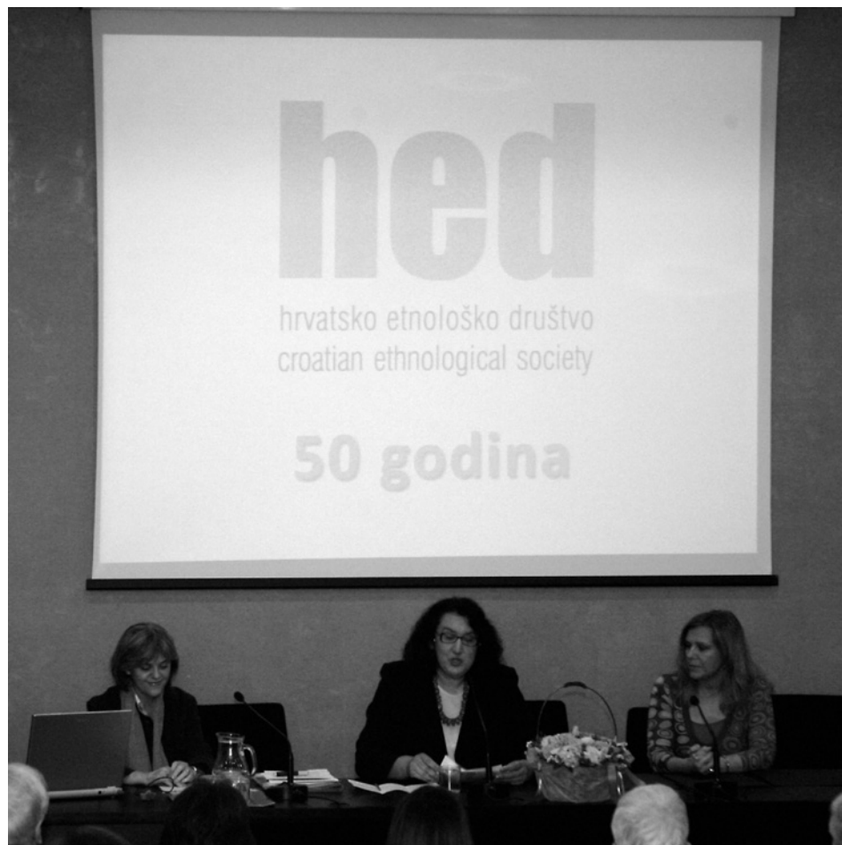
Svečana skupština povodom 50. obljetnice HED-a 4. 6. 2009. godine