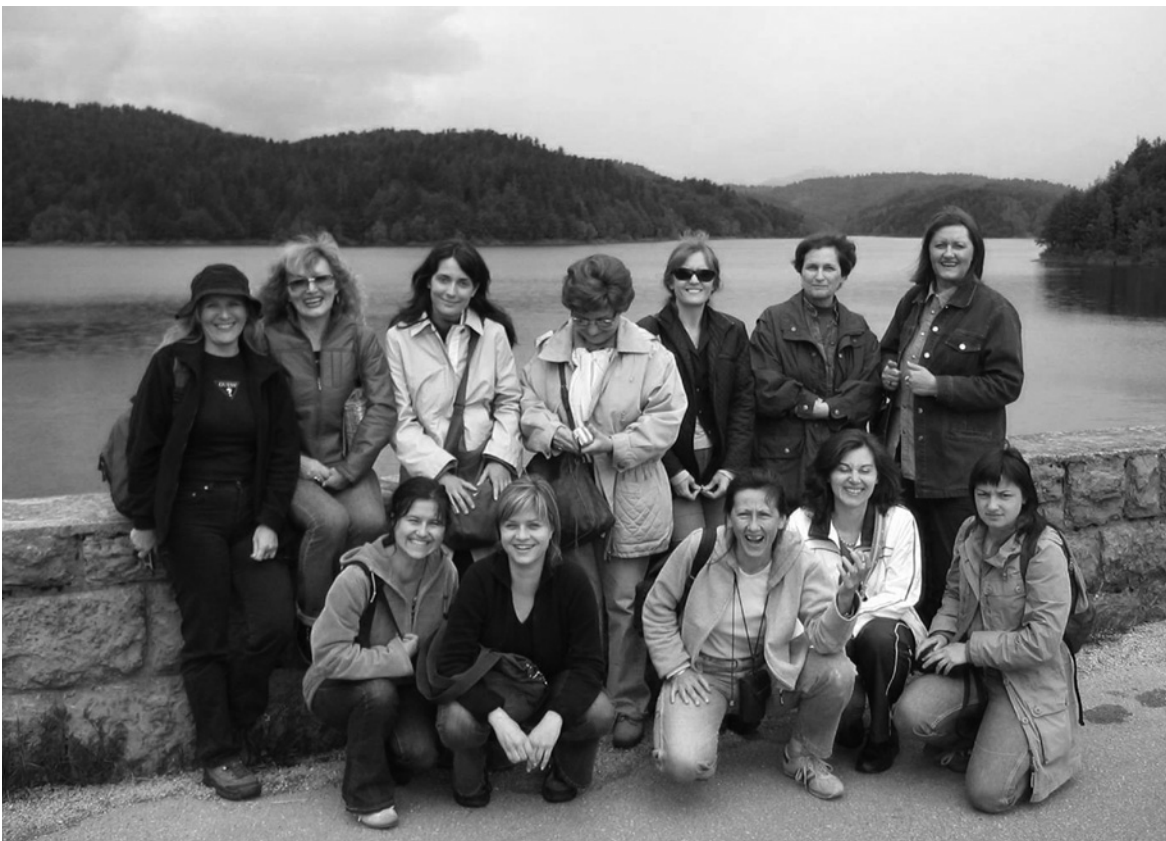
Sudionice godišnjega skupa o baštini Gorskoga kotara u Crnom Lugu 2004. godine