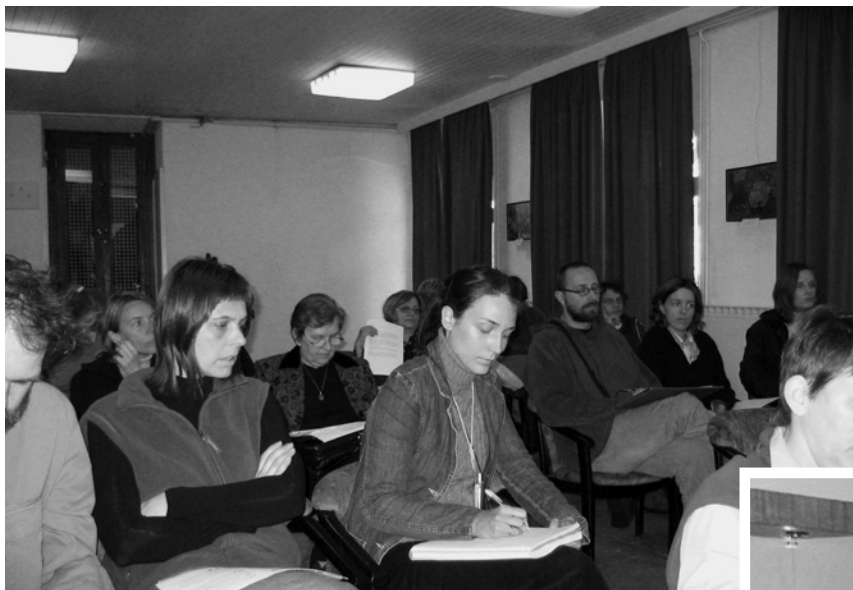
Osme "Hrvatsko-slovenske etnološke paralele" u Motovunu 2004. godine