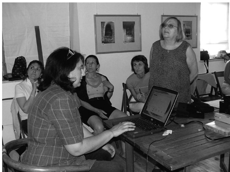
Godišnji skup pod naslovom "Kultura i transformacija: Hrvatska 1945. – 1990." u Lubenicama na otoku Cresu 2005. godine