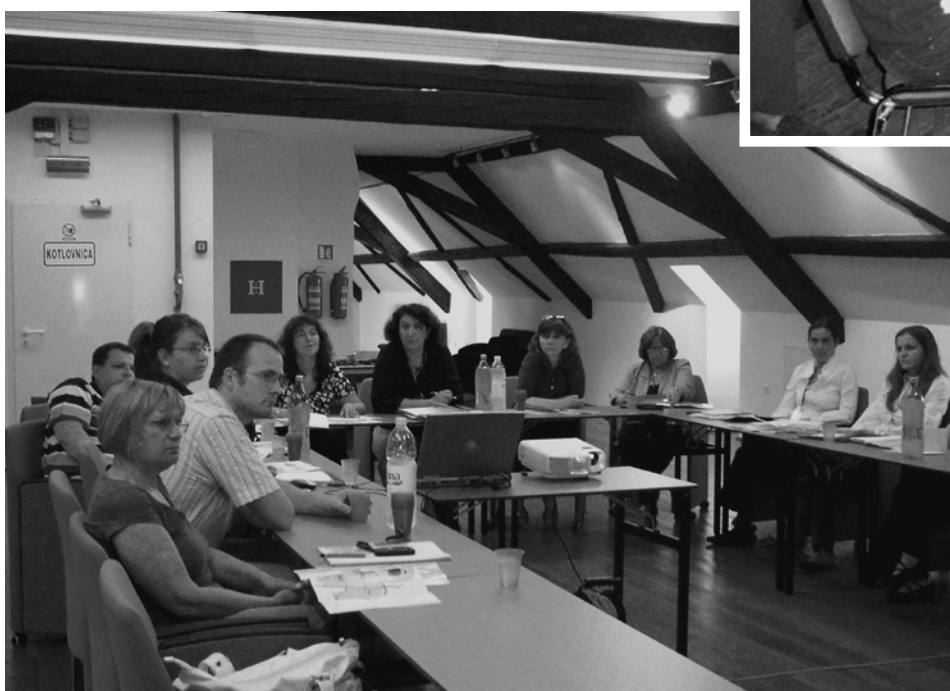
Okrugli stol pod naslovom "Mogućnosti za prijavu međunarodnih projekata" na desetim "Hrvatsko-slovenskim etnološkim paralelama" u Varaždinu 2008. godine