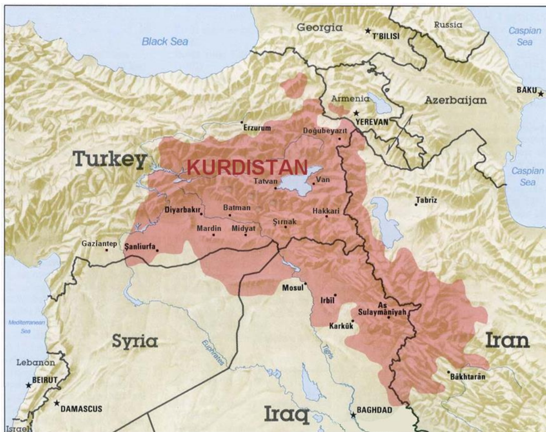
Karta 1. Kurdistan

Kurdi su četvrta najveća etnička grupa na Bliskom istoku i najveća na svijetu bez države. Njihova im je izolacija dozvolila da zadrže odvojeni identitet od država u kojima žive. Međutim, njihova simbiotska veza s okolnim državama uvijek je bila posebnost ovog područja i ta će se kompleksnost zadržati u budućnosti zbog međusobno isprepletenih odnosa naroda na nekoliko razina.