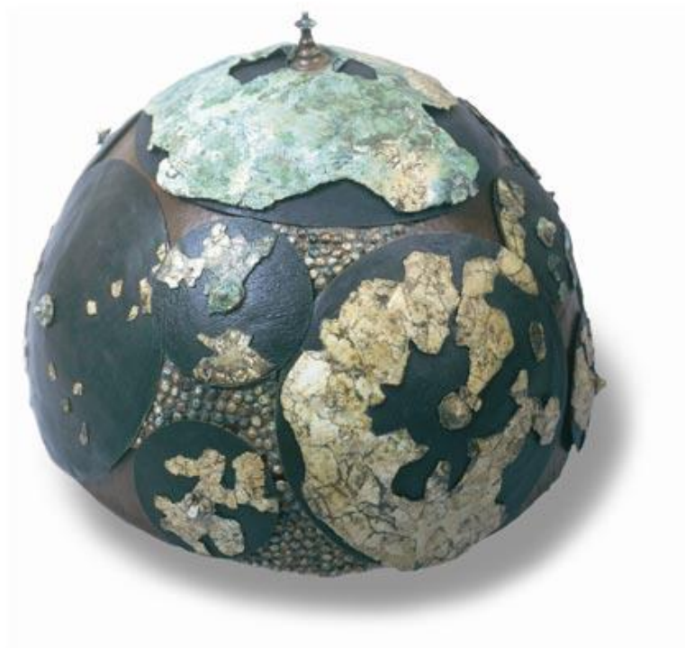
Slika 3. Kneževska zdjelasta kaciga