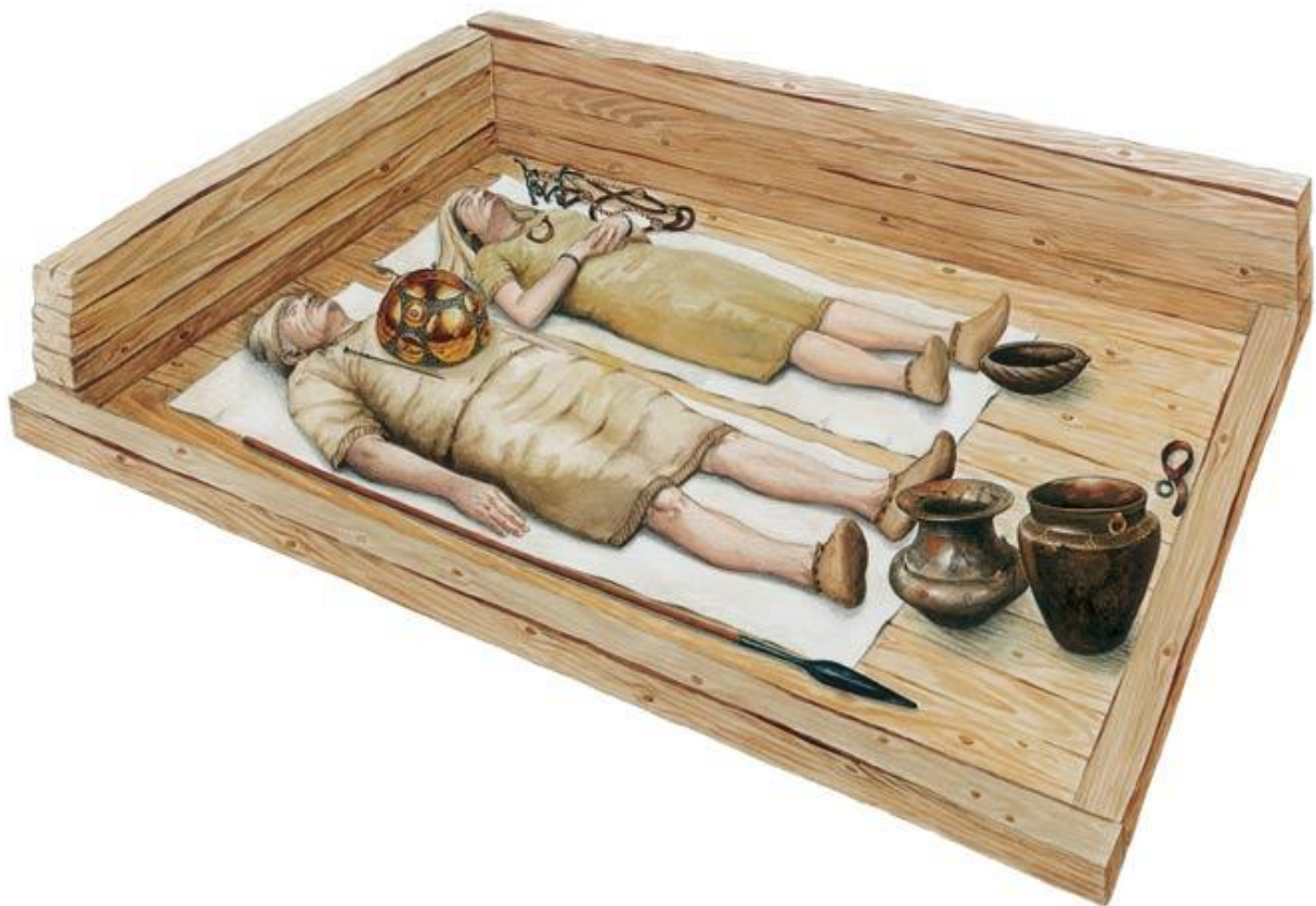
Slika 5. Prikaz kneževskog groba pronađenog u tumulu br. 139

Prilikom iskapanja tumula broj 3 pronađeno je deset grobova, među kojima i prvi kneževski grob sa zdjelastom kacigom. Zahvaljujući tako vrijednom otkriću, 1993. godine započelo je istraživanje tumula broj 139. U njemu je otkriven i drugi kneževski grob (grob 6) sa zdjelastom kacigom. Tumul je bio smješten na sjeverozapadnom rubu nekropole grobnih humaka. Promjer mu je iznosio 19 metara, s dva metra visine. Pored kneževskog ratničkog groba pronađeno je još šest ukopa.