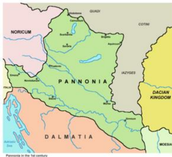
Slika 6. Prikaz provincije Panonije