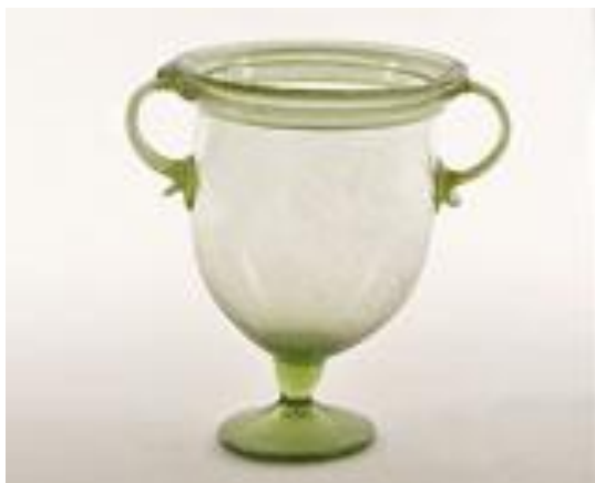
Slika 8. Nalaz iz paljevinskog groba s Gornje Vasi