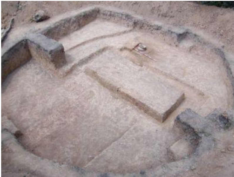
Slika 4. Prikaz tumula nakon iskapanja

vjerojatno će biti zanimljivije utvrde sjeverne, blaže padine, kao i južni dio gradine koji se terasasto spušta do gotovo okomitih stijena s istočne, južne i zapadne strane naselja.