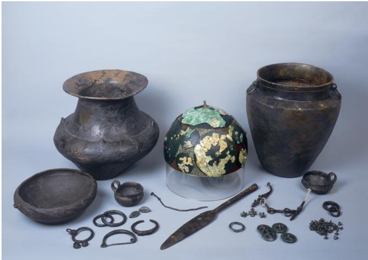
Slika 2. Grobni prilozi iz kneževskog groba na Budinjaku