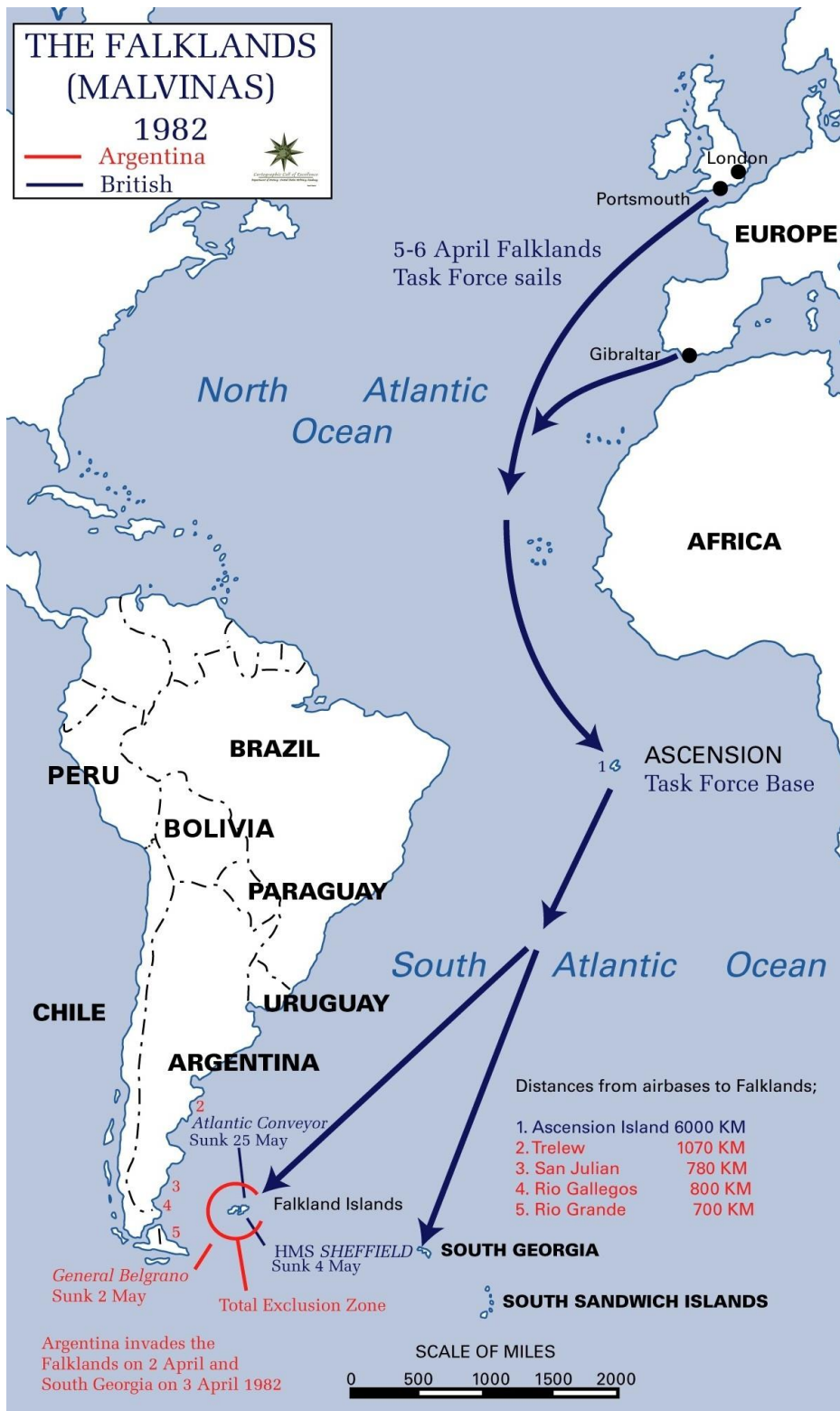
Kretanje britanskih i argentinskih snaga (izvor: „The Falklands Campaign: Distances of Bases“ u United States Military Academy, www.usma.edu, 17.2.2015.)