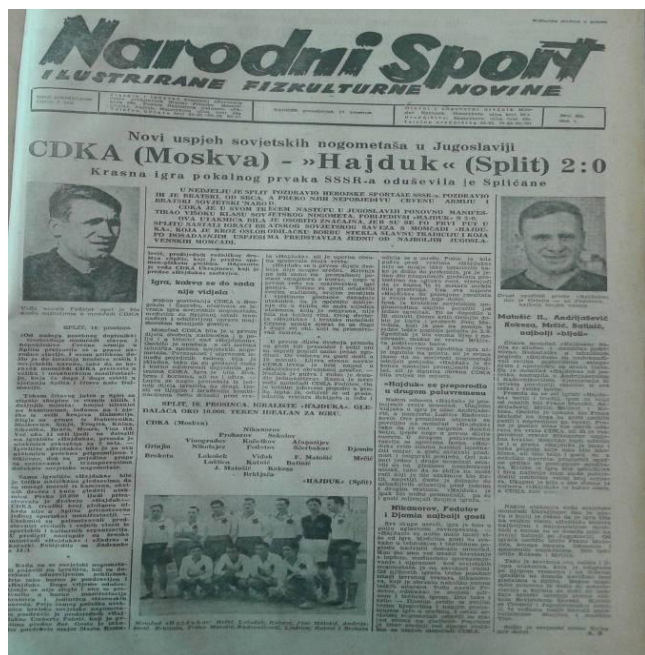
Slika 1: Narodni sport: izvještaj s utakmice splitskog Hajduka i moskovskog CDKA 105

Sovjetski viceprvak i pobjednik kup natjecanja 1945. godine, moskovski CDKA, za destinaciju svoje turneje odabrao je Jugoslaviju, što je izazvalo oduševljenje javnosti i nogometnih domaćina. Moskovski nogometaši odigrali su četiri utakmice pobijedivši beogradske timove Partizan (4:3) i Crvenu Zvezdu (3:1), te splitski Hajduk (2:0). Najjači otpor pružila je reprezentacija grada Zagreba odigraivši neriješeno 2:2. 103 Sve su utakmice bile izvrsno posjećene te su se pretvorile „u burnu manifestaciju bratstva i jedinstva slavenskih naroda“. 104