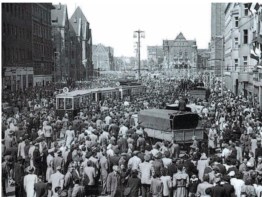
Slika 2 „Poznanjski lipanj“ 1956.