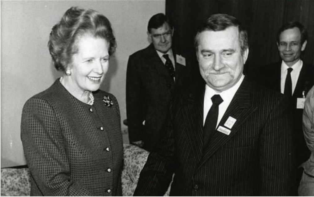
Slika 7 Susret Margaret Tacher i Lecha Wałęse u Gdanjsku 1988.