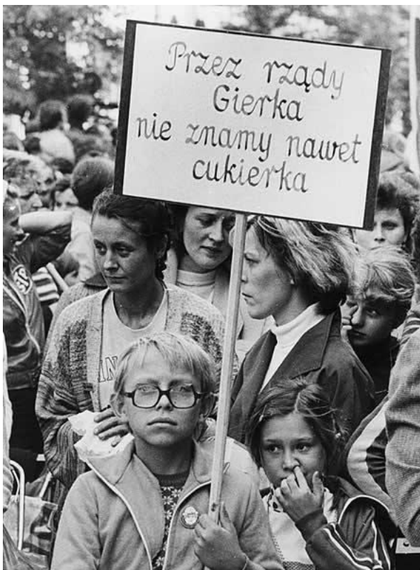
Slika 12 "U Gierkovej vladi ne znamo ni za bonbon", marš gladi u Lođu 1981.