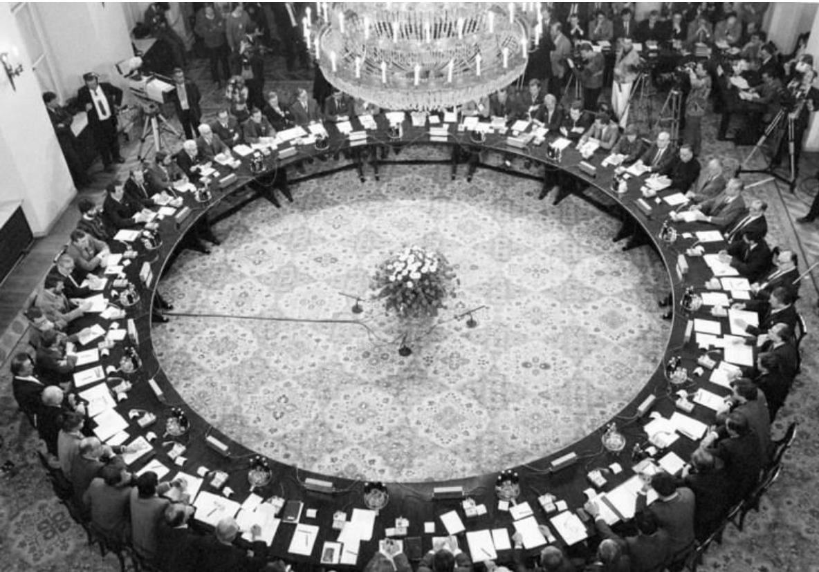
Slika 8 Okrugli stol 1989.