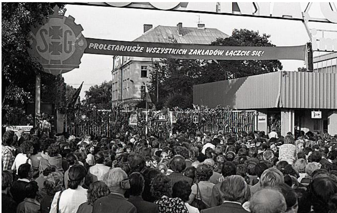
Slika 4 Gdanjsk, kolovoz 1980. „Proleteri svih tvornica, ujedinite se!“