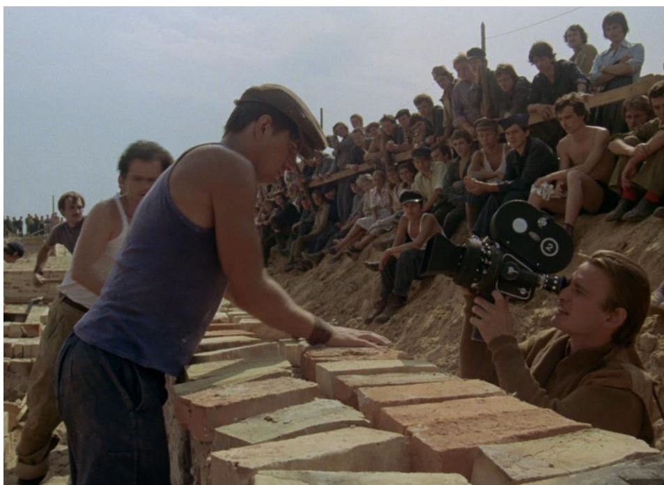
Slika 10 Prizor iz filma Andrzeja Wajde "Čovjek od mramora" (1977.): radničke svečanosti