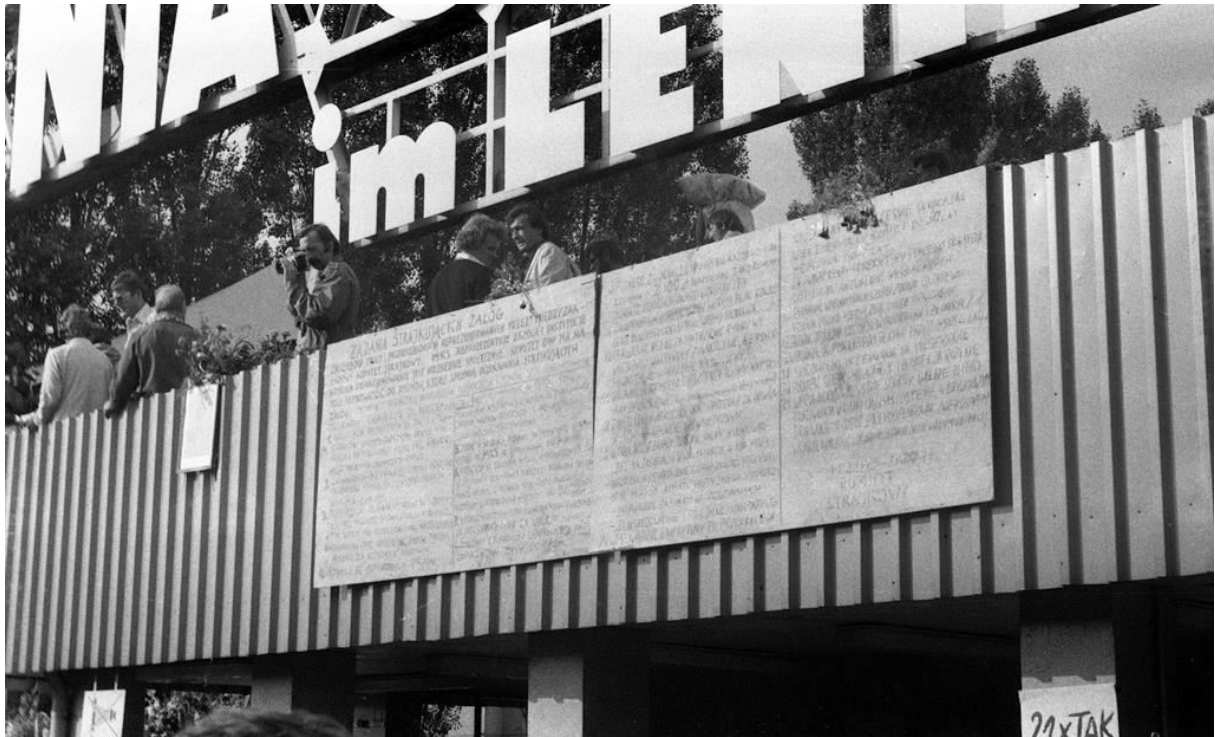
Slika 3 21 postulat na glavnom ulazu u gdanjsko brodogradilište „Lenjin“ (1980.)