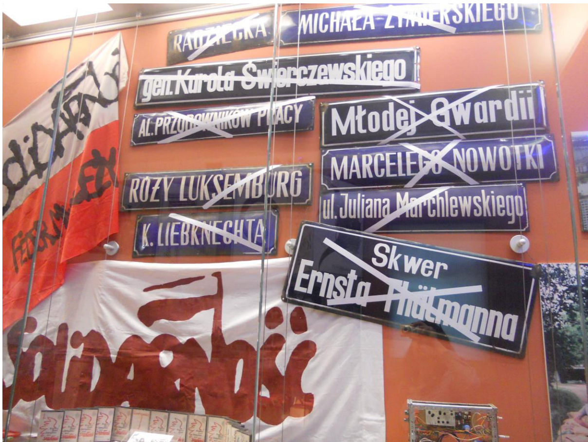
Slika 15 Powijest "Solidarności" smještena u dekomunizacijski kontekst, dio stalnog postava Muzeja grada Wrocław (Muzeum Miejskiego Wrocławia)