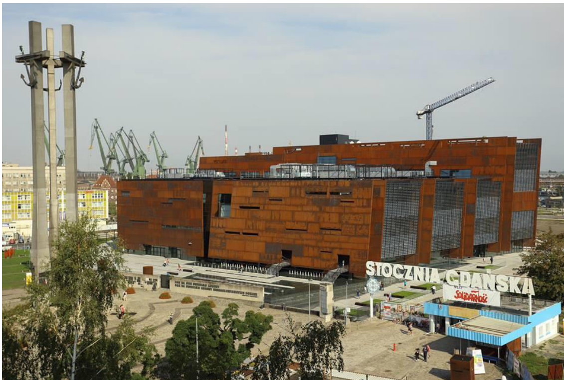
Slika 1 Muzej ECS i nekadašnji ulaz u brodogradilište