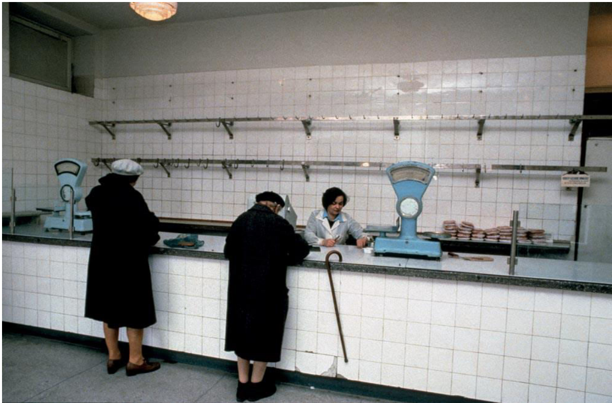
Slika 11 Prizor ekonomije oskudice, Varšava 1982.