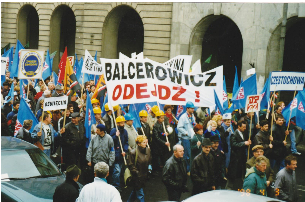
Slika 14 "Balcerowiczu odłazi!" Demonstracije u Varšavi 1997. protiv vlade AWS-UW-a