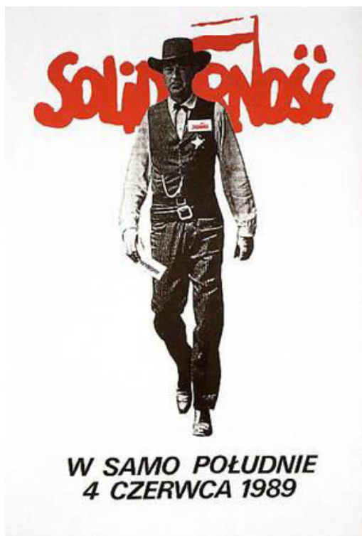
Slika 9 "Točno u podne 4. lipnja" - Plakat s izborne kampanje "Solidarnosti"