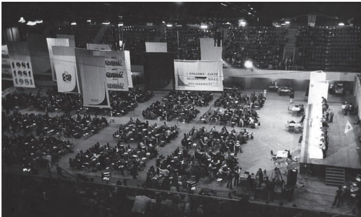
Slika 6 Prvi nacionalni kongres delegata Solidarnosti u Gdanjsku, jesen 1981.